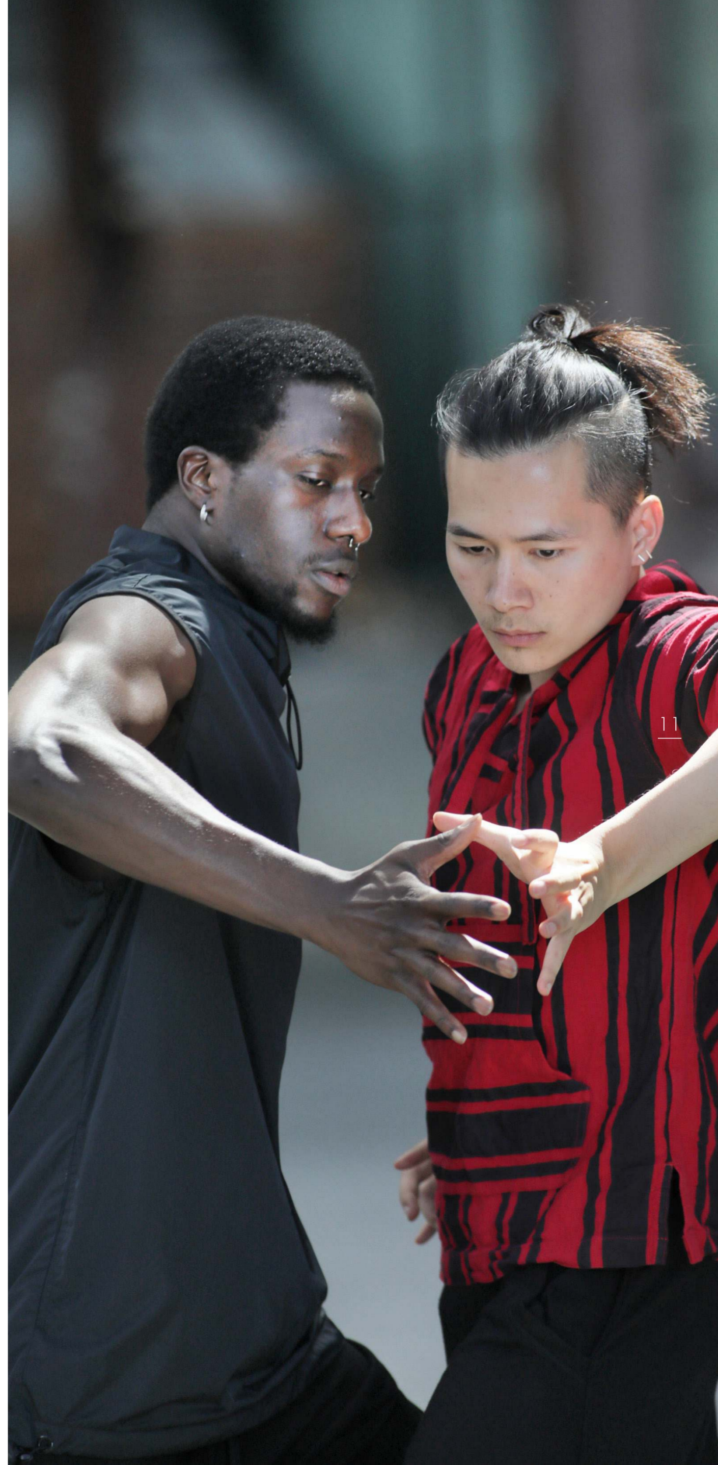
Scène uit Mirror Mirror van Conny Janssen.

“Ik ben heel visueel ingesteld en ik schrijf ook veel, ook al ben ik dyslectisch. Dat laatste heeft zowel voor- als nadelen. Het geeft een bijzondere kleur aan wat ik schrijf, maar soms is dat wat ik geschreven heb niet voor iedereen te volgen. Om een noodzaak te vinden voor mijn solo ben ik eerst