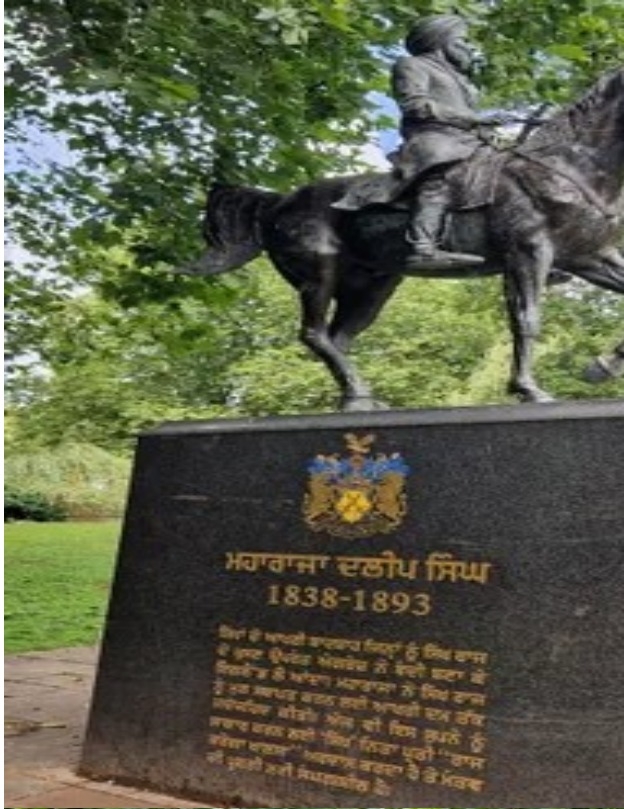
ਮਹਾਰਾਜਾ ਦਲੀਪ ਸਿੰਘ ਦਾ ਬੁੱਤ, ਥੈਟਫੋਰਡ, ਇੰਗਲੈਂਡ