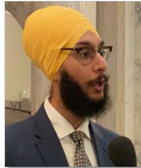
ਸ੍ਰ. ਯੁਵਰਾਜ ਸਿੰਘ