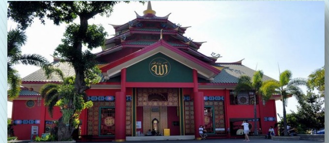
Masjid Cheng Hoo Banyuwangi