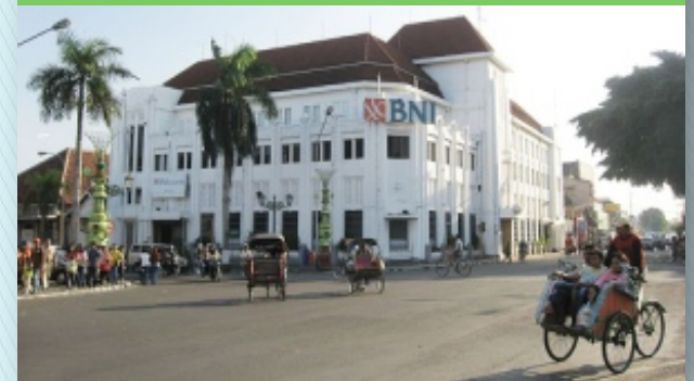
Bank BNI 46 Kilometer 0 Yogyakarta