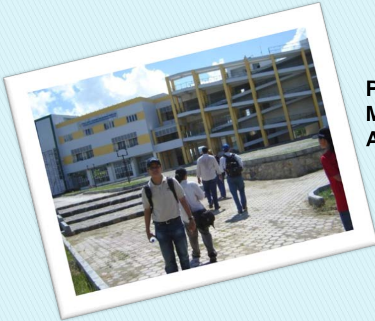
Pembangunan Gedung Untuk Evakuasi Masyarakat sebagai bentuk Mitigasi Tsunami Aceh. (Ady,_Modul Sospol STIE Triguna, 2012)