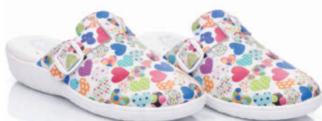
133 - 29.00 € No. 36-41 Εμπριμέ