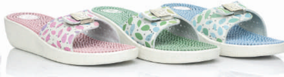
844 - 24.90 € No. 36-41 Ροζ - Βεραμάν - Γαλάζιο