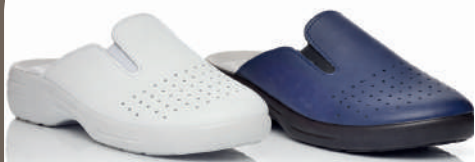
135 - 34.00 € No. 36-41 Λευκό - Μπλε