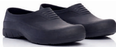
840 - 33.90 € No. 35-46 Μαύρο