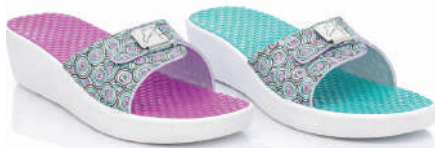
835 - 24.00 € No. 36-41 Φούξια - Πράσινο