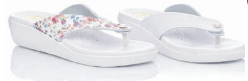
075A - 22 € No. 36-41 Εμπριμέ - Λευκό