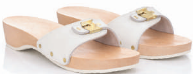
022 - 39.90 € No. 36-41 Λευκό