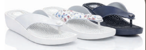
075M - 22 € No. 36-41 Λευκό - Μπλε - Εμπριμέ