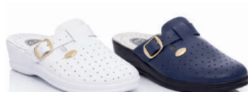
124 - 26.00 € No. 36-41 Λευκό - Μπλε