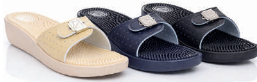
800M - 22 € No. 36-41 Μπεζ - Μπλε - Μαύρο