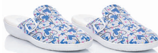
134 - 29.00 € No. 36-41 Εμπριμέ