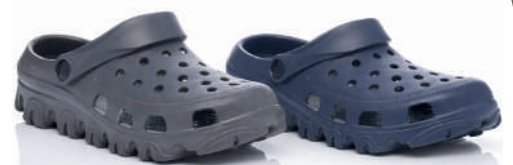
838 - 19.00€ No. 36-46 Γκρι - Μπλε