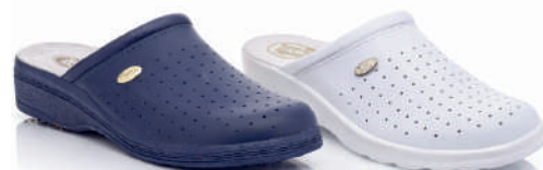
118 - 27.00 € No. 40-46 Μπλε - Λευκό