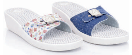
811 - 22€ No. 36-41 Εμπριμέ - Τζίν