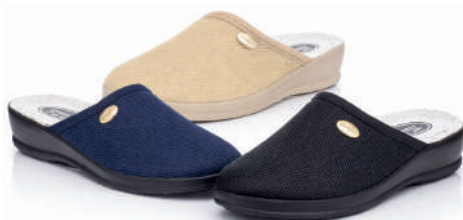
1175 - 25.00 € No. 36-41 Μπεζ - Μπλε - Μαύρο