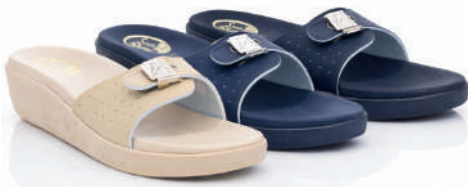
800A - 22 € No. 36-41 Μπεζ - Μπλε - Μαύρο