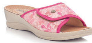
2565 - 25.00 € No. 36-41 Μπεζ - Μπλε - Ροζ