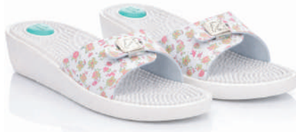
833 - 22 € No. 36-41 Εμπριμέ