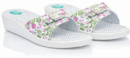
832 - 22 € No. 36-41 Εμπριμέ