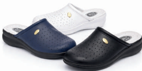
121 - 26.00 € No. 36-41 Λευκό - Μπλε - Μαύρο