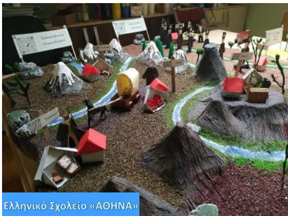
Ελληνικό Σχολείο «ΑΘΗΝΑ»

Αφού σταθεροποιήθηκε η βάση και ετοιμάστηκαν όλα, αρχίσαμε να τα κολλάμε με σιλικόνη πάνω στη βάση. Η μακέτα μας είναι έτοιμη!