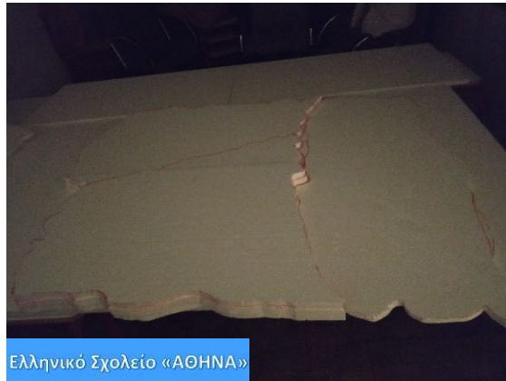
Ελληνικό Σχολείο «ΑΘΗΝΑ»

Έχοντας για οδηγό χάρτες της Ρουμανίας σχεδιάσαμε και κόψαμε φελιζόλ (Styrofoam 2cm) στο σχήμα κάθε περιοχής. Για να ξεχωρίζουν τα σύνορα των περιοχών φτιάχτηκαν σε διαφορετικά ύψη κολλώντας 2-3 επιπλέον στρώσεις φελιζόλ. Τα κολλήσαμε μεταξύ τους με κόλλα σιλικόνης και έτσι άρχισε να δημιουργείται η βάση της μακέτας(150εκ. Χ 150εκ.)