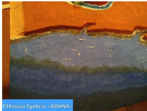
Ελληνικό Σχολείο «ΑΘΗΝΑ»