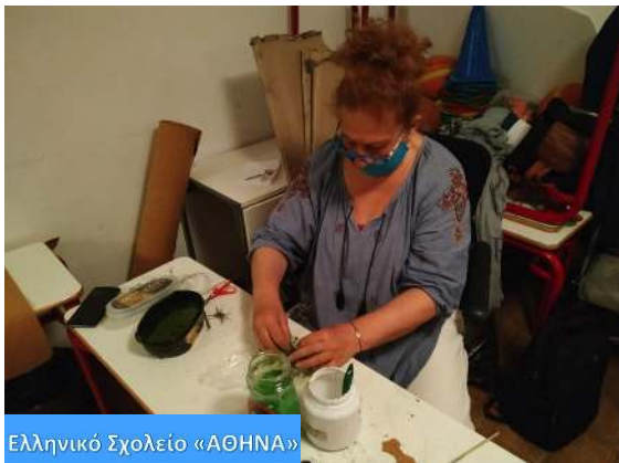
Ελληνικό Σχολείο «ΑΘΗΝΑ»