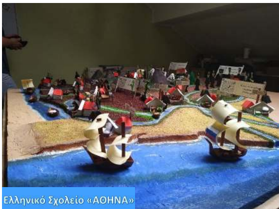
Ελληνικό Σχολείο «ΑΘΗΝΑ»