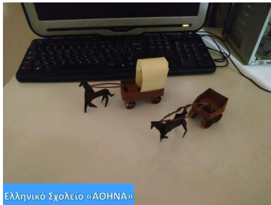
Ελληνικό Σχολείο «ΑΘΗΝΑ»