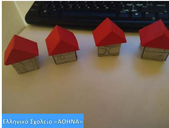
Ελληνικό Σχολείο «ΑΘΗΝΑ»