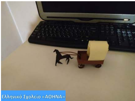
Ελληνικό Σχολείο «ΑΘΗΝΑ»