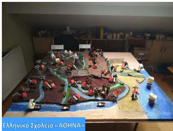
Ελληνικό Σχολείο «ΑΘΗΝΑ»