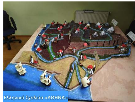
Ελληνικό Σχολείο «ΑΘΗΝΑ»