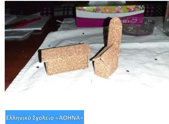
Ελληνικό Σχολείο «ΑΘΗΝΑ»