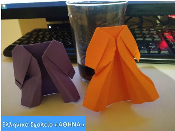
Ελληνικό Σχολείο «ΑΘΗΝΑ»

Κατά την περίοδο της τηλεκπαίδευσης τα παιδιά έφτιαχναν τα οριγκάμι βλέποντας σχετικά βίντεο στο www.youtube.com