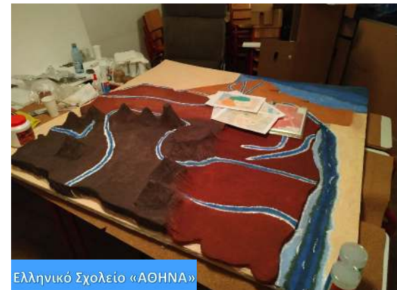
Ελληνικό Σχολείο «ΑΘΗΝΑ»