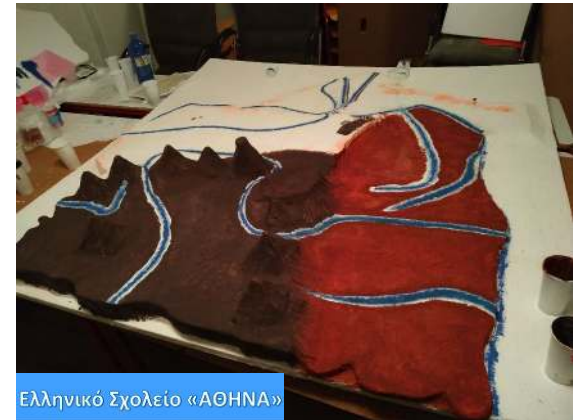
Ελληνικό Σχολείο «ΑΘΗΝΑ»