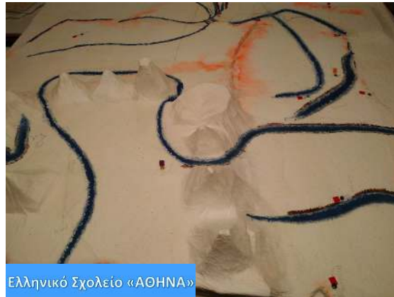
Ελληνικό Σχολείο «ΑΘΗΝΑ»