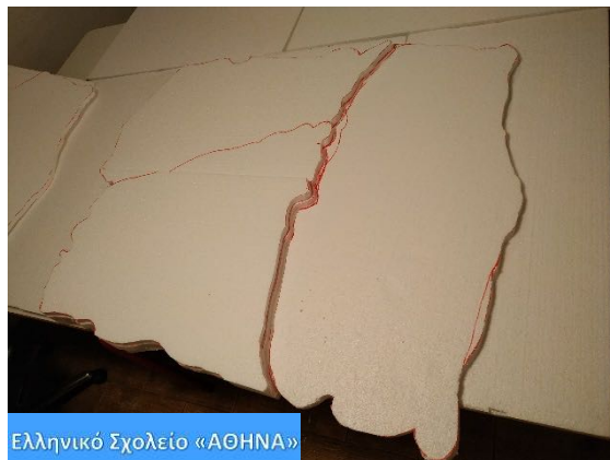
Ελληνικό Σχολείο «ΑΘΗΝΑ»