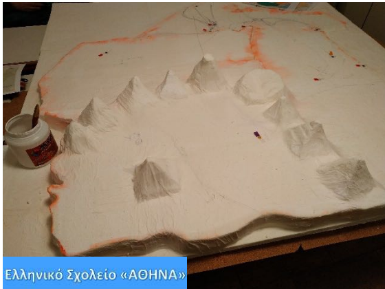
Ελληνικό Σχολείο «ΑΘΗΝΑ»

Χρωμάτισαμε τα ποτάμια και τη Μαύρη Θάλασσα έχοντας προηγουμένως φτιάξει κυμματισμούς με το χαρτί κουζίνας και την κόλλα. Η κάθε περιοχή βάφτηκε με διαφορετικό χρώμα για να ξεχωρίζει. Χρησιμοποιήσαμε τέμπρες στα βασικά χρώματα και βγάλαμε μόνοι μας τις αποχρώσεις που θέλαμε.