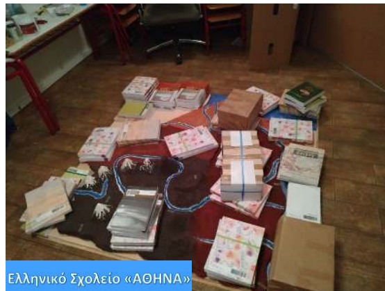
Ελληνικό Σχολείο «ΑΘΗΝΑ»