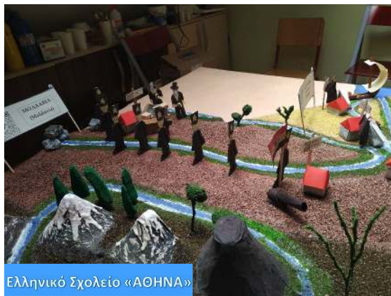
Ελληνικό Σχολείο «ΑΘΗΝΑ»