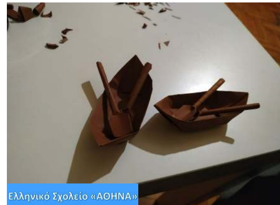
Ελληνικό Σχολείο «ΑΘΗΝΑ»