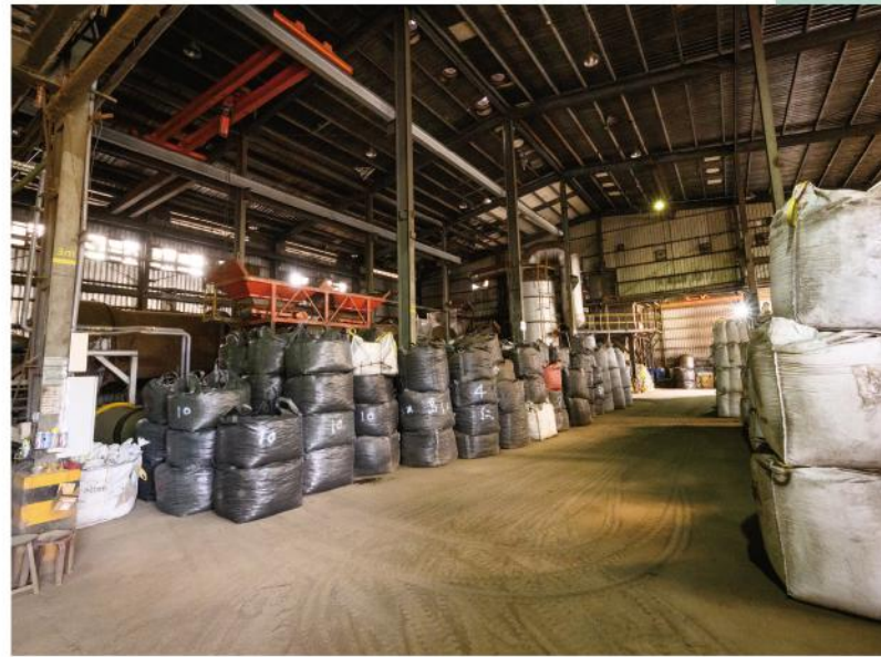
· 電鍍汙泥再利用，開啟循環經濟更多可能

同時，這種系統化管理也符合國際趨勢，契合科技大廠對供應鏈透明度與追蹤性的需求。這正是他們放心交付業務給泳霖的關鍵，也讓公司穩居產業最前端。