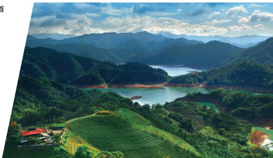
· 得天獨厚的地理環境，孕育出石碇包種茶的清新風味

堅持不用鐳射雕刻，而是透過手感力道賦予字句靈魂。希望藉此拋轉引玉，開創新文人壺的大格局。