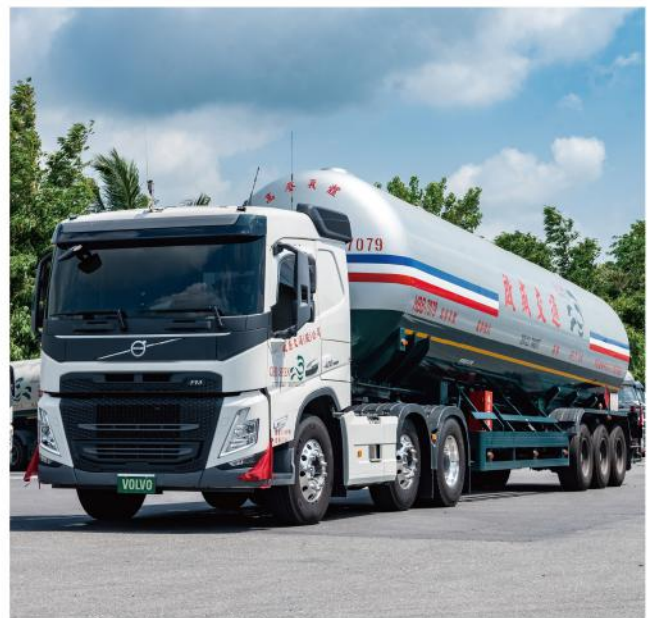
· 導入Volvo Connect分析駕駛行為，全面提升車隊環保效率

「還有一個重點。」蘇總笑著繼續說：「後市的二手銷售價格也高。」那是當然，在商言商嘛。