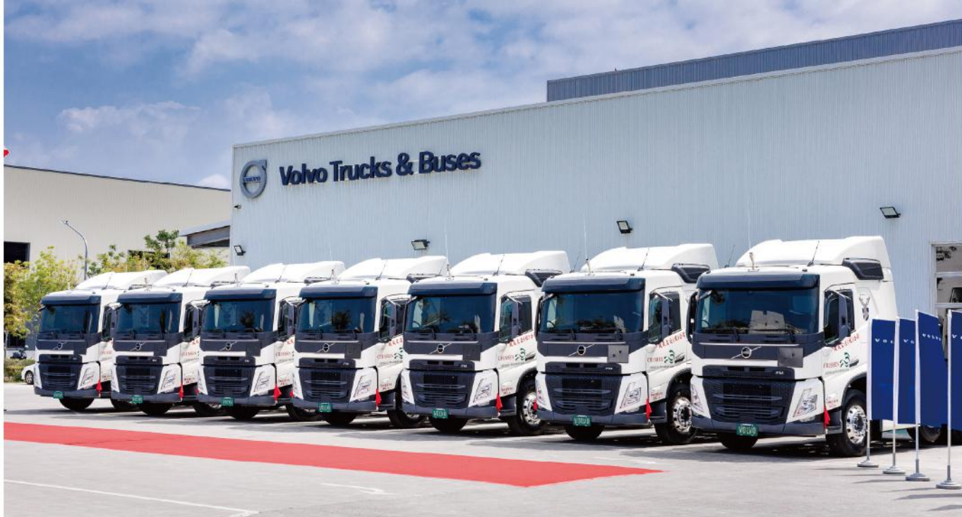
· 啟盛車隊超過九成採用VOLVO車款，作為執行高風險任務的最強後盾

學原料、高壓氣體、ISO Tank等高風險運輸任務，為國內石化、電子產業供應鏈的重要樞紐。