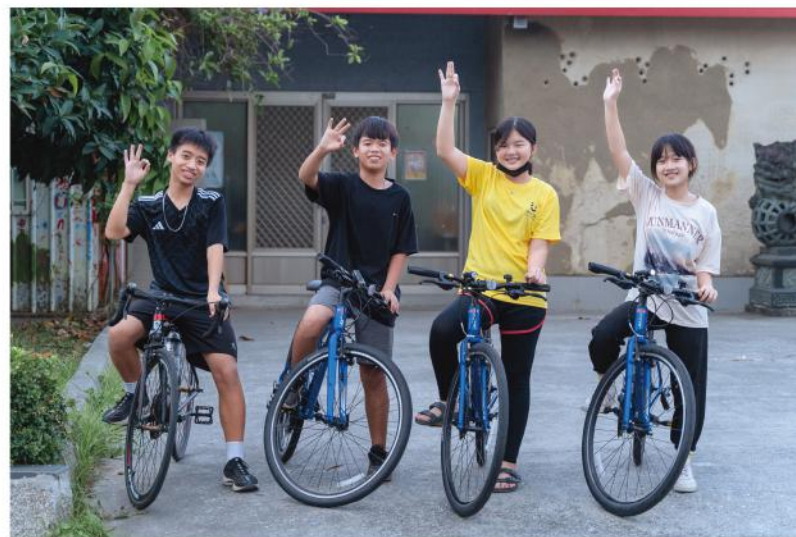
· 打破制式教育的束縛，書屋希望在對話與遊戲中找回孩子們學習動機

太古汽車也邀請您，下次來到知本時，不妨探訪書屋的據點，或者喝杯咖啡，看看孩子們親手打造的空間與作品，在陌生的地方，重新遇見那份溫柔的自己。您會慢慢發現——每一份陪伴、每一個微小行動，有一天終將匯聚成改變世界的力量。