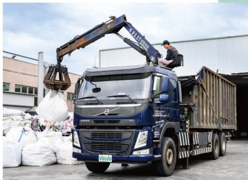
· Volvo Trucks雲端化監控，是泳霖贏得客戶信任的關鍵

透過嚴守法規、導入先進設備，並以國際標準為準則，泳霖持續將廢棄物處理推向資源化、高效率與高安全的新境界。對泳霖而言，廢棄物從來不是終點，而是企業承擔永續責任的起點。以VOLVO車隊為核心，串聯制度、科技與設備，讓每一趟清運與處理，都化為推動永續未來的實質力量。