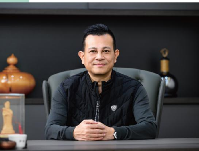
· 凌董以全球化、數位化與永續經營，作為環保供應鏈三大核心

在大型廢棄物處理方面，凌董很自豪地介紹起自家引進全台少數的移動式破碎機。他解釋：「它不僅馬力更大，還能處理彈簧床、廢家具等難以應付的物料。」憑藉這項高機動性能力，泳霖長期承包雙北、桃園、新竹等縣市的清潔隊標案，負責處理巨大家具與廢木材處理。