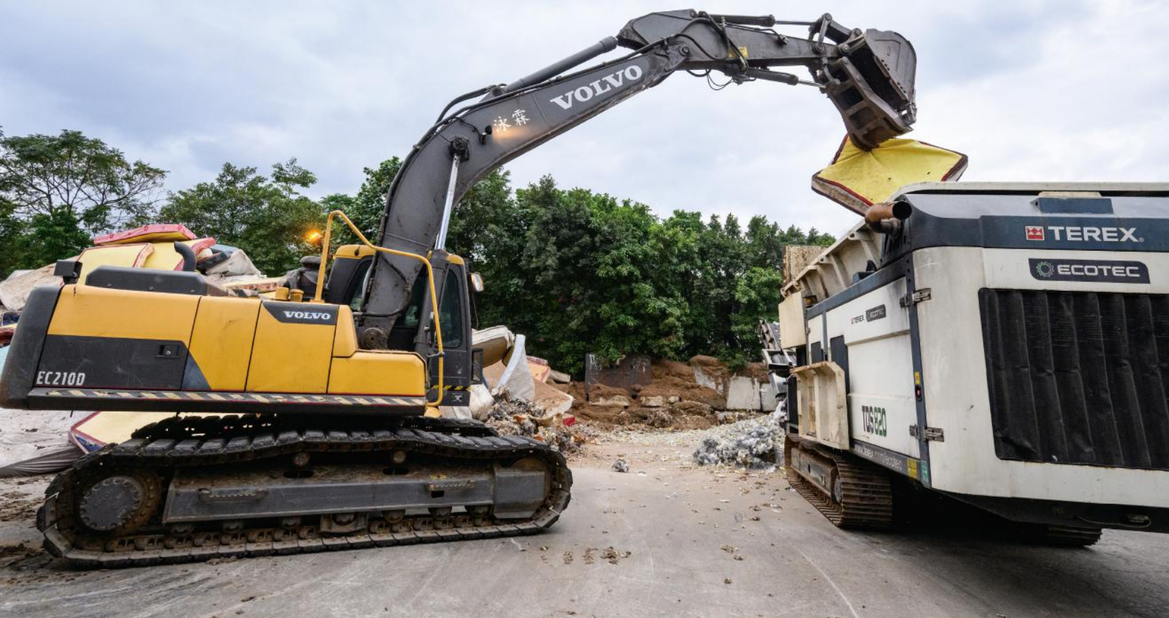
· 靈活抓取、高效運轉，Volvo EC210D撐起高強度破碎作業

認證機構的嚴格審查，從流程設計到最終處理，層層把關，確保機密安全自源頭即被妥善守護。除美國外，泳霖亦於泰國、馬來西亞設有處理據點，支援國際客戶電子零組件破碎與電池熔煉等高門檻作業。