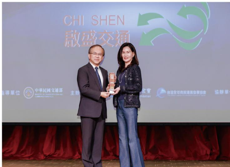
· 蘇總認為，ESG是運輸業對社會、環境與公共安全不可推卸的責任

難怪，啟盛交通在2025年競爭激烈的「ESG交通運輸永續獎」中脫穎而出。ESG永續獎？是的，要知道啟盛交通甚至不是溫室氣體排放列管對象，但仍於2024年自主啟動溫室氣體盤查、成立永續ESG白皮書，一路堅定著朝向轉型為「綠能運輸」的方向邁進。