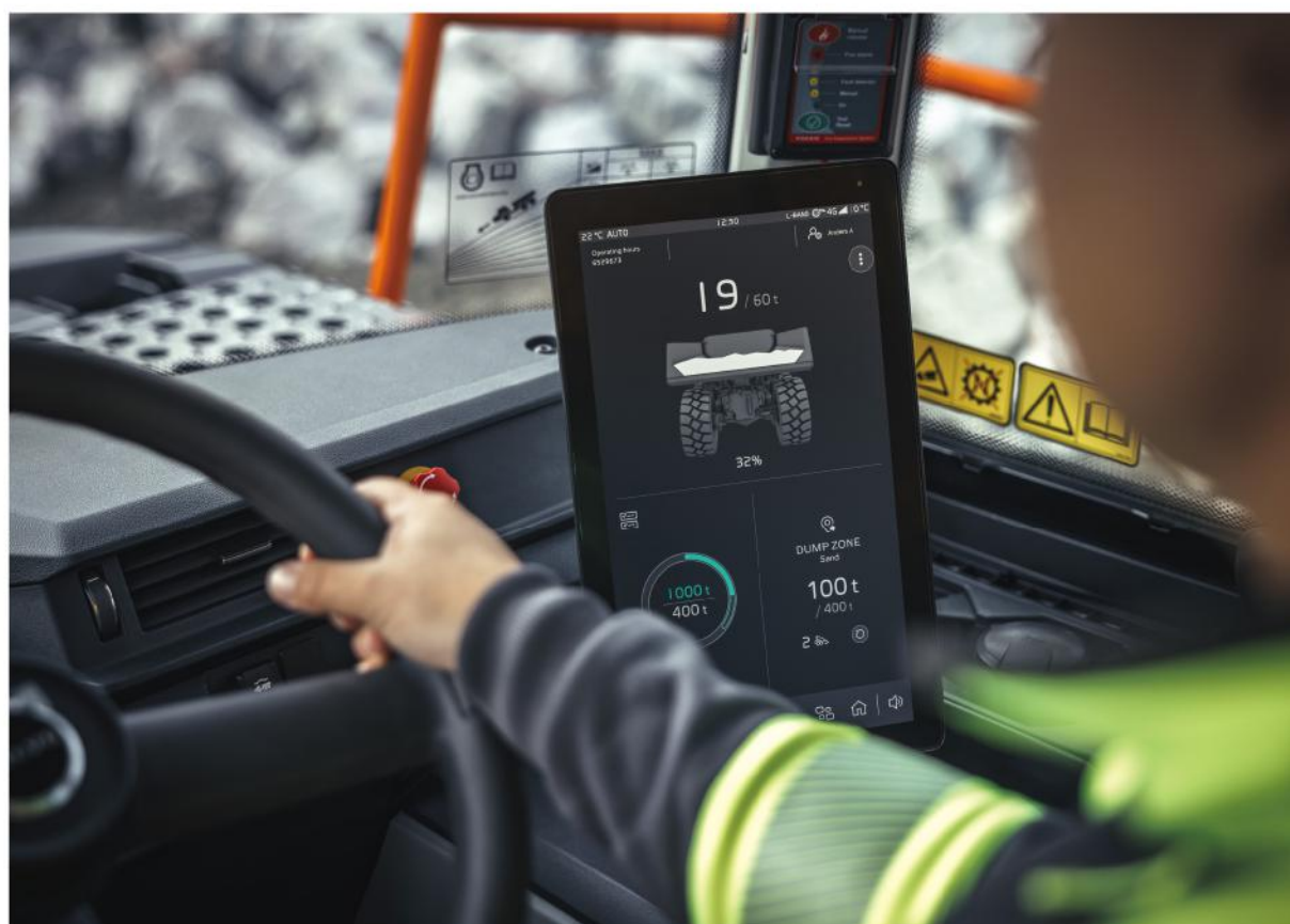
· 透過側螢幕顯示評分，駕駛能夠即時觀察油耗表現

結構，也將為第一線駕駛的工作品質帶來重大改變。當繁瑣的坡道策略交由 AI 處理，司機得以將專注力回歸行車安全。VOLVO期待透過這套I-SEE AI千里眼預判系統，為您的運輸事業注入革新動能，攜手開創高效節能的事業新局。