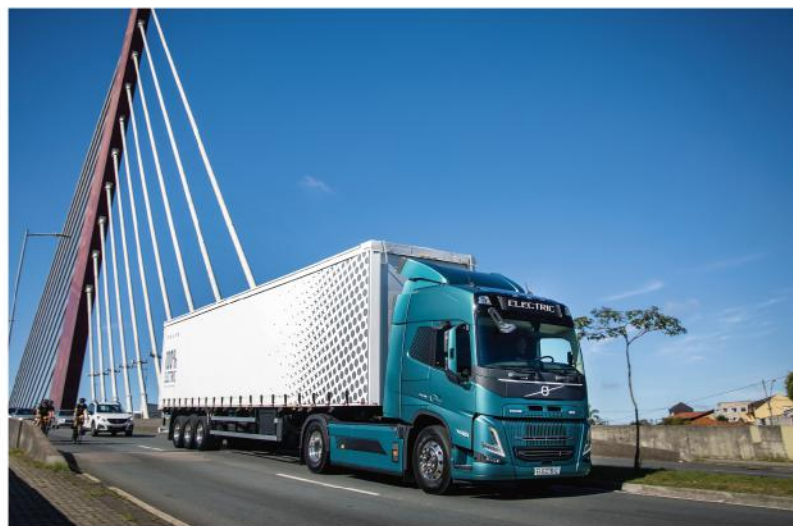
· 太古商用車「全方位解決方案」，串連淨零運輸生態系

在社會投入上，太古基金長期支持香港的慈善項目，涵蓋教育、海洋保育及藝術三大領域，2024年捐款總額達港幣4千7百萬元，持續擴大公益影響力。台灣太古汽車也積極投入地方創生，透過「騎士烏托邦 BIKERTOPIA」活動，吸引騎士與旅人走進花東，帶動在地經濟復甦，同時推廣農產特色並落實 SDGs，協助花蓮、台東六個鄉鎮強化社區發展。2025年，活動更與北醫 EMBA 合作，在偏鄉設置免費健診站以改善健康落差。這段美好的地方關係更促成花蓮富里鄉與日本沖繩豐見城市締結姊妹市，深化區域合作與國際交流。