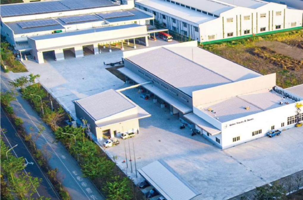
· VOLVO高雄大寮廠導入再生能源，實踐集團能源轉型目標

放的運輸產業，公司積極引進電動卡車與電動重型機械，協助台灣企業從傳統燃油動力轉向零排放能源，同時提供「全方位解決方案」(Total Solution)，涵蓋充電基礎設施規劃、後勤維修與保養服務，以及運用 Volvo Connect 建立智慧車隊管理，提升能源效率、降低車輛耗損並強化駕駛安全，逐步形成完整的低碳轉型生態圈。此佈局不僅契合台灣淨零政策方向，也呼應集團在全球對減碳、提升資源使用效率的長期承諾。