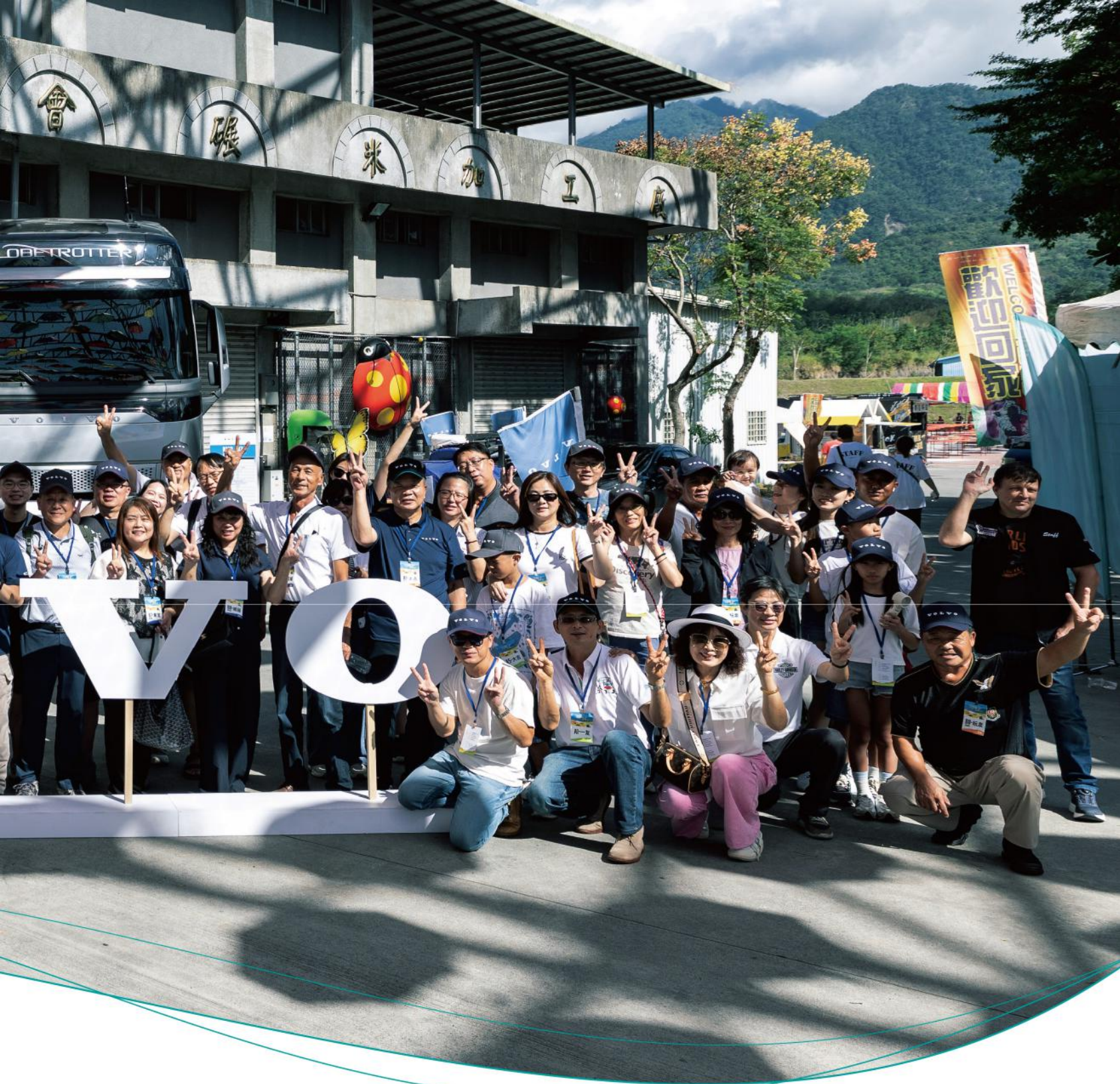
· VOLVO車主家庭齊聚富里，開啟「村村共好」新篇章

今年九月，馬太鞍溪堰塞湖潰堤，花蓮光復鄉遭遇史無前例的洪災，強烈的衝擊也連帶導致整個東台灣觀光業遭受重創。在此關鍵時刻，VOLVO商用車堅守與花東鄉鎮共好承諾，透過一系列結合地方創生的深度旅遊，將人潮與經濟帶入當地，支持在地觀光與產業鏈復甦，再次見證了東台灣展現出的美麗與堅韌奇蹟。