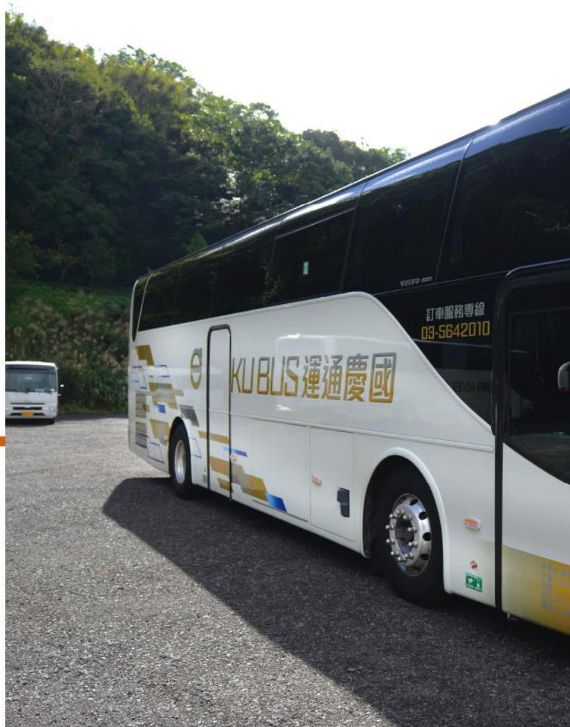
· Volvo B8R巴士底盤為長程接駁提供安靜、平穩的乘坐體驗