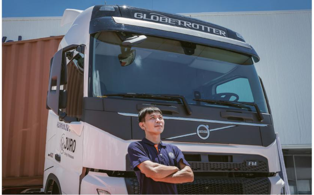
· 大車蒟蒻認為I-SEE不僅減輕駕駛疲勞更能節省成本，是絕對值得的投資

這套系統的啟用門檻現已降低至時速 40 公里，這意味著它不僅能在高速公路上展現強大戰力，即便在台灣地形起伏劇烈的山道上，同樣能穩定發揮實質的節能效益。