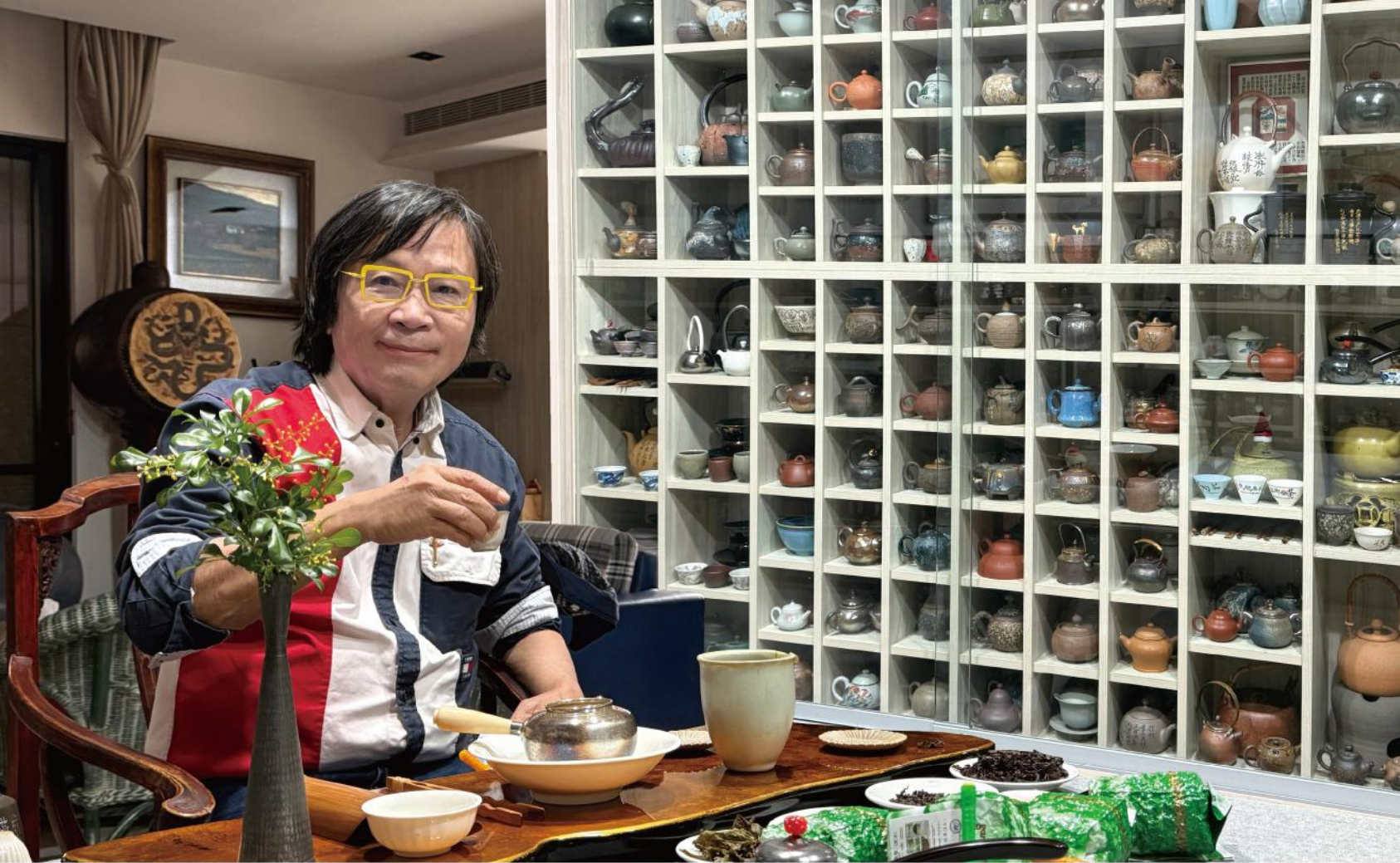
· 工作室宛如一座小型茶葉博物館，承載著他對茶文化的熱愛