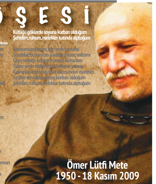
Ömer Lütfi Mete 1950 - 18 Kasım 2009

Özümün özü bu girdapta kanayan Sen asil yar için akmayan kana yan O yar özü kim bakar bu kana yan Özüm özüm kanayan Müjde ey toprak tuğbadır bu fidan bu çınar Şehidim ölümsüz fani gönüllerde divan On binler yüz binler göz göz, saf saf halkla revan Diyet alacağız billah top yeşilin bir çihan Ölmedin sen bir oluştun bu bir şanlı doğum