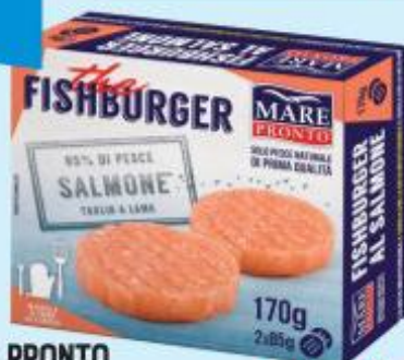
MARE PRONTO FISHBURGER DI SALMONE 170 G