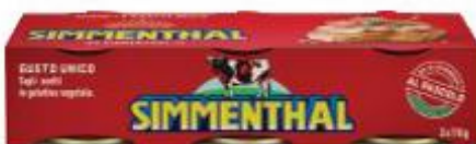
SIMMENTHAL CARNE MAGRA IN GELATINA 70 G X 3