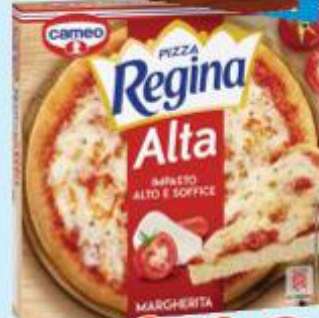
CAMEO PIZZA REGINA MARGHERITA ALTA 375 G