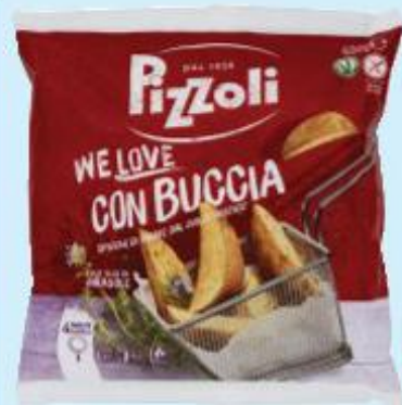
PIZZOLI WE LOVE SPICCHI CON BUCCIA 600 G