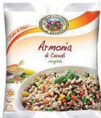
GIAS IL MEDITERRANEO A TAVOLA ARMONIA DI CEREALI - 600 G