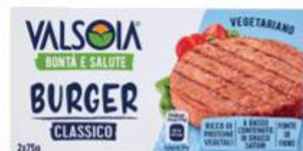
VALSOIA BURGER VEGETARIANO 150 G