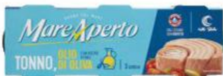
MARE APERTO TONNO ALLOLIO DI OLIVA 70 G X 3