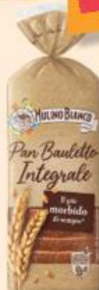
MULINO BIANCO PAN BAULETTO INTEGRALE 400 G