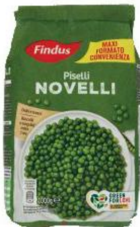
FINDUS PISELLI NOVELLI 1 KG