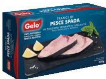
GELO TRANCI DI PESCE SPADA 450 G