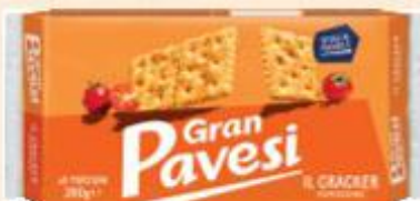
PAVESI GRAN PAVESI CRACKERS POMODORO 280 G