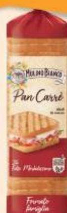
MULINO BIANCO PANCARRÉ 24 FETTE - 430 G