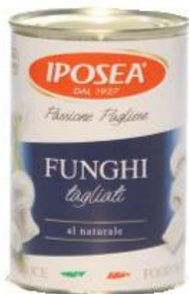
IPOSEA FUNGHI CHAMPIGNON TAGLIATI AL NATURALE GR 380