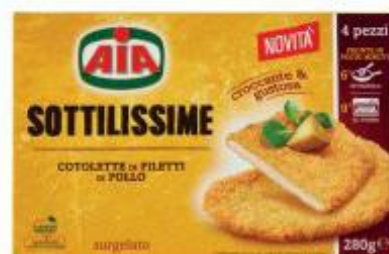
AIA SOTTILISSIME COTOLETTE DI FILETTO DI POLLO 280 G