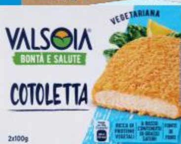
VALSOIA COTOLETTA VEGETARIANA 200 G