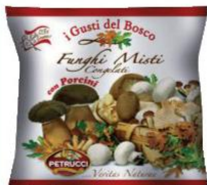
PETRUCCI FUNGHI MISTI CON PORCINI 450 G