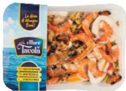
MARE IN TAVOLA SUPER SPAGHETTATA 350 G