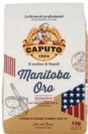
CAPUTO MANITOBA ORO FARINA TIPO 0 - 1 KG