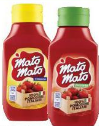
MATO MATO KETCHUP CLASSICO/PICCANTE 390 ML