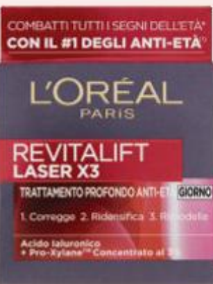
L'ORÉAL LASER CREMA GIORNO 50 ML