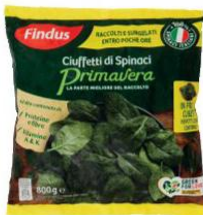
FINDUS CIUFFETTI DI SPINACI 800 G