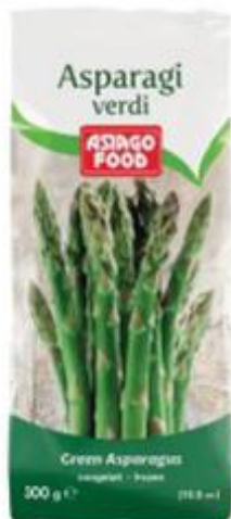
ASIAGO FOOD PUNTE DI ASPARAGI 300 G

GIAS IL MEDITERRANEO A TAVOLA BROCCOLI ROSETTE 600 G