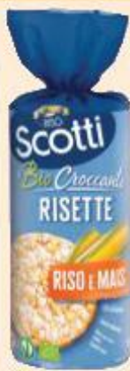
SCOTTI GALLETTE DI RISO E MAIS BIO 150 G