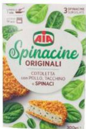
AIA SPINACINE ORIGINALI 300 G