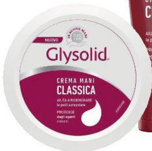
GLYSOLID CREMA MANI CIOTOLA/TUBO 75 ML