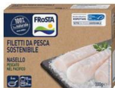
FROSTA FILETTO DI NASELLO 300 G