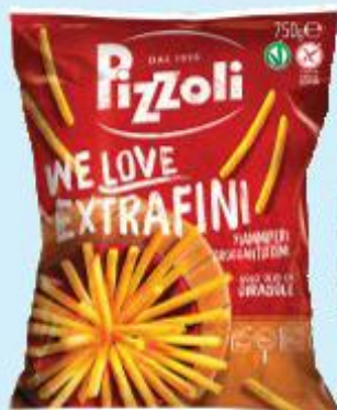
PIZZOLI WE LOVE EXTRA FINI FIAMMIFERI 750 G