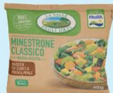
LA VALLE DEGLI ORTI MINISTRONE 400 G