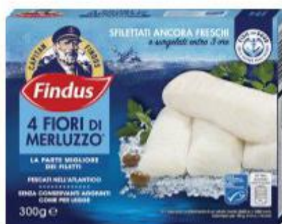
FINDUS FIORI DI MERLUZZO 300 G