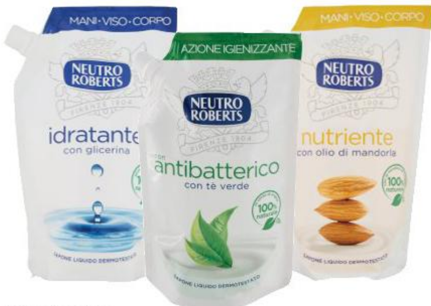
NEUTRO ROBERTS SAPONE LIQUIDO ANTIBATTERICO/IDRATANTE/NUTRIENTE RICARICA BUSTA - 400 ML