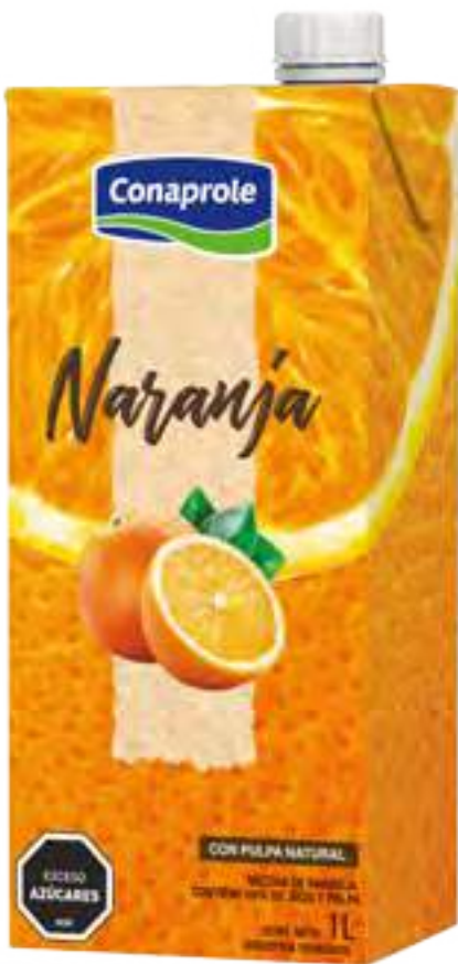
Jugo Naranja Cont. Neto 1 litro