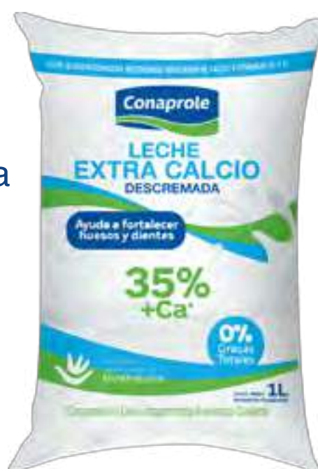
Leche Descremada Extra Calcio Cont. Neto 1 Litro