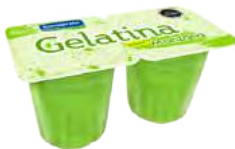
Manzana Cont. Neto 2 x 104 grs