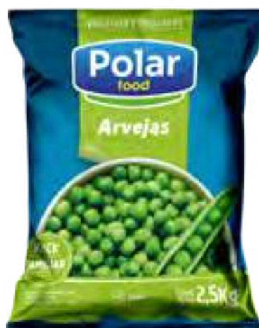
Arvejas Cont. Neto 2,5 kg