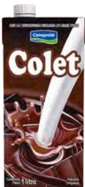
Colet Clásico Cont. Neto 1 Litro