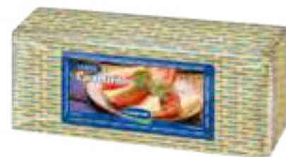
Queso Cuartirolo Cont. Aprox 3,2 kg