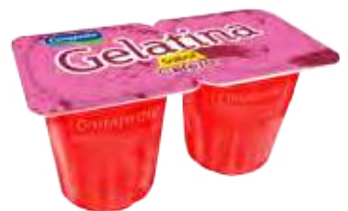
Cereza Cont. Neto 2 x 104 grs