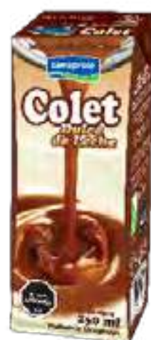
Colet Dulce de Leche Cont. Neto 250 ml