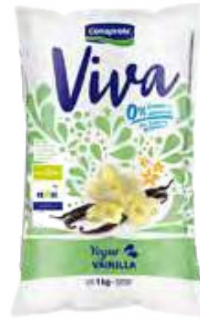
Viva Vainilla Cont. Neto 1 kg