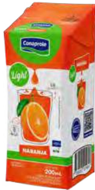
Jugo Naranja Light Cont. Neto 250 ml