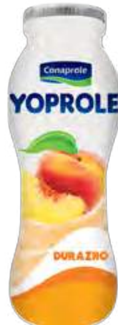
Yoprole Durazno Cont. Neto 185 grs