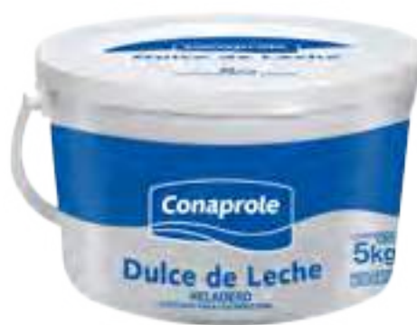
Dulce de Leche Tipo Argentino Cont. Neto 5 kg