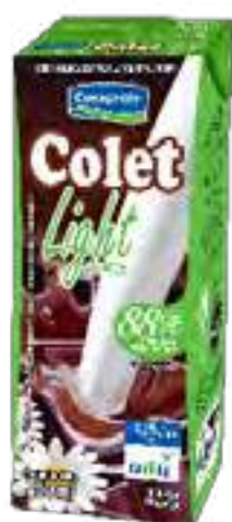
Colet Light Cont. Neto 250 ml