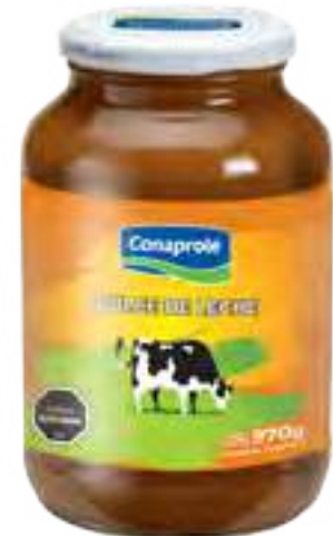
Clásico Cont. Neto 970 grs