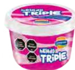
Helado Crema, Frutilla y Chocolate Cont. Neto 125 grs