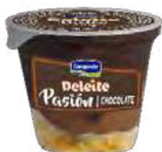
Pasi3n Chocolate Cont. Neto 100 grs