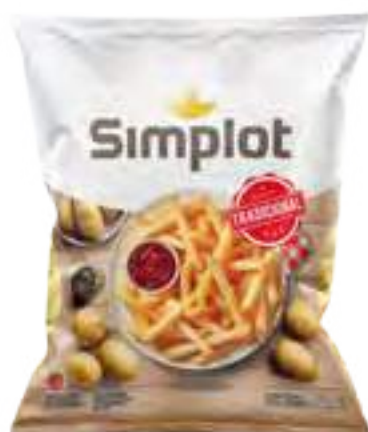
Papas Tradicionales Cont. Neto 2 kg