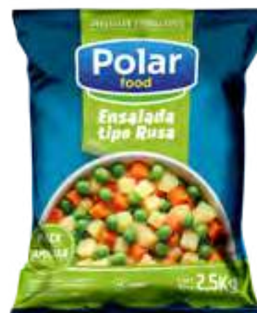
Ensalada Jardinera / Rusa Cont. Neto 2,5 kg