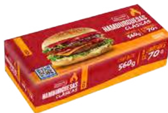
Hamburguesa Clásica Conaprole 8 x 70 g Cont. Neto 560 grs