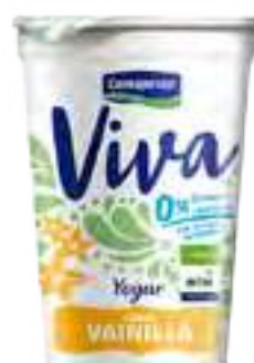
Viva Vainilla Cont. Neto 200 grs