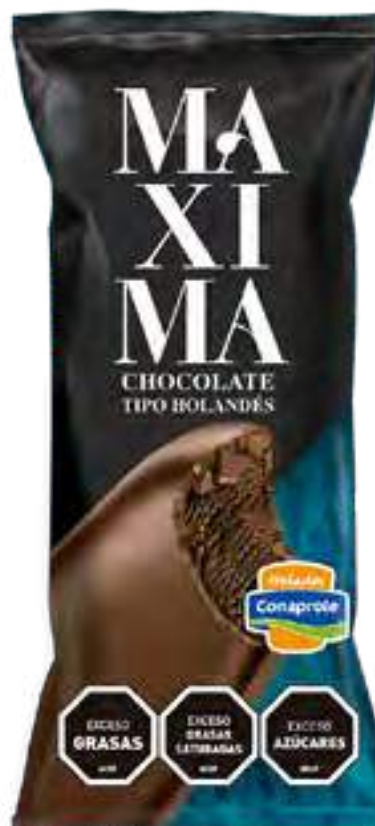
Maxima Chocolate tipo Holandés Cont. Neto 65 grs