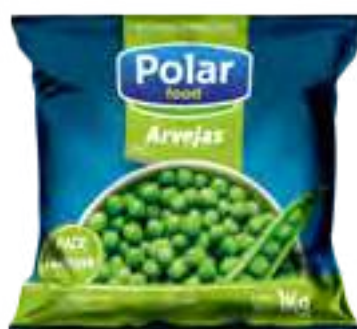
Arvejas Cont. Neto 1 kg