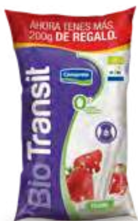
Frutilla Light Cont. Neto 1,2 kg

0% grasa, 0% colesterol, sin azúcares agregado