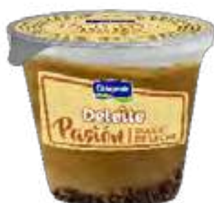
Pasi3n Dulce de Leche Cont. Neto 100 grs