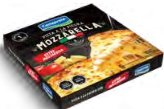
Pizza extra Mozzarella 1 unidad Peso Neto 508 grs