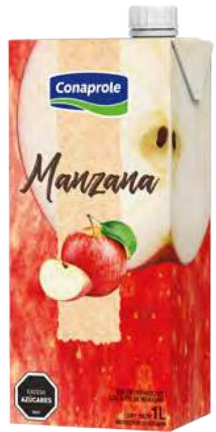
Jugo Manzana Cont. Neto 1 litro