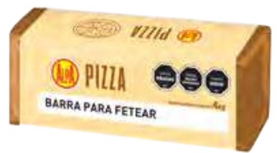
Alpa Pizza Cont. Neto 4 kg