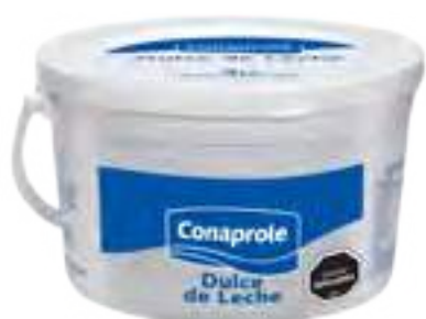
Dulce de Leche Común Cont. Neto 3 kg