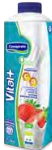
Vital + Inmunidad Cont. Neto 1 kg