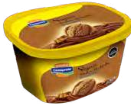
Súper Dulce de Leche Cont. Neto 2 Litros