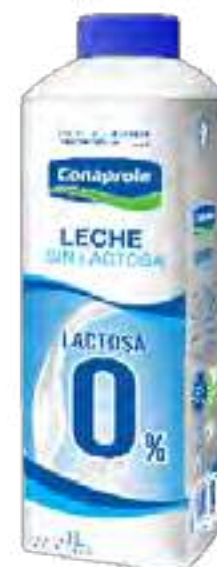
Leche Ultra Descremada 0% Lactosa