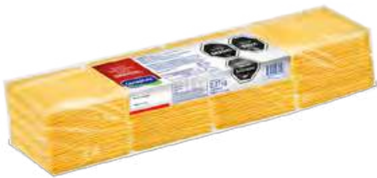
Cheddar en Fetas Cont. Neto 2,270 kg