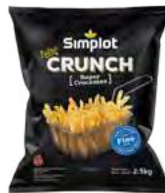
Papas Corte Fino Extra Crunch Cont. Neto 2,5 kg