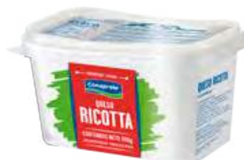
Queso Ricotta Cont. Neto 500 grs