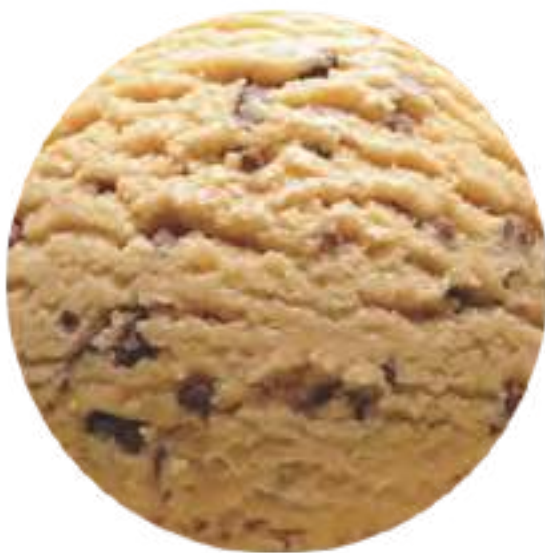
Helado Dulce de Leche granizado