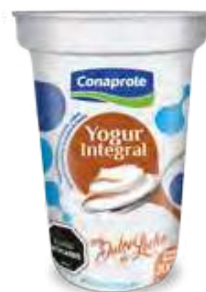
Integral con Dulce de Leche Cont. Neto 200 grs