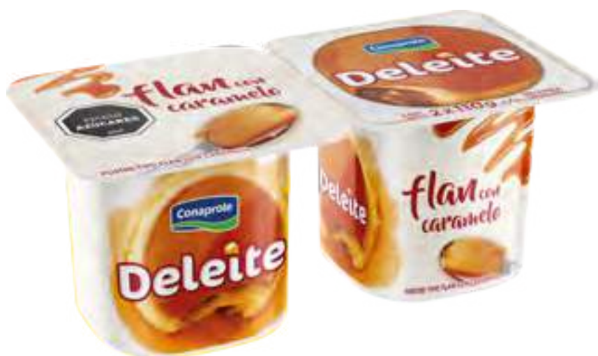
Deleite Flan con Caramelo Cont. Neto 2 x 110 grs