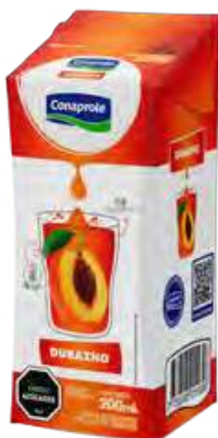
Jugo Durazno Cont. Neto 250 ml