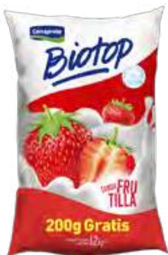
Biotop Frutilla Cont. Neto 1,2 kg