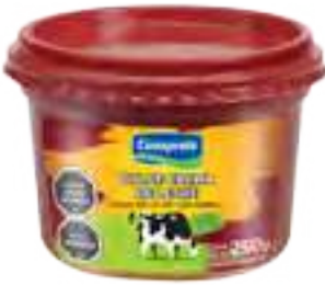
Dulce Crema de Leche Cont. Neto 250 grs