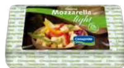
Queso Mozzarella Light Cont. Neto 3 kg