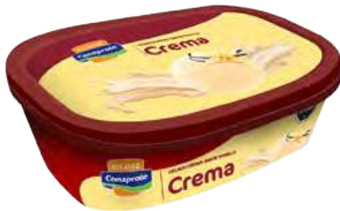
Helado Crema Cont. Neto 1 Litro