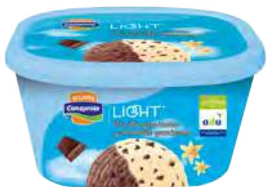
Helado Light Vainilla granizada y Chocolate granizado Cont. Neto 2 litros