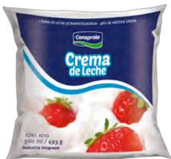
Crema de Leche Cont. Neto 500 ml