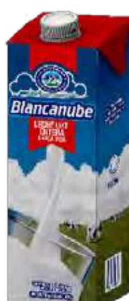
Leche UHT Larga Vida Entera