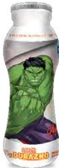
Conamigos Durazno Cont. Neto 185 grs