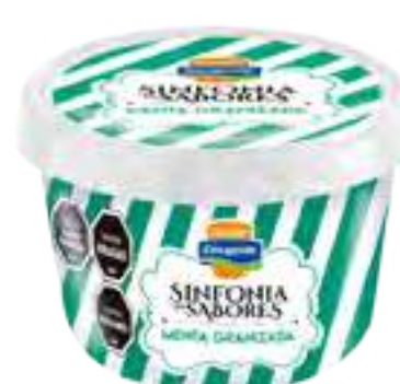
Menta Granizada Cont. Neto 125 grs