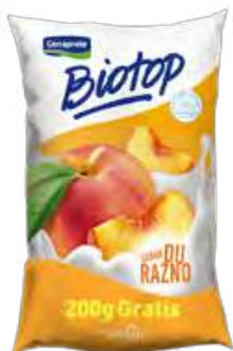
Biotop Durazno Cont. Neto 1,2 kg