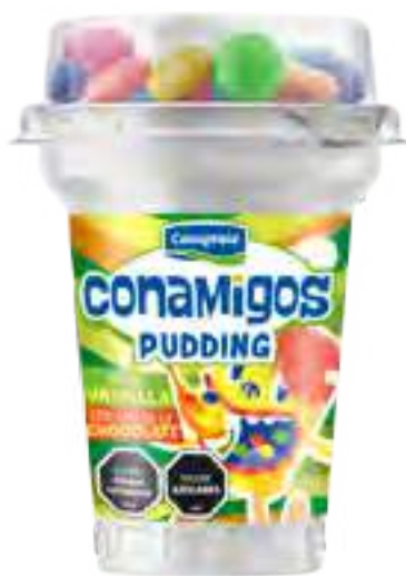
Pudding Vainilla con Discos de Chocolate Cont. Neto 130 grs