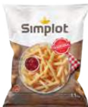
Papas Tradicionales Cont. Neto 1,1 kg