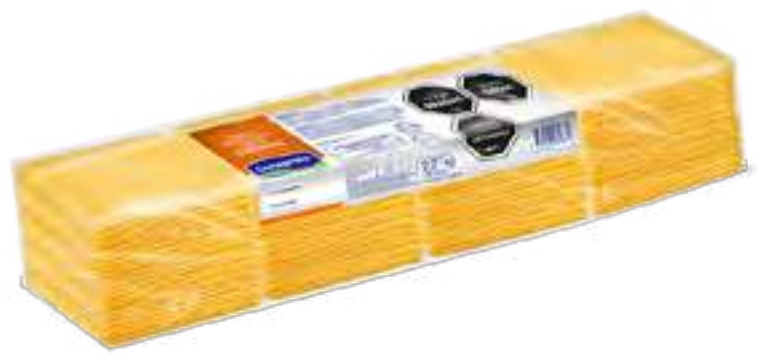
Emmental en Fetas Cont. Neto 2,270 kg