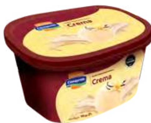
Helado Crema Cont. Neto 2 Litros