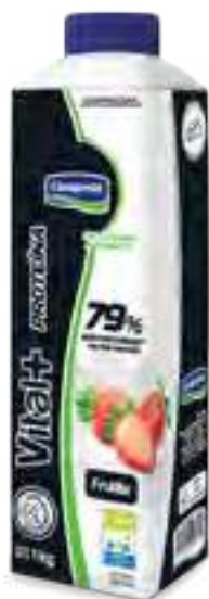
Vital + Proteína Cont. Neto 1 kg