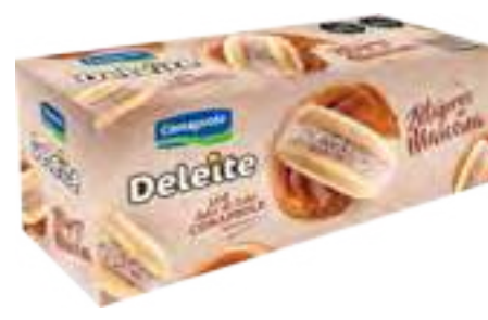
Alfajores Maicena Cont. 6 uni x 60 grs (360 grs)