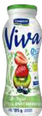
Viva Frutilla, Kiwi y Arándano Cont. Neto 185 grs