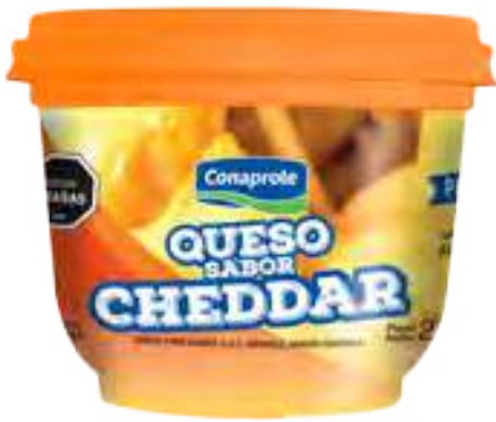
Queso Sabor Cheddar Cont. Neto 230 grs