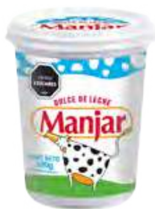
Dulce de Leche Manjar Cont. Neto 500 grs