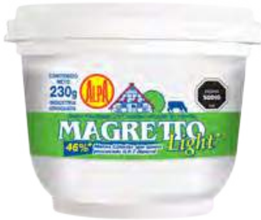
Queso Magretto Light Cont. Neto 230 grs