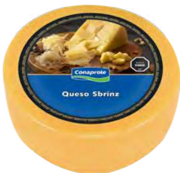
Queso Sbrinz Cont. Aprox 7 kg