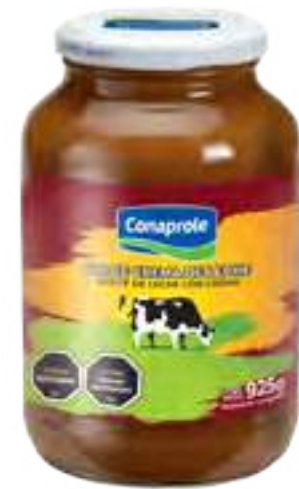
Dulce Crema de Leche Cont. Neto 925 grs