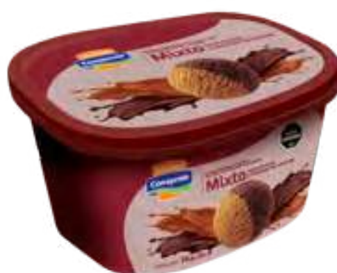
Helado Dulce de Leche y Chocolate Holandés Cont. Neto 2 Litros