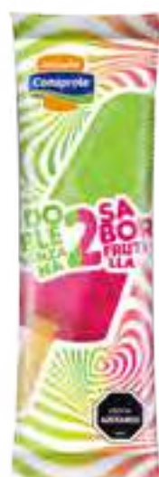
Frutilla Manzana Cont. Neto 58 grs