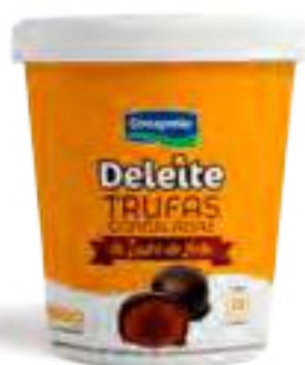
Trufas Chocolate Cont. Neto 168 grs