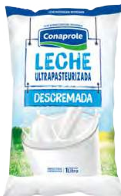
Leche Ultrapasteurizada Desc. Cont. Neto 1 Litro