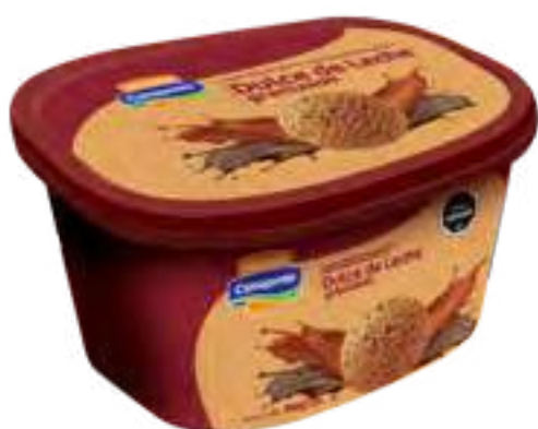
Helado Dulce de Leche Granizado Cont. Neto 2 Litros