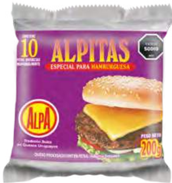
Alpititas para Hamburguesa Cont. Neto 200 grs