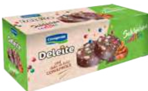
Salchich3n con Confites Cont. Neto 500 grs