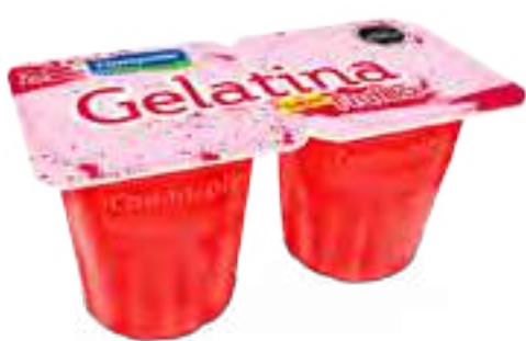
Frutilla Cont. Neto 2 x 104 grs