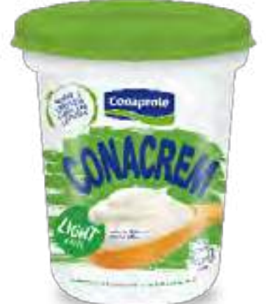
Requesón Cont. Neto 250 grs