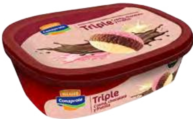
Helado Crema, Frutilla y Chocolate Cont. Neto 1 Litro