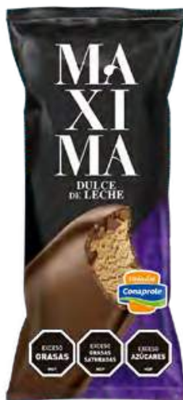
Maxima Dulce de Leche Cont. Neto 65 grs