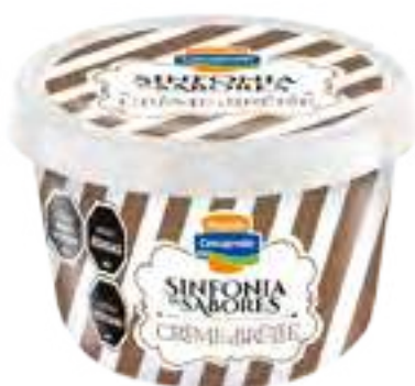
Crème Brûlée Cont. Neto 125 grs