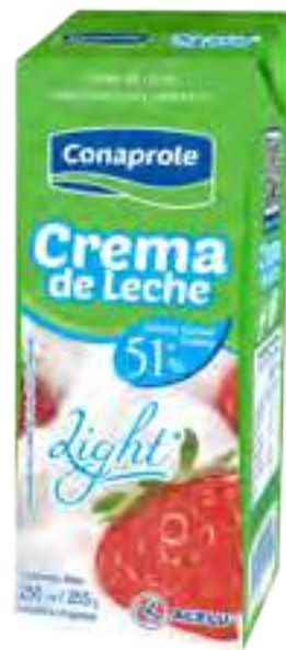
Crema de Leche Light Cont. Neto 250 ml