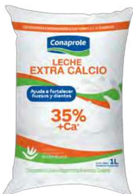
Leche Semidescremada Extra Calcio Cont. Neto 1 Litro