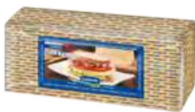
Queso Magro Cont. Aprox 2,8 kg