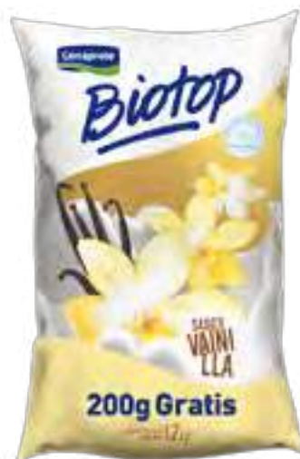
Biotop Vainilla Cont. Neto 1,2 kg