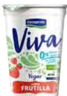
Viva Frutilla Cont. Neto 200 grs

0% grasa, 0% colesterol, sin azúcares agregado