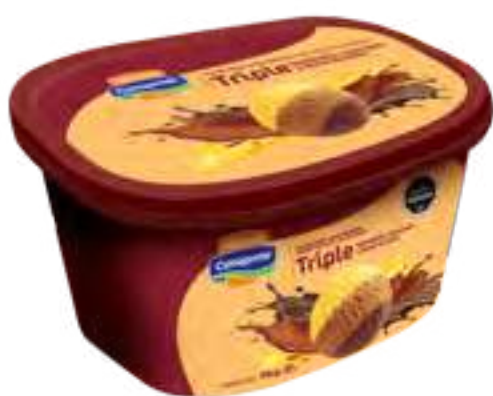
Helado Sambayón, Dulce de Leche y Chocolate Cont. Neto 2 Litros