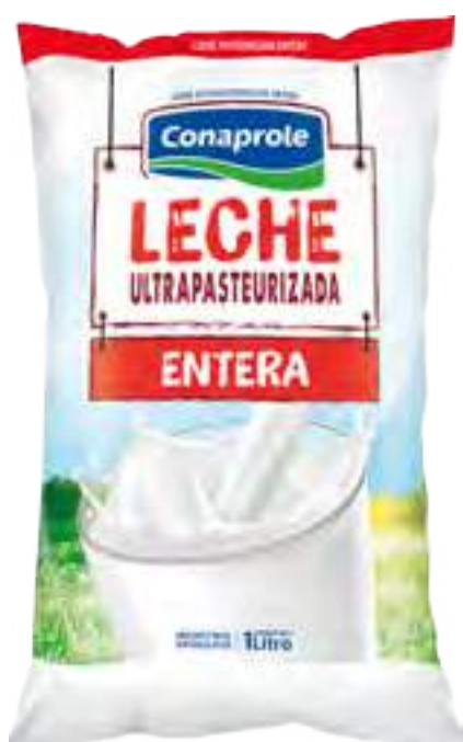
Leche Ultrapasteurizada Entera Cont. Neto 1 Litro