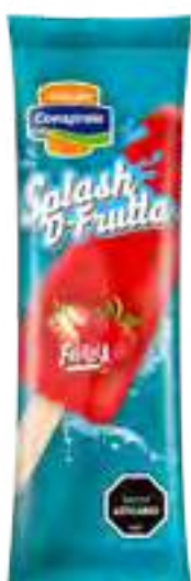
Splash D-Fruta Frutilla Cont. Neto 56 grs