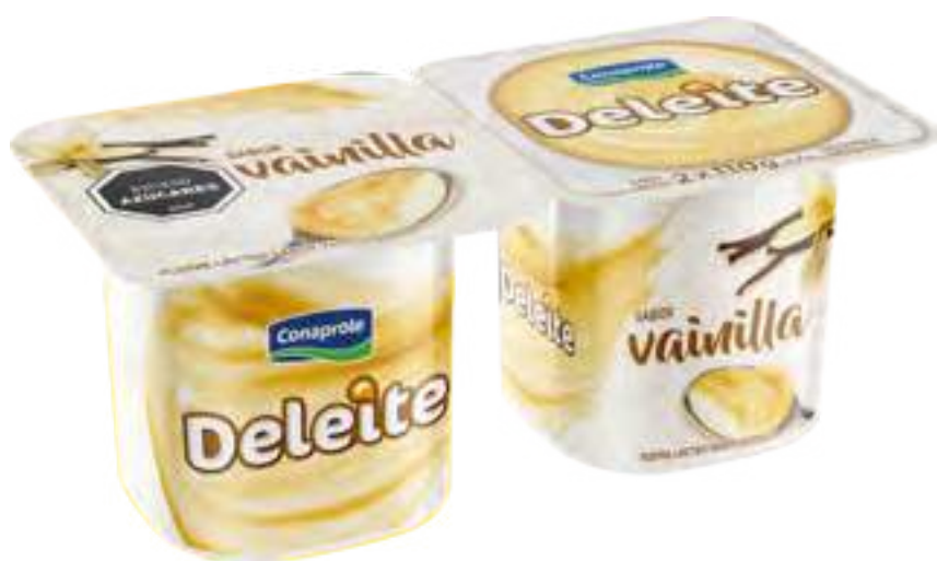
Deleite Vainilla Cont. Neto 2 x 110 grs