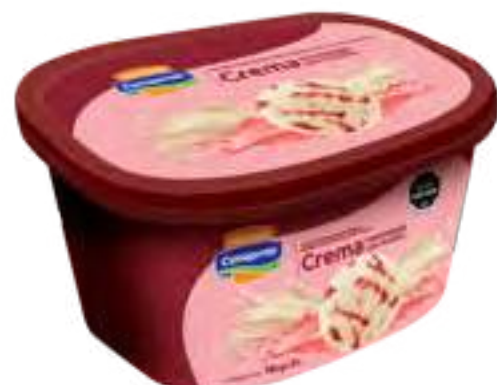
Helado Crema Marmolada con Frutilla Cont. Neto 2 Litros