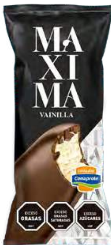
Maxima Vainilla Cont. Neto 62 grs