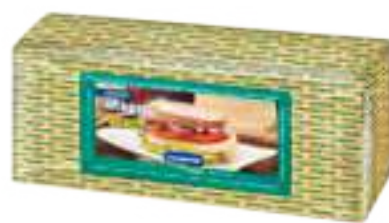
Queso Magro sin sal Cont. Aprox 2,8 kg