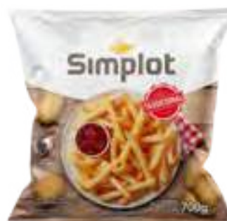
Papas Tradicionales Cont. Neto 700 grs