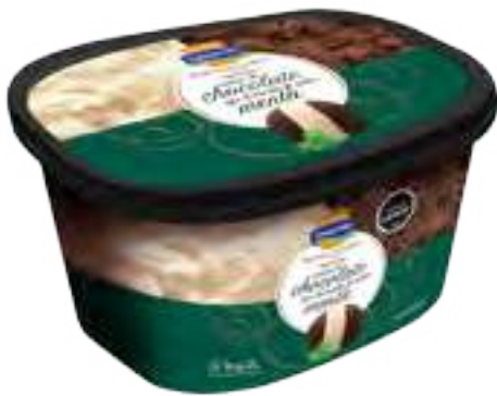
Crema de Chocolate tipo Holandés y Menta Cont. Neto 2 Litros