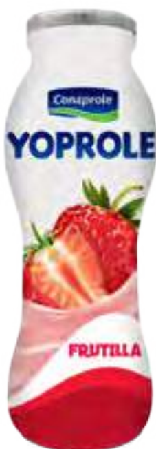
Yoprole Frutilla Cont. Neto 185 grs