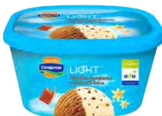
Helado Light Vainilla granizada y Dulce de leche Cont. Neto 2 litros