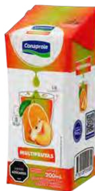
Jugo Multifrutas Cont. Neto 250 ml