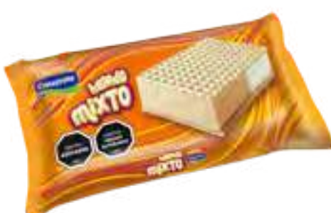
Mixto: Dulce de Leche y Crema Cont. Neto 75 grs