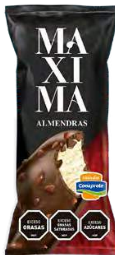
Maxima Almendras Cont. Neto 65 grs