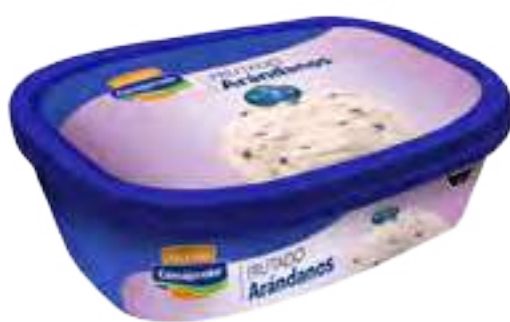
Helado Arándanos Cont. Neto 1 Litro