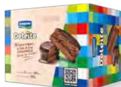
Alfajor Deleite Chocolate Cont. 3 uni x 60 grs (180 grs)