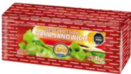
Queso Sandwich Cont. Neto 4 kg