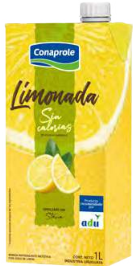
Limonada Light Cont. Neto 1 litro