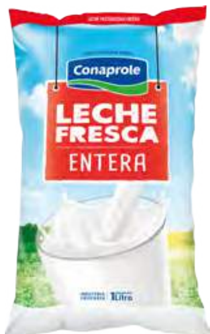
Leche Fresca Entera Cont. Neto 1 Litro