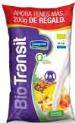
Ananá Durazno Light Cont. Neto 1,2 kg