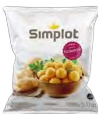
Papas Noisettes Cont. Neto 1,1 kg