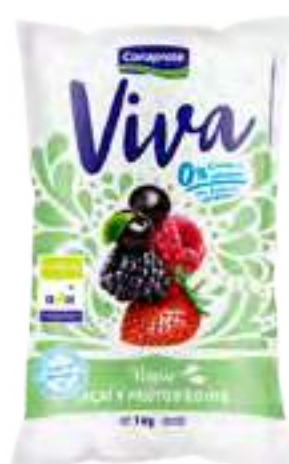
Viva Açaí y Frutos Rojos Cont. Neto 1 kg