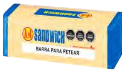
Queso Sandwich Alpa Cont. Neto 4 kg