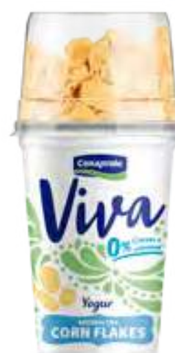
Viva Corn Flakes Cont. Neto 162 grs