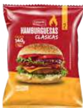
Hamburguesa Clásica Conaprole 2 X 70 g Cont. Neto 140 grs