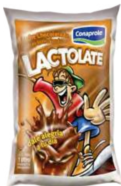
Lactolate Cont. Neto 1 Litro