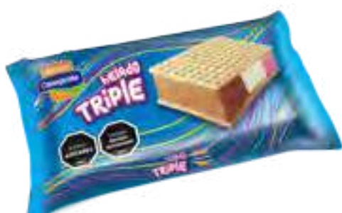
Triple Crema, Chocolate y Frutilla Cont. Neto 75 grs