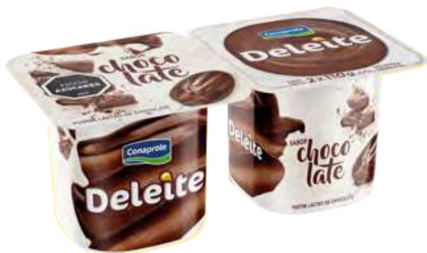
Deleite Chocolate Cont. Neto 2 x 110 grs