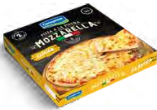
Pizza 2 Unidades Cont. Neto 900 grs