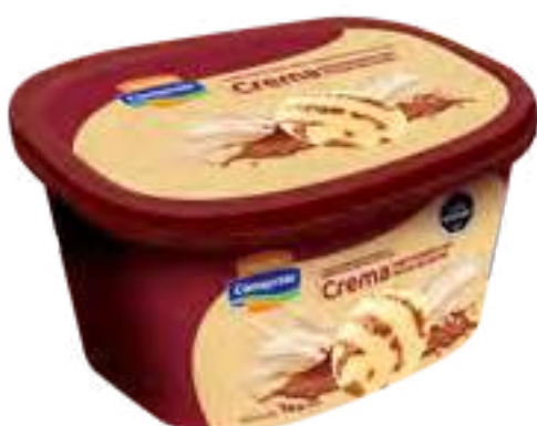
Helado Crema Marmolada con Dulce de Leche Cont. Neto 2 Litros