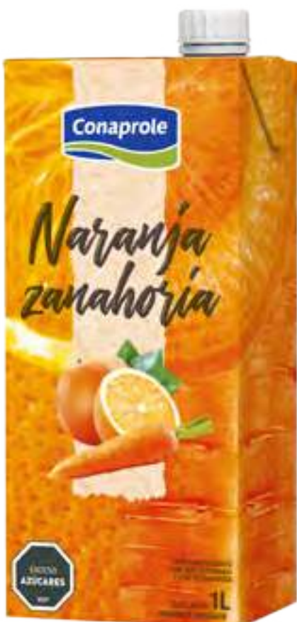
Jugo Naranja y Zanahoria Cont. Neto 1 litro