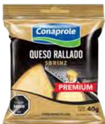
Queso Rallado Cont. Neto 40 grs