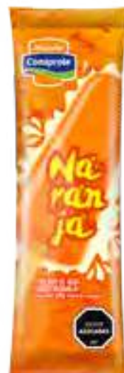
Helado de Naranja Cont. Neto 58 grs