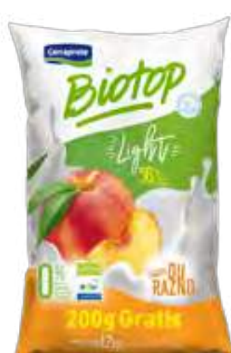
Biotop Durazno Light Cont. Neto 1,2 kg