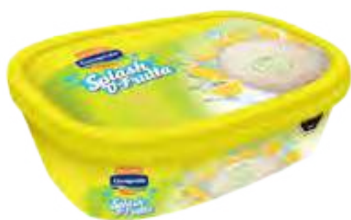
Helado Limón Cont. Neto 1 Litro