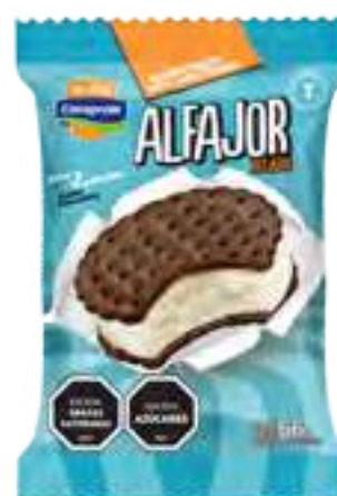
Alfajor Vainilla Cont. Neto 66 grs