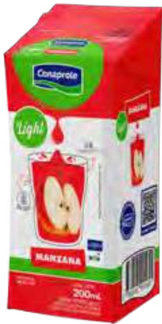
Jugo Manzana Light Cont. Neto 250 ml