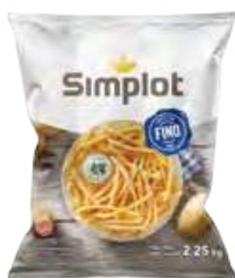
Papas Corte Fino Cont. Neto 2,25 kg