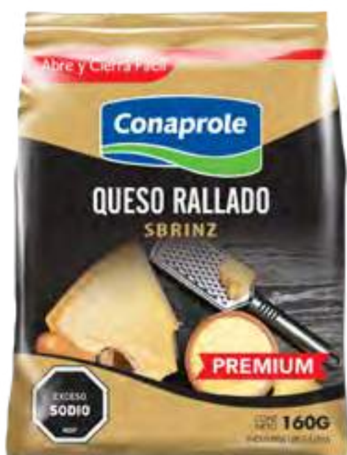
Queso Rallado Cont. Neto 160 grs