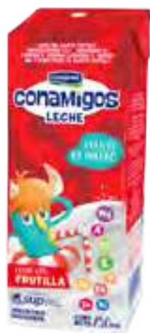
Leche Frutilla Conamigos Cont. Neto 250 ml