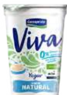
Viva Natural Cont. Neto 200 grs