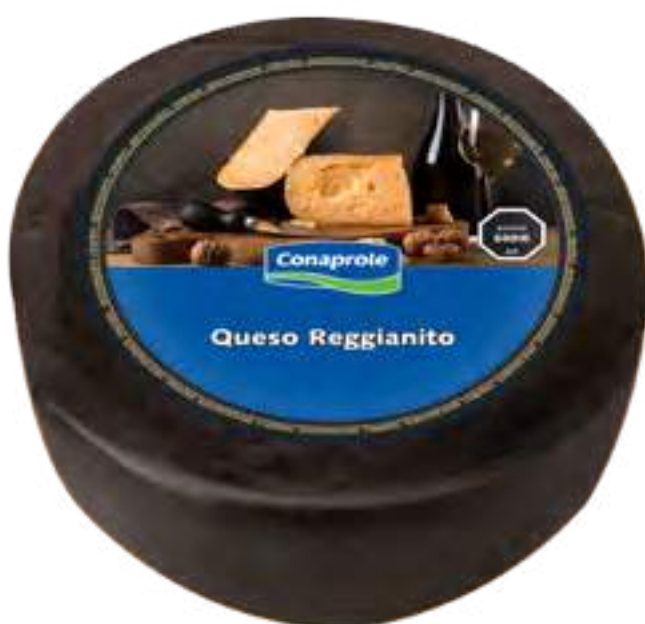
Queso Reggiano Cont. Neto 7,5 kg