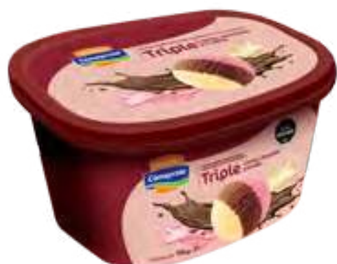
Helado Crema, Frutilla y Chocolate Cont. Neto 2 Litros