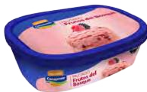
Helado Frutos del Bosque Cont. Neto 1 Litro