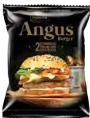
Hamburguesa Angus Cont. Neto 200 grs