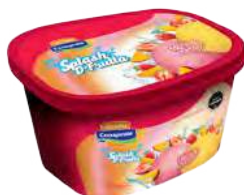
Helado Frutilla y Mango Cont. Neto 2 Litros