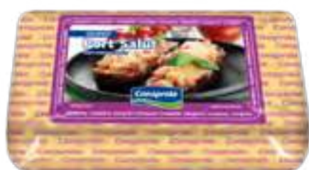
Queso Port salut Cont. Aprox 700 grs