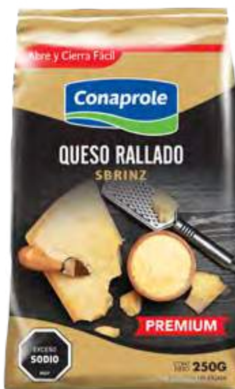
Queso Rallado Cont. Neto 250 grs