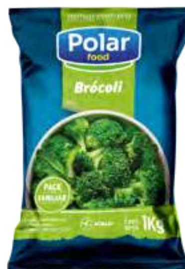
Brócoli Cont. Neto 1 kg