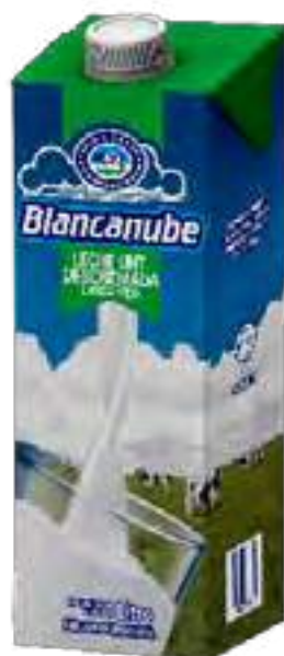
Leche UHT Larga Vida Descremada