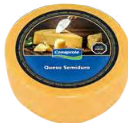
Queso Semiduro Cont. Aprox 6,2 kg