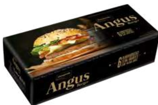
Hamburguesa Angus Cont. Neto 600 grs