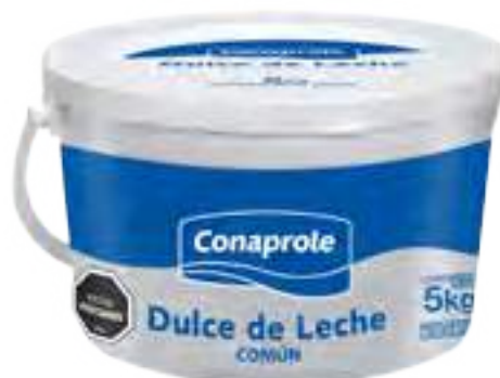
Dulce de Leche Común Cont. Neto 5 kg