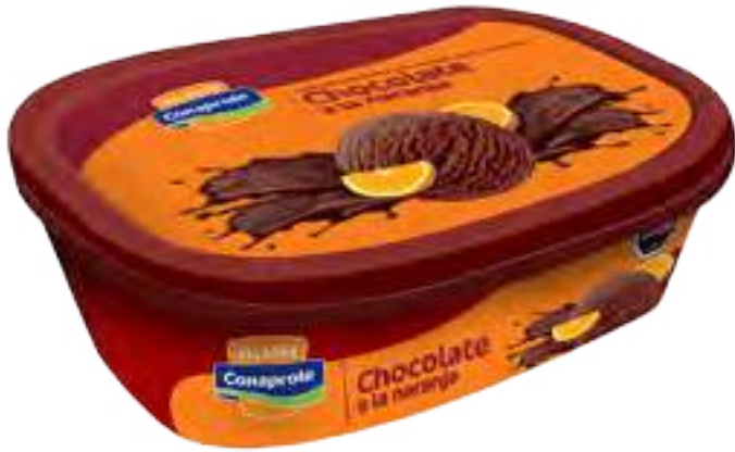
Helado Chocolate a la Naranja Cont. Neto 1 Litro