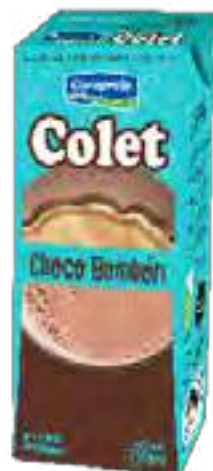
Colet Choco Bombón Cont. Neto 250 ml