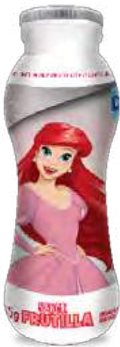
Conamigos Frutilla Cont. Neto 185 grs