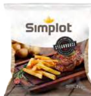
Papas Steakhouse Cont. Neto 2 kg