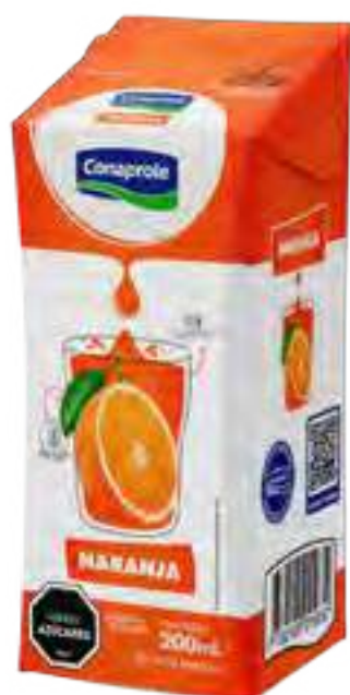
Jugo Naranja Cont. Neto 250 ml