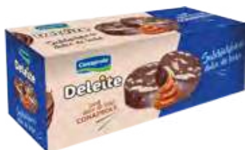
Salchich3n con Dulce de Leche Cont. Neto 500 grs