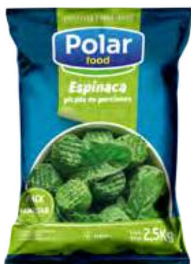
Espinaca Picada en Porciones Cont. Neto 2,5 kg