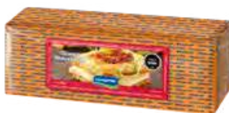
Queso Mozzarella Cont. Neto 5 kg