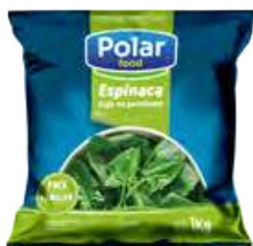
Espinaca Hoja en Porciones Cont. Neto 1 kg