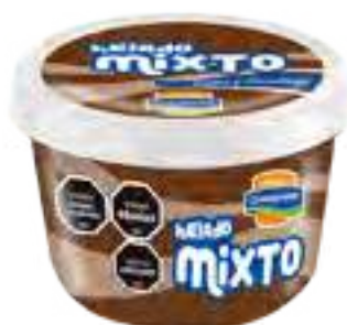
Helado Crema y Chocolate Cont. Neto 125 grs