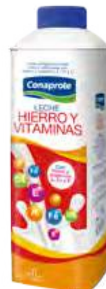
Leche Ultra Entera Hierro y Vitaminas