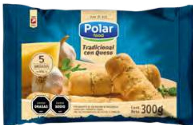
Pan de ajo Polar Food Cont. Neto 300 g