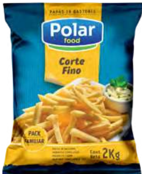
Papas Corte Fino Polar Food Cont. Neto 2 kg