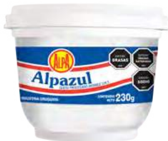
Queso Alpazul Cont. Neto 230 grs