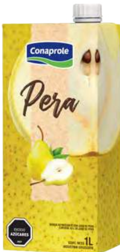
Jugo Pera Cont. Neto 1 litro