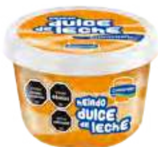
Helado Dulce de Leche Granizado Cont. Neto 125 grs