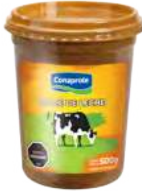
Clásico Cont. Neto 500 grs