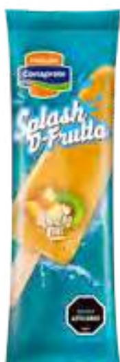
Splash D-Fruta Durazno-Kiwi Cont. Neto 56 grs