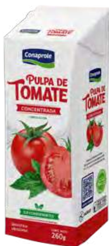
Pulpa de Tomate Cont. Neto 260 grs