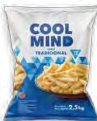
Cool Mind Corte Tradicional Cont. Neto 2,5 kg