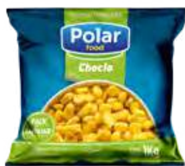
Choclo Cont. Neto 1 kg