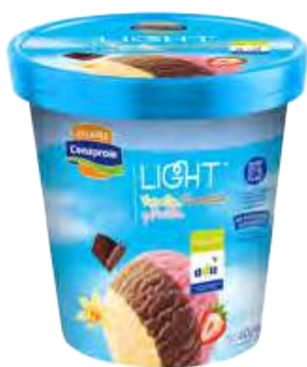
Helado Light Triple: Vainilla Chocolate y Frutilla Cont. Neto 900 ml