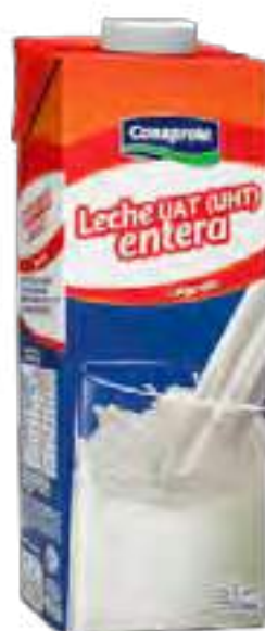
Leche UHT Larga Vida Entera