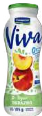
Viva Durazno Cont. Neto 185 grs