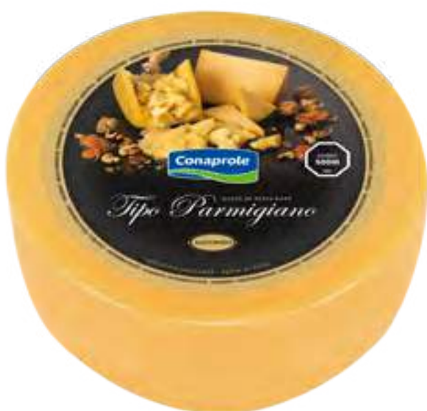
Queso Parmigiano Cont. Neto 7,5 kg