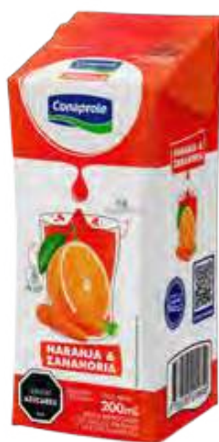
Jugo Naranja y Zanahoria Cont. Neto 250 ml