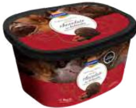
Chocolate tipo Holadés Marmolado con Dulce de Leche Cont. Neto 2 Litros