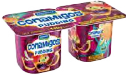
Pudding Chocolate Cont. Neto 2 x 110 grs