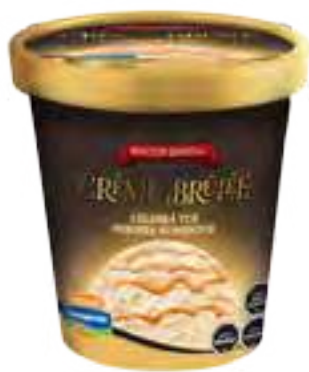
Creme brûlée Marmolado con Caramelo