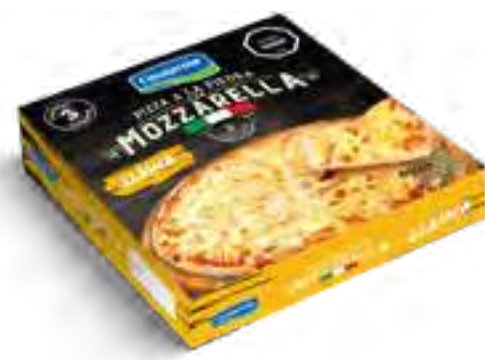
Pizza 3 Unidades Cont. Neto 600 grs