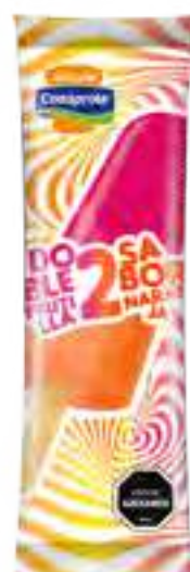
Frutilla Naranja Cont. Neto 58 grs