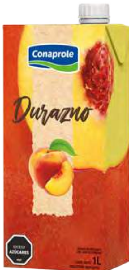
Jugo Durazno Cont. Neto 1 litro