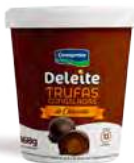
Trufas Dulce de Leche Cont. Neto 168 grs