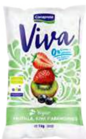
Viva Frutilla, Kiwi y Arándanos Cont. Neto 1 kg