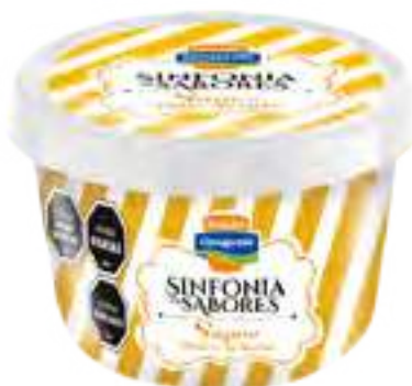
Súper Dulce de Leche Cont. Neto 125 grs