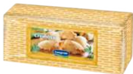
Queso Cremoso Cont. Aprox 3 kg