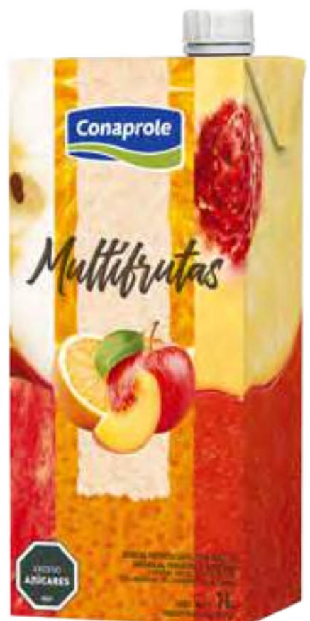
Jugo Multifrutas Cont. Neto 1 litro