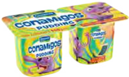
Pudding Vainilla Cont. Neto 2 x 110 grs