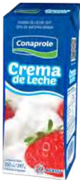
Crema de Leche Cont. Neto 250 ml