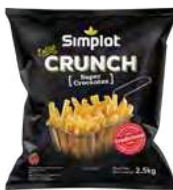
Papas Tradicionales Extra Crunch Cont. Neto 2,5 kg