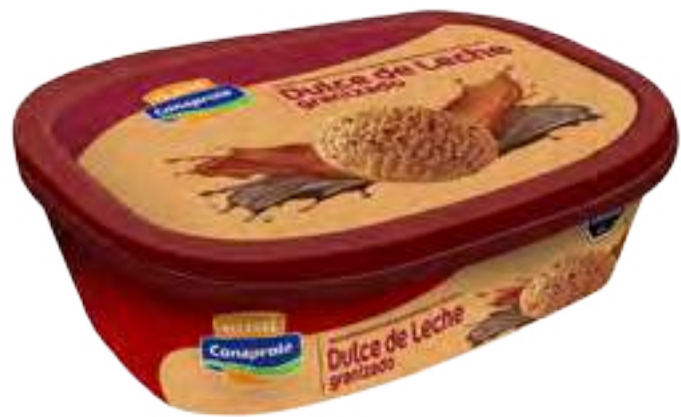
Helado Dulce de Leche Granizado Cont. Neto 1 Litro