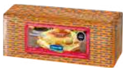
Queso Mozzarella Cont. Neto 3 kg