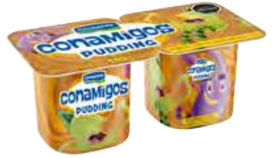
Pudding Dulce de Leche Cont. Neto 2 x 110 grs