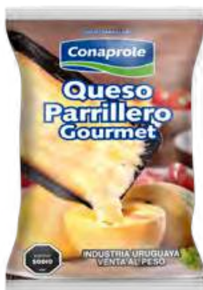
Parrillero en porción Cont. Aprox 350 grs c/u