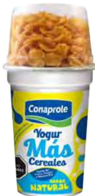
Más Cereales Cont. Neto 166 grs