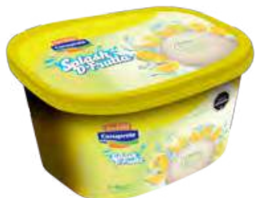
Helado Limón Cont. Neto 2 Litros