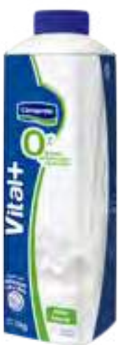
Natural 0% Cont. Neto 1 kg

0% grasa, 0% colesterol, sin azúcares agregado