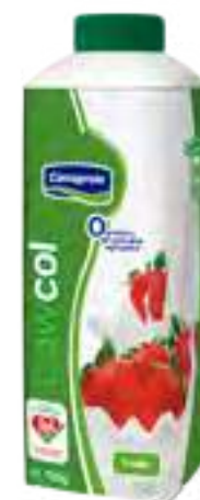
Frutilla 0% Cont. Neto 750 grs