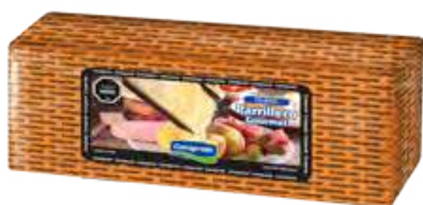
Queso Parrillero Cont. Aprox 3 kg