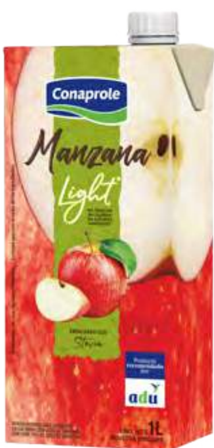
Jugo Manzana Light Cont. Neto 1 litro