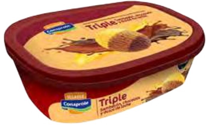
Helado Sambayón, Dulce de Leche y Chocolate Cont. Neto 1 Litro