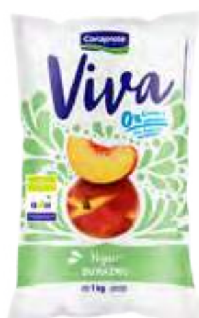
Viva Durazno Cont. Neto 1 kg