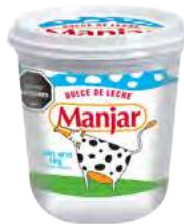
Dulce de Leche Manjar Cont. Neto 1 kg