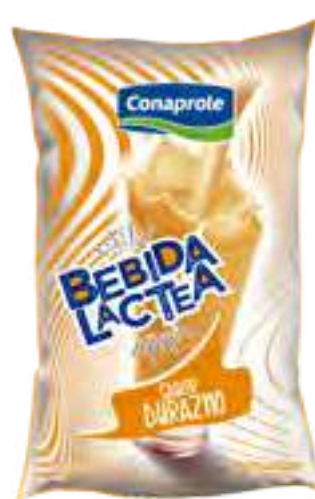
Bebida Láctea Durazno Cont. Neto 1 Litro