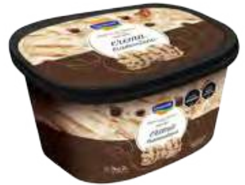
Crema Tramontana Cont. Neto 2 Litros