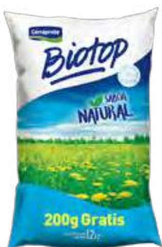
Biotop Natural Cont. Neto 1,2 kg