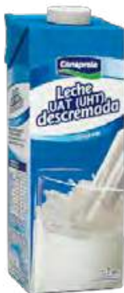
Leche UHT Larga Vida Descremada