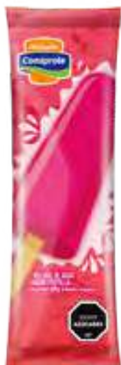
Helado de Frutilla Cont. Neto 58 grs