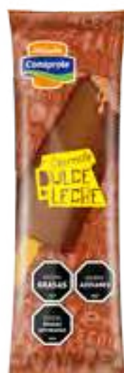
Barrita de Dulce de Leche Cont. Neto 72 grs