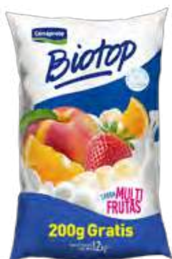
Biotop Multifrutas Cont. Neto 1,2 kg