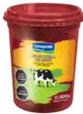
Dulce Crema de Leche Cont. Neto 500 grs