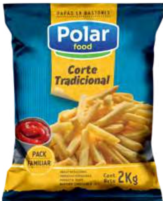
Papas Corte Trad. Polar Food Cont. Neto 2 kg