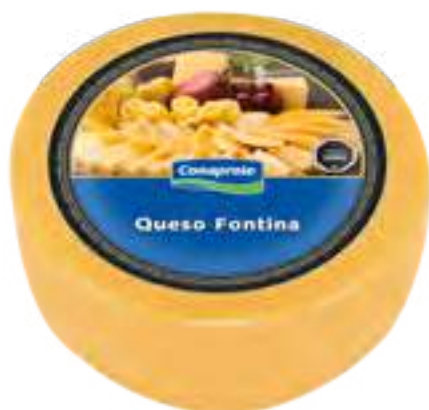
Queso Fontina Cont. Aprox 4,2 kg