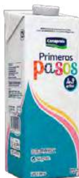
Leche Primeros Pasos