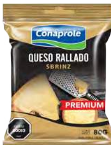
Queso Rallado Cont. Neto 80 grs