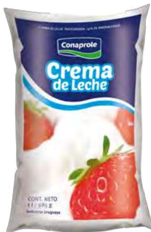
Crema de Leche Cont. Neto 1 litro