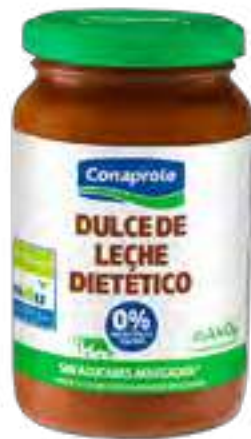
Dulce de Leche Dietético Cont. Neto 440 grs

0% grasa, 0% colesterol, sin azúcares agregado