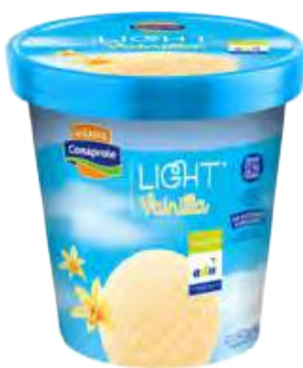
Helado Light Vainilla Cont. Neto 900 ml