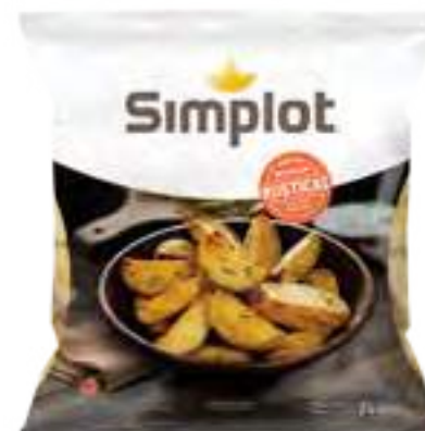
Papas Rústicas Cont. Neto 2 kg