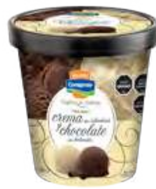
Crema tipo Irlandesa y Chocolate tipo Holandés