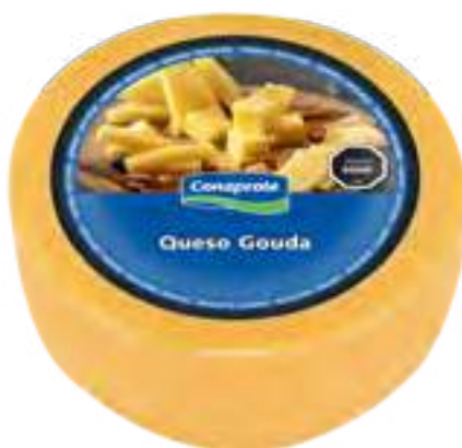
Queso Gouda Cont. Aprox 4,5 kg