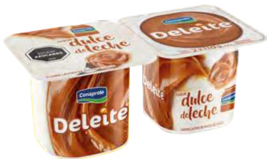
Deleite Dulce de Leche Cont. Neto 2 x 110 grs