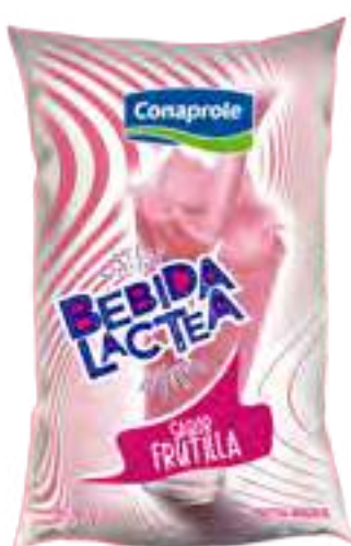
Bebida Láctea Frutilla Cont. Neto 1 Litro