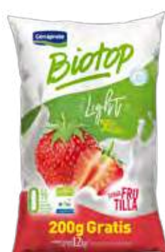
Biotop Frutilla Light Cont. Neto 1,2 kg