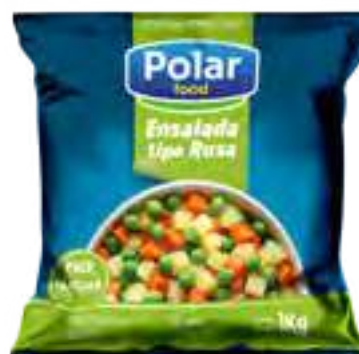
Ensalada Jardinera / Rusa Cont. Neto 1 kg