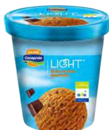
Helado Light Dulce de Leche Granizado Cont. Neto 900 ml