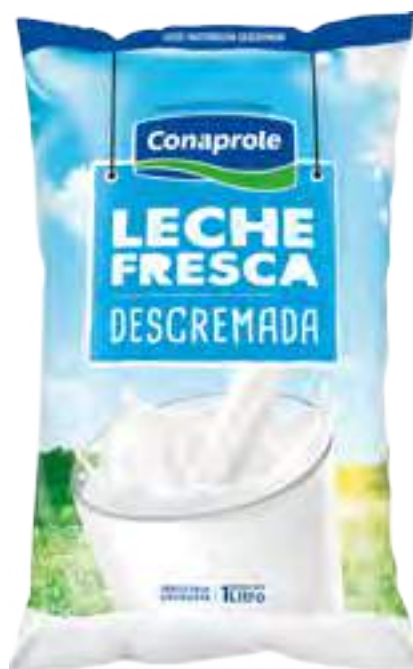
Leche Fresca Descremada Cont. Neto 1 Litro