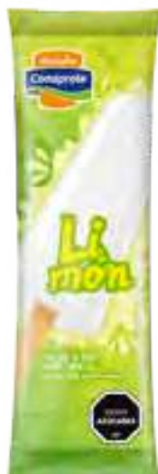
Helado de Limón Cont. Neto 58 grs