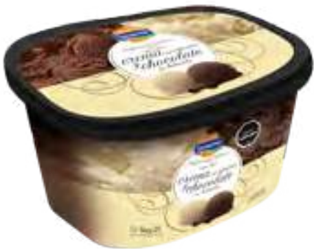
Crema tipo Irlandesa y Chocolate tipo Holandés Cont. Neto 2 Litros