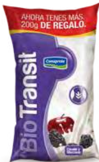
Manzana Ciruela Cont. Neto 1,2 kg