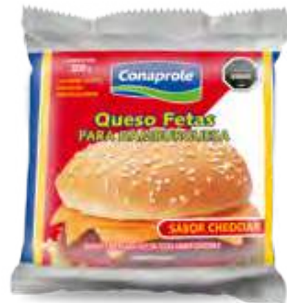
Para Hamburguesas en fetas sabor Cheddar Cont. Neto 200 grs