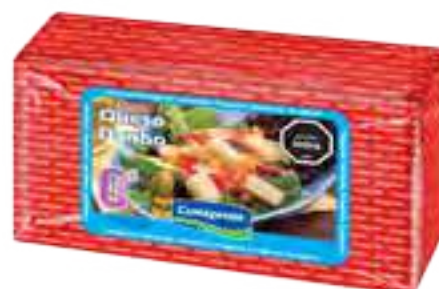
Queso Danbo 0% Lactosa Cont. Aprox 3 kg