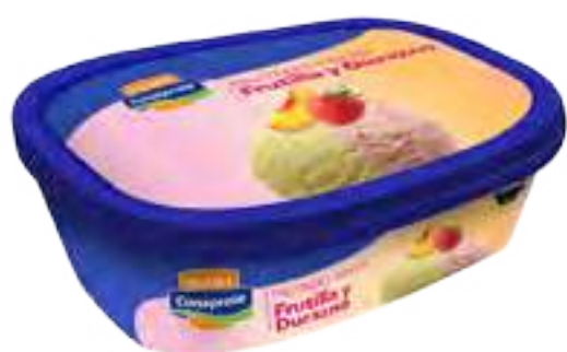
Helado Frutilla y Durazno Cont. Neto 1 Litro