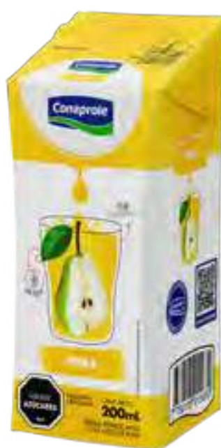
Jugo Pera Cont. Neto 250 ml