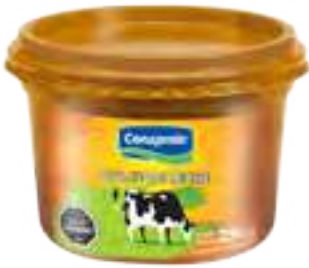
Clásico Cont. Neto 250 grs