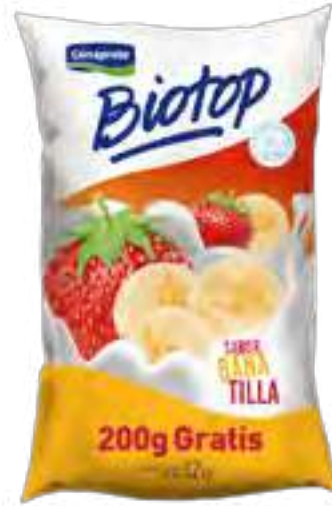
Biotop Banatilla Cont. Neto 1,2 kg