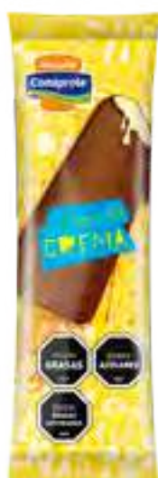
Barrita de Crema Cont. Neto 69 grs