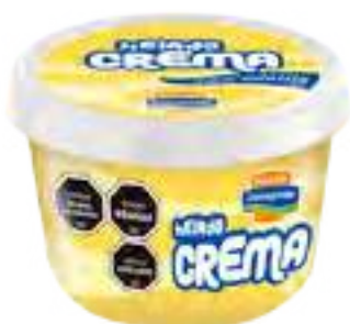
Helado Crema Cont. Neto 125 grs