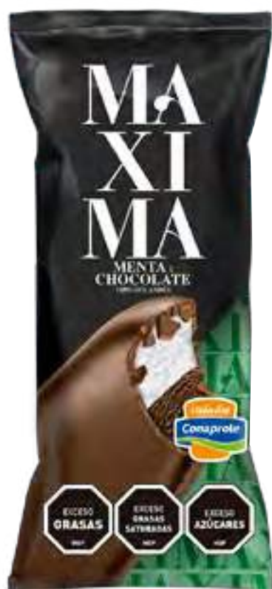
Maxima Menta y Chocolate Cont. Neto 65 grs