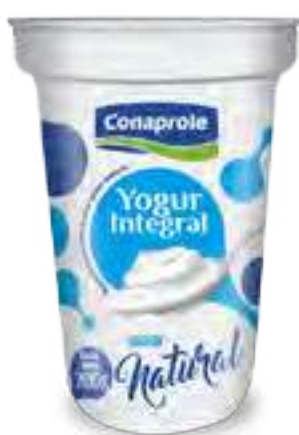
Integral Natural Cont. Neto 200 grs