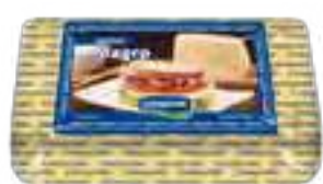
Queso Magro Cont. Aprox 1 kg