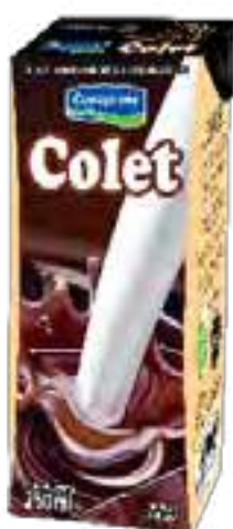
Colet Clásico Cont. Neto 250 ml