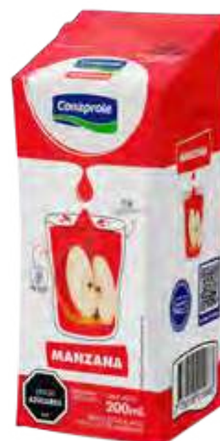
Jugo Manzana Cont. Neto 250 ml