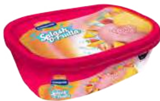
Helado Frutilla y Mango Cont. Neto 1 Litro