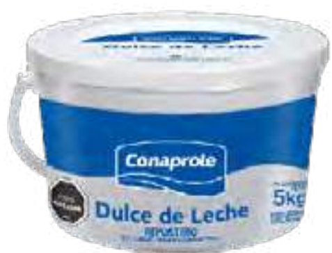
Dulce de Leche Repostero Cont. Neto 5 kg