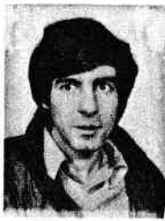
MARECHAL Henri Weertsdreef 25 3044 OUD HEVERLEE 016/47.73.63