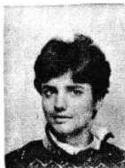
FOBE Fabienne Roosevelttlaan 99 9000 GENT 091/23.87.05 rue Jules Trooz 63 1150 BRUXELLES