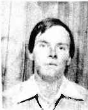
NYS Jean rue de la Madeleine 82 7500 TOURNAI 069/22.24.18