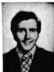
FEDIDA Alain dédale du Campanile 3/208 Bte 20/043 1200 BRUXELLES