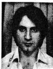
BALLOUT Jabbour avenue de l'Héliport 16 Bte 1000 BRUXELLES