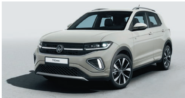
Ascot grigio Verniciatura tinta unita