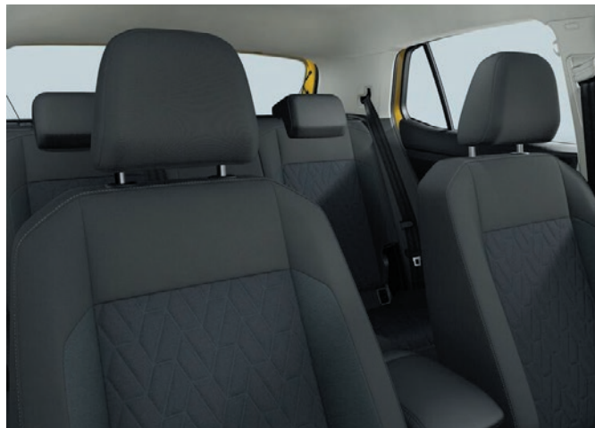
Life/UNITED (di serie): tessuto, grigio mélange