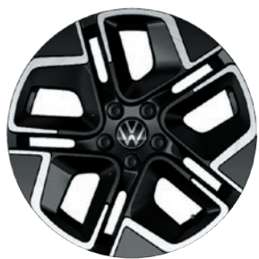
Cerchi in lega leggera «York» in nero torniti a specchio