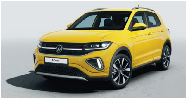
Grape Yellow Verniciatura tinta unita