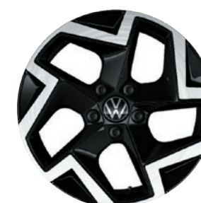
Cerchi in lega leggera «Coventry»