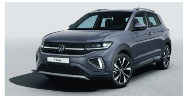
Grigio fumo Verniciatura metallizzata