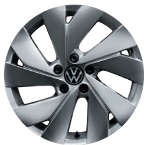
Cerchi in lega leggera «Nottingham»