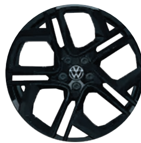
Cerchi in lega leggera «York» in nero torniti (non specchio)