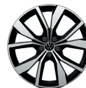
Cerchi in lega leggera «Misano»