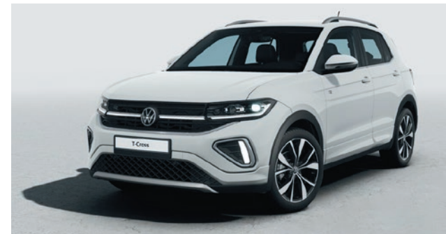
Pure White Verniciatura tinta unita