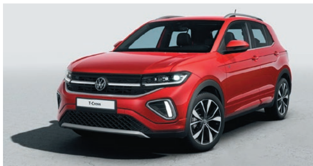
Kings Red Verniciatura metallizzata