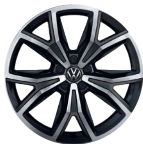
Cerchi in lega leggera «Köln»