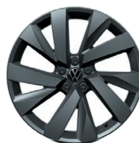
Cerchi in lega leggera «Funchal»