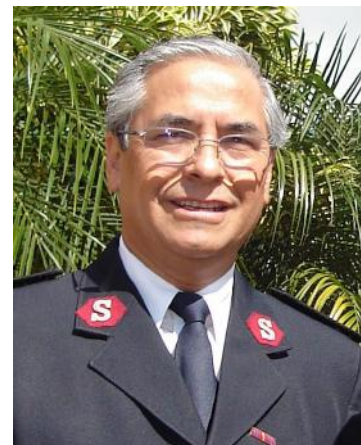
Mayor Eduardo Almendras Lagos Oficial Retirado