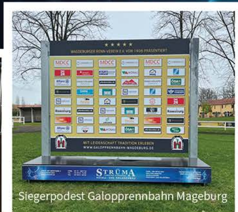
Siegerpodest Galopprennbahn Mageburg