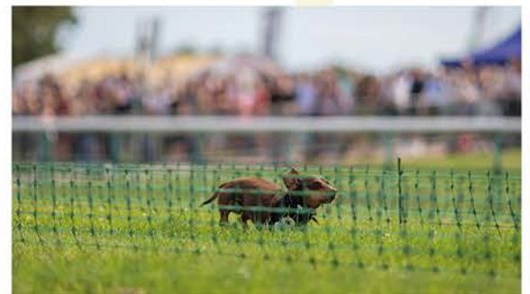
DIE 1. PLATZIERTEN DER DREI RENNKLASSEN.