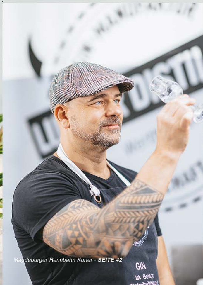
Magdeburger Rennbahn Kurier - SEITE 42

Ausgewählte fruchtige und aromatische Bio-Botanicals bestimmen den außergewöhnlichen floralen Charakter unserer Kreationen, betont Tobias Kaiser.