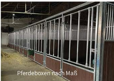
Pferdeboxen nach Maß