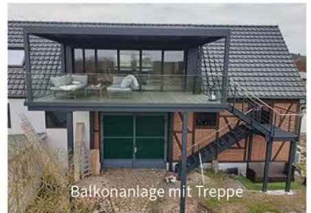
Balkonanlage mit Treppe