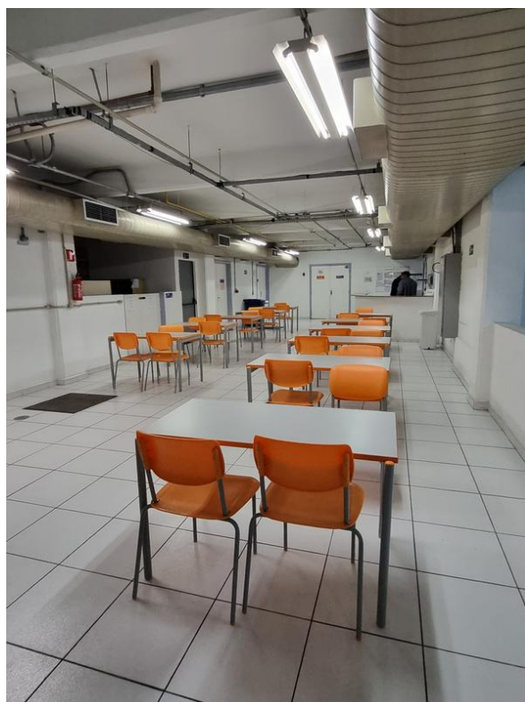
Subsolo – Refeitório, farmácia e almoxarifado.