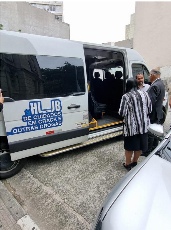
Encaminhamento de pacientes para unidades conveniadas.