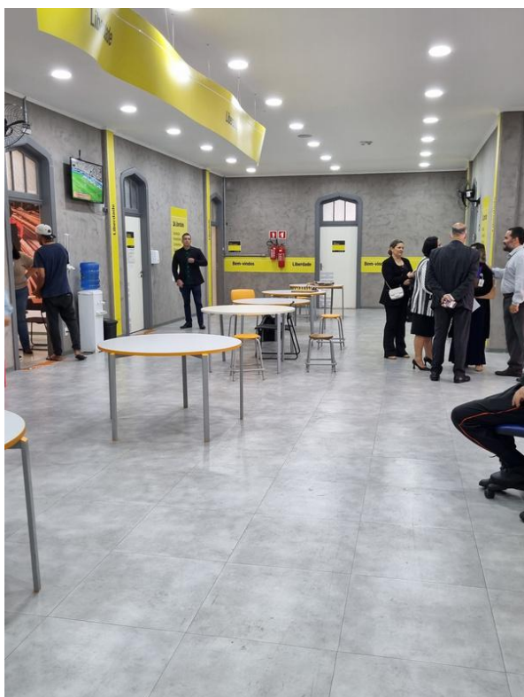
2º andar – salas de grupos e consultórios.