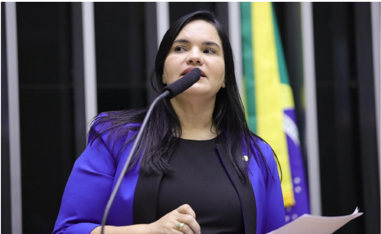
Dep. Missionária Michele Collins (PP/PE) - Autora do Requerimento 57/2024

Em reunião ocorrida no dia 9/10/2024, a Comissão de Previdência, Assistência Social, Infância, Adolescência e Família - CPASF aprovou o Requerimento nº 57/2024 CPASF, de autoria da Deputada Missionária Michele Collins (PP/PE), que requer a realização de Visita Técnica, por esta Comissão, ao Hub de Cuidados em Crack e Outras Drogas, em São Paulo – SP, para conhecer o modelo de trabalho oferecido no tratamento de usuários de drogas e os serviços sócio assistenciais ofertados às famílias.