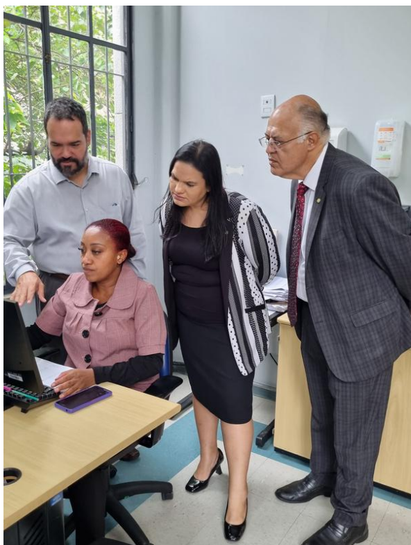
1º andar – acolhimento multiprofissional e triagem para encaminhamento às unidades conveniadas.