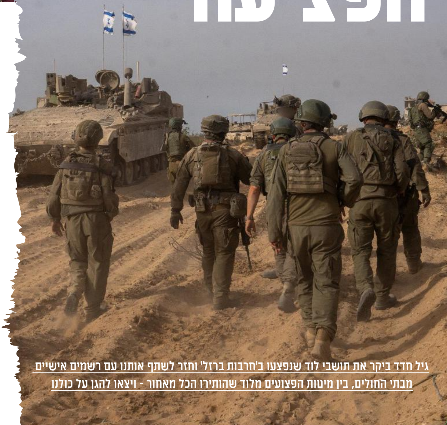
גיל חדד ביקר את תושבי לוד שנפצעו ב'חרבות ברזל' וחזר לשתף אותנו עם רשמים אישיים מבתי החולים, בין מיטות הפצועים מלוד שהותירו הכל מאחור - ויצאו להגן על כולנו