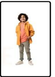
GRADE SCHOOL (5 TO 12 YEAR)