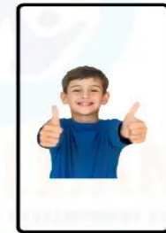
PRESCHOOL AGE (3 TO 5 YEARS)