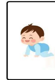
BABIES (BIRTH TO 12 MONTHS)