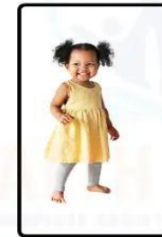
TODDLERHOOD (1 TO 3 YEARS)