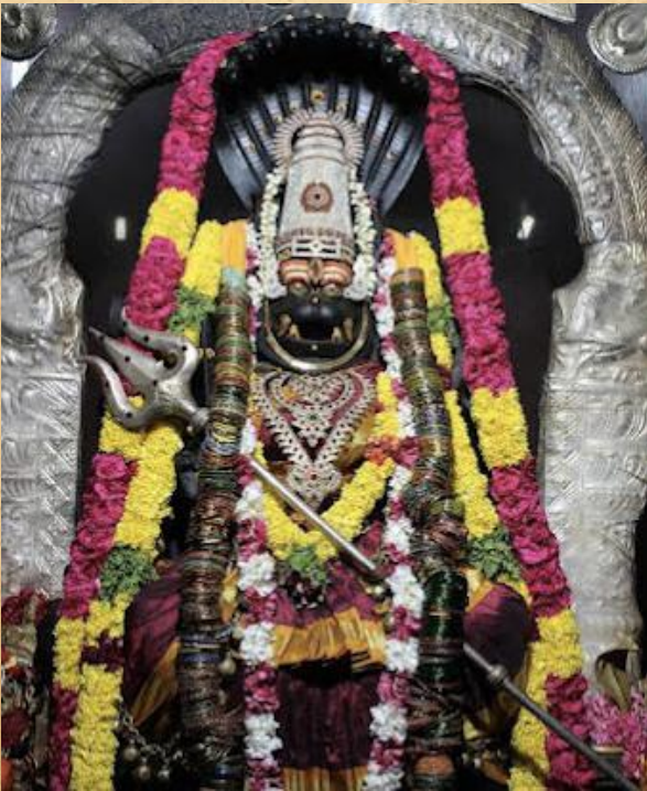
నికుంభిల అని కూడా అమ్మవారిని కొలుస్తారు.

శ్రీ మహా ప్రత్యంగిరా దేవి శక్తివంతమైన దేవత. అంగీరసుడు, ప్రత్యంగిరసుడు అనే ఇద్దరు పవిత్ర ఋషులు ఆమె మూలమంత్రాన్ని, దేవిని స్వయంగా కనుగొన్నట్లు తెలుస్తోంది. అందువలన ఆమె పేరు వాటి నుండి ఉద్భవించింది.