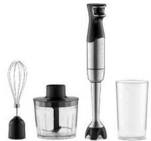
STABMIXER DYNAMIC BLADE 1500