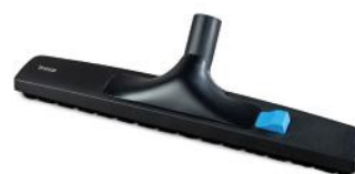
UNIVERSAL BODENDÜSE XXL, 35 MM