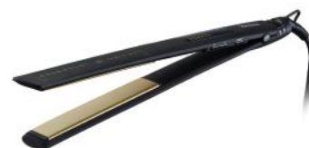
HAARGLÄTTEISEN ESSENTIAL GLAMOUR