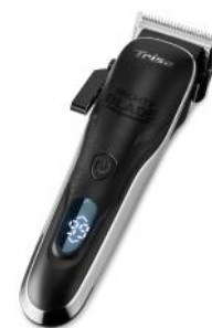
HAARSCHNEIDER MIGHTY BLADE