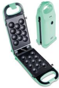
SNACK MAKER RETRO LINE, MINT