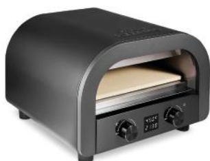
ELEKTR. PIZZAOFEN PIZZA MIO+