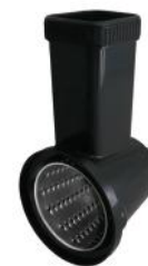
GEMÜSESCHNEIDER ZU 6610/6623