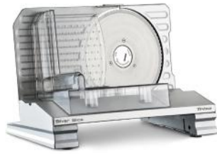
ALLESSCHNEIDER SILVER SLICE