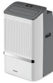
KLIMAGERÄT COOL MATE X78 PRO