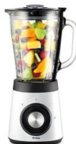
STANDMIXER DINERS EDITION