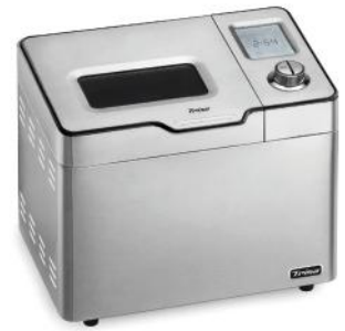
BROTBÄCKER LE BISTRO