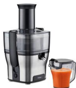
ENTSAFTER PURE JUICE