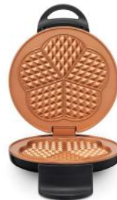
WAFFELEISEN RETRO WAFFLES