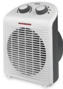
HEIZLÜFTER HEAT & CHILL