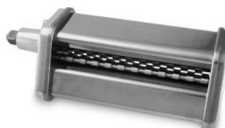
BANDNUDELSCHNEIDER ZU 6610/6623