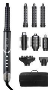
MULTISTYLER SUPREME STYLE