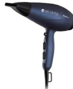
HAARTROCKNER IONIC SILK PLUS