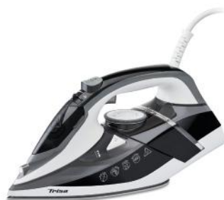
DAMPFBÜGELEISEN PROFESSIONAL STEAM I6242