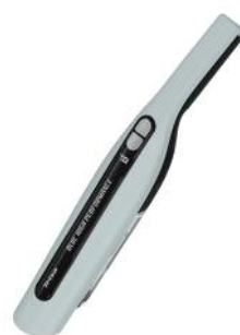
HANDSTAUBSAUGER QUICK CLEAN COMFORT T1912