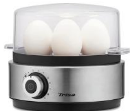
EIERKOCHER VARIO EGGS