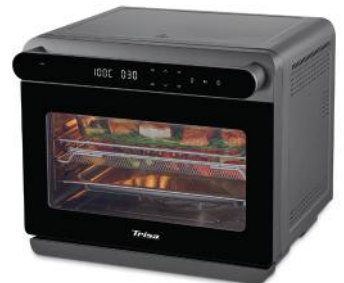
STEAMER AIR FUSION PRO 24 L