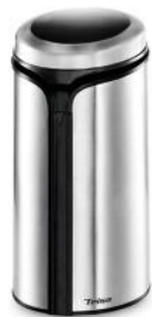
KAFFEEMÜHLE MACININO CAFFÈ