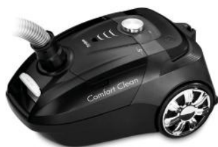
STAUBSAUGER COMFORT CLEAN T9142