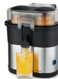
ZITRUSPRESSE VITA XPRESS DUO