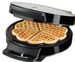
WAFFELEISEN WAFFLE PLEASURE