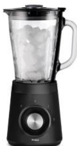
STANDMIXER DINERS EDITION