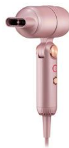
HAARTROCKNER IONIC-T BLUSH