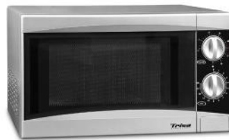
MIKROWELLE MICRO PLUS