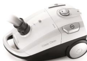
STAUBSAUGER CLASSIC CLEAN T6601