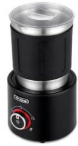
MILCHAUFSCHÄUMER MILKY AIR PRO