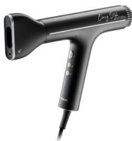
HAARTROCKNER CLASSY STYLE