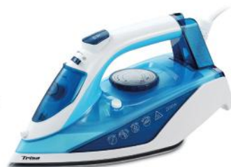
DAMPFBÜGELEISEN COMFORT STEAM I5717