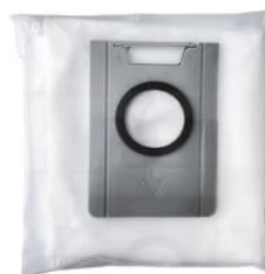
STAUBBEUTEL 1.5 L ZU 9524, 3 STK.