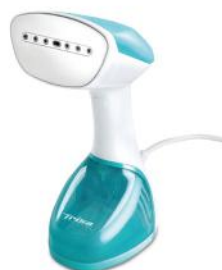
DAMPFBÜRSTE SILKY STEAM