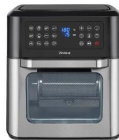
HEISSLUFTFRITTEUSE CRISP MASTER