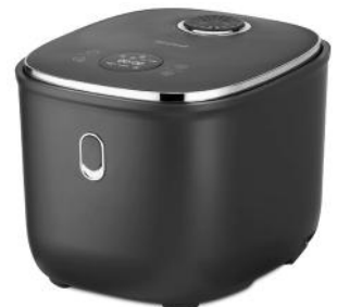
REISKOCHER NICE RICE PLUS