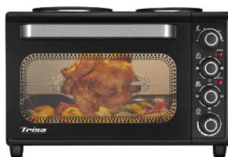
BACKOFEN BAKE & COOK