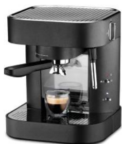
FILTERKAFFEEMASCHINE PERFECT COFFEE 6