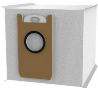
STAUBBEUTEL 3.2 L ZU 9523, 3 STK.