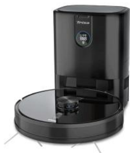
ROBOTERSTAUBSAUGER T-BOT PRO 4000