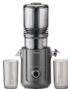
ENTSAFTER SLOW FLOW JUICE