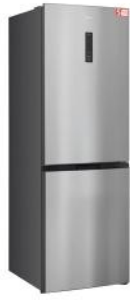
KOMBI KÜHLSCHRANK 323 L, EDELSTAHL