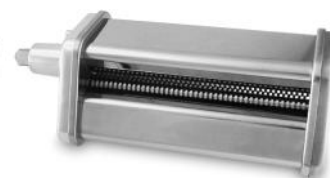
SPAGHETTISCHNEIDER ZU 6610/6623