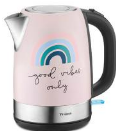
WASSERKOCHER GOOD VIBES