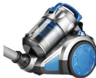
STAUBSAUGER TRUE CYCLONE COMFORT CLEAN T6301