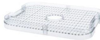
DÖRRGITTER HEALTHY SNACK