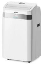
KLIMAGERÄT COOL MATE X77 PRO