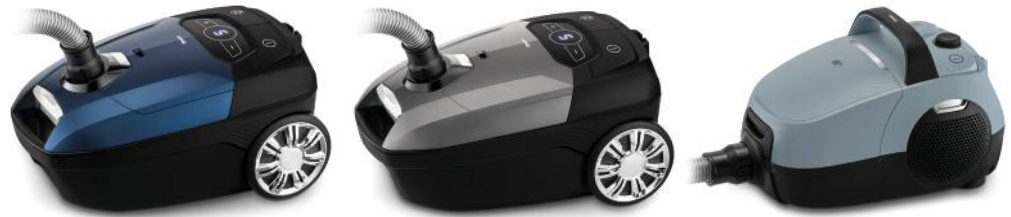
STAUBSAUGER PROFESSIONAL CLEAN T3420