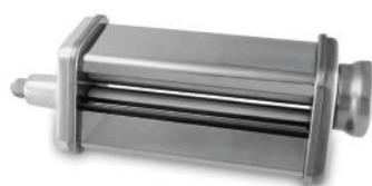
TEIGROLLER ZU 6610/6623