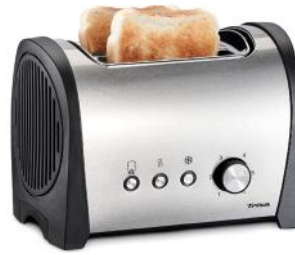
TOASTER ROYAL TOAST