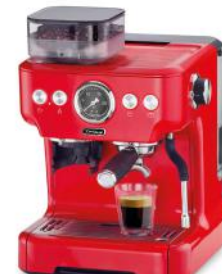
ESPRESSOMASCHINE BARISTA PLUS, ROT