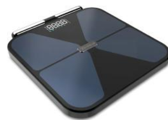
PERSONENWAAGE BIOMETRIX SMART