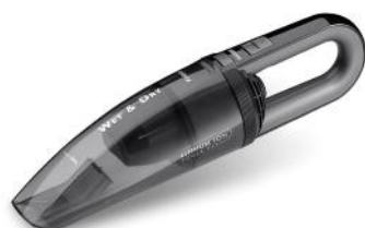
HANDSTAUBSAUGER QUICK CLEAN CLASSIC T8542