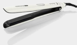
DAMPFGLÄTTEISEN STEAM STYLE PRO