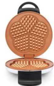
WAFFELEISEN RETRO WAFFLES