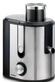
ENTSAFTER VITAL JUICER