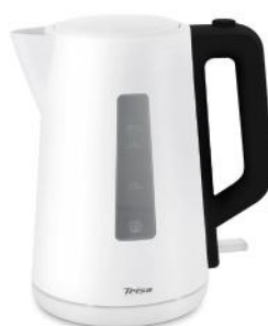
WASSERKOCHER CLASSIC BOIL 1.7 L W6770