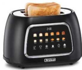
TOASTER TOAST IT!