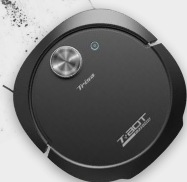
ROBOTERSAUGER T-BOT MAX 12000