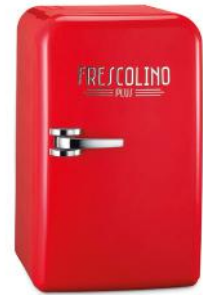
MOBILE KÜHLBOX FRESCOLINO PLUS, 12V ROT