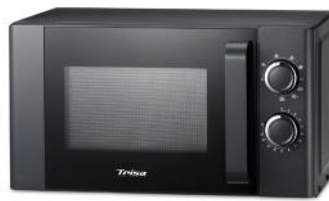
MIKROWELLE MICRO GRILL 20L