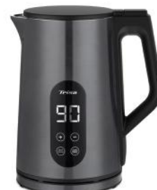
WASSERKOCHER DIGITAL BOIL