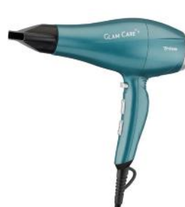
HAARTROCKNER GLAM CARE