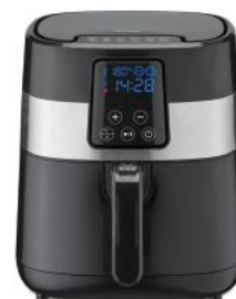
HEISSLUFTFRITTEUSE TASTY FRY