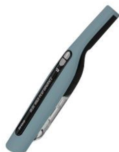
HANDSTAUBSAUGER QUICK CLEAN COMFORT T1911