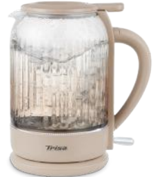
WASSERKOCHER SILENT BOIL 1.5L BEIGE