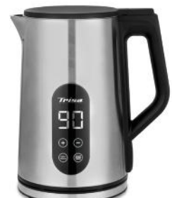
WASSERKOCHER DIGITAL BOIL