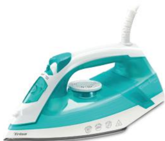
BÜGELEISEN CLASSIC STEAM I5521