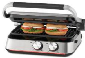
DOPPELPLATTEN GRILL PRIME PANINI