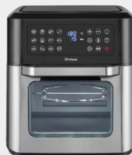
HEISSLUFTFRITEUSSE CRISP MASTER