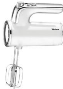
HANDMIXER DINERS EDITION WEISS