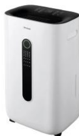
LUFTENTFEUCHTER DRY MATE PRO