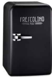
MOBILE KÜHLBOX FRESCOLINO PLUS, 12V SCHWARZ