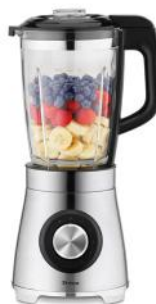
STANDMIXER VARIO POWER MIX