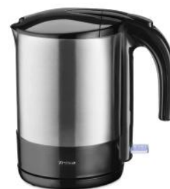
WASSERKOCHER COMFORT BOIL W4875