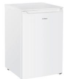
GEFRIERSCHRANK 87 L