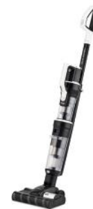
AKKUSTAUBSAUGER QUICK CLEAN PROFESSIONAL T2270