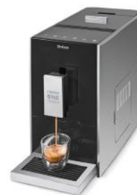
KAFFEEVOLLAUTOMAT CREMA ONE TOUCH