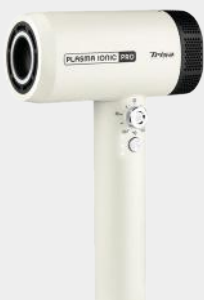
HAARTROCKNER PLASMA IONIC PRO