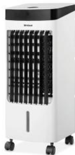
LUFTKÜHLER HYDRO CHILL X80 PLUS