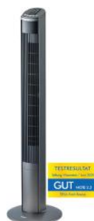
TURMVENTILATOR FRESH BREEZE