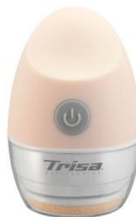
POWDER PUFF PERFECT MAKE-UP