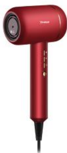
HAARTROCKNER ULTRA IONIC PRO