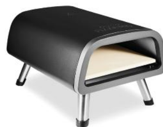
ELEKTR. PIZZAOFEN PIZZA MIO