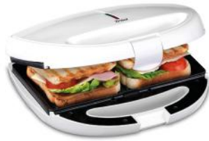
SANDWICH TOASTER TASTY SNACK