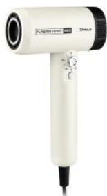
HAARTROCKNER PLASMA IONIC PRO