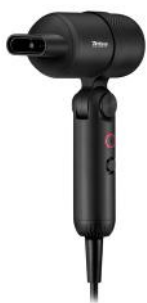
HAARTROCKNER IONIC-T BOLD