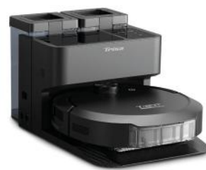
ROBOTERSTAUBSAUGER T-BOT MAX 12000