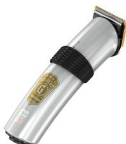
HAARSCHNEIDER GOLD CUT