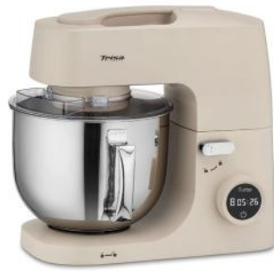
KÜCHENMASCHINE SWEET HOME BAKERY