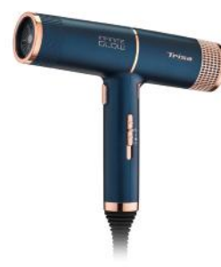
HAARTROCKNER INFINITE GLOW