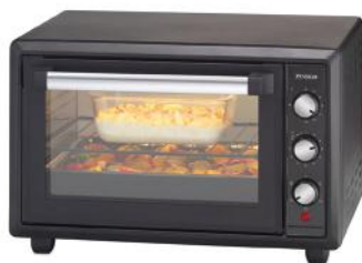
BACKOFEN FORNO GUSTO 28L