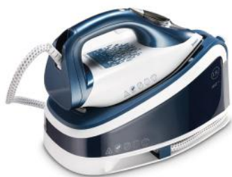
DAMPFSTATION COMFORT STEAM 15820