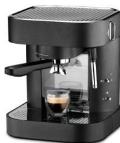
FILTERKAFFEEMASCHINE PERFECT COFFEE 12