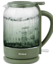
WASSERKOCHER SILENT BOIL 1.5L GRÜN