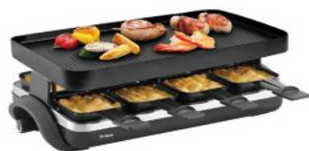
RACLETTE SUPREME 8