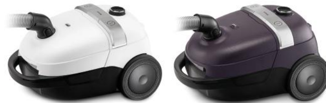
STAUBSAUGER COMFORT CLEAN T3770