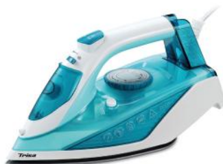
DAMPFBÜGELEISEN COMFORT STEAM I5714