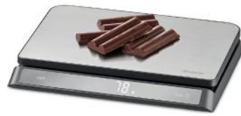
DIGITALE KÜCHENWAAGE ELITE SCALE