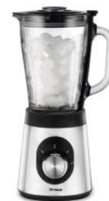
STANDMIXER ROYAL CRUSH