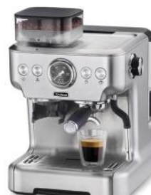
ESPRESSOMASCHINE BARISTA PLUS, SILBER