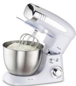
KÜCHENMASCHINE MIX CHEF