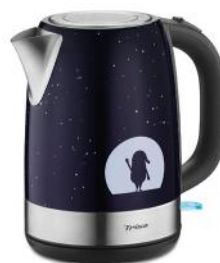
WASSERKOCHER X-MAS NIGHTS