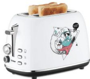
TOASTER STREET ART