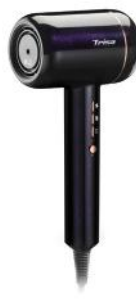
HAARTROCKNER ULTRA IONIC PRO