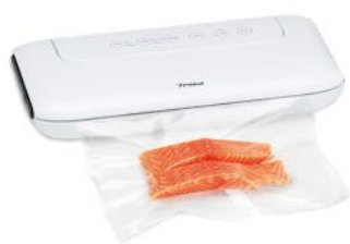
VAKUUMIERGERÄT VAC & SEAL