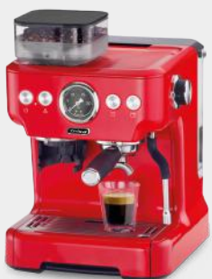
ESPRESSOMASCHINE BARISTA PLUS