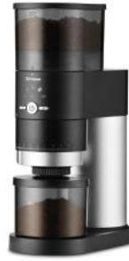
KAFFEEMÜHLE PERFECT COFFEE GRINDER