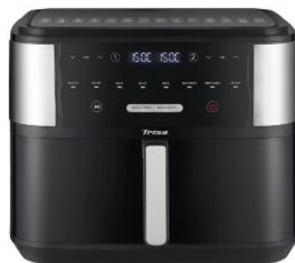
HEISSLUFTFRITTEUSE CRUNCHY FRY PRO