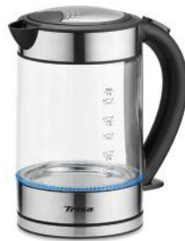
WASSERKOCHER COMPACT BOIL 1.7L W5669