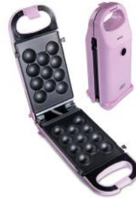
SNACK MAKER RETRO LINE, ROSA