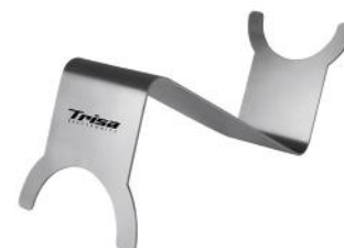
HALTER FÜR RACLETTE PFÄNNCHEN, 4 STK.