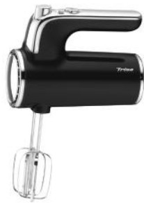
HANDMIXER DINERS EDITION SCHWARZ