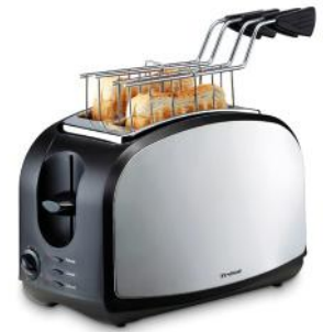
TOASTER CRISPY SNACK