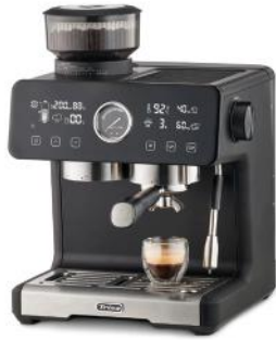
ESPRESSOMASCHINE SMART BARISTA