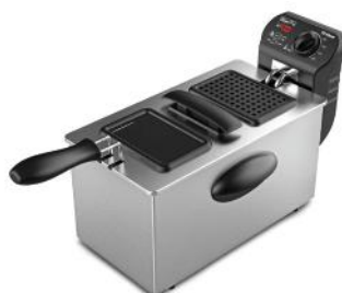
FRITEUSE CRISPY FRY