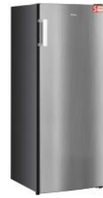
GEFRIERSCHRANK 161 L, EDELSTAHL