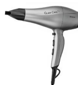
HAARTROCKNER GLAM CARE