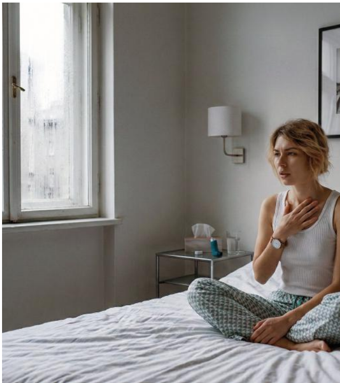
RAUM MIT ZU HOHER LUFTFEUCHTIGKEIT

und die Raumluft belasten. Auch ein muffiger Geruch ist häufig ein erstes Anzeichen. Luftentfeuchter helfen, die Feuchtigkeit gezielt zu regulieren und ein ausgeglichenes Raumklima zu schaffen. Sie entziehen der Luft überschüssige Feuchtigkeit und tragen dazu bei, Räume trocken, hygienisch und langfristig geschützt zu halten.