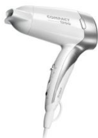
REISEHAARTROCKNER COMPACT 1200