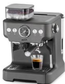
ESPRESSOMASCHINE BARISTA PLUS, ANTHRACIT