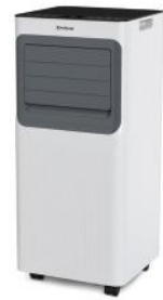
KLIMAGERÄT COOL MATE X79 MAX