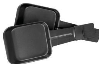
RACLETTEPFÄNNCHEN 2ER SET