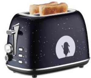
TOASTER X-MAS NIGHTS