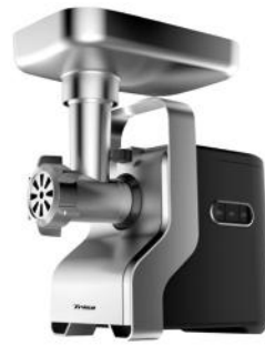
FLEISCHWOLF VARIO GRINDER