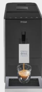
KAFFEEVOLLAUTOMAT CREMA ONE TOUCH