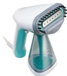
DAMPFBÜRSTE FRESH UP