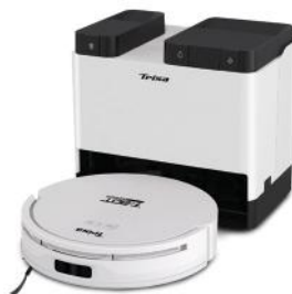
ROBOTERSTAUBSAUGER T-BOT PLUS 5000