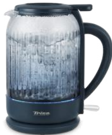
WASSERKOCHER SILENT BOIL 1.5L BLAU