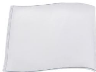
VAKUUMIERBEUTEL 50 STK. 20X30CM