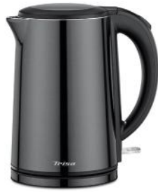
WASSERKOCHER COMFORT TOUCH