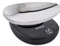
DIGITALE KÜCHENWAAGE FLAVOUR SCALE