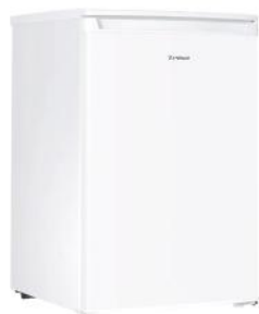
KÜHLSCHRANK 126 L