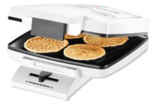
BRETZELEISEN BRICELET CLASSIQUE