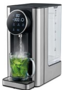
HEISSWASSERSPENDER SILVER STREAM