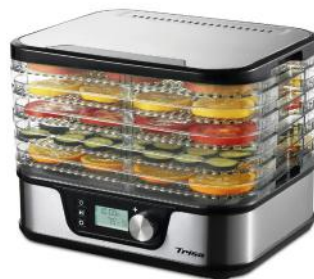
DÖRRGERÄT HEALTHY SNACK