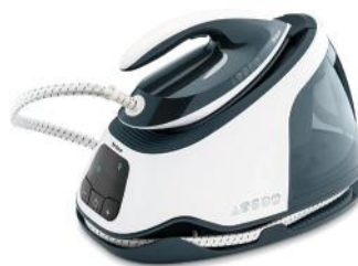
DAMPFSTATION PERFECT STEAM 165 PRO