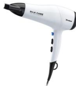
HAARTROCKNER SILK CARE