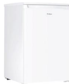
KOMBI KÜHLSCHRANK 109 L