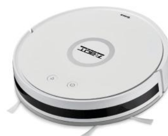
ROBOTERSTAUBSAUGER T-BOT LITE