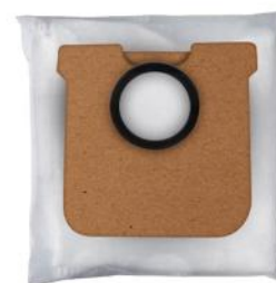
STAUBBEUTEL 1.5 L ZU 9525, 3 STK.