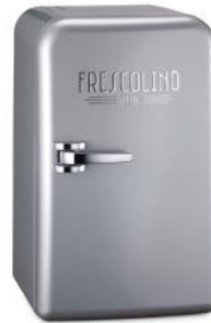
MOBILE KÜHLBOX FRESCOLINO PLUS, 12V SILBER