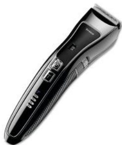
HAARSCHNEIDER TURBO CUT