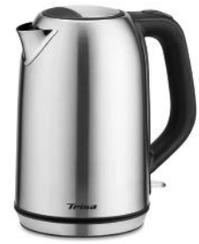
WASSERKOCHER COMPACT BOIL 1.7L W5575