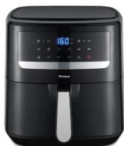
HEISSLUFTFRITTEUSE CRUNCHY FRY