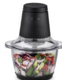
HÄCKSLER CHOP NOIR