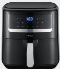
HEISSLUFTFRITEUSSE CRUNCHY FRY