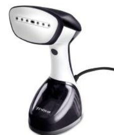
DAMPFBÜRSTE SILKY STEAM