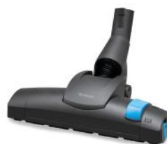
UNIVERSAL BODENDÜSE 35MM