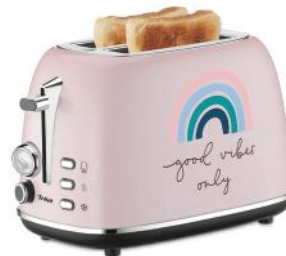
TOASTER GOOD VIBES