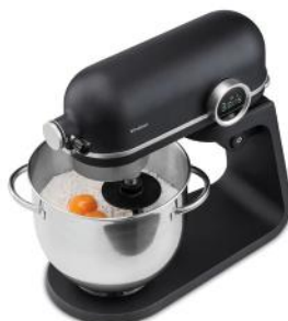
KÜCHENMASCHINE KITCHEN PROFESSIONAL