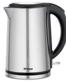
WASSERKOCHER COMFORT TOUCH