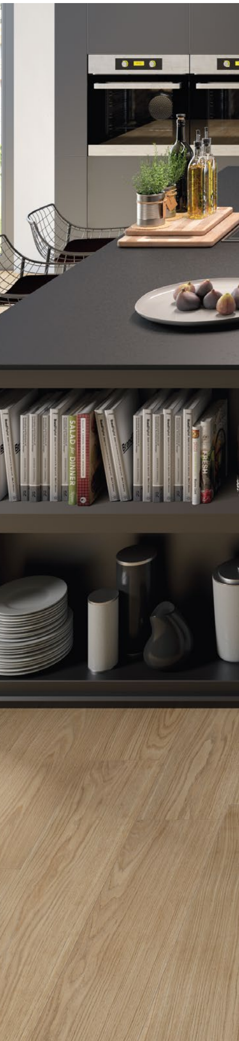
Dorato. 20X120 - 7 7 / 8 "x47 1 / 4 "