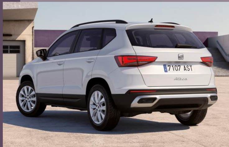
LED Scheinwerfer und Heckleuchten