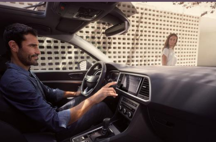
SEAT Media System 8,25''