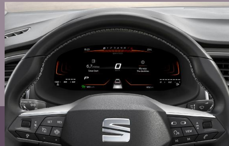
Sport Multifunktionslenkrad in Leder und 8.0" Digital Cockpit