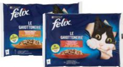
FELIX LE GHIOTTONERIE VARI GUSTI 85 G X 4