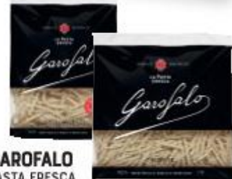
GAROFALO PASTA FRESCA CALAMARATA/ PACCHERI/ SCIALATIELLI/ TROFIE - 400 G