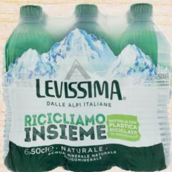
LEVISSIMA ACQUA MINERALE NATURALE 50 CL X 6