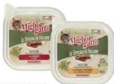
MIGLIOR GATTO PATE MANZO/POLLO E TACCHINO/SUINO PATATE E PISELLI - 100 G