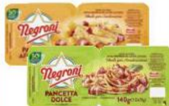
NEGRONI PANCETTA A CUBETTI DOLCE/AFFUMICATA 70 G X 2