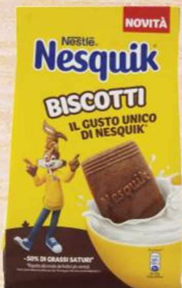
NESTLÉ NESQUIK BISCOTTI 300 G