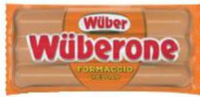
WUBER WUBERONE WURSTEL CON CHEDDAR 250 G