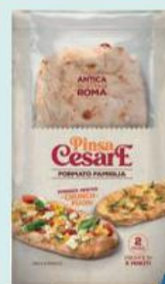
CESARE PINSIA ROMANA FRESCA 250 G X 2