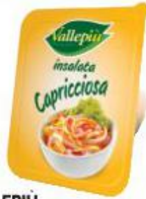
VALLEPIÙ INSALATA CAPRICCIOSA 200 G