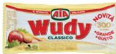
WUDY WURSTEL CLASSICO 300 G