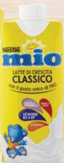
NESTLÉ MIO LATTE CLASSICO/ CON BISCOTTO 50 CL