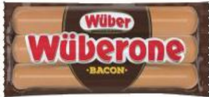
WUBER WUBERONE WURSTEL CON BACON 250 G