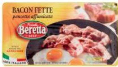
BERETTA BACON A FETTE 100 G