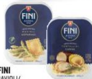
FINI RAVIOLI/ TORTELLINI/ TORTELLONI VARI GUSTI 250 G