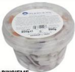
MARINSIEME COCKTAIL MARE COTTO AL NATURALE 500 G