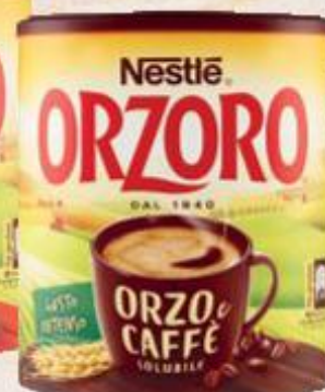
NESTLÉ ORZORO SOLUBILE ORZO E CACAO/ ORZO E CAFFÈ 180/120 G