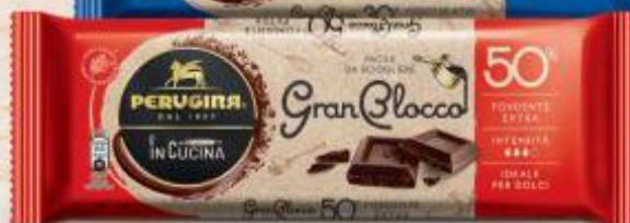
PERUGINA GRAN BLOCCO DI CIOCCOLATO LATTE 30%/FONDENTE 50% - 70% 150 G