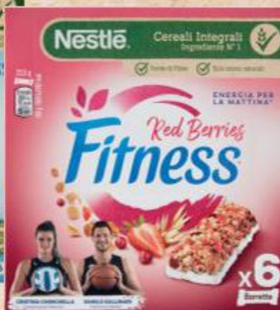
NESTLÉ FITNESS BARRETTE VARI GUSTI 6 PEZZI