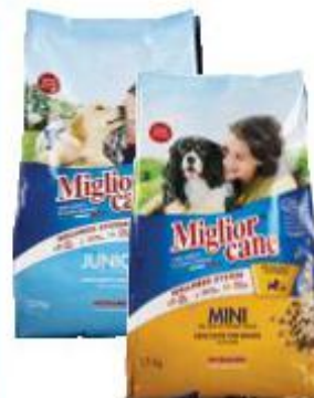
MIGLIOR CANE CROCCHETTE CANE MINI MANZO/ JUNIOR POLLO 1,5 KG