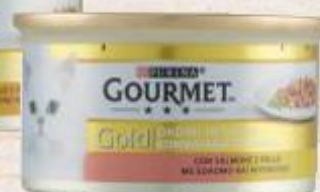
PURINA GOURMET GOLD VARI TIPI E GUSTI 85 G