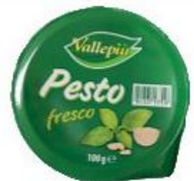
VALLEPIÙ PESTO ALLA GENOVESE 100 G