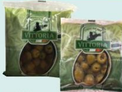
VELLECA OLIVE DENOCCIATE NERE/VERDI BUSTA - 200 G