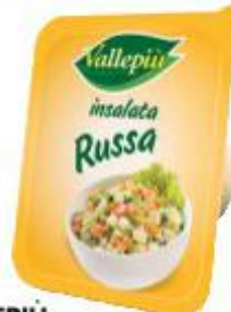
VALLEPIÙ INSALATA RUSSA 200 G