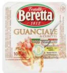
BERETTA GUANCIALE A CUBETTI 100 G