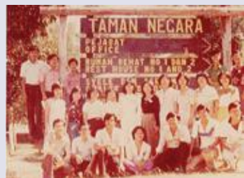
▼个人布道训练营（1979年）

1969年至1975年中，开始有本地传道人受聘，从外坡来到而连突牧会。当中，有的是从内地会创办的基督徒训练中心毕业。