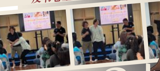
▲学员示范大力士参孙。