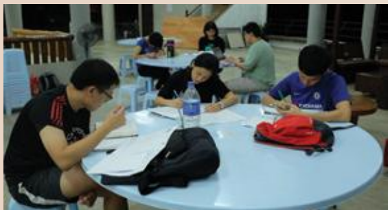
▲ 营会晚上，大家自发温习所学。

这需要大量查考经文，有时也需要与弟兄姐妹彼此讨论，得出经文的核心教导。在“新一代培训”四天三夜的营会，弟兄姐妹有机会一起学习，并聆听讲员释经讲道，同时学习如何自己预备查经教材。