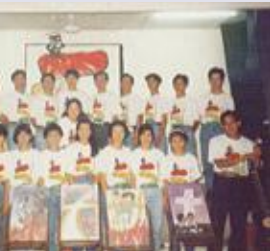
▼ 献堂礼 (2003年)