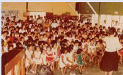
▼ 青主日学庆生会（1989年）