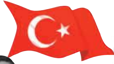
Şüpheli bir uçak kazasında şehit düşen Jandarma Genel Komutanı

Orgeneral Eşref Bitlis 1933 - 17 Şubat 1993