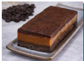
Torta de Manteiga Escocesa