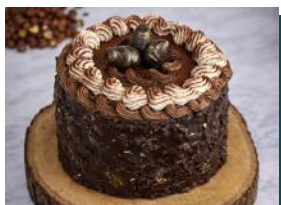
Torta de Páscoa de Avelã e Leite em Pó