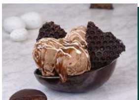
Gelato Pão de Mel Caseiro