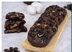
Cookies de Chocolate Recheados