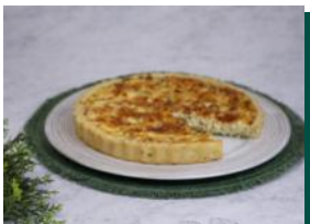
Quiche de Bacalhau