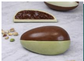
Ovo em Fatias