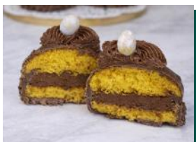
Mini Bolo de Cenoura e Avelã