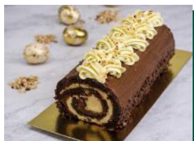
Rocambole de Brownie, Leite em Pó e Avelã