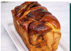
Babka de Gran Nocciola