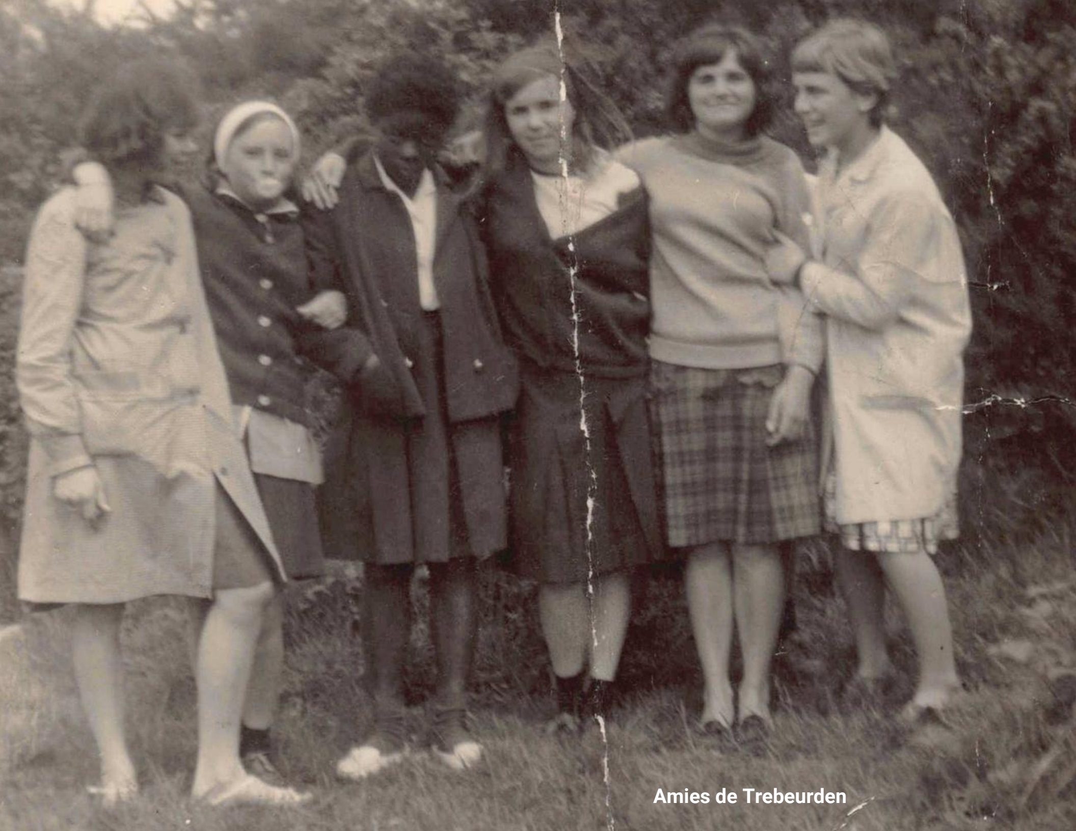
Amies de Treburden