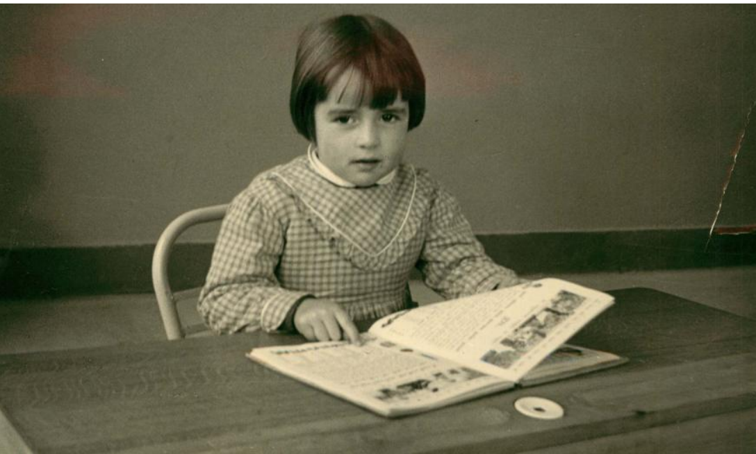
Ecole Notre-Dame de Lourdes, Pont-du-Cens, à Nantes.