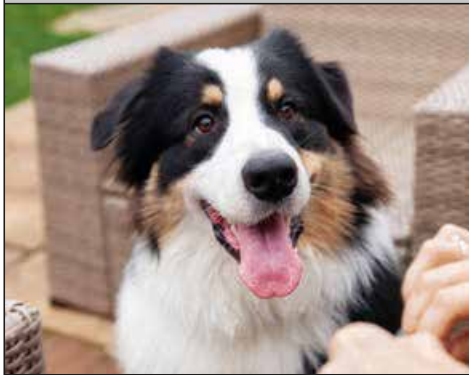
Paseo con mi perro...

PIPI CACA LIMPIAR RECOGER BOTELLA BOLSAS