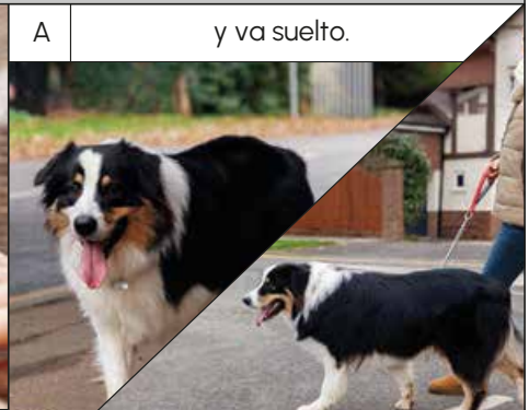
atado con correa.