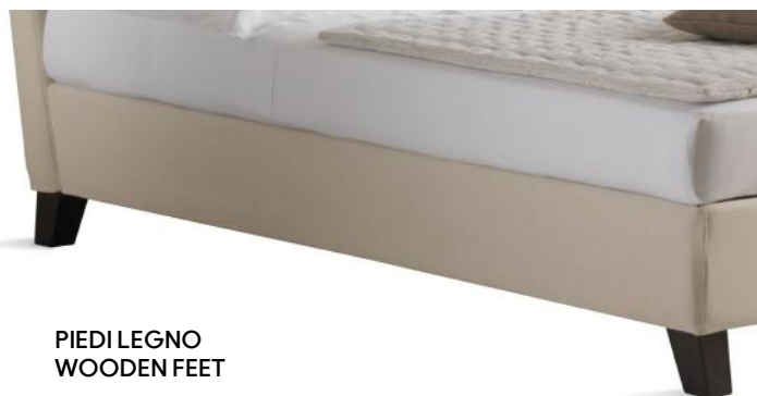
PIEDI LEGNO WOODEN FEET

Indique los pies elegidos en el momento de la compra.