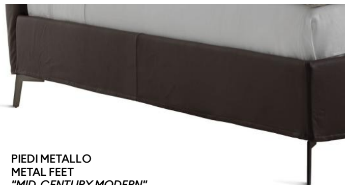
PIEDI METALLO METAL FEET "MID-CENTURY MODERN"