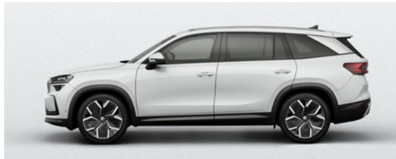
Metallic Moon Weiss