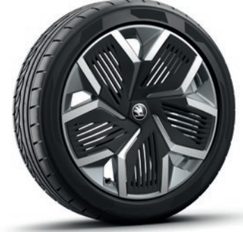
Leichtmetallrädern 8,0J x 20" «Rila», Anthrazit mit polierter Oberfläche und Aero Blende