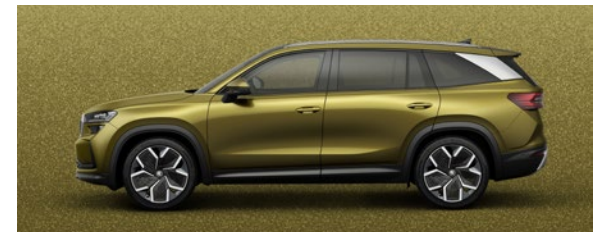
Metallic Bronze Gold