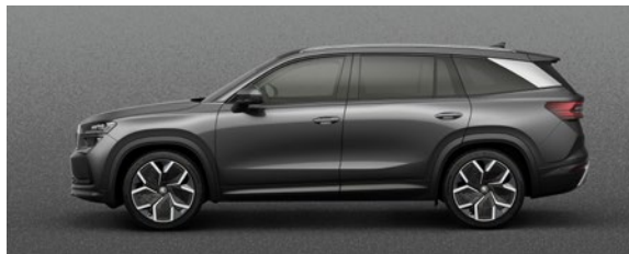
Uni Steel Grau