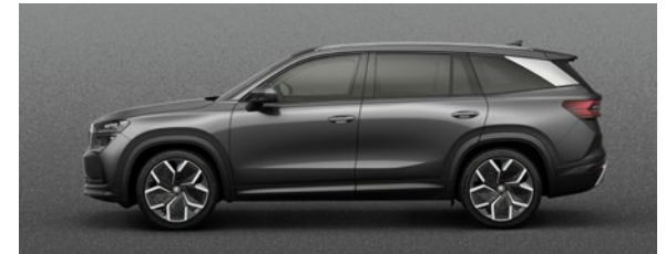
Metallic Graphite Grau