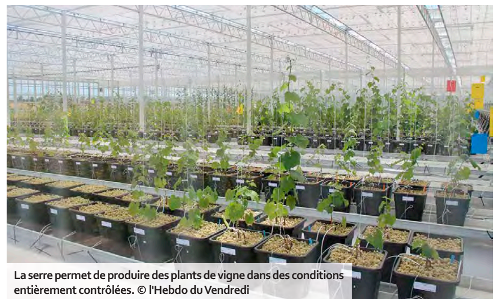
La serre permet de produire des plants de vigne dans des conditions entièrement contrôlées.