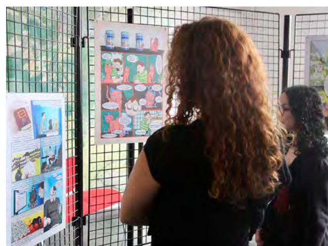
Chaque planche a été conçue avec la participation de jeunes de la Mission locale d'Épernay.

La bande dessinée se distingue par son ton à la fois ludique et sérieux, facilitant l'échange entre élèves, enseignants, infirmiers scolaires et professionnels de l'addictologie. À la fin de l'ouvrage, deux flash codes permettent d'accéder à des ressources complémentaires : l'un destiné aux élèves, dévoilant les coulisses de la création, l'autre pour les adultes, proposant une analyse détaillée de chaque planche et des pistes pédagogiques à exploiter en classe.