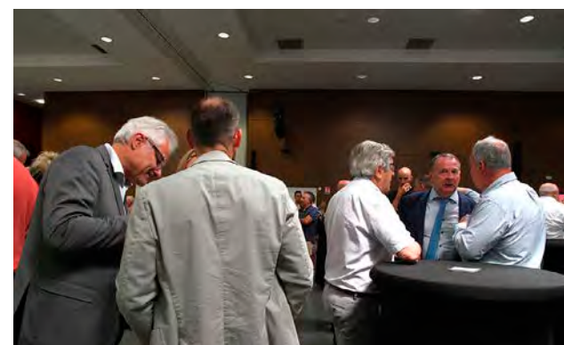
Le commissaire de la Foire de Châlons réunit les forces vives du territoire à l'occasion des solstices de l'UCIA.