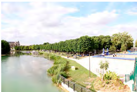
L'opération Châlons plage revient ce samedi au grand Jard.

Tous les ans, le mini-village Châlons plage organisé par la mairie apporte son lot d'animations et comme un air de vacances au grand Jard. Cette 17 e édition promet encore de ravir les petits et les grands, qu'on soit fan de sensations fortes, plutôt branché ateliers créatifs et lecture, ou adepte du farniente et des apéros partagés. La minibase nautique, déjà présente, propose des sessions de pédalo, canoé, paddle, kayak et water-roller (les fameuses boules gonflables sur l'eau) moyennant un budget de 3 à 9€ les 15 minutes.