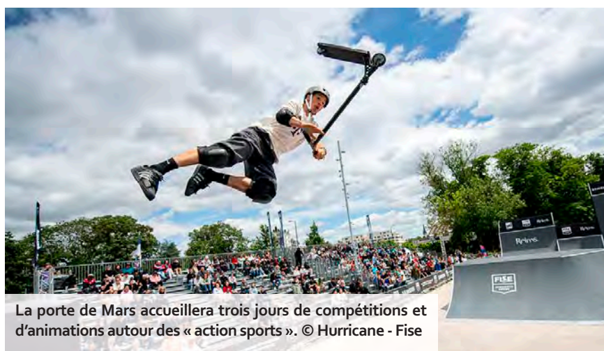
La porte de Mars accueillera trois jours de compétitions et d'animations autour des « action sports ».

C'est l'un des grands événements qui lancent l'été à Reims et cela fait treize ans que cela dure. La tournée du Festival international des sports extrêmes (Fise Xperience Series) s'installe du vendredi 27 au dimanche 29 juin, sur l'esplanade de la porte de Mars pour trois jours de compétitions autour du BMX, de la trottinette et du parkour (course libre d'obstacles), discipline introduite l'an passé dans la cité des sacres. Du très haut niveau en perspective, notamment en BMX, puisque la compétition comptera pour la Coupe de France de Freestyle Park. Pour la première fois, des sessions nocturnes prolongeront la journée, avec des contests pros organisés le vendredi, de 21 h à 22 h 30 pour la trottinette et le samedi, de 21 h 15 à 22 h 45 pour le BMX. Ce rendez-vous dédié aux « action sports »,