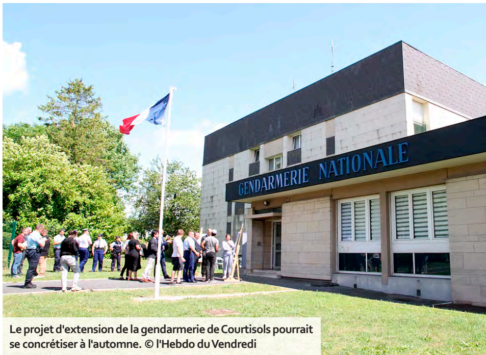
Le projet d'extension de la gendarmerie de Courtisols pourrait se concrétiser à l'automne.

C'est un chantier express qui se profile à la gendarmerie de Courtisols. Grâce à la construction modulaire, une extension adossée au bâtiment historique permettra d'améliorer l'accueil des usagers.