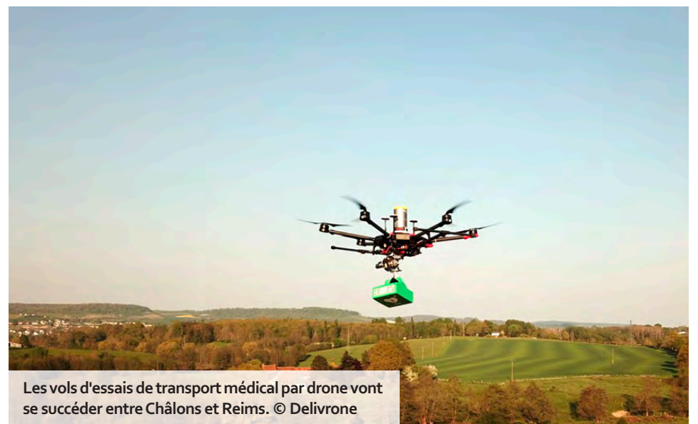
Les vols d'essais de transport médical par drone vont se succéder entre Châlons et Reims.