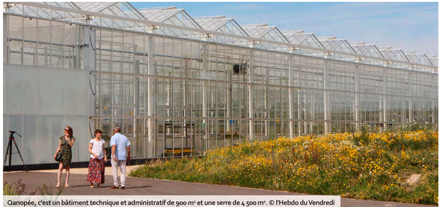
Qanopée, c'est un bâtiment technique et administratif de 900 m 2 et une serre de 4 500 m 2 .

Derrière Qanopée, une serre bioclimatique de 4 500 m 2 , se cache une mobilisation sans précédent entre différents territoires et collectivités, dont les régions viticoles de Champagne, Bourgogne et Beaujolais. L'objectif : sécuriser la production de matériel végétal sain et résistant, en prémultipliant différents cépages dans des conditions entièrement contrôlées. Cette unité de production, dite « insect-proof », protège les plants de vigne des virus et maladies grâce à des filets