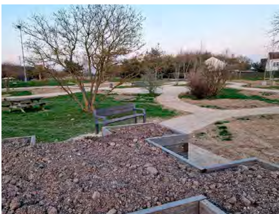
Le square rénové et son jardin thérapeutique seront inaugurés le 3 juillet.