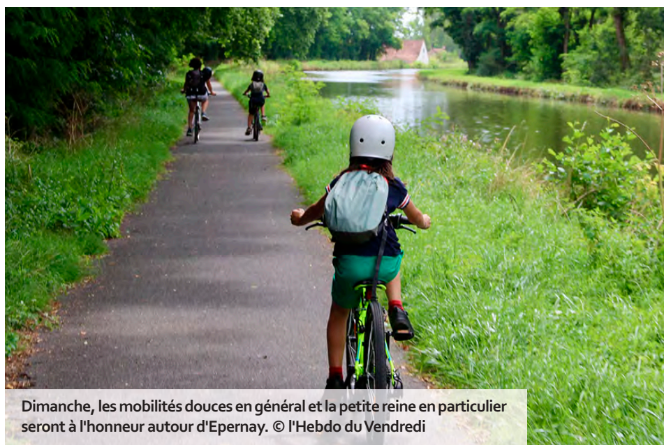
Dimanche, les mobilités douces en général et la petite reine en particulier seront à l'honneur autour d'Epernay.

Grande fête populaire et familiale, la manifestation vise à promouvoir le territoire et ses richesses, tout en invitant petits et grands à redécouvrir la vallée de la Marne et la Montagne de Reims, chacun à son rythme, grâce aux mobilités douces. Pour l'occasion, 16 kilomètres de routes, s'étendant de Tincourt à Châtillon-sur-Marne, seront exceptionnellement fermés à la circulation automobile, offrant un terrain de jeu unique aux adeptes de vélos, trottinettes (non motorisées), rollers ou marche à pied. Deux circuits sont proposés : une boucle famille de 9 km (110 m de dénivelé positif) et une boucle loisirs de 16 km (206 m de dénivelé positif). Ici, pas de départ ni d'arrivée imposés : chacun rejoint le parcours où il le souhaite, pour une balade en toute liberté, dans le sens inverse des aiguilles