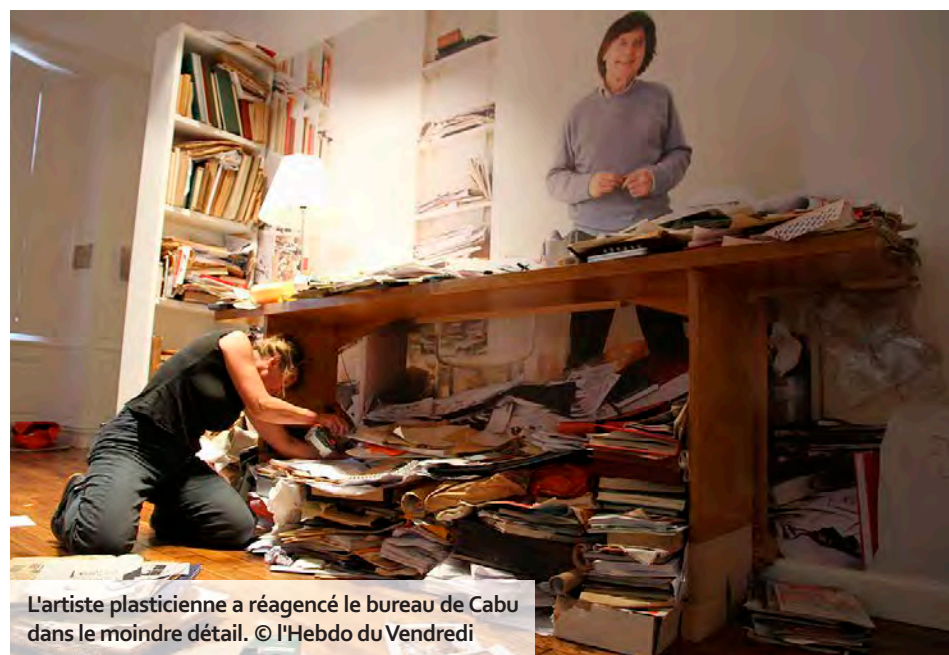
L'artiste plasticienne a réagencé le bureau de Cabu dans le moindre détail.

Un millier d'objets, dont beaucoup ont appartenu à Cabu