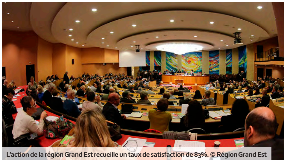
L'action de la région Grand Est recueille un taux de satisfaction de 83%.

À l'approche du dixième anniversaire de la création de la région, cette étude, menée du 21 au 27 mai, a été réalisée par l'institut OpinionWay auprès d'un échantillon représentatif de la population, rassemblant 2 038 habitants. Premier enseignement : l'attachement au Grand Est est solide. 92 % des personnes interrogées se déclarent satisfaites de vivre dans la région, dont un tiers « très satisfaites ». Ce taux progresse de deux points par rapport à l'enquête réalisée il y a cinq ans. Les jeunes (moins de 35 ans) se montrent particulièrement enthousiastes, 76 % d'entre eux percevant la région « comme en expansion ou en développement ». L'optimisme sur l'avenir est également au rendez-vous, avec 74 % des habitants qui voient l'avenir du Grand Est sous un jour favorable. Les femmes et les habitants des grandes villes se montrent même un peu plus optimistes que la moyenne. Les habitants identifient clairement les forces du territoire : sa position stratégique au cœur de l'Europe (69 %), son