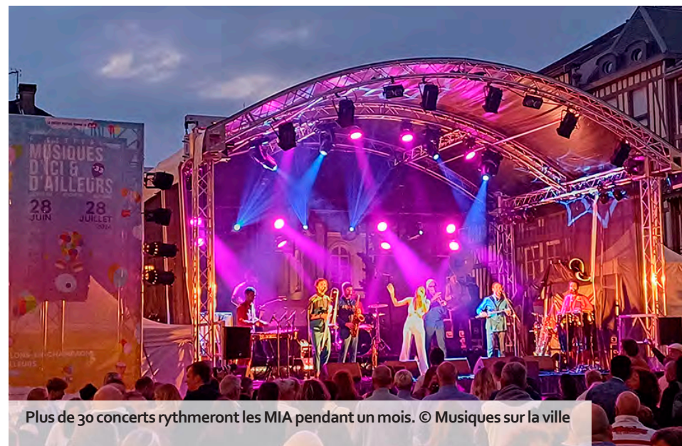
Plus de 30 concerts rythmeront les MIA pendant un mois.

✓ 34 e festival des MIA, jusqu'au 27 juillet, Châlons, Saint-Memmie, Saint-Martin-sur-le-Pré, Vitry-le-François et Sainte-Ménéhould. Accès libre. Programme complet : musiques-ici-ailleurs.com .