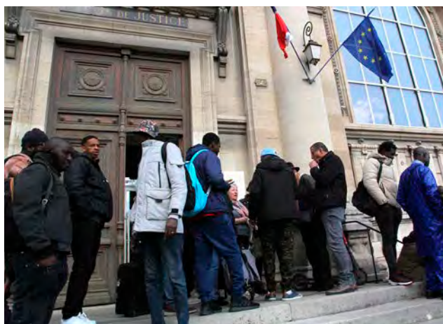
Près de 60 saisonniers clandestins ont déposé plainte suite aux vendanges de 2023.

À l'aune de douze heures d'audience, le substitut a requis quatre ans de prison, dont deux ferme, et 300 000 € d'amende contre la gérante de la société de prestations viticoles Avanim, ainsi que trois ans de prison, dont un ferme, et 10 000 € d'amende contre deux hommes accusés d'avoir recruté les vendangeurs. Le patron de l'exploitation viticole basée à Mareuil-le-Port, qui a fait appel à Avanim, a déclaré aux médias ne pas se sentir concerné par l'affaire. Le parquet requiert 200 000 € d'amende contre sa société, la SARL Cerseuillat de la Gravelle. Le jugement a été mis en délibéré au lundi 21 juillet à 14 h.