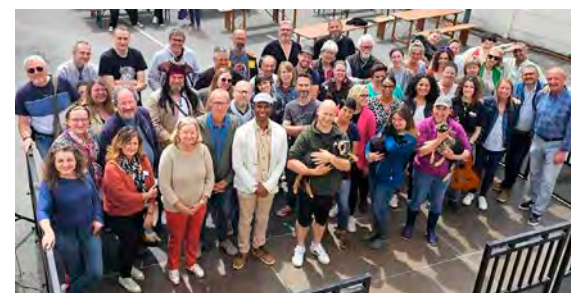
La joyeuse bande d'artistes et d'artisans remet ça !

Les mascottes de ce rendez-vous restent évidemment les chèvres miniatures et mauresques élevées à Somme-Vesle. Elles feront cette année encore le déplacement, mais uniquement le samedi.