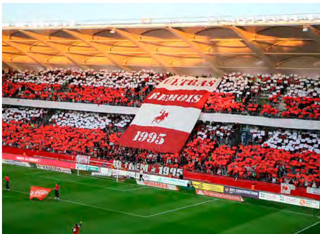
Le stade Auguste-Delaune aura-t-il droit à des rencontres de Ligue 1 ou de Ligue 2 la saison prochaine ?