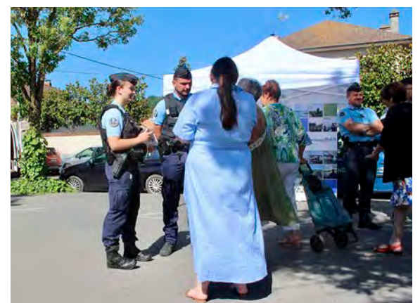
Les gendarmes ont aussi rappelé les bonnes pratiques pour limiter les risques de cambriolage.

Gratuit et facile à mettre en place, ce service repose sur la proximité entre les forces de l'ordre, les habitants et les élus locaux. Il suffit de signaler son absence à la gendarmerie ou en ligne pour bénéficier du dispositif, actif toute l'année, même si l'été reste la période la plus sensible. Dans la Marne, 257 logements ont déjà été inscrits depuis janvier, pour des absences de quelques jours à plusieurs mois. D'ici à la fin de l'année, plus de 500 foyers marnais devraient profiter de cette protection supplémentaire.