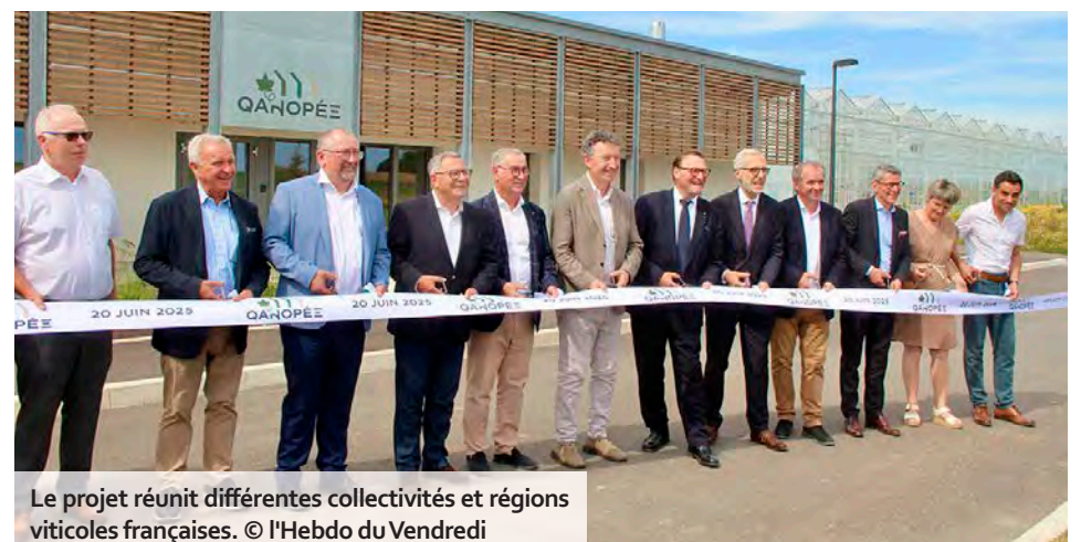
Le projet réunit différentes collectivités et régions viticoles françaises.