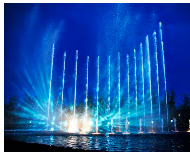
Les créations spectaculaires d'Aquatique Show (en photo, à Mulhouse) s'installeront à Châlons le 4 juillet.

Plusieurs mappings ont été conçus par des sociétés spécialisées au fil des années et un nouvel opus sera dévoilé pour l'occasion (à 23 h). « Il sera projeté sur le pont des Mariniers, indique Laurence Padiou, directrice de l'office, en veillant à préserver la surprise pour les passagers. Il dure six minutes et se compose de plusieurs séquences féeriques, très rythmées, en clin d'œil à l'histoire de Châlons, ses illustres personnages et son patrimoine. » Petit avant-goût du spectacle : il se déploiera sur les arches du pont et donnera à contempler des jeux de reflets sur l'eau. Autre rendez-vous de cette soirée anniversaire : un show aquatique de 20 minutes – joué à 22 h 30 et 23 h 30 – que le public pourra découvrir depuis le quai Eugène-Perrier. « C'est une proposition inédite et exclusive, souligne Isabelle Gréaud, responsable du développement touristique à l'agglomération. Le canal du Mau sera illuminé sur environ 40 mètres, avec des jets d'eau synchronisés pouvant aller jusqu'à 20 mètres de haut, des jeux immersifs, une mise en scène et une bande sonore sur-mesure, etc. » Effet « wahou » garanti !