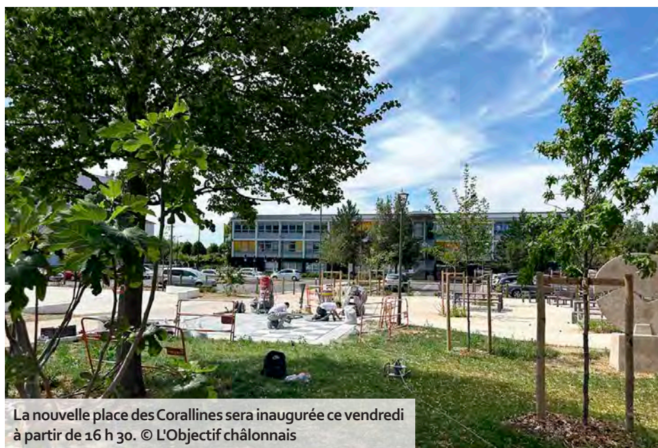
La nouvelle place des Corallines sera inaugurée ce vendredi à partir de 16 h 30.

total. L'enjeu de cette requalification : désenclaver l'îlot des Corallines et l'ouvrir sur l'ensemble du quartier. Les travaux ont aussi concerné l'axe reliant la rue des Bourgs au parc Bellevue, désormais en zone 30 pour apaiser la circulation, ainsi que le parking du pôle Dunant, avec un accès piéton donnant sur la