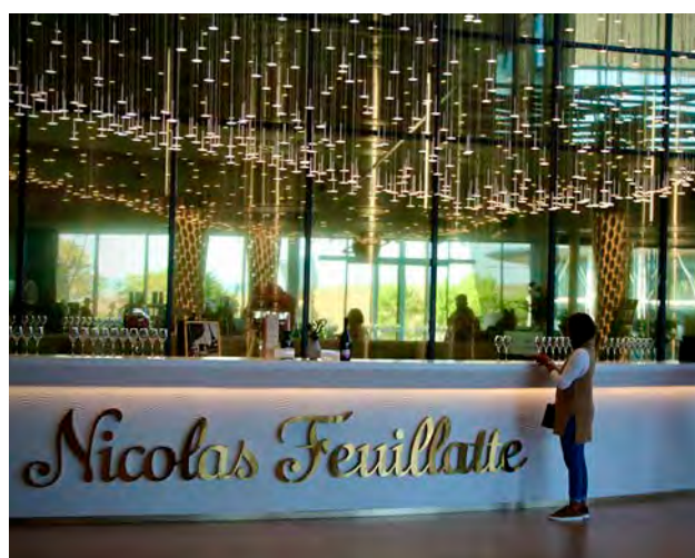
Le groupe Terroirs & Vignerons de Champagne (TEVC) détient quatre marques dont Nicolas Feuillatte.

Les performances des maisons du groupe sont notables. Champagne Nicolas Feuillatte, leader en grande distribution en France, voit son chiffre d'affaires progresser de 5% et consolide ses positions à l'international, particulièrement au Royaume-Uni, aux États-Unis, au Canada et en Europe. Champagne Castelnau poursuit sa relance avec une croissance de 3,1% et de nouveaux contrats de distribution en Amérique du Nord. Abelé 1757 progresse de 7% et développe ses ventes à l'export. Enfin, Champagne Henriot maintient un chiffre d'affaires stable, porté notamment par le lancement de deux cuvées d'exception.