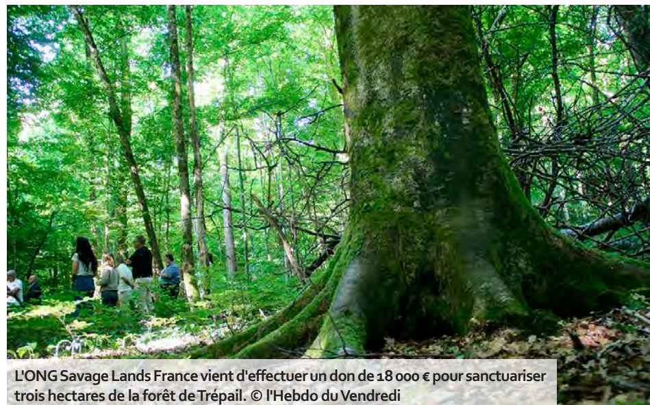
L'ONG Savage Lands France vient d'effectuer un don de 18 000 € pour sanctuariser trois hectares de la forêt de Trépail.

Une nouvelle étape dans la préservation de la biodiversité forestière du Grand Est a été franchie vendredi 20 juin. La région, le Parc naturel régional de la Montagne de Reims et la Fondation du patrimoine ont lancé la deuxième campagne de mécénat pour la création d'îlots forestiers en libre évolution, lors d'une visite en forêt de Trépail. Cette initiative s'inscrit dans le cadre du programme européen Life Biodiv'Est, débuté en août 2023, et vise à protéger durablement des écosystèmes forestiers grâce à une collaboration entre acteurs publics et privés. Au cœur de ce dispositif : les Obligations réelles environnementales (ORE), un outil juridique garantissant la protection d'îlots forestiers de 1 à 10 hectares pour au moins 70 ans, sans aucune intervention sylvicole. Ces micro-réerves natu-