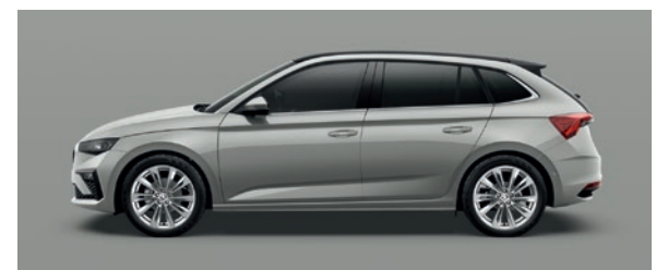
Uni Steel Grau