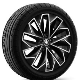
Leichtmetallrädern 6,5J x 17" «Propus Aero», schwarz