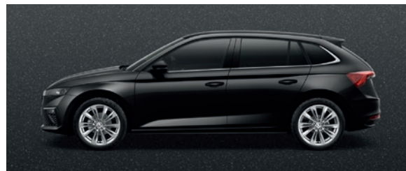
Perleffekt Schwarz Magic