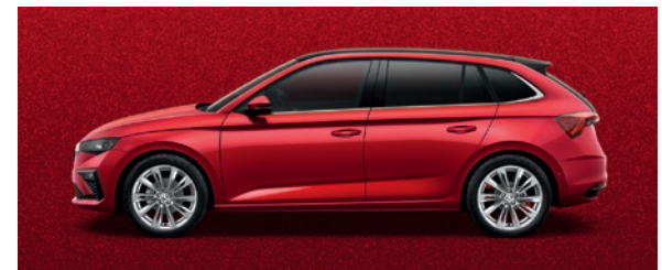
Metallic Velvet Rot

Die Preise verstehen sich in CHF inkl. 8.1% MwSt. Einige der oben aufgeführten Mehrausstattungen können nur in Verbindung mit zusätzlichen Mehrausstattungen bestellt werden. Die dargestellten Farben können von den tatsächlichen Farben und Lackbeschaffenheiten abweichen. Zudem sind nicht alle aufgeführten Mehrausstattungen miteinander kombinierbar. Für detailliertere Informationen kontaktieren Sie bitte Ihren Škoda Partner.