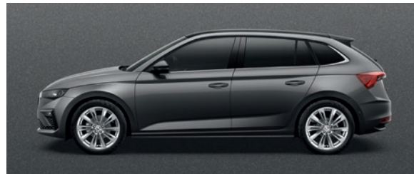
Metallic Graphite Grau