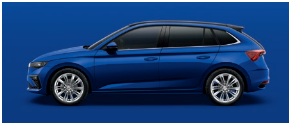
Uni Energy Blau