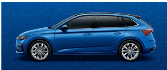
Metallic Race Blau