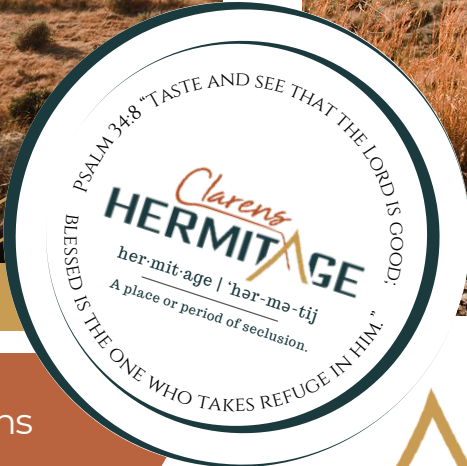
Ds Jan Venter | Leierskap Netwerk

“Clarens se weergalose stilte omvou ’n mens in die nag sodat die dag se ervarings diep gebêre word en ’n mens se siel kan rus.”