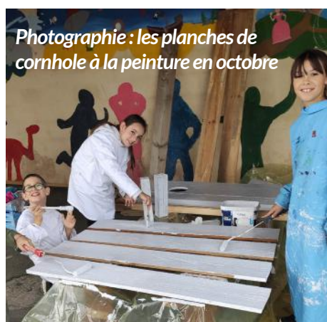
Photographie : les planches de cornhole à la peinture en octobre

Cette année, les 20 élèves (CE/CM) de l'école ont fabriqué, dès la rentrée, des cornholes (jeu de lancer et d'adresse où l'on atteindra un trou dans une planche avec un petit sac de maïs) : projet interdisciplinaire (courriers à écrire, plans à concevoir, outils à utiliser, règles du jeu à comprendre). Les parents d'élèves de l'école nous ont largement aidés en menuiserie et en couture.