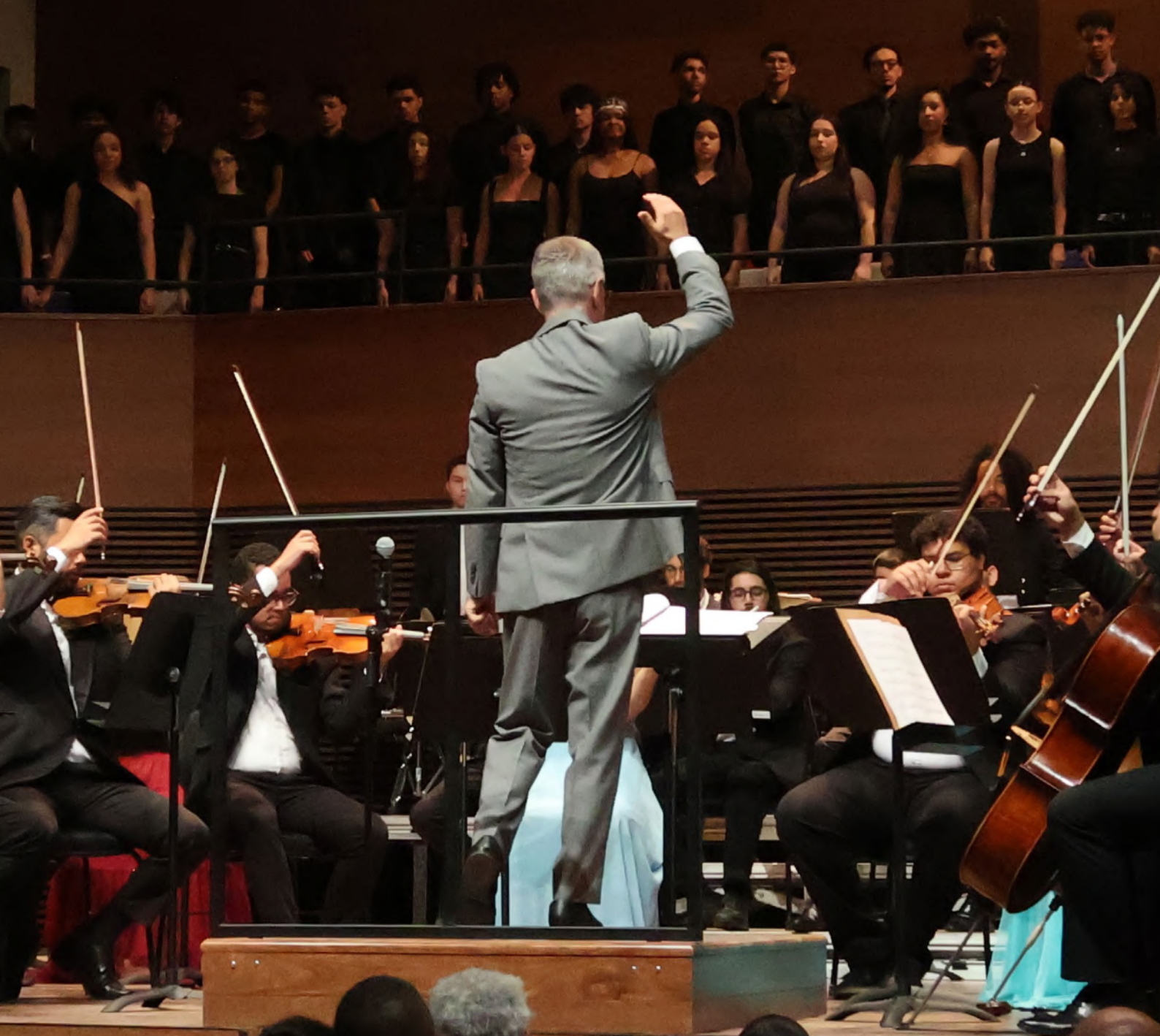
Imagem do mês

Concertos de Natal emocionam o público no encerramento de 2025 no palco do Teatro Baccarelli