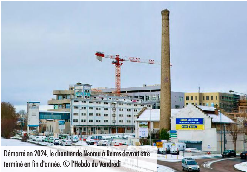
Démarré en 2024, le chantier de Neoma à Reims devrait être terminé en fin d'année.