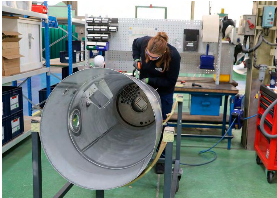
Pour la première fois depuis 2014, le nombre d'entrées en apprentissage a légèrement baissé en 2025.

France Compétences, l'institution publique qui régule et finance la formation professionnelle et l'apprentissage, prévoit ainsi 12 milliards d'euros de dépenses, soit près de 1,5 milliard de moins que l'an passé. Une baisse qui concerne particulièrement l'alternance (-687 M€ de dépenses), alors que, pour la première fois depuis 2014, le nombre d'entrées en apprentissage a légèrement reculé en 2025, ainsi que le compte personnel de formation (CPF), dont les ressources allouées diminueront de 650 M€, pour atteindre 1,32 milliard d'euros.