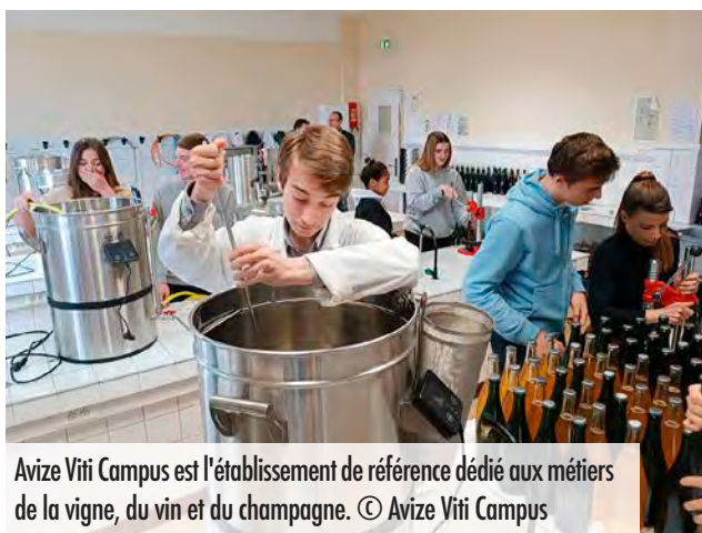
Avize Viti Campus est l'établissement de référence dédié aux métiers de la vigne, du vin et du champagne.