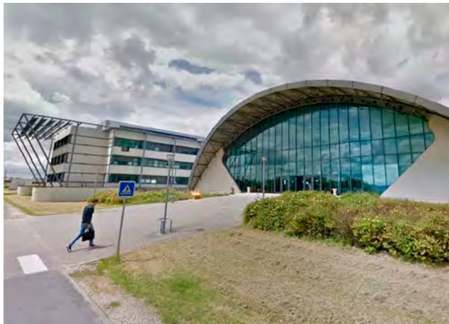
L'Université de Reims Champagne-Ardenne est la première université française à intégrer l'ICA.

Cette dynamique s'inscrit dans la continuité du projet régional EXEBIO, porté par l'URCA et ses partenaires, qui vise à faire de la bioéconomie un levier de développement local. À travers cette alliance européenne, l'université affirme une conviction forte : c'est depuis les territoires que se construisent les transitions durables, au service du bien commun et des générations futures.