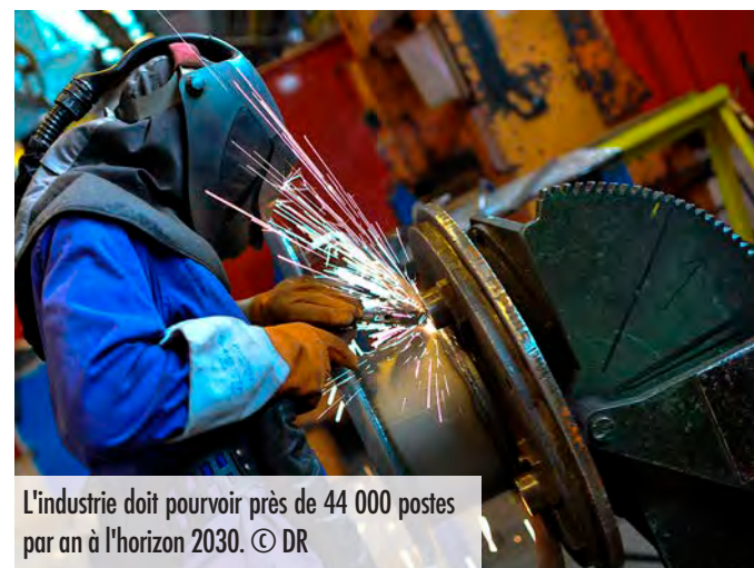
L'industrie doit pourvoir près de 44 000 postes par an à l'horizon 2030.

Mais l'avenir s'annonce exigeant : près de 44 000 postes par an seront à pourvoir d'ici 2030, selon l'observatoire des compétences industries d'OPCO 2i, principalement pour remplacer les départs en retraite et accompagner les mobilités professionnelles. Autant d'opportunités à saisir, à condition de relever le défi des compétences et de l'attractivité des métiers.