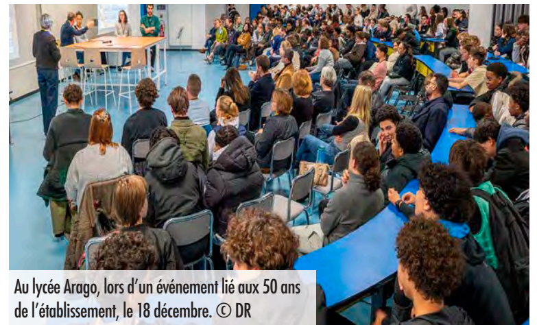
Au lycée Arago, lors d'un événement lié aux 50 ans de l'établissement, le 18 décembre.

Situé au cœur du quartier Croix-Rouge de Reims, à deux pas d'une station de tramway, le lycée François-Arago a fêté ses 50 ans d'existence en 2025. L'établissement, qui compte 30 classes et 730 élèves, met cet anniversaire à l'honneur tout au long de l'année scolaire, notamment lors de ses journées portes ouvertes organisées vendredi 6 mars, à partir de 15 h 30, et samedi 7 mars, de 9 h à 13 h. Une cérémonie officielle, en présence du maire, Arnaud Robinet, se tiendra vendredi à 16 h. Parmi les spécialités du lycée Arago figurent des bacs pro et des BTS dans les domaines du génie climatique et du BTP – formations aux métiers en plein essor liés à la transition énergétique et à la construction durable –, ainsi qu'une classe préparatoire aux écoles d'ingénieurs. L'établissement dispose de plateaux techniques modernes et de partenariats avec des entreprises locales qui permettent aux élèves de se former au plus près du terrain.