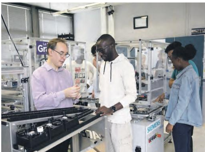
L'Eisine ouvrira à la rentrée deux nouvelles spécialités à Reims et Charleville-Mézières, accessibles à partir d'un bac +2.

Avec ces ouvertures, l'Eisine confirme son engagement en faveur du développement des compétences industrielles et de l'attractivité du territoire champardennais.