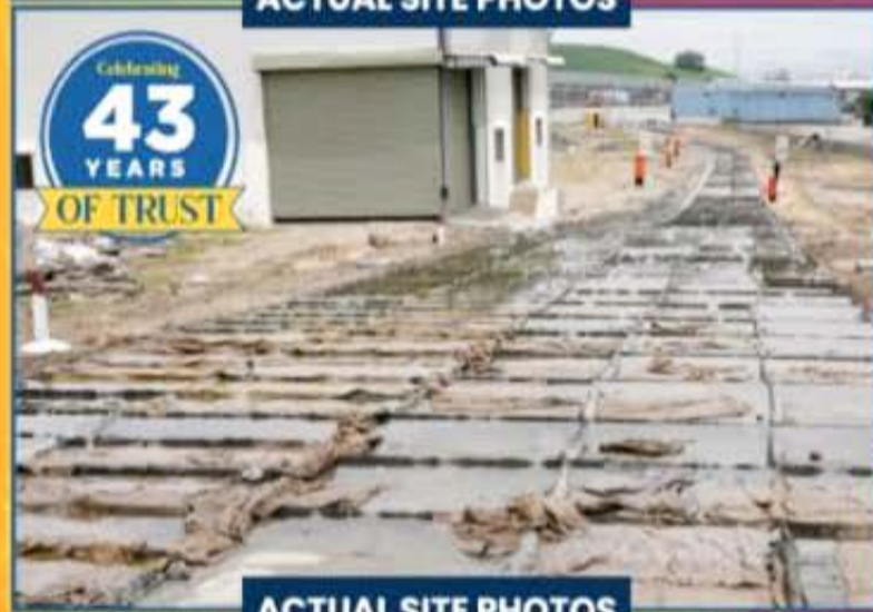
ACTUAL SITE PHOTOS