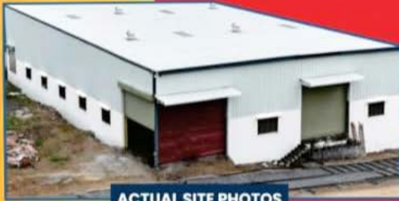
ACTUAL SITE PHOTOS

आप सभी को आनंदोत्सव / पंचकल्याणक महापूजा में आशीर्वाद देने जरूर जरूर आना है, अगले महीने!