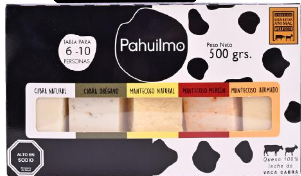
TABLA QUESO CABRA