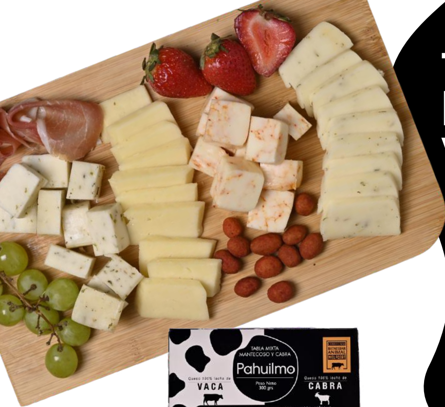
TABLA MIXTAS Vaca-Cabra