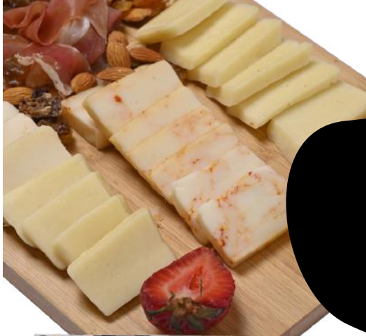
TABLA QUESO MANTECOSO