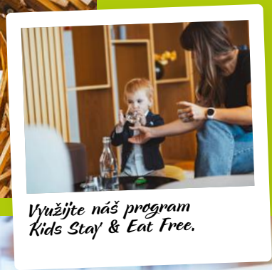
Využijte náš program Kids Stay & Eat Free.