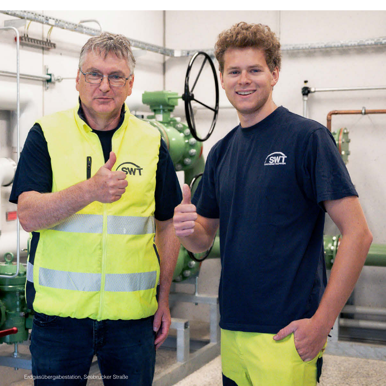
Erdgasübergabestation, Seebrucker Straße