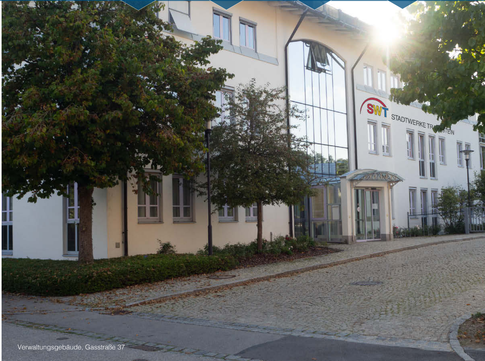
Verwaltungsgebäude, Gasstraße 37