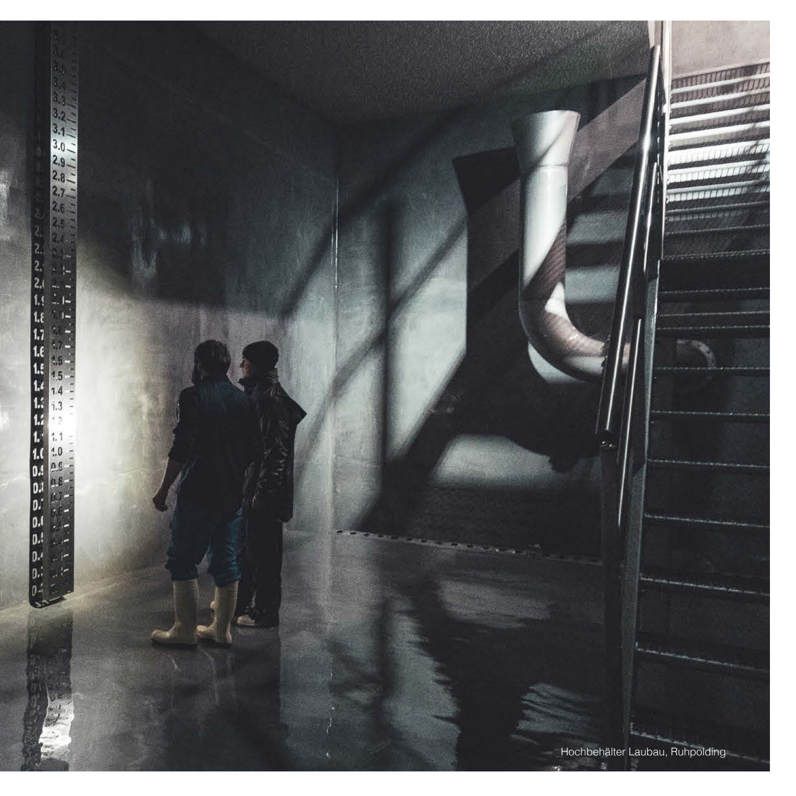
Hochbehälter Laubau, Ruhpolding