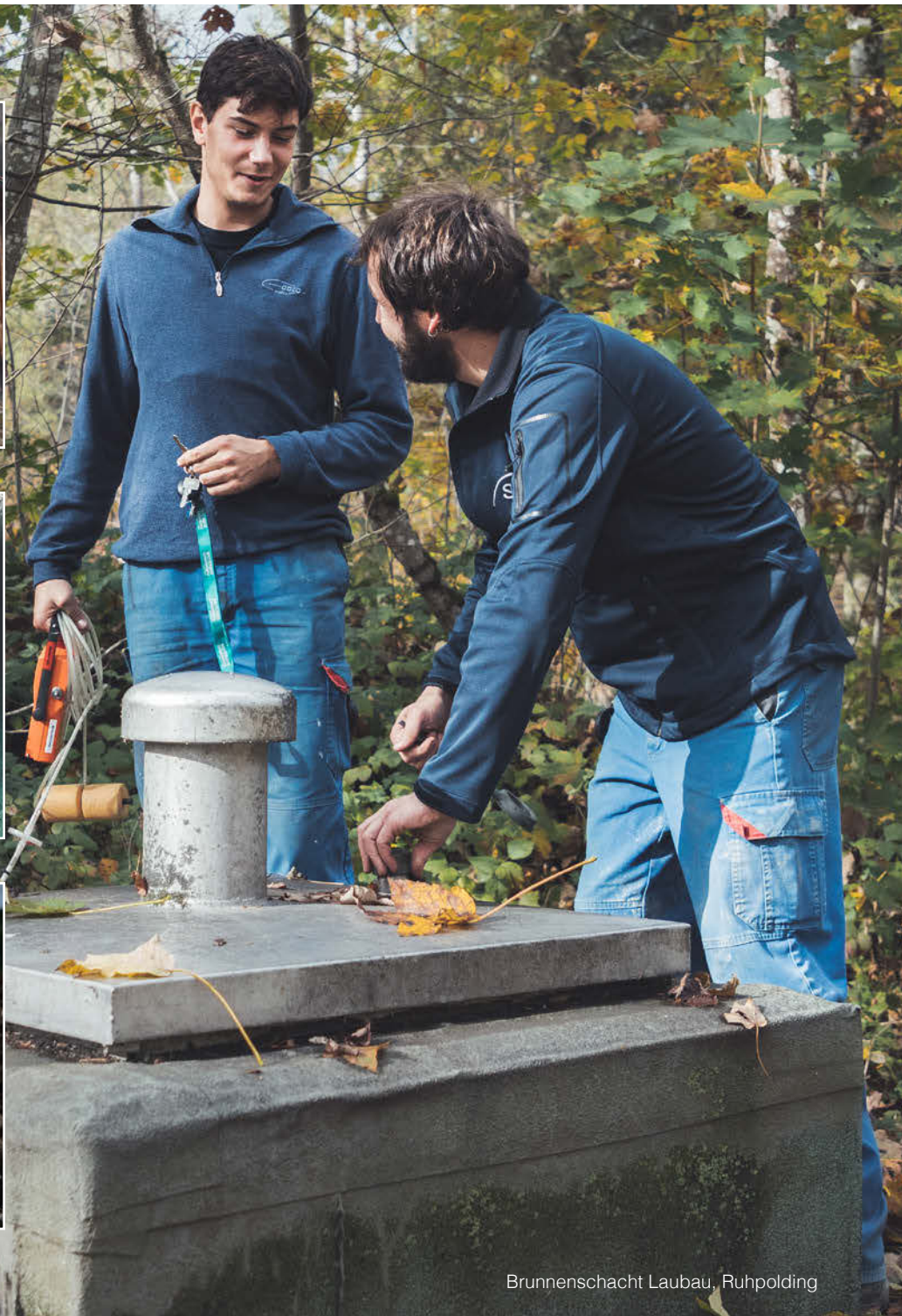
Brunnenschacht Laubau, Ruhpolding