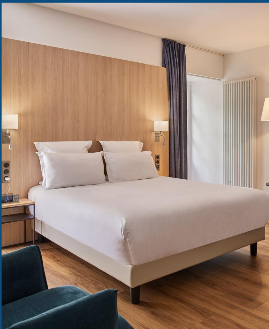
La Maison des Équipages