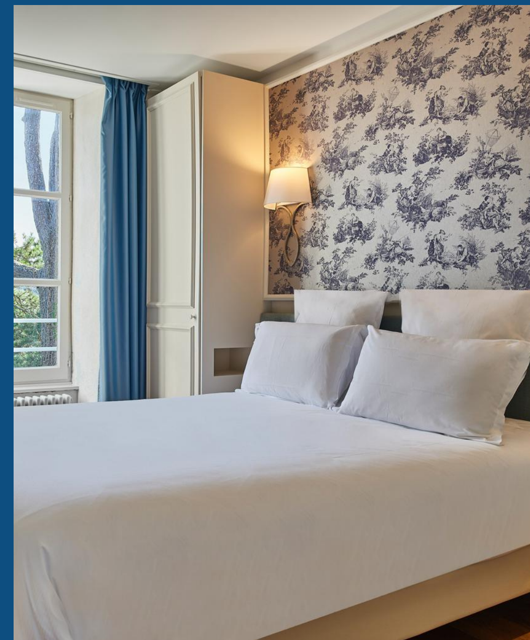
La Maison des Amiraux