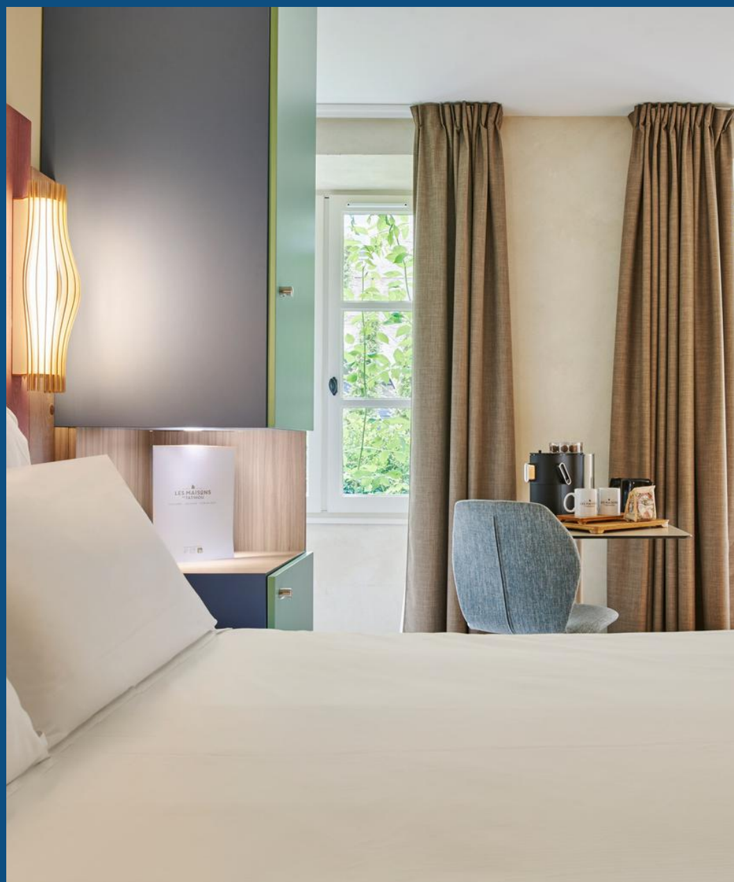
La Maison des Gabiers