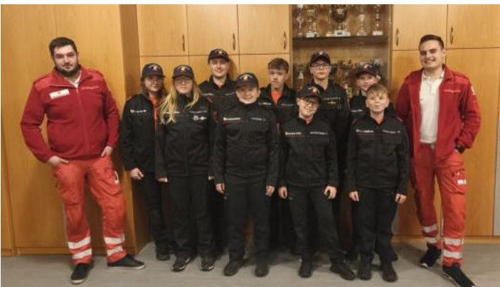
FF-Jugend Erste Hilfe Kurs mit Rotem Kreuz Waldhausen

Durch die Bewerbe und den Wissenstest können die Mädels und Burschen Abzeichen in Bronze, Silber und Gold erreichen – und das motiviert ungemein.