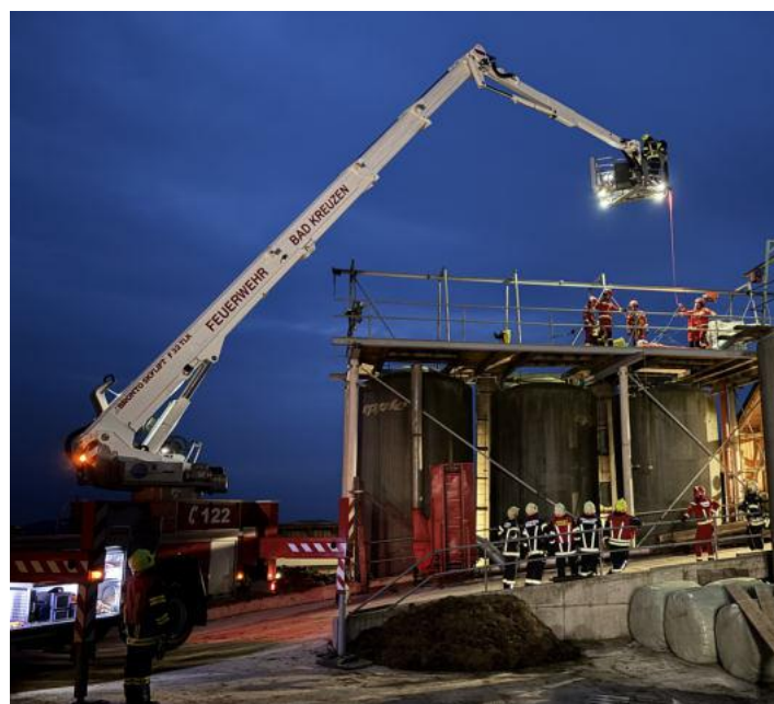
Frühjahrsübung mit HUB Bad Kreuzen und Höhenrettung

Ende März fand unsere große Frühjahrsübung statt. Dabei wurden wir von der FF-Bad Kreuzen mit dem HUB und RLF samt Besatzung und dem Höhenrettungsstützpunkt Arbing tatkräftig unterstützt.