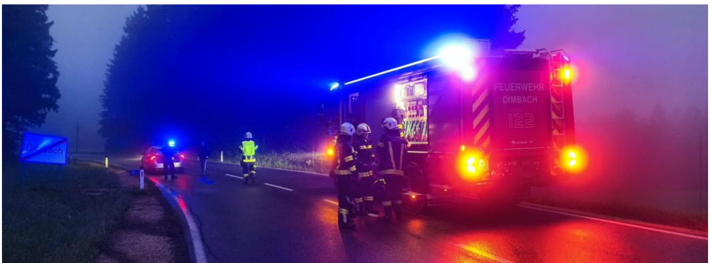
Einsatz Aufräumarbeiten nach Verkehrsunfall auf B119 / Ortsgebiet Dimbach

4 Berge-, Hebe- und Transportleistung 2 Binden u. Auffangen von Flüssigkeiten 3 Arbeiten nach Elementarereignissen