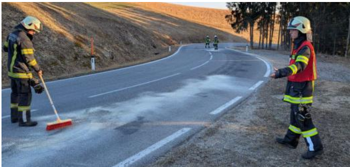
Einsatz Aufräumarbeiten nach Verkehrsunfall auf B119

Die erbrachten Einsatzstunden unserer Kameradinnen und Kameraden belaufen sich auf 568 Mannstunden.