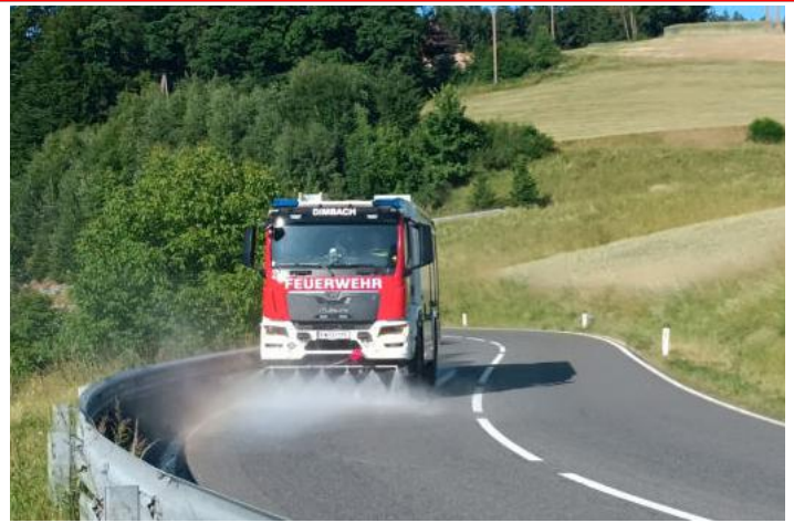
Einsatz Aufräumarbeiten nach Verkehrsunfall auf B119

2 Retten/Befreien von Menschen aus Notlage 3 Aufräumarbeiten nach Unfall