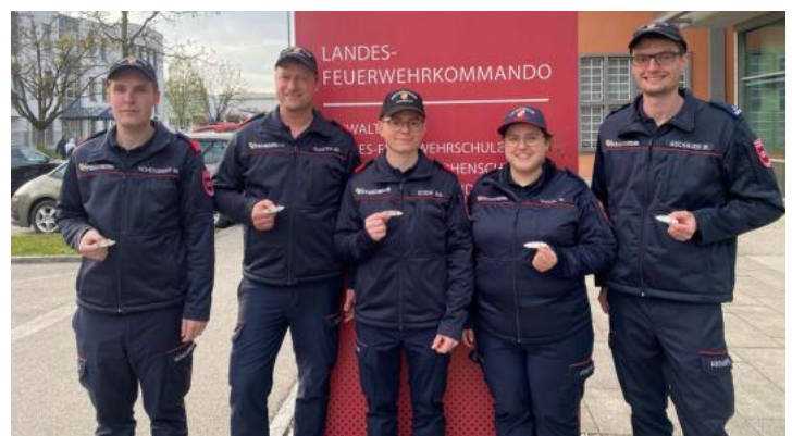
Prüfungsteilnehmer vom Funkleistungsabzeichen an der Landesfeuerwehrschule