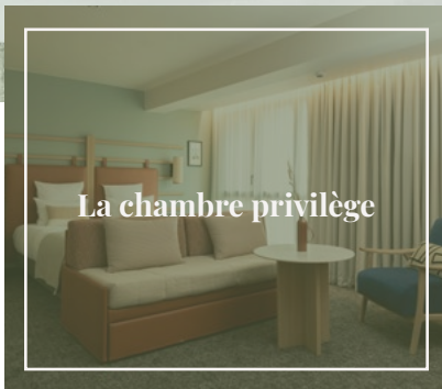
La chambre privilège