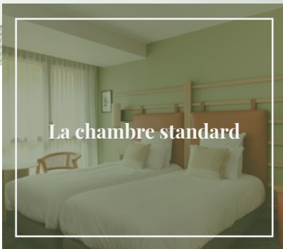
La chambre standard