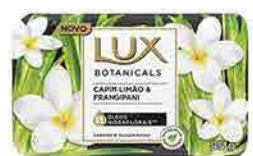
16517 SABONETE LUX CAPIM LIMÃO/FRANGIPANI | 12X85GR 7891150069602