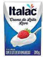
8197 CREME DE LEITE ITALAC LEVE TP | 24X200GR 7898080640222