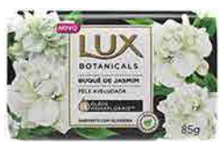
15434 SABONETE LUX BUQUÊ DE JASMIN BRANCO | 4X85GR 7891150060449