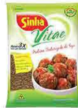
9948 PROTEÍNA DE SOJA SINHÁ VITAE CARNE | 1X400GR 7892300001671