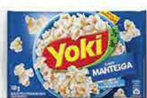
6943 PIPOCA MICROONDAS YOKI MANTEIGA | 36X100GR 7891095110167