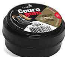
17438 CERA P/CALÇADO COURO BOM PASTA PRETO | 1X36 GR 7896040707336