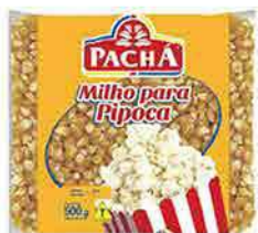
7127 MILHO PIPOCA PACHA | 20X500GR 7896602900212