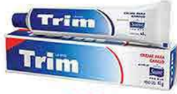
5386 CREME TRIM SUAVE | 1X65GR 78911037645653