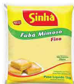
2278 FUBA SINHA MIMOSO | 20X1KG 7892300001480