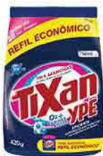
16234 TIRA MANCHAS TIXAN YPÊ EM PÓ COLORIDA SACHÊ | 1X420 GR 7896098901267