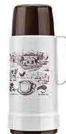
7976 GARRAFA TÉRMICA INVICTA DECORADA GOURMET | 1X1 LT 7891691083211