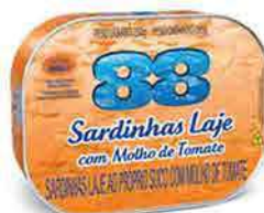
15489 SARDINHA 88 LAJE TOMATE ABRE FÁCIL | 24X250GR 7891167023154