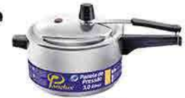
12490 PANELA PRESSÃO PANELUX 3LT | 1X3LT 7898147771012