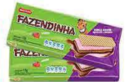
18874 WAFER FAZENDINHA CHOCOLATE/ MORANGO | 40X115GR 7896061301643