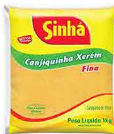
13132 CANJIQUEINHA SINHÁ XEREM FINA | 20X1KG 7892300004016