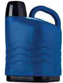
7977 GARRAFÃO TÉRMICO INVICTA AZUL | 1X5 LT 7891691087059