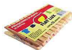
15363 PRENDEDOR DE ROUPA FIATLUX MADEIRA PEQUENO | 1X50 DZ 7896007932320