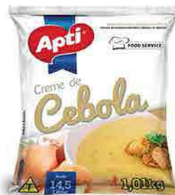
13688 CREME DE CEBOLA APTÍ | 1X1 KG 7896327513094