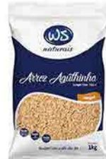
13361 ARROZ INTEGRAL WS | 1X1KG 7898928727108