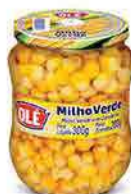
7379 MILHO VERDE OLÉ VIDRO | 12X200GR 7891032013303