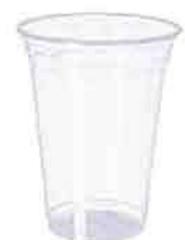
17654 COPO DESCARTÁVEL ABNT PP TRANSP. COPOBRAS | 50X330 ML 7896030813313