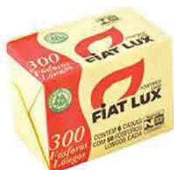
13501 FÓSFOROS FIAT LUX CASA | 20X6 UNID 7896007943210