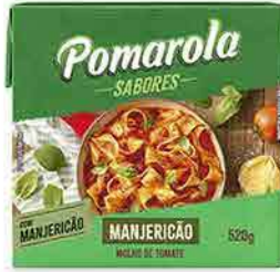
2091 MOLHO POMAROLA OLIVA E MANJERICÃO TP | 12X520GR 7896036094938