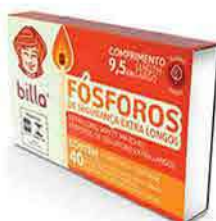
18020 FÓSFOROS BILLA EXTRA LONGO | 1X10 UNID 7898958192082