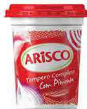
1357 TEMPERO ARISCO COMPLETO | 12X300 GR 7891700011006