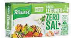
17719 CALDO KNORR ZERO SAL LEGUMES | 10X48GR 7891150072879