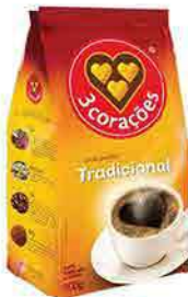
13833 CAFÉ 3 CORAÇÕES TRADICIONAL | 10X500GR 7896005800010