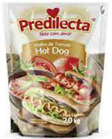
15891 MOLHO PREDILECTA HOT DOG TOMATE STAND UP | 1X2KG 7896292306523