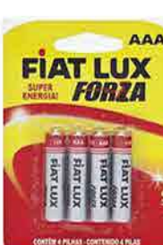
16182 PILHA FIATLUX COMUM AAA PALITO | 1X4 UNID 7896007974474