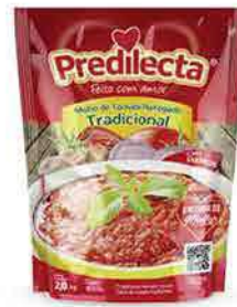
15888 MOLHO PREDILECTA REFOGADO STAND UP | 1X2KG 7896292303324