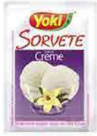
3010 PÓ SORVETE YOKI CREME SACHÊ | 1X150 GR 7891095009930