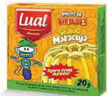
16296 GELATINA LUAL AMIGOS DA VIRTUDE MARACUJÁ | 36X20 GR 7896683409123