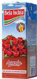
11929 SUCO BELA ISCHIA TP ACEROLA(NECTAR) | 1X1LT 7898063765584