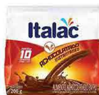
12889 ACHOCOLADO EM PÓ ITALAC | 24X200GR 7898080640772