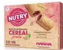
15827 BARRA RECHEADA NUTRY CAIXA GOIABA | 3X20 GR 7891331014209