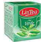
11947 CHÁ LINTEA VERDE 18GR | 1X10UNID 7891095011896