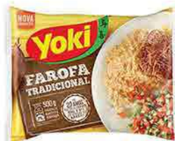
16520 FAROFA PRONTA YOKI TRADICIONAL | 1X500GR 7891095300488