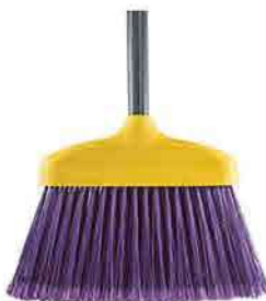
17341 VASSOURA PLURI PLUS | 1 UNID 7898650900336