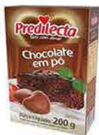
17846 CHOCOLATE EM PÓ PREDILECTA | 1X200GR 7896292305984