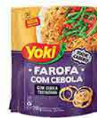
18034 FAROFA PRONTA YOKI CEBOLA | 1X200GR 7891095028993