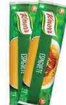
15921 MACARRÃO KNORR ESPAGUETE SÊMOLA | 30X500GR 789150062344