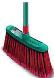
17292 VASSOURA NOVICA MULTIUSO FÁCIL BETTANIN | 1 UNID 7896001016828