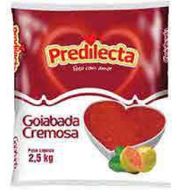
1356 GOIABADA PREDILECTA CREMOSA BAG | 1X2.5KG 7896292331211