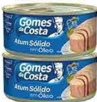
9706 ATUM SÓLIDO GOMES DA COSTA ÓLEO | 12X170GR 7891167011731