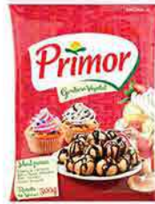
4186 GORDURA HIDROGENADA PRIMOR | 1X500GR 7891080400674