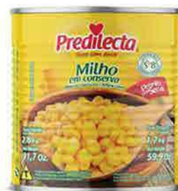
17610 MILHO VERDE PREDILECTA LATA | 1X1.7KG 7896292314511