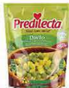
15886 DUETO MILHO+ERVILHA PREDILECTA SACHÊ | 32X170GR 7896292358072