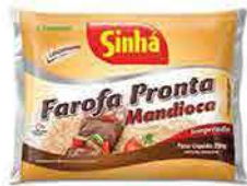
14302 FAROFA PRONTA SINHA MANDIOCA | 1X250GR 7892300002326