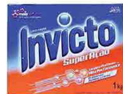
1739 LAVA-ROUPAS EM PÓ INVICTO SUPERACÃO | 20X1 KG 7898031170112