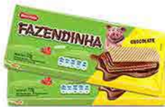
18842 WAFER FAZENDINHA CHOCOLATE | 40X115GR 7896061300141