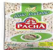
7768 FEIJÃO FRADINHO PACHA | 10X500GR 7896602904562