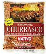
12366 SAL GROSSO NATIVO TEMPERO CHURRASCO | 10X300 GR 7897052201591