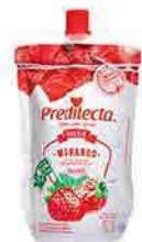
18828 GELEIA PREDILECTA MORANGO BICO | 1X210GR 7896292315112