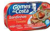
9708 SARD. GOMES DA COSTA TOMATE ABRE FÁCIL | 24X125GR 7891167021020