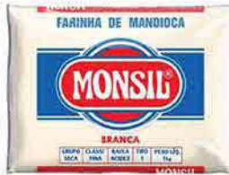
11509 FARINHA DE MANDIOCA BRANCA MONSIL | 20X1KG 7896035911250