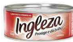
240 CERA INGLEZA PASTA VERMELHA | 12X400 GR 7891242010444