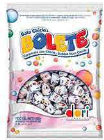
13169 BALA DORI CHICLE BOLETE TUTTI-FRUTTI | 1X600 GR 7896058591590