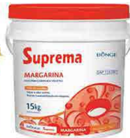
4182 MARGARINA SUPREMA 75% LIPÍDIO BALDE | 1X15KG 7891080401817