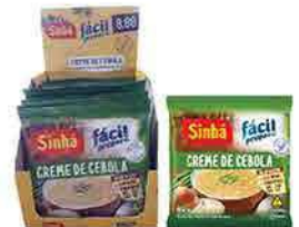
16423 CREME DE CEBOLA SINHÁ | 12X62 GR 7892300003170