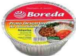
1449 MARMITEX BOREDA F. MÁQUINA N.9 | 1X100UNID 7897384700144