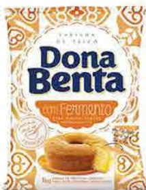
1230 FARINHA DE TRIGO DONA BENTA COM FERMENTO | 10X1KG 7896005232705