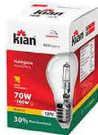
13766 LÂMPADA KIAN HALOGÊNIO ECOLOG. 70WX220V | 1 UNID 7898495149570