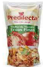
8849 MOLHO PREDILECTA ERVAS FINAS STAND UP | 24X340GR 7896292304215