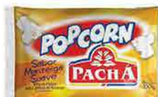
8931 PIPOCA MICROONDAS PACHA MANTEIGA | 24X100GR 7896602901004