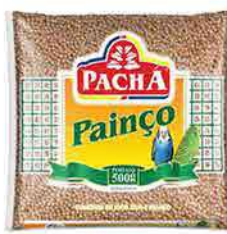
7132 PAINÇO PACHA | 20X500GR 7896602900106