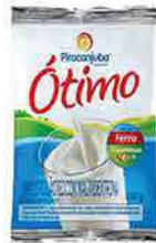
17384 LEITE LÁCTEO COMP. EM PÓ ÓTIMO PIRACANJUBA | 5X400GR 7898215152460