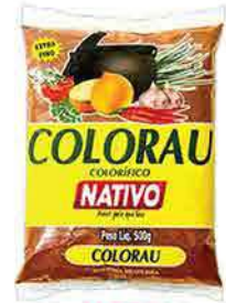
12310 COLORAU NATIVO 1X500 GR 7897052200136