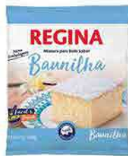
10030 MISTURA PARA BOLO REGINA BAUNILHA | 12X400GR 7896093300324