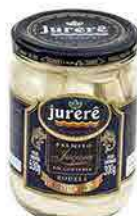
15905 PALMITO RODELA JURERÉ JUÇARA | 1X300GR 7896314613011