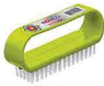
12553 ESCOVA PARA UNHAS NOVIÇA BETTANIN | 1X12 UNID 7896001002159