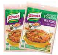
11242 TEMPERO KNORR FRANGO ASSADO CEBOLA/ALHO | 15X25 GR 7891150009592