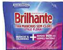
17726 TIRA MANCHAS BRILHANTE S/CLORO UTILE FLORAL | 1X380 GR 7891150067868