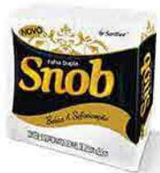
17615 GUARDANAPO SNOB F. DUPLA PEQ. 23,5X23,5 | 64X50 UNID 7896110001524