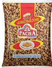
2075 AMENDOIM PACHÁ TORRADO EM GRÃO | 10X500GR 7896602900304