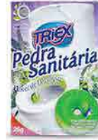
17749 PEDRA SANITÁRIA TRIEX FLORES EUCALIPTO | 12X25GR 7896527702069