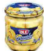
17526 COGUMELO CHAMPIGNON OLÉ VIDRO | 1X100GR 7891032013969