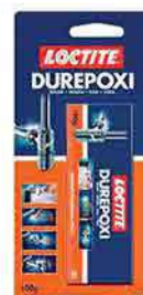
14599 DUREPOXI SM 1X100GR 7891200008971