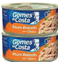
9707 ATUM RALADO GOMES DA COSTA ÓLEO | 12X170GR 7891167011748