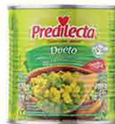
9906 DUETO MILHO+ERVILHA PREDILECTA LATA | 24X170GR 7896292348073