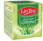
11946 CHÁ LINTEA CAPIM CIDREIRA 10GR | 1X10UNID 7891095001781