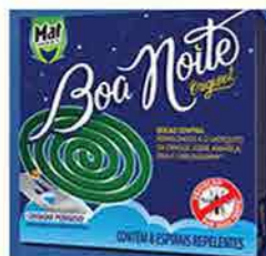
17428 INSET. ESPIRAL BOA NOITE ORIGINAL | 1X8 UNID 7891176117585