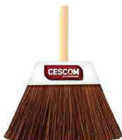
1225 VASSOURA PIAÇAVA CESCOM DIST.N.3 | 1X12 UNID 7898062140153