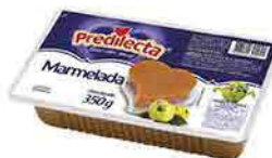
8703 MARMELEDA PREDILECTA BLOCO | 24X350GR 7896292302921