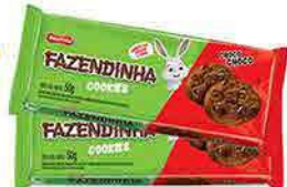
18875 COOKIES FAZENDINHA CHOCOLATE | 1X50GR 7896061300646