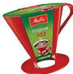
45129 SUPORTE FILTRO MELITTA 103 | 1 UNID 7891021000949