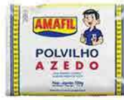
5434 POLVILHO AZEDO AMAFIL | 20X500GR 7896035921136