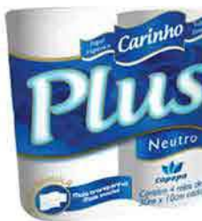
4426 PAPEL HIGIÊNICO CARINHO PLUS NEUTRO 30MT | 16X4 UNID 7896339810334