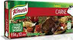
7419 CALDO KNORR CARNE | 1X114 GR 7891150012363