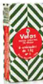
14051 VELA NOSSA SRª DA PENHA Nº2 15GR | 24X8UNID 7896335100019