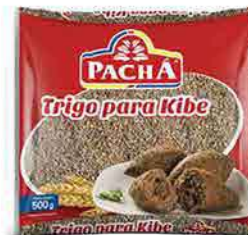
7129 TRIGO PARA KIBE PACHÁ | 20X500GR 7896602900205