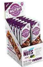
16388 BARRA NUTS NUTRY ZERO DISPLAY AÇAI | 12X30 GR 7891331015688