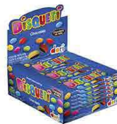
15328 DISQUETI DORI 18X40 GR 7896058593372