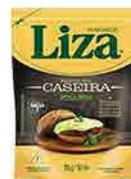
15200 MAIONESE LISA CASEIRA ERVAS FINAS SACHÊ | 1X186GR 7896036000014