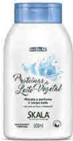
7622 HIDRATANTE SKALA PROTEÍNAS DO LEITE | 1X500 ML 7897042005833