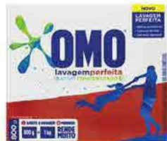
16325 LAVA-ROUPAS EM PÓ OMO LAV.PERFEITA | 20X800 GR 7891150064317