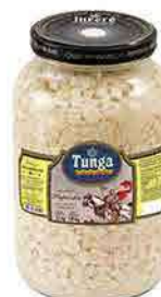
15906 PALMITO PICADO JURERÉ TUNGA PUPUNHA | 1X1.8KG 7896314614308