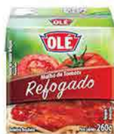
12915 MOLHO REFOGADO OLÉ TP | 12X260GR 7891032015123