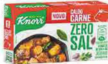
17718 CALDO KNORR ZERO SAL CARNE | 10X48GR 7891150072862