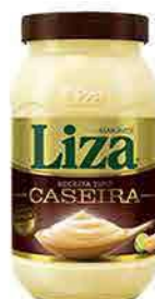
11850 MAIONESE LISA CASEIRA PET | 12X489GR 7896036094211