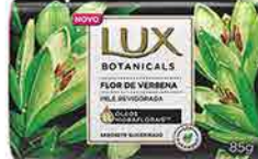
15426 SABONETE LUX SUAVE FLOR DE VERBENA VERDE | 12X85GR 7891150059856