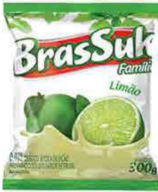
16029 REFRESCO BRASSUK LIMÃO | 1X300 GR 7896683402087