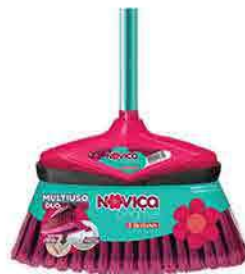
13267 VASSOURA NOVICA ORIGINAL BETTANIN | 1 UNID 7896001016712