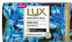
15430 SABONETE LUX SUAVE LÍRIO AZUL | 12X125GR 7891150060302