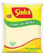
6062 CREME DE MILHO SINHÁ | 20X500GR 78923000026452