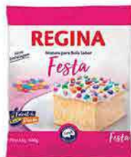
10032 MISTURA PARA BOLO REGINA FESTA | 12X400GR 7896093300317