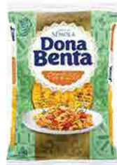
12952 MACARRÃO DONA BENTA SÊMOLA PARAFUSO | 24X500GR 7896005286555