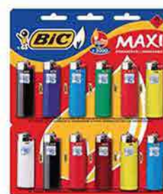
8920 ISQUEIRO BIC MAXI | 1X12 UNID 70330631335