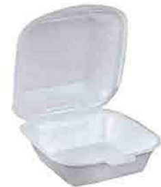
16196 HAMBURGUEIRA COPOPLAST CH-03 | 1X200UNID 17898604231285