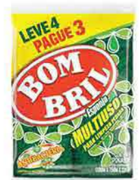
14733 ESPONJA BOMBRIL MULTIUSO LV4 PG3 | 1X4 UNID 7891022859812