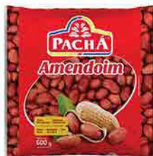
7121 AMENDOIM PACHA | 20X500GR 7896602900021