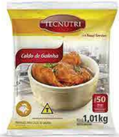
16471 CALDO TECNUTRI GALINHA SACHÊ | 1X1,01 KG 7898286805746