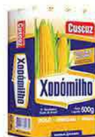
4570 CUSCUZ XODÔMILHO 30X500GR 7896223702615