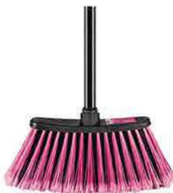
14799 VASSOURA JEITOSA MULTIUSO BETTANIN | 1 UNID 7896001040724