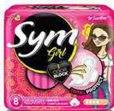
470 ABSORVENTE SYM GIRL C/ABAS SUAVE | 12X8 UNID 7896110003221