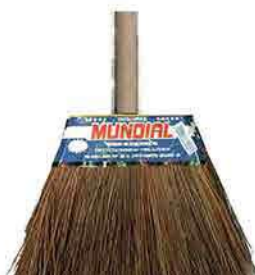
1547 VASSOURA PIAÇAVA MUNDIAL N.3 | 1X12 UNID 7898062140108