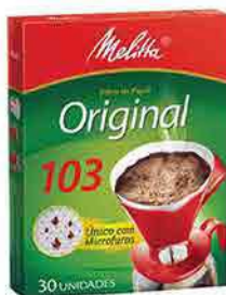
7955 COADOR MELITTA DE PAPEL 103 | 6X30 UN 7891021001960