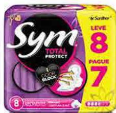
11837 ABSORVENTE SYM NORMAL C/ABAS SUAVE LV8 PG7 | 1X8 UNID 7896110007700