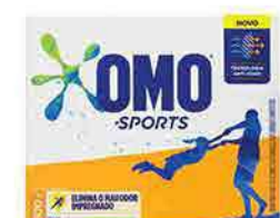
16326 LAVA-ROUPAS EM PÓ OMO SPORTS | 20X800 GR 7891150064607