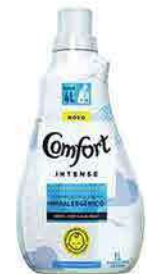
17477 AMACIANTE COMFORT CONC. BCO P. CUIDADO | 12X1LT 7891150042131