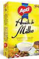
12636 AMIDO DE MILHO APTI CAIXA | 1X200GR 7896327512615