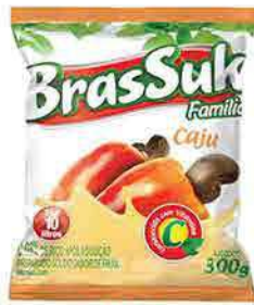
16036 REFRESCO BRASSUK CAJU | 1X300 GR 7896683402346