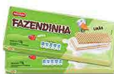
18873 WAFER FAZENDINHA LIMÃO | 40X115GR 7896061300172