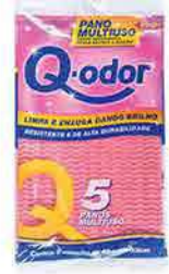
16951 PANO MULTI-USO Q-ODOR ROSA | 1X5 UNID 7897434401250