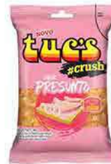
17862 BISCOITO TUCS DIN CRACKERS CRUSH PRESUNTO | 40X60GR 7896061301735