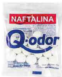
15993 NAFTALINA Q-ODOR | 50X30GR 7897434400970