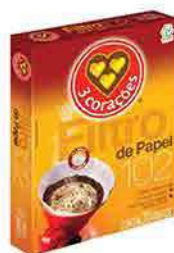
13828 COADOR 3 CORAÇÕES PAPEL 102 | 1X30 UNID 7896005803714