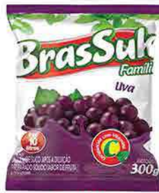
16035 REFRESCO BRASSUK UVA | 1X300 GR 7896683402032