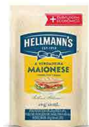
15674 MAIONESE HELLMANN'S SACHÊ | 12X400GR 789150056916