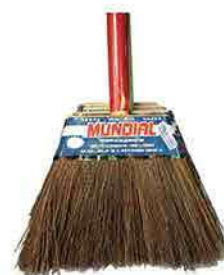
11479 VASSOURA PIAÇAVA MUNDIAL N.4 CABO PLÁST | 1X12 UNID 7898062140047