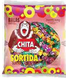
11860 BALA CHITA MASTIGÁVEL ORIGINAL SORTIDA | 1X600 GR 7896286614870