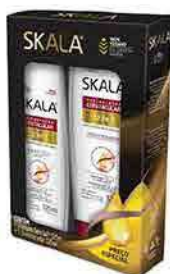
15339 SHAMPOO+CONDICIONADOR SKALA 12EM1 | 2X325 ML 7897042013791