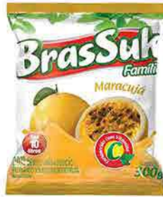
16031 REFRESCO BRASSUK MARACUJÁ | 1X300 GR 7896683402018