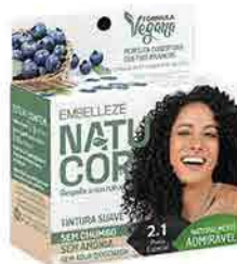
17289 TINTURA NATUCOR PRETO ESPEC. MIRTILO 2.1 | 1 UNID 7896013558033