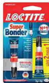
18806 COLA SUPER BONDER ORIGINAL L2P1 | 24X2X3GR 7891200016174