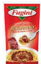
17982 MOLHO DE TOMATE FUGINI BOLONHESA SACHÊ | 32X340GR 7897517206116