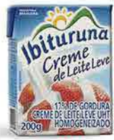
5779 CREME DE LEITE IBITURUNA LEVE TP | 27X200GR 7896401600689