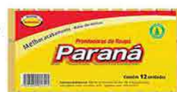
13347 PRENDEDOR DE ROUPA PARANÁ MADEIRA | 1X50 DZ 7896080900544