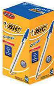
487 CANETA BIC CRISTAL AZUL | 1X50UNID 70330129627