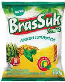
16398 REFRESCO BRASSUK ABACAXI/HORTELÃ | 1X300 GR 7896683402353