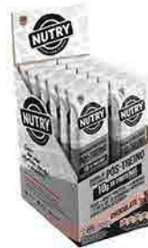
15124 BARRA PROT. NUTRY PROTEÍNA DISPLAY CHOCOLATE | 12X30 GR 7891331015114