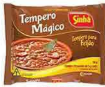
14355 TEMPERO MÁGICO SINHÁ FEIJÃO | 1X50 GR 7892300002746