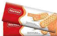
18859 BISCOITO BELA VISTA MAIZENA | 40X200GR 7896061300370