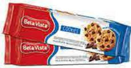
18839 COOKIES BELA VISTA BAUNILHA | 1X100GR 7896061300288