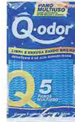
16950 PANO MULTI-USO Q-ODOR AZUL | 1X5 UNID 7897434401243