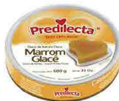
4299 MARRON GLACÊ PREDILECTA LATA | 12X600GR 7896292320093