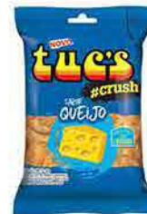
17861 BISCOITO TUCS DIN CRACKERS CRUSH QUEIJO | 40X60GR 7896061301728