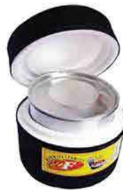
16268 MARMITA TÉRMICA DF REDONDA GRAND N°16 | 1UNID 7898292690022