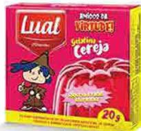
16292 GELATINA LUAL AMIGOS DA VIRTUDE CEREJA | 36X20 GR 7896683409161