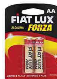
16183 PILHA FIATLUX ALCALINA AA PEQUENA | 1X2 UNID 7896007904174