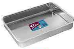
12493 ASSADEIRA RETANGULAR Nº3 | 1UNID 7898147772033