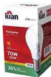
13769 LÂMPADA KIAN HALOGÊNIO ECOLOG. 70WX127V | 1 UNID 7898495149563