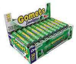
16469 GOMA DORI TUBO EUCALIPTUS | 1X30 UNID 7896058597776