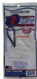
15350 COADOR ZEBINA ARAME DM11 SOLTEIRINHO | 1X12UN 7898151450286