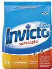
15539 LAVA-ROUPAS EM PÓ INVICTO SUPERACÃO SACHÉ | 8X2KG 7898031172857