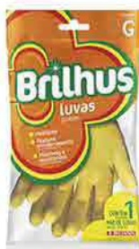
16300 LUVA MULTI-USO BRILHUS GRAND LATEX AMARELA | 1X1 PARES 7896001020627