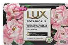
15435 SABONETE LUX ROSAS FRANCESAS ROSA | 4X85GR 7891150060456