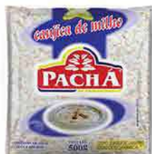
7122 CANJICA BRANCA PACHA | 20X500GR 7896602900038