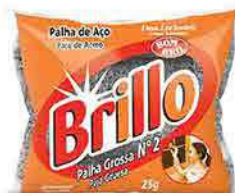
598 PALHA DE AÇO BRILLO Nº2 BOMBRILO | 1X20 UNID 7891022849288