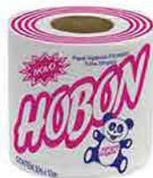
13774 PAPEL HIGIÊNICO HOBON INDIVIDUAL 30MT | 1X64 UNID 7898937601017