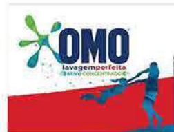
17460 LAVA-ROUPAS EM PÓ OMO LAV.PERFEITA | 9X1,6 KG 7891150064331