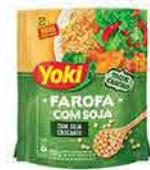
18033 FAROFA PRONTA YOKI SOJA | 1X200GR 7891095030064