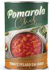
13603 TOMATE PELADO EM CUBOS POMAROLA LATA | 1X400GR 7896036097267