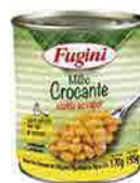
18886 MILHO VERDE FUGINI VAPOR LATA | 24X170GR 7897517209391