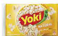
6941 PIPOCA MICROONDAS YOKI NATURAL | 36X100GR 7891095110624