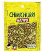
15289 TEMPERO CHIMICHURRI NATIVO | 15X20 GR 7897052202659