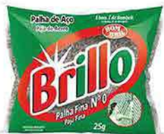
597 PALHA DE AÇO BRILLO Nº0 BOMBRILO | 1X20 UNID 7891022849240