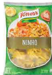
15925 MACARRÃO KNORR NINHO SÊMOLA | 20X500GR 7891150062436