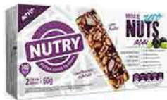
16389 BARRA NUTS NUTRY ZERO CAIXA AÇAI | 2X30 GR 7891331015688