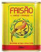
2276 ÓLEO COMPOSTO FAISÃO | 12X200ML 7896760901717