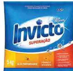
3155 LAVA-ROUPAS EM PÓ INVICTO SUPERACÃO SACHÉ | 1X5KG 7898031170136