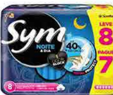
11907 ABSORVENTE SYM NOITE & DIA C/ABAS SUAVE LV8 PG7 | 1X8 UNID 7896110007892