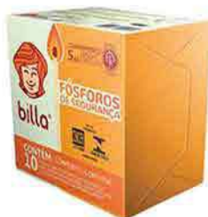
18014 FÓSFOROS BILLA 10X10 UNID 7898958192877