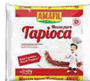
12497 MASSA PARA TAPIOCA AMAFIL | 20X500GR 7896035990101