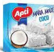
12625 MARIA MOLE COCO APTI | 1X50 GR 7896327501152