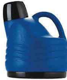
153140 GARRAFÃO TÉRMICO INVICTA AZUL | 1X3 LT 7891691087035