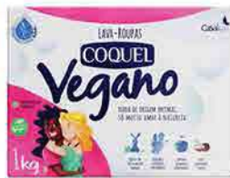
17608 LAVA-ROUPAS EM PÓ COQUEL VEGANO | 20X1 KG 7896040707473