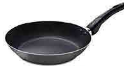
10647 FRIGIDEIRA ANTIADERENTE PANELUX 22CM | 1UNID 7898147771814