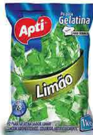
13689 GELATINA APTI LIMÃO | 1X1 KG 7896327500810