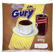
1829 ACHOCOLATADO GURY | 24X400GR 7896274201402