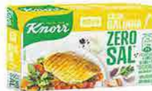
17717 CALDO KNORR ZERO SAL GALINHA | 10X48GR 7891150072824