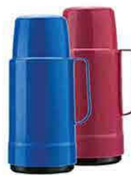
7975 GARRAFA TÉRMICA INVICTA LISA SORTIDA | 1X500 ML 7891691083129