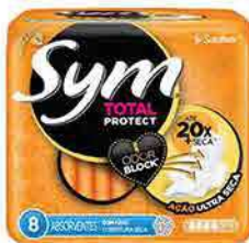
6485 ABSORVENTE SYM C/ABAS SECA AÇÃO ULTRASSECA LV8 PG7 | 12X8 UNID 7896110003863