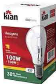
13767 LÂMPADA KIAN HALOGÊNIO ECOLOG. 100WX220V | 1 UNID 7898495149594