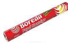
17606 PAPEL MANTEIGA BOREDA 30 CM C/7,5MT | 1 UNID 7897384700731