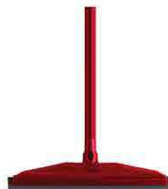
14360 RODO EVA ENXUTO 30CM CONDOR | 1 UNID 7891055112403