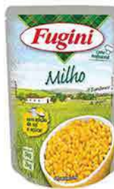
14749 MILHO VERDE FUGINI SACHÊ | 1X2KG 7897517209322