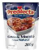
16146 GELEIA DE MOCOTÓ PREDILECTA NATURAL SACHÊ | 1X200GR 7896292315488