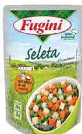
17687 SELETA DE LEGUMES FUGINI SACHÊ | 1X2KG 7897517209377