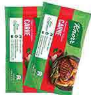
14757 TEMPERO KNORR IDEAL CARNES | 1X40 GR 7891150051997