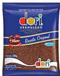
1495 CHOCOLATE GRANULADO DORI | 1X500 GR 7896058505504