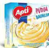
16254 PUDIM BAUNILHA APTI | 1X50 GR 7896327514916