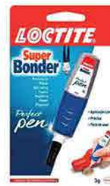
14597 COLA SUPER BONDER PERFECT PEN SM | 1X3GR 7891200014798