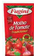
17676 MOLHO DE TOMATE FUGINI TRADICIONAL SACHÊ | 32X340GR 7897517206086