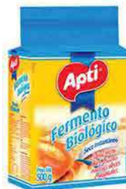
12627 FERMENTO INSTANTÂNEO BIOLÓGICO APTI | 1X500GR 7896327512257