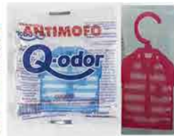
15991 ANTI MOFO Q-ODOR CABIDE | 1X50UNID 7897434401199