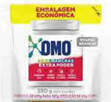
16366 TIRA MANCHAS OMO EM PÓ EXT. PODER BCA SACHÊ | 1X380 GR 7891150062108