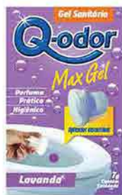
15997 GEL SANITÁRIO Q-ODOR LAVANDA | 1X7GR 7897434401717