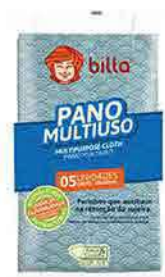
18019 PANO MULTI-USO BILLA AZUL | 1X5 UNID 7898918339380