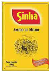
14311 AMIDO DE MILHO SINHÁ CAIXA | 1X500GR 7892300010505