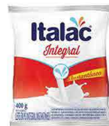
15311 LEITE EM PÓ ITALAC INTEGRAL INSTANTÂNEO SACHÊ | 5X400GR 7898080641694