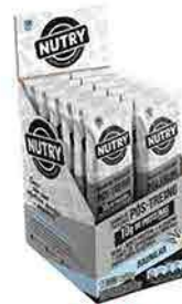
15126 BARRA PROT. NUTRY PROTEÍNA DISPLAY VANILA | 12X30 GR 7891331015138