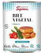
16037 BIFE VEGETAL SUPERBOM LATA | 1X550GR 7896024804501