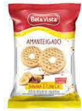
18835 BISCOITO AMANTEIG. BELA VISTA BANANA E CANELA | 1X310GR 7896061300783