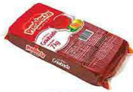
3688 GOIABADA PREDILECTA | 1X7KG 7896292300019