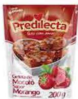
16144 GELEIA DE MOCOTÓ PREDILECTA MORANGO SACHÊ | 1X200GR 7896292315495