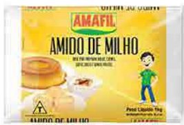
12917 AMIDO DE MILHO AMAFIL | 1X1KG 7896035950372