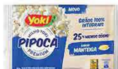
18027 PIPOCA MICROONDAS YOKI PREMIUM MANTEIGA | 36X90GR 7891095030217