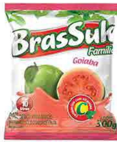
16026 REFRESCO BRASSUK GOIABA | 1X300 GR 7896683402063