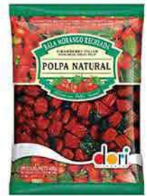
12996 BALA DORI MORANGO RECHÇADA | 1X600 GR 7896058591699