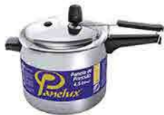
8591 PANELA PRESSÃO PANELUX 4,5LT | 1X4,5LT 7898147771029