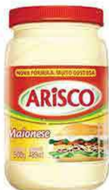
3352 MAIONESE ARISCO PET | 12X500GR 7891700206921