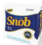
7359 GUARDANAPO SNOB 24X22 | 80X50 UNID 7896110081250