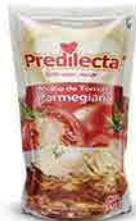
16151 MOLHO PREDILECTA PARMEGIANA STAND UP | 24X340GR 7896292311466