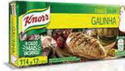
7418 CALDO KNORR GALINHA | 1X114 GR 7894000000350