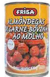
16171 ALMÔNDEGAS AO MOLHO DE CARNE FRISA | 1X430GR 7896481901560