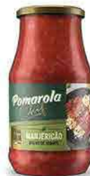
15717 MOLHO POMAROLA CHEF MANJERICÃO VIDRO | 1X420GR 7896036000274