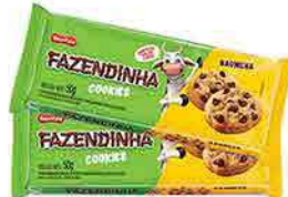
18843 COOKIES FAZENDINHA BAUNILHA | 1X50GR 7896061300516