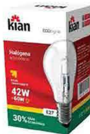
13771 LÂMPADA KIAN HALOGÊNIO ECOLOG. 42WX127V | 1 UNID 7898495149549