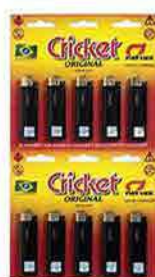
333 ISQUEIRO CRICKET CARLTON PRETO | 1X10 UNID 7896280833031