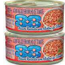
14788 ATUM RALADO 88 TOMATE | 12X140GR 7891167040427