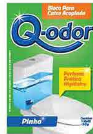
15988 BLOCO SANITÁRIO CX.ACOPLADA Q-ODOR PINHO | 1X36UNID 7897434401304