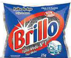
466 PALHA DE AÇO BRILLO Nº1 BOMBRILO | 1X20 UNID 7891022849264