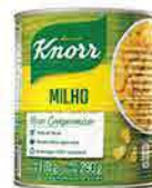
15497 MILHO VERDE KNORR LATA | 24X170GR 789150058903