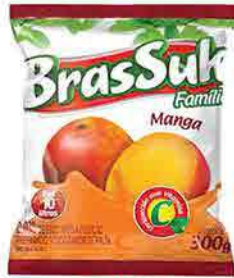
16030 REFRESCO BRASSUK MANGA | 1X300 GR 7896683402056