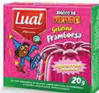
16293 GELATINA LUAL AMIGOS DA VIRTUDE FRAMBOESA | 36X20 GR 7896683409154