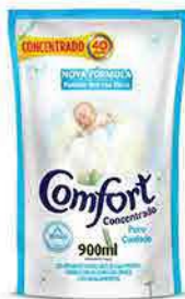
14750 AMACIANTE COMFORT CONC. BCO P. CUIDADO SACHÉ | 12X900 ML 7891150054561