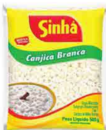
14309 CANJICA BRANCA SINHÁ | 20X500GR 78923000020528