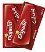
1233 CATCHUP D'AJUDA SACHÊ | 192X7GR 7896054903342