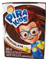
7798 ACHOCOLATADO PIRAKIDS LÍQUIDO | 27X200ML 7898215151807