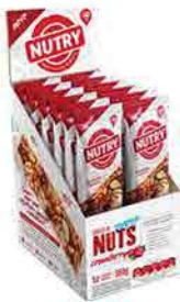
16390 BARRA NUTS NUTRY ZERO DISPLAY CRANBERRY | 12X30 GR 7891331015695