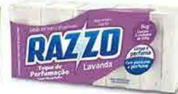
6423 SABÃO TAB. RAZZO PERF. LAVANDA | 12X5X200 GR 7896023400070