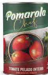
13610 TOMATE PELADO POMAROLA LATA | 1X400GR 7896036095669