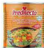
9667 SELETA DE LEGUMES PREDILECTA LATA | 24X170GR 7896292307780