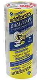
15377 FITA EMPACOT.QUALITAPE TRANSP.48X60 | 1X4UNID 7896603803796