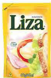
10406 MAIONESE LISA SACHÊ | 12X472GR 7896036094808