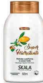
16346 HIDRATANTE SKALA SUPER HIDRATANTE | 1X500 ML 7897042007844