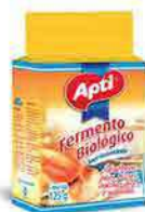
12626 FERMENTO INSTANTÂNEO BIOLÓGICO APTI | 8X125GR 7896327512240