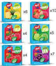
12611 GELATINA APTI SORTIDA | 36X35 GR 7896327514107