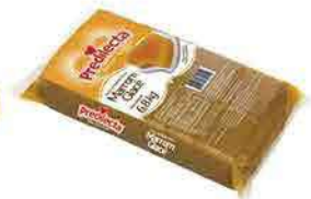
3734 MARRON GLACÊ PREDILECTA BLOCO | 1X6.8KG 7896292320017