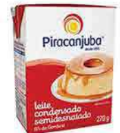
6630 LEITE CONDENSADO PIRACANJUBA SEMIDESNATADO TP | 27X270 GR 7898215152019