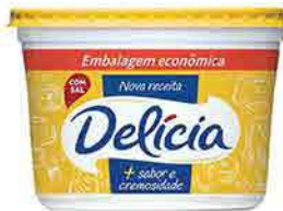
6451 MARGARINA DELÍCIA 70% LIPÍDIO | 12X1KG 7891080400063