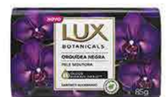
15423 SABONETE LUX SUAVE ORQUÍDEA NEGRA ROXO | 12X85GR 7891150059900