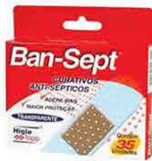
8388 CURATIVO BAN-SÉPTICO TRANSPARENTE | 1X35UNID 7898095296049