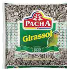
7131 SEMENTE DE GIRASSOL PACHA | 10X500GR 7896602900113