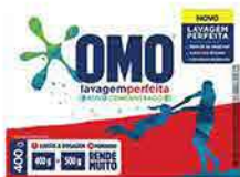
17554 LAVA-ROUPAS EM PÓ OMO LAV.PERFEITA | 24X400 GR 7891150065284