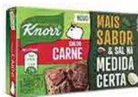
6655 CALDO KNORR CARNE | 10X57 GR 7891150012301