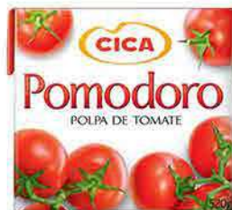
4922 POLPA DE TOMATE POMODORO TP | 12X520GR 7896036095119