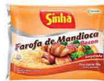
14303 FAROFA PRONTA SINHA BACON | 1X250GR 7892300001992