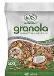
16433 GRANOLA WS COCO | 1X500GR 7898928727757