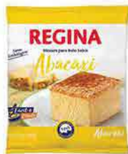
10029 MISTURA PARA BOLO REGINA ABACAXI | 12X400GR 7896093300737