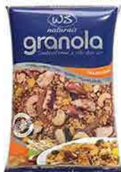
7867 GRANOLA CASEIRA WS | 1X1KG 7898928727016