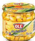
4974 MILHO VERDE OLÉ VIDRO | 12X120GR 7891032013303