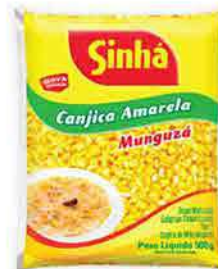
14308 CANJICA AMARELA SINHÁ | 20X500GR 78923000026742