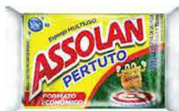
17903 ESPONJA ASSOLAN MULTIUSO PERTUTO | 10X3 UNID 7896090100064