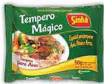
13884 TEMPERO MÁGICO SINHÁ AVES | 1X50 GR 7892300002470