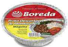
2372 MARMITEX BOREDA F. MÁQUINA N.8 | 1X100UNID 7897384700069