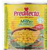
17611 MILHO VERDE PREDILECTA LATA | 24X170GR 7896292340503