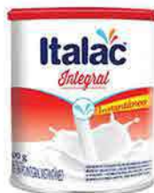
15312 LEITE EM PÓ ITALAC INTEGRAL INSTANTÂNEO LATA | 1X400GR 7898080641823