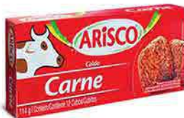
10383 CALDO ARISCO CARNE | 1X114 GR 7891700080378