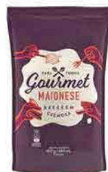
15675 MAIONESE GOURMET SACHÊ | 1X400GR 7891150058668