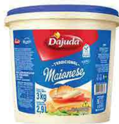
1236 MAIONESE D'AJUDA BALDE | 1X3KG 7896054900327