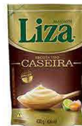
13561 MAIONESE LISA CASEIRA SACHÊ | 1X430GR 7896036094877