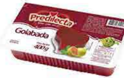
1638 GOIABADA PREDILECTA PRÁTICA | 24X400GR 7896292304017