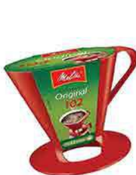
13820 SUPORTE FILTRO MELITTA 102 | 1 UNID 7891021000925