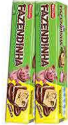
18841 BISCOITO RECH. FAZENDINHA CHOCOLATE | 40X130GR 7896061300240