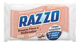
11173 SABÃO TAB. RAZZO COCO INDIVIDUAL | 60X200 GR 7896023400919