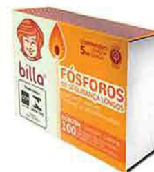
18015 FÓSFOROS BILLA LONGO | 1X10 UNID 7898958192112