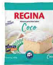
10031 MISTURA PARA BOLO REGINA COCO | 12X400GR 7896093300331