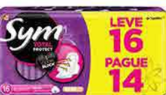
11910 ABSORV. SYM NORMAL C/ABAS SUAVE LV16 PG14 | 1X16 UNID 7896110008042