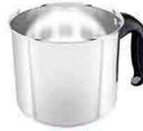
12495 CANECO FERVEDOR Nº 12 | 1UNID 7898147772125