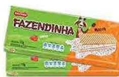
18872 WAFER FAZENDINHA FLOCOS | 40X115GR 7896061300165