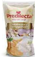
10439 MOLHO PREDILECTA STROGONOFF STAND UP | 24X340GR 7896292309531