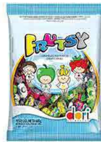
12997 BALA DORI FRUTSY SORTIDA | 1X600 GR 7896058591606