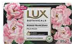
15424 SABONETE LUX SUAVE ROSAS FRANCESAS ROSA | 12X85GR 7891150059870