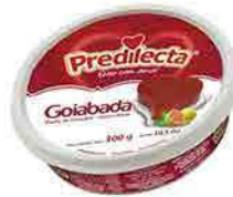
5521 GOIABADA PREDILECTA POLI | 24X300GR 7896292300163