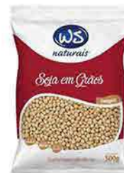
14783 SOJA EM GRÃO WS | 1X500GR 7898928727146