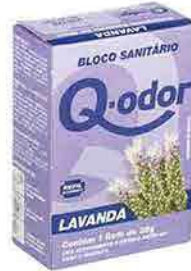
15983 BLOCO SANITÁRIO Q-ODOR REFIL LAVANDA | 1X36UNID 7897434400918