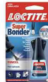
14593 COLA SUPER BONDER PINCEL SM | 1X4 GR 7891200006366