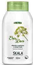
15277 HIDRATANTE SKALA ERVA DOCE | 1X500 ML 7897042009848