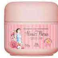
14887 DESODORANTE CREME ALMA DE FLORES JASMIM | 1X55GR 7891134003806