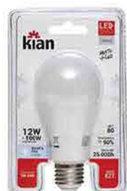
13759 LÂMPADA KIAN LED 12W BIVOLT | 1 UNID 7899710006555