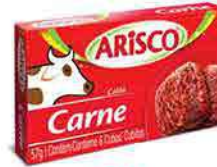
5121 CALDO ARISCO CARNE | 10X57 GR 7891700080354