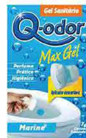
15995 GEL SANITÁRIO Q-ODOR MARINE | 1X7GR 7897434401489