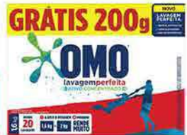
16351 LAVA-ROUPAS PÓ OMO LAV. PERFEITA GTS200G | 9X1,6 KG 7891150064348