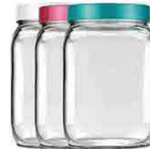
13111 POTE INVICTA REDONDO LISO SORTIDO | 1X1,3 LT 7891691028014