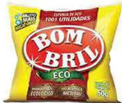
232 LÃ DE AÇO BOMBRILO 14X8 UNID 7891022101003