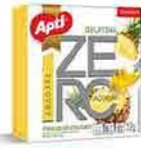
12615 GELATINA APTI ZERO ABACAXI | 12X12 GR 7896327513933