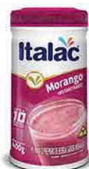
12885 PÓ PARA PREPARO BEBIDA MORANGO ITALAC PT | 1X400GR 7898080640963