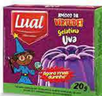
16298 GELATINA LUAL AMIGOS DA VIRTUDE UVA | 36X20 GR 7896683409147