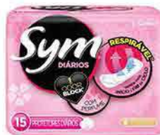
9677 ABSORVENTE SYM PROTETOR DIÁRIO C/FRAGÂNCIA | 4X15 UNID 7896110007502