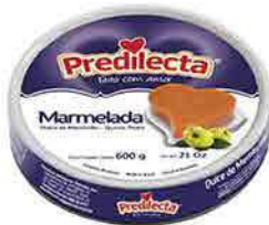
7357 MARMELEDA PREDILECTA LATA | 12X600GR 7896292301399