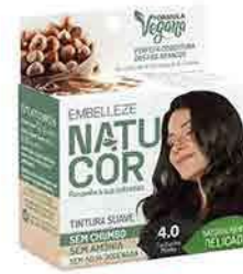
9239 TINTURA NATUCOR CASTANHO MEDIO 4.0 | 1 UNID 7896013500384