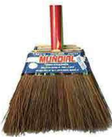
11480 VASSOURA PIAÇAVA MUNDIAL N.5 CABO PLÁST | 1X12 UN 7898062140276