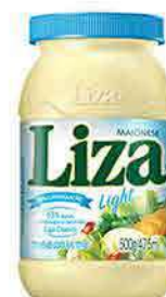
11851 MAIONESE LISA LIGHT PET | 12X500GR 7896036091333