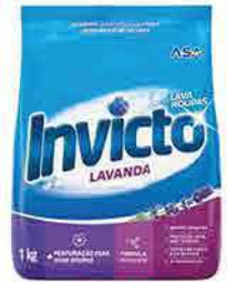
17842 LAVA-ROUPAS EM PÓ INVICTO LAVANDA SACHÉ | 16X1KG 7898031172970