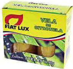
17484 VELA FIAT LUX CITRONELA 90GR | 2X90GR 7896007921614