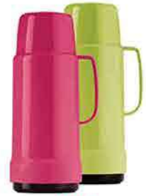
7974 GARRAFA TÉRMICA INVICTA LISA SORTIDA | 1X1 LT 7891691083112