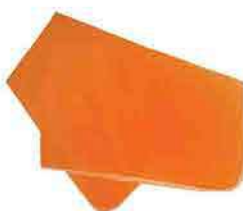
8503 FLANELA ZEBINA 38X58 1X12 UNID 7898151450095