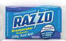
11171 SABÃO TAB. RAZZO AZUL ANIL INDIVIDUAL | 60X200 GR 7896023401978