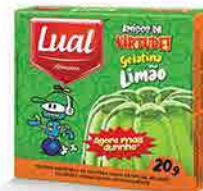
16295 GELATINA LUAL AMIGOS DA VIRTUDE LIMÃO | 36X20 GR 7896683409116