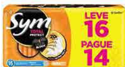
11909 ABSORVENTE SYM C/ABA SAÇÃO ULTRASSECA LV16 PG14 | 1X16 UNID 7896110008363