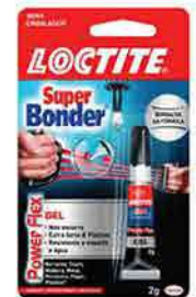
14596 COLA SUPER BONDER POWER FLEX GEL | 24X2GR 7891200012572