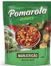
11794 MOLHO POMAROLA CASEIRO MANJERICÃO SACHÊ | 24X300GR 7896036096079