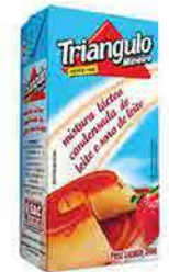
14343 LEITE CONDENSADO MIST. LÁCTEA TRIÂNGULO TP | 27X395GR 7896434920778