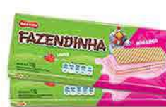
18871 WAFER FAZENDINHA MORANGO | 40X115GR 7896061300158