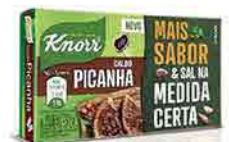
3190 CALDO KNORR PICANHA | 10X57 GR 7891700200585