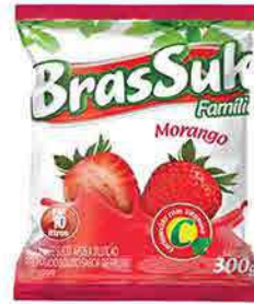
16032 REFRESCO BRASSUK MORANGO | 1X300 GR 7896683402025