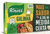
6654 CALDO KNORR GALINHA | 10X57 GR 7894000077475