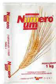
10036 FARINHA DE TRIGO NÚMERO UM | 10X1KG 7896093300034