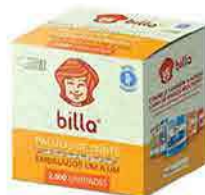
18011 PALITO DENTAL EMBALAGEM INDIVIDUAL BILLA | 1X2000 UN 7898918339410