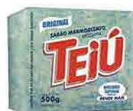
756 SABÃO TAB. TEIÚ MARMORIZADO | 20X500 GR 7896394800226