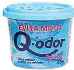
15960 EVITA MOFO Q-ODOR INFANTIL | 1X80GR 7897434401120