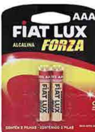
16185 PILHA FIATLUX ALCALINA AAA PALITO | 1X2 UNID 7896007904372