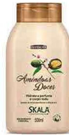
15276 HIDRATANTE SKALA AMÊNDOAS DOCE | 1X500 ML 7897042007141