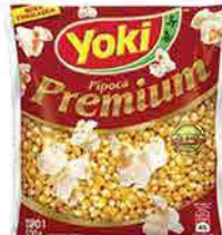
18024 MILHO PIPOCA PREMIUM YOKI | 24X500GR 7891095006984