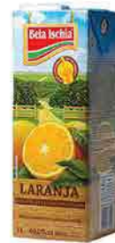
10769 SUCO BELA ISCHIA TP LARANJA(NECTAR) | 1X1LT 7898063764440