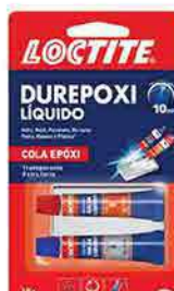
14601 DUREPOXI LÍQUIDO SM | 1X16GR 7891200011537