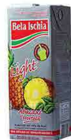
10772 SUCO BELA ISCHIA TP LIGHT ABACAXI/HORTELÃ(NECTAR) | 1X1LT 7898063764594