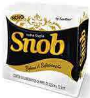
17620 GUARDANAPO SNOB F. DUPLA GRANDE 32,5X32,5 | 48X50 UNID 7896110001531