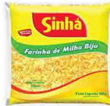
978 FARINHA DE MILHO BIJU SINHA | 20X500GR 7892300006690