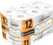
10554 PAPEL HIGIÊN. CARINHO PREMIUM F.D. NEUT. 30MT L12 PG11 | 4X12 UNID 7896339811102