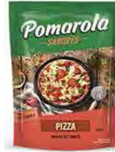
9349 MOLHO POMAROLA PIZZA SACHÊ | 24X300GR 7896036095065