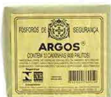
306 FÓSFOROS ARGOS 20X10 UNID 7898905100054