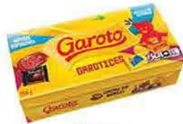
13188 BOMBOM GAROTO SORTIDO | 1X300 GR 7891008209013