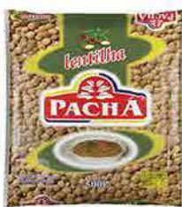
7126 LENTILHA PACHA | 10X500GR 7896602900151