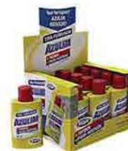
1687 TIRA FERRUGEM AZULIM | 1X50 ML 7897534808157