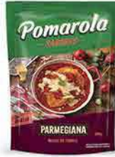
9350 MOLHO POMAROLA PARMEGIANA SACHÊ | 24X300GR 7896036095072