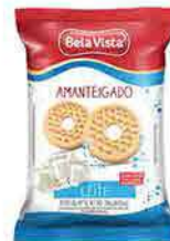
18857 BISCOITO AMANTEIG. BELA VISTA LEITE | 1X310GR 7896061300752