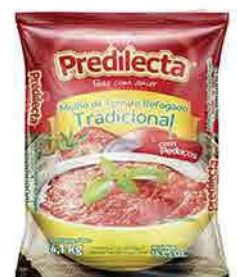
5132 MOLHO PREDILECTA REFOGADO BAG | 1X4.1KG 7896292310803