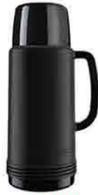
15259 GARRAFA TÉRMICA INVICTA IDEAL PRETO | 1X1 LT 7891691284311