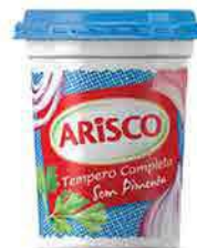
3497 TEMPERO ARISCO SEM PIMENTA | 12X300 GR 7891700011204