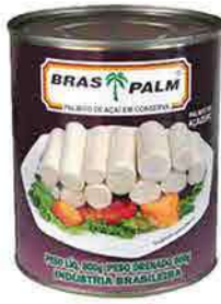
18807 PALMITO TOLETE BRASPALM LATA | 1X500GR 7891500128430