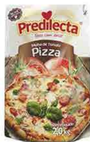
15889 MOLHO PREDILECTA PIZZA STAND UP | 1X2KG 7896292305427