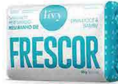
6396 SABONETE LIVY FRESCOR ERVA DOCE E BAMBU | 12X85GR 7896023408229