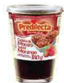
4986 GELEIA DE MOCOTÓ PREDILECTA MORANGO COPO | 1X180GR 7896292305496