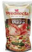
8851 MOLHO PREDILECTA PIZZA STAND UP TOMATE | 24X340GR 7896292304222