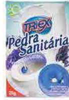
17728 PEDRA SANITÁRIA TRIEX AROMAS DO CAMPO | 12X25GR 7896527702083