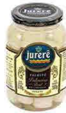
10297 PALMITO TOLETE JURERÉ PALMEIRA REAL | 1X300GR 7896314611208