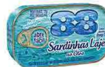
15672 SARDINHA 88 LAJE ÓLEO ABRE FÁCIL | 25X125GR 7891167023055