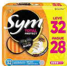
17618 ABSORV. SYM NORMAL C/ABAS SECA LV32 PG28 | 1X32 UNID 7896110094618