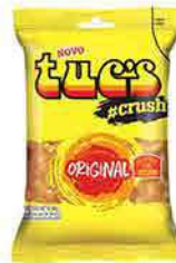
17863 BISCOITO TUCS DIN CRACKERS CRUSH ORIGINAL | 40X60GR 7896061301742