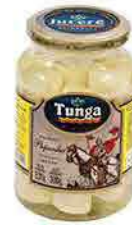
14314 PALMITO TOLETE JURERÉ TUNGA PUPUNHA | 1X300GR 7896314614100