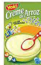
749 CREME DE ARROZ YOKI TRADICIONAL | 12X200 GR 7891095110520