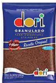
12998 CHOCOLATE GRANULADO DORI | 1X1,01 KG 7896058591705