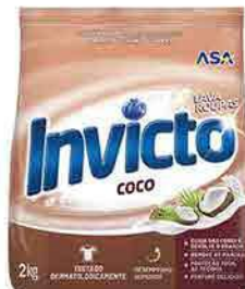
17845 LAVA-ROUPAS EM PÓ INVICTO COCO SACHÉ | 8X2KG 7898031173489