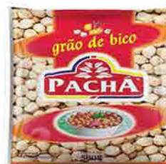
7125 GRÃO DE BICO PACHA | 10X500GR 7896602900144