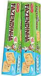
18870 BISCOITO FAZENDINHA S/RECHEIO LEITE | 40X123GR 7896061300455