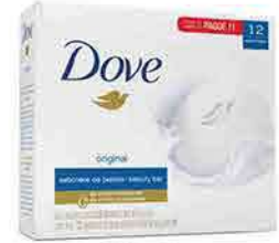
11422 SABONETE DOVE BRANCO LV12PG11 | 12X90GR 7891150052468