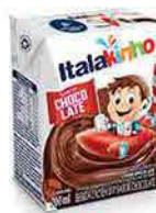
8195 ACHOCOLATADO ITALAKINHO LÍQUIDO | 24X200ML 7898080640239