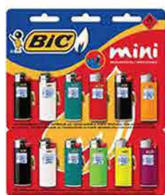
8322 ISQUEIRO BIC MINI | 1X12 UNID 70330631328