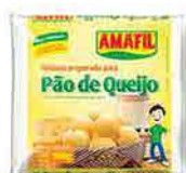
8935 MISTURA PÃO DE QUEIJO AMAFIL | 1X500GR 7896035931036