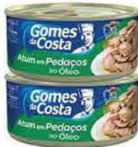
9908 ATUM PEDAÇO GOMES DA COSTA ÓLEO | 12X170GR 7891167011717