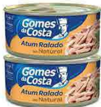
15474 ATUM RALADO GOMES DA COSTA NATURAL | 12X170GR 7891167011779