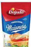
12148 MAIONESE D'AJUDA SACHÊ | 24X200GR 7896054903151