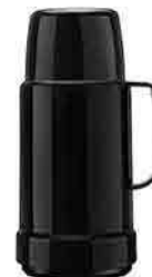
15253 GARRAFA TÉRMICA INVICTA GLT PRETO | 1X500 ML 7891691183126