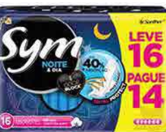
17625 ABSORVENTE SYM NOITE & DIA C/ABAS SUAVE LV16 PG14 | 1X16 UNID 7896110094625