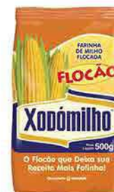
13982 FLOCÃO DE MILHO XODÔMILHO | 20X500GR 7896223702738