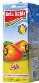
10780 SUCO BELA ISCHIA TP CAJU(NECTAR) | 1X1LT 7898063764471