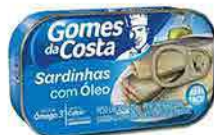
9709 SARDINHA GOMES DA COSTA ÓLEO ABRE FÁCIL | 24X125GR 7891167021013