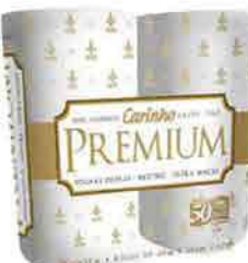
12468 PAPEL HIGIÊNICO CARINHO PREMIUM F.D. 30MT | 16X4 UNID 7896339810907