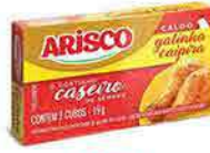
1373 CALDO ARISCO GALINHA CAIPIRA | 24X19 GR 7891700023023