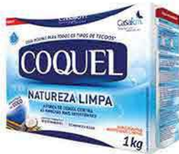
16164 LAVA-ROUPAS EM PÓ COQUEL NATUREZA LIMPA | 20X1 KG 7896040706186