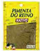
12359 PIMENTA DO REINO MOÍDA NATIVO | 15X18 GR 78971052200242