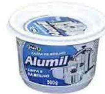
1686 BRILHA ALUMÍNIO PASTA ALUMIL | 12X500 ML 7897534800502