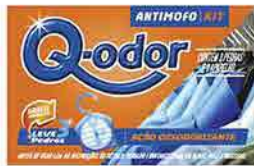
15992 ANTI MOFO Q-ODOR KIT C/3 UNID.APAR | 1X3UNID 7897434401915