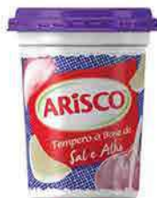
1358 TEMPERO ARISCO ALHO E SAL | 12X300 GR 7891700012102