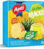
12604 GELATINA APTI ABACAXI | 36X35 GR 7896327500780