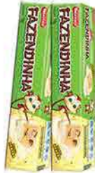
18868 BISCOITO RECH. FAZENDINHA BANANA | 40X130GR 7896061301605