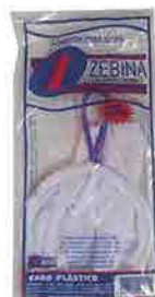
11473 COADOR ZEBINA ARA MED12,5 | 1X24UN 7898151450170