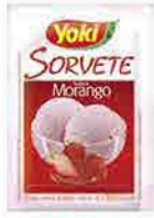
3009 PÓ SORVETE YOKI MORANGO SACHÊ | 1X150 GR 7891095009916