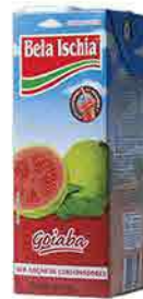
13083 SUCO BELA ISCHIA TP GOIABA(NECTAR) | 1X1LT 7898063763559