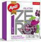
12618 GELATINA APTI ZERO UVA | 12X12 GR 7896327513940