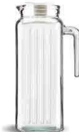
16217 JARRA INVICTA VIDRO VENEZA C/TP | 1X1,2 LT 7891691009457