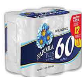
17872 PAPEL HIGIÊNICO PAPOULA NEUTRO 60MT L12P11 | 4X12 UNID 7898937600041