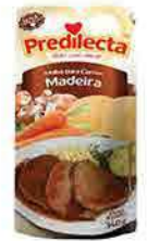
8848 MOLHO PREDILECTA MADEIRA STAND UP | 24X340GR 7896292305793