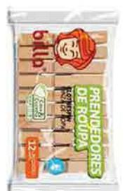
18017 PRENDEDOR DE ROUPA BILLA MADEIRA PEQUENO | 1X50 DZ 7898640210933