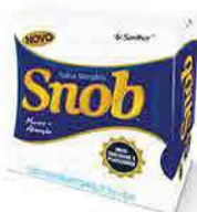
1943 GUARDANAPO SNOB GRANDE 30X33 | 48X50 UNID 7896110081359