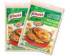
11243 TEMPERO KNORR FRANGO ASSADO LIMÃO/ORÉGANO | 15X25 GR 7891150009585