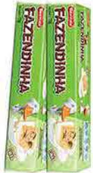
18869 BISCOITO RECH. FAZENDINHA LIMÃO | 40X130GR 7896061301599