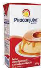
6631 LEITE CONDENS. PIRACANJUBA SEMIDESN. TP | 27X395 GR 7898215152002