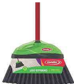
13379 VASSOURA CONDOR PVC V-52 VARRE FORTE | 1 UNID 7891055003084