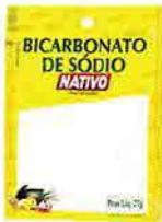
12303 BICARBONATO DE SÓDIO NATIVO | 15X27 GR 47897052200028