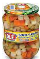
4808 SELETA DE LEGUMES OLÉ VIDRO | 12X200GR 7891032012658