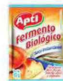
12628 FERMENTO INSTANTÂNEO BIOLÓGICO APTI | 48X10GR 7896327512233