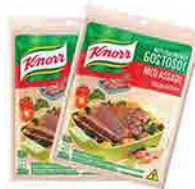
11402 TEMPERO KNORR ASSADO CASEIRO | 15X25 GR 7891150021174