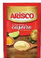
2467 MAIONESE ARISCO SACHÊ | 24X196GR 7891700206952