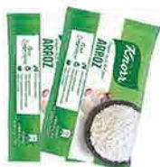
15065 TEMPERO KNORR ARROZ ALHO/CEBOLA | 1X48 GR 7891150051768