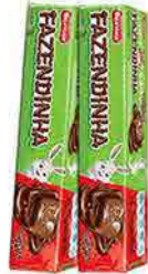
18867 BISCOITO RECH. FAZENDINHA CHOCO CHOCO | 40X123GR 7896061300448