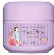
14888 DESODORANTE CREME ALMA DE FLORES BAUNILHA | 1X55GR 7891134003967