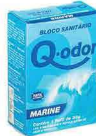
15981 BLOCO SANITÁRIO Q-ODOR REFIL MARINE | 1X36UNID 7897434400895