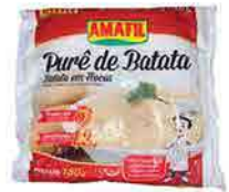
13953 PURÊ DE BATATAS EM FLOCOS AMAFIL SACHÊ | 1X180GR 7896035972084