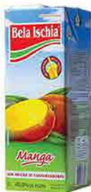
13085 SUCO BELA ISCHIA TP MANGA(NECTAR) | 1X1LT 7898063763566