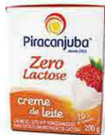
12898 CREME DE LEITE PIRACANJUBA ZEROLACTOSE TP | 27X200GR 7898215151982