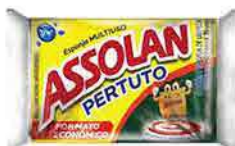
12949 ESPONJA ASSOLAN MULTIUSO PERTUTO | 1X60 UNID 7896090105007