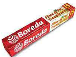
3025 FILME PVC BOREDA 28CM C/15MT | 1X12UNID 7897384700380