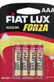
16186 PILHA FIATLUX ALCALINA AAA PALITO | 1X4 UNID 7896007904471