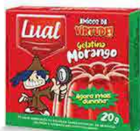
16297 GELATINA LUAL AMIGOS DA VIRTUDE MORANGO | 36X20 GR 7896683409130