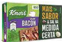
7564 CALDO KNORR BACON 10X57 GR 7894000033860