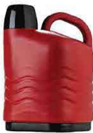
15309 GARRAFÃO TÉRMICO INVICTA VERMELHO | 1X5 LT 7891691187056