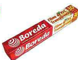
3026 FILME PVC BOREDA 28CM C/30MT | 1X12UNID 7897384700397