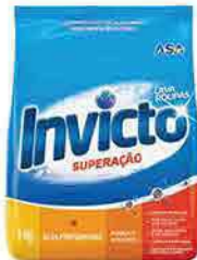
16137 LAVA-ROUPAS EM PÓ INVICTO SUPERACÃO SACHÉ | 16X1KG 7898031172819