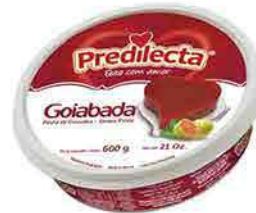
3690 GOIABADA PREDILECTA POLI | 24X600GR 7896292300095