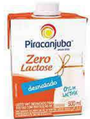
14265 LEITE LÍQ. PIRACANJUBA ZERO LACT.DESNAT. TP EDGE | 12X500ML 7898215152972