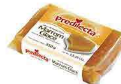
3733 MARRON GLACÊ PREDILECTA BLOCO | 24X350GR 7896292302884