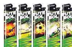
7765 ISQUEIRO CRICKET ORIGINAL DECORADO | 1X10 UNID 7896280833963