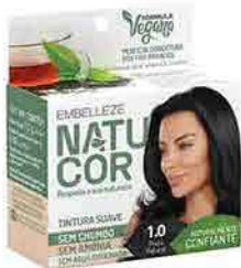
9245 TINTURA NATUCOR PRETO NATURAL 1.0 | 1 UNID 7896013502937