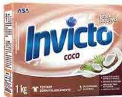
18049 LAVA-ROUPAS EM PÓ INVICTO COCO | 20X1 KG 7898031173458