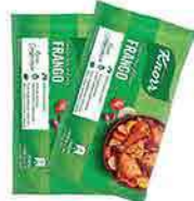
14756 TEMPERO KNORR IDEAL FRANGO | 1X40 GR 7891150052000