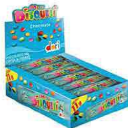
2736 DISQUETI DORI MINI 36X11 GR 7896058500110