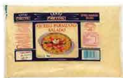
14735 QUEIJO RALADO RETTIS | 1X1KG 7898114700366