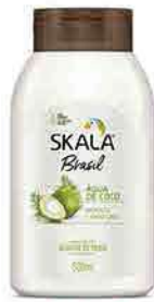
17500 HIDRATANTE SKALA ÁGUA DE COCO | 1X500 ML 7897042013715