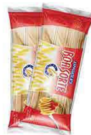
16140 MACARRÃO BOA SORTE SÊMOLA ESPAGUETE | 12X1KG 7896005219447