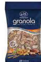
7868 GRANOLA CASEIRA WS | 1X500GR 7898928727023