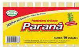
13348 PRENDEDOR DE ROUPA PARANÁ BAMBU | 50X10 UNID 7896080900568