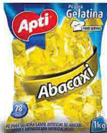
14778 GELATINA APTI ABACAXI | 1X1 KG 7896327500780