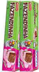
18865 BISCOITO RECH. FAZENDINHA MORANGO | 40X130GR 7896061300257