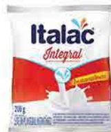
17360 LEITE EM PÓ ITALAC INTEGRAL INSTANTÂNEO SACHÊ | 10X200GR 7898080641687