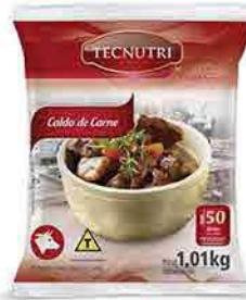
16472 CALDO TECNUTRI CARNE SACHÊ | 1X1,01 KG 7898286805739