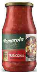
15716 MOLHO POMAROLA CHEF TRADICIONAL VIDRO | 1X420GR 7896036000267