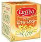
11949 CHÁ LINTEA ERVA DOCE 10GR | 1X10UNID 7891095001798