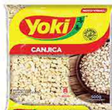
11786 CANJICA BRANCA YOKI | 12X500GR 7891095100293