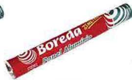
5078 ROLO ALUMÍNIO BOREDA 30 CM C/7,5MT | 1X12 UNID 7897384700014