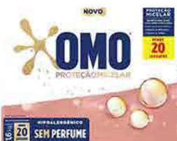
16488 LAVA-ROUPAS PÓ OMO MICELAR S/PERFUME | 9X1,6 KG 7891150072220