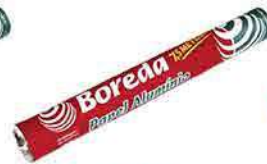
5463 ROLO ALUMÍNIO BOREDA 45 CM C/7,5MT | 1X25 UNID 7897384700298