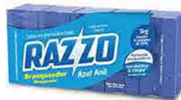
900 SABÃO TAB. RAZZO AZUL ANIL | 12X5X200 GR 7896023400025