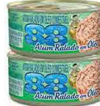
2755 ATUM RALADO 88 ÓLEO | 12X140GR 7891167040403