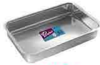
12492 ASSADEIRA RETANGULAR Nº2 | 1UNID 7898147772026