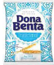
1098 FARINHA DE TRIGO DONA BENTA | 10X1KG 7896005202074