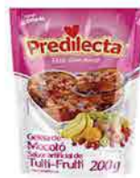
16145 GELEIA DE MOCOTÓ PREDILECTA TUTTI-FRUTI SACHÊ | 1X200GR 7896292315518