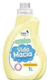
16288 AMACIANTE VIDA MACIA G&CAMOMILA | 12X1 LT 7896040704113