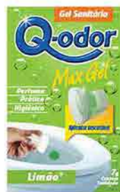
15994 GEL SANITÁRIO Q-ODOR LIMÃO | 1X7GR 7897434401502