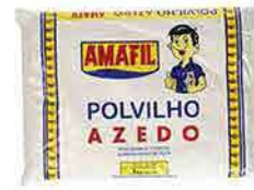
7560 POLVILHO AZEDO AMAFIL | 20X1KG 7896035921150