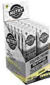
15125 BARRA PROT. NUTRY PROTEÍNA DISPLAY BANANA | 12X30 GR 7891331015077