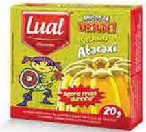
16291 GELATINA LUAL AMIGOS DA VIRTUDE ABACAXI | 36X20 GR 7896683409109