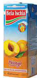
10783 SUCO BELA ISCHIA TP PÊSSEGO(NECTAR) | 1X1LT 7898063763580