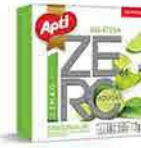
12616 GELATINA APTI ZERO LIMÃO | 12X12 GR 7896327513957