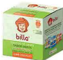
18012 PALITO DENTAL EMBALAGEM INDIV. MENTA BILLA | 1X2000 UN 7898918339014