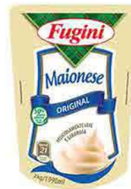
17990 MAIONESE FUGINI SACHÊ | 1X2KG 7897517205553