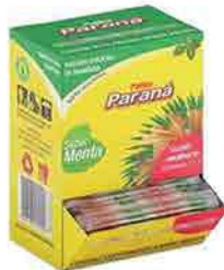
16375 PALITO DENTAL PARANA MENTA SACHÊ | 1X1000 UNID 7896080900087