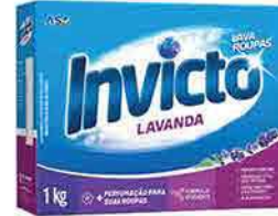
12910 LAVA-ROUPAS EM PÓ INVICTO LAVANDA | 20X1 KG 7898031172949