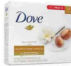
15314 SABONETE DOVE KARITÉE BAUNILHA LV+PG- | 12X90GR 7891150052451