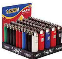
10087 ISQUEIRO BIC MAXI BANDEJA | 1X50 UNID 70330909229