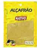
12302 AÇAFRÃO NATIVO 15X10 GR 7897052200747