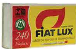
3503 FÓSFOROS FIAT LUX COZINHA | 1X15 UNID 7896007941636