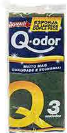
16008 ESPONJA DUPLA FACE Q-ODOR C/3 | 120X3UNID 7897434401236