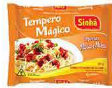
16209 TEMPERO MÁGICO SINHÁ MASSAS | 1X50 GR 7892300003095