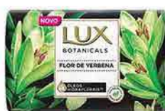
15436 SABONETE LUX FLOR DE VERBENA VERDE | 4X85GR 7891150060463