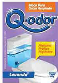
15987 BLOCO SANITÁRIO CX.ACOPLADA Q-ODOR LAVANDA | 1X36UNID 7897434401298