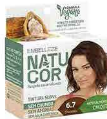
9248 TINTURA NATUCOR CHOCOLATE 6.7 | 1 UNID 7896013516231