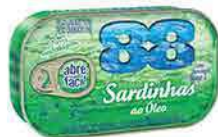
7972 SARDINHA 88 ÓLEO ABRE FÁCIL | 25X125GR 7891167023017