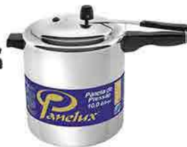
12491 PANELA PRESSÃO PANELUX 10LT | 1X10LT 7898147771074