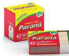
17594 FÓSFOROS PARANÁ ECO LONGO FAMILIA | 20X10 UNID 7896080900223