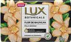
15425 SABONETE LUX SUAVE FLOR DE BAUNILHA AMARELO | 12X85GR 7891150059863