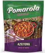
11793 MOLHO POMAROLA CASEIRO AZEITONA SACHÊ | 24X300GR 7896036096062