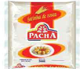
7124 FARINHA DE ROSCA PACHA | 20X500GR 7896602900069