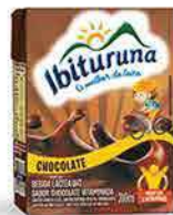
4100 ACHOCOLATADO IBITURUNA LÍQUIDO | 27X200ML 7896401600672