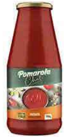
16524 MOLHO POMAROLA CHEF PASSATA VIDRO | 1X700GR 7896036098806