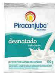
14263 LEITE EM PÓ PIRACANJUBA DESNAT. INSTANTÂNEO SACHÊ | 5X400GR 7898215152484