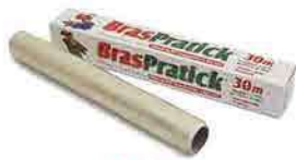
14623 FILME PVC BRASPRATICK 28CM C/30MT | 1 UNID 7898906825024