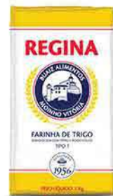
10037 FARINHA DE TRIGO REGINA PAPEL | 10X1KG 7896093300027