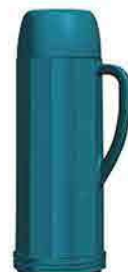
15514 GARRAFA TÉRMICA EUREKA AZUL OCEANO | 1X1 LT 7891691005459