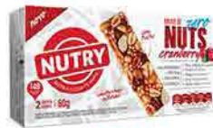
16391 BARRA NUTS NUTRY ZERO CAIXA CRANBERRY | 2X30 GR 7891331015695