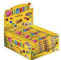
15329 DISQUETI DORI AMENDOIM | 18X39 GR 7896058593396