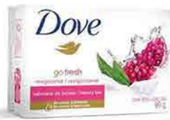
14071 SABONETE DOVE REVIGORANTE | 6X90GR 7891150043923