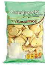
13276 SEQUILHOS NATA BOMBISCOITO ZERO LACTOSE/GLU | 1X320GR 7898249283222