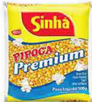
14301 MILHO PIPOCA PREMIUM SINHÁ | 10X500GR 7892300030107