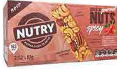
17753 BARRA NUTS NUTRY CAIXA PIMENTA | 2X31 GR 7891331015787