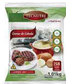
16474 CREME DE CEBOLA TECNUTRI SACHÊ | 1X1,01 KG 7898286806156