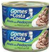
15476 ATUM PEDAÇO GOMES DA COSTA NATURAL | 12X170GR 7891167011724