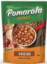
12421 MOLHO POMAROLA CASEIRO CLÁSSICO SACHÊ | 24X300GR 7896036036051