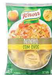
15926 MACARRÃO KNORR NINHO SÊMOLA COM OVOS | 20X500GR 7891150062443