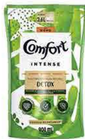
16311 AMAC. COMFORT CONC. INTENSE CUIDADO NAT. SACHÉ | 12X900 ML 7891150064874