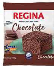
10035 MISTURA PARA BOLO REGINA CHOCOLATE | 12X400GR 7896093300348