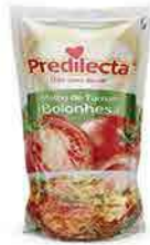
8706 MOLHO PREDILECTA BOLONHESA STAND UP | 24X340GR 7896292307001