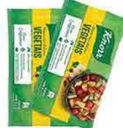
14758 TEMPERO KNORR IDEAL VEGETAIS | 1X40 GR 7891150051980