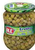
7384 ERVILHA OLÉ VIDRO | 12X200GR 78921032012351