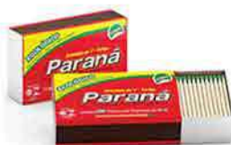
14012 FÓSFOROS PARANÁ ECO LONGO FORNO E FOGÃO | 1X15 UNID 7896080920054