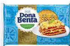
14353 LASANHA DONA BENTA OVOS | 20X500GR 7896005281673