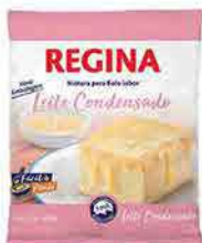
11032 MISTURA PARA BOLO REGINA LEITE CONDENSADO | 12X400GR 7896093301628