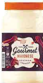
15345 MAIONESE GOURMET PET | 1X500GR 7891150057692