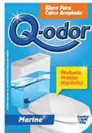
15990 BLOCO SANITÁRIO CX.ACOPLADA Q-ODOR MARINE | 1X36UNID 7897434401663