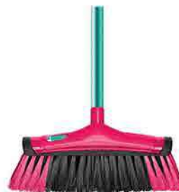
14632 VASSOURA NOVICA PELO VARRY1000 | 1 UNID 7896001010000