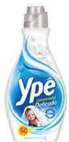
17628 AMACIANTE YPÊ CONCENT. DELICADO | 12X1 LT 7896098901519