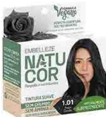
17290 TINTURA NATUCOR PRETO CARVAO 1.01 | 1 UNID 7896013566069