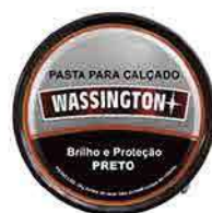
16376 CERA P/CALÇADO WASHINGTON PASTA PRETA | 1X36 GR 7793350020080