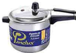
8592 PANELA PRESSÃO PANELUX 7,0LT | 1X7,0LT 7898147771036