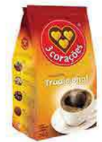
13832 CAFÉ 3 CORAÇÕES TRADICIONAL | 20X250GR 7896005800362