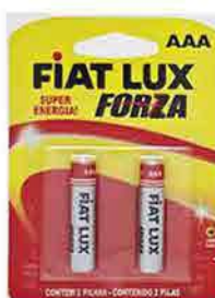
16181 PILHA FIATLUX COMUM AAA PALITO | 1X2 UNID 7896007974375