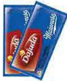
1235 MAIONESE D'AJUDA SACHÊ | 192X7GR 7896054903359