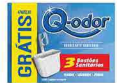
16316 BLOCO SANITÁRIO Q-ODOR 3UN SORT-AP GTS | 1X3UNID 7897434401106