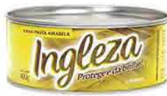
238 CERA INGLEZA PASTA AMARELA | 12X400 GR 7891242010413