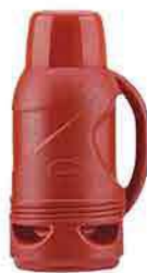
15257 GARRAFA TÉRMICA INVICTA LIDER VERMELHO | 1X500 ML 7891691180125