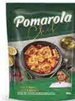
13196 MOLHO POMAROLA CHEF PIZZA SACHÊ | 24X300GR 7896036097946