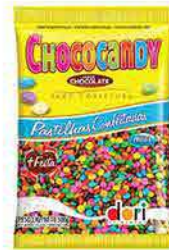
15074 CHOCOCANDY DORI MINI | 1X500 GR 7896058591989