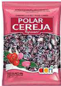
13095 BALA DORI POLAR CEREJA | 1X600 GR 7896058591651