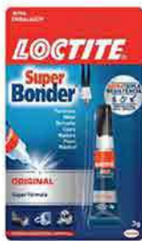
8496 COLA SUPER BONDER ORIGINAL+2 GRÁTIS | 26X3GR 7891200190942