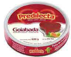
4079 GOIABADA PREDILECTA LATA | 12X600GR 7896292330092