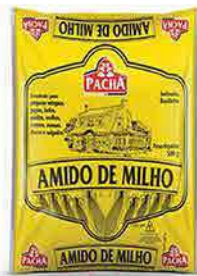
8936 AMIDO DE MILHO PACHA | 10X500GR 7896602900564