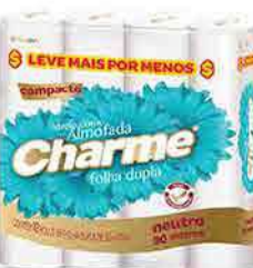
17616 PAPEL HIGIÊNICO CHARME FOLHA DUPLA 30MT NEUTRO | 16X4 UNID 7896110093451