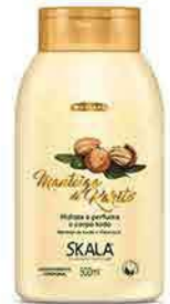
7623 HIDRATANTE SKALA MANTEIGA DE KARITÉ | 1X500 ML 7897042005826