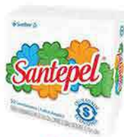
938 GUARDANAPO SANTEPEL 24X22 | 1X80X50 UNID 7896110083254