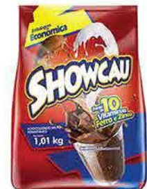
9384 ACHOCOL. EM PÓ SHOWCAU PREDILECTA | 10X1KG 7896292330740