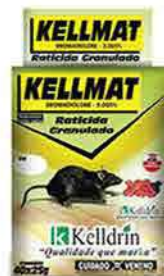
16944 RATICIDA GRANULADO KELL MAT DISPLAY | 40X25 GR 7891021001908