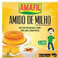
14787 AMIDO DE MILHO AMAFIL | 1X500GR 7896035950419