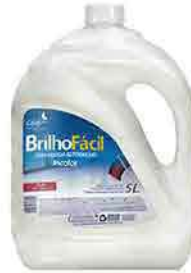
17825 CERA BRILHO FÁCIL LÍQ. INCOLOR | 1X5 LT 7896040707244