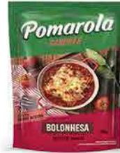
9601 MOLHO POMAROLA BOLONHESA SACHÊ | 24X300GR 7896036095126