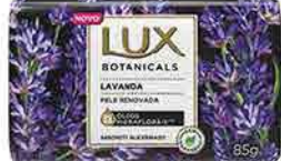
15429 SABONETE LUX SUAVE LAVANDA LILÁS | 12X85GR 7891150059887