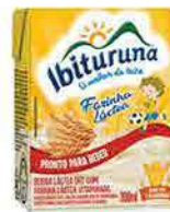
15757 BEBIDA LÁCTEA CEREAIS IBITURUNA | 27X200ML 7896401601723