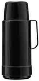
15252 GARRAFA TÉRMICA INVICTA GLT PRETO | 1X1 LT 7891691183119