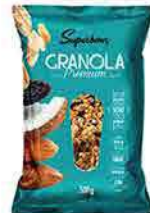
17759 GRANOLA PREMIUM SUPERBOM | 1X500GR 7896024855008