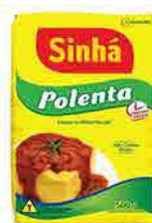
16426 POLENTA SINHA | 12X500GR 7892300022614