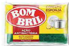
8463 ESPONJA BOMBRIL MULTIUSO | 1X60 UNID 7891022100938