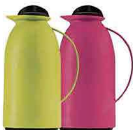
12656 GARRAFA TÉRMICA INVICTA VG SORTIDA | 1X500 ML 7891691088032