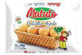
12278 POLVILHO AZEDO MATUTO | 20X1KG 7896035921457