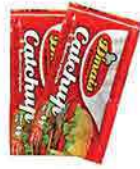
13959 CATCHUP D' MAIS SACHÊ | 156X6GR 7898958172060