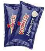
8569 MAIONESE PREDILECTA SACHÊ | 192X7GR 17896292340432