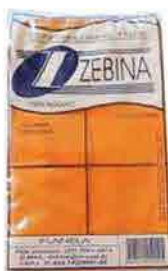
16938 FLANELA ZEBINA 28X38 EMB. ECONOMICA | 1X10 UNID 7898151450378