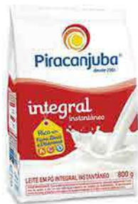
17385 LEITE EM PÓ PIRACANJUBA INT. INSTANTÂNEO SACHÊ | 1X800GR 7898215152255