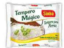
14569 TEMPERO MÁGICO SINHÁ ARROZ | 1X50 GR 7892300002852