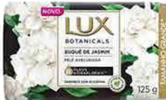
15432 SABONETE LUX SUAVE BUQUÊ DE JASMIM BRANCO | 12X125GR 7891150060289