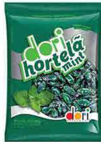
12993 BALA DORI HORTELÃ MINT | 1X600 GR 7896058591613