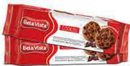
18862 COOKIES BELA VISTA CHOCOLATE | 1X100GR 7896061300295