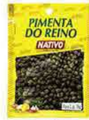
12358 PIMENTA DO REINO GRÃO NATIVO | 15X18 GR 7897052202291