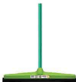
14634 RODO NOVICA VAI E VEM 40CM BETTANIN | 1 UNID 7896001012813