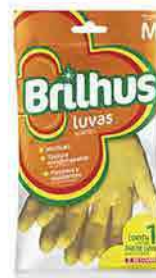
16903 LUVA MULTI-USO BRILHUS MÈDIA LATEX AMARELA | 1X1 PARES 7896001020610