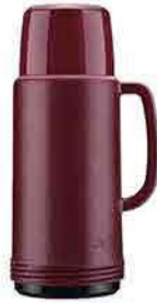
15260 GARRAFA TÉRMICA INVICTA IDEAL UVA | 1X1 LT 7891691084317