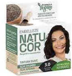
9240 TINTURA NATUCOR CASTANHO ESCURO 3.0 | 1 UNID 7896013502166