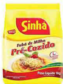
1489 FUBA PRÉ-COZIDO SINHA | 20X1KG 7892300030633