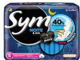
3066 ABSORVENTE SYM C/ABAS NOTURNO SUAVE | 12X8 UNID 7896110007892