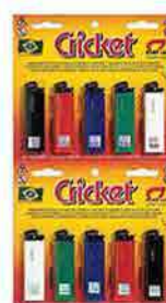
2408 ISQUEIRO CRICKET ORIGINAL CLASSIC | 1X10 UNID 7896280833116