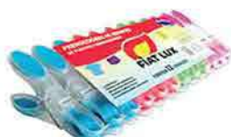
15364 PRENDEDOR DE ROUPA FIATLUX PLÁSTICO EMB. MÉDIO | 1X50 DZ 7896007932221