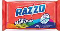
16519 SABÃO TAB. RAZZO TIRA MANCHAS INDIVIDUAL | 1X200 GR 7896023400704