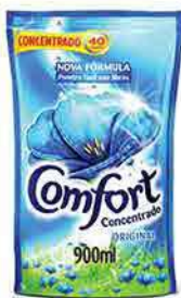
15245 AMACIANTE COMFORT CONC. AZUL NATUREZA | 12X900 ML 7891150054585