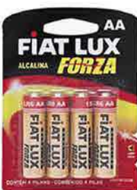
16184 PILHA FIATLUX ALCALINA AA PEQUENA | 1X4 UNID 7896007904273