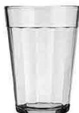
11143 COPO NADIR AMERICANO | 1X24 UNID 7891155003663