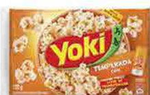
18026 PIPOCA MICROONDAS YOKI TOQUE DE CHEF | 36X100GR 7891095006274