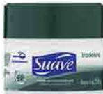
16891 DESODORANTE CREME SUAVE TRADICIONAL | 1X55GR 7891150063136