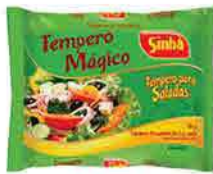
14356 TEMPERO MÁGICO SINHÁ SALADAS | 1X50 GR 7892300002753