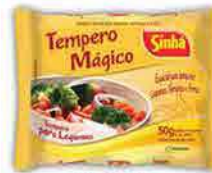
13886 TEMPERO MÁGICO SINHÁ LEGUMES | 1X50 GR 7892300002500