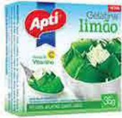
12608 GELATINA APTI LIMÃO | 36X35 GR 7896327514145