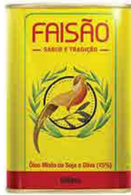
499 ÓLEO COMPOSTO FAISÃO | 6X500ML 7896760901700