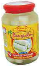
12919 PALMITO TOLETE BRASPALM | 1X300GR 7891500251749