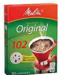
7954 COADOR MELITTA DE PAPEL 102 | 6X30 UN 7891021001908