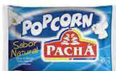
8932 PIPOCA MICROONDAS PACHA NATURAL | 24X100GR 7896602901011