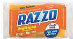
11095 SABÃO TAB. RAZZO GLICER. AMARELO INDIVID. | 60X200 GR 7896023400896