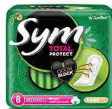
6484 ABSORVENTE SYM NORMAL S/ABAS SUAVE | 12X8 UNID 7896110002255