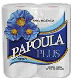
13775 PAPEL HIGIÊNICO PAPOULA NEUTRO 30MT | 16X4 UNID 7898937601086