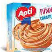
12633 PUDIM CARAMELO APTI | 1X50 GR 7896327514923