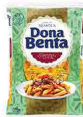
12961 MACARRÃO DONA BENTA SÊMOLA PENNA | 24X500GR 789605281697