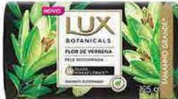
15433 SABONETE LUX SUAVE FLOR DE VERBENA VERDE | 12X125GR 7891150060272