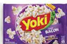
6945 PIPOCA MICROONDAS YOKI BACON | 36X100GR 7891095110723