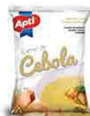
16249 CREME DE CEBOLA APTÍ | 1X68 GR 7896327512264