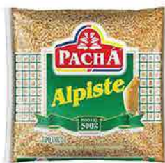
7130 ALPISTE PACHA | 20X500GR 7896602900014