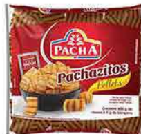
2734 PURURUCA PACHÁ LISTRADA | 12X400GR 7896602909895