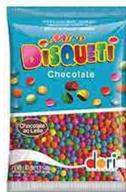
13262 DISQUETI DORI MINI 1X500 GR 7896058505559