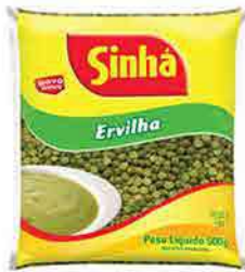
17671 ERVILHA PARTIDA SINHA | 12X500GR 7892300001763