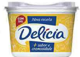
2157 MARGARINA DELÍCIA 70% LIPÍDIO | 12X500GR 7891080400087