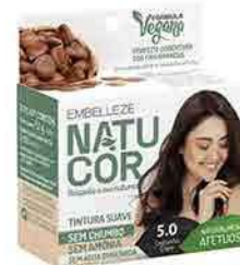
9242 TINTURA NATUCOR CASTANHO CLARO 5.0 | 1 UNID 7896013502791