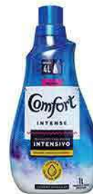
15247 AMACIANTE COMFORT CONC. AZUL ORIGINAL | 12X1LT 7891150028944