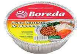
1454 MARMITEX BOREDA F. MANUAL N.9 | 1X100UNID 7897384700106