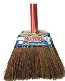
11634 VASSOURA PIAÇAVA MUNDIAL N.3 CABO PLÁST | 1X12 UNID 7898062140016