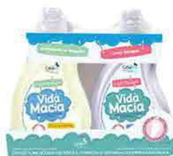
17766 KIT VIDA MACIA L.ROUPA SEM AMAC. G&CAMOMILA | 6X2X1 LT 17896040707678