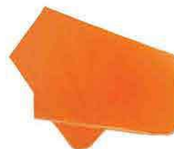
8504 FLANELA ZEBINA 28X48 1X12 UNID 7898151450149