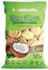
17513 SEQUILHOS COCO BOMEISCOITO ZERO LACTOSE/GLU | 1X320GR 789829283239