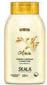
7620 HIDRATANTE SKALA AVEIA | 1X500 ML 7897042005215