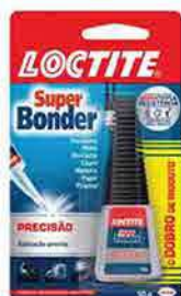
17214 COLA SUPER BONDER PRECISÃO | 12X10GR 7891200015627