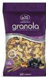
16437 GRANOLA WS AÇAI | 1X500GR 7898928727184