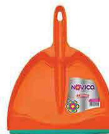
13266 PÁ DE LIXO PLÁSTICA NOVICA CLIPA | 1 UNID 7896001001459