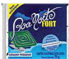
10643 INSET. ESPIRAL BOA NOITE FORT | 1X10 UNID 7896084904012