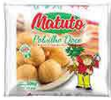
7559 POLVILHO DOCE MATUTO | 20X500GR 7896035921037