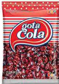
12995 BALA DORI GOTA COLA | 1X600 GR 7896058591682