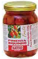
16460 PIMENTA BIQUINHO NATIVO VIDRO | 1X235 GR 7897052202703