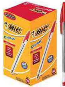
489 CANETA BIC CRISTAL VERMELHA | 1X50UNID 70330129634