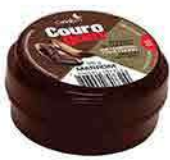
17824 CERA P/CAÇADO COURO BOM PASTA MARROM | 1X36 GR 7896040707329