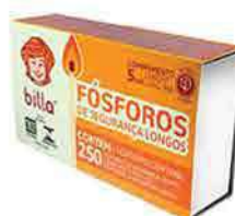
18016 FÓSFOROS BILLA LONGO | 1X10 UNID 7898958192075