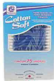
13186 HASTES FLEXÍVEIS THEOTO COTTONSOFTAZ | 12X75UND 7891334190603