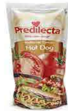
9668 MOLHO PREDILECTA HOT DOG TOMATE STAND UP | 24X340GR 7896292306424