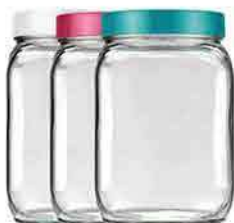
10164 POTE INVICTA QUADRADO MÉDIO SORTIDO | 1X1,3LT 7891691028519