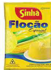
8047 FLOCÃO DE MILHO SINHÁ | 20X500GR 7892300000933