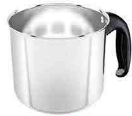
12496 CANECO FERVEDOR Nº 14 | 1UNID 7898147772378