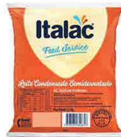
12887 LEITE CONDENSADO ITALAC SEMIDESN. BAG | 1X2,5 KG 7898080640857