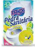
17750 PEDRA SANITÁRIA TRIEX FRUTAS CÍTRICAS | 12X25GR 7896527702090