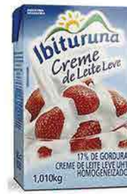
17584 CREME DE LEITE IBITURUNA LEVE TP | 1X1.01KG 7896401600047