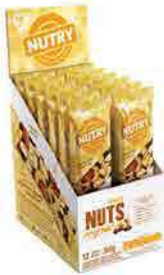
15122 BARRA NUTS NUTRY DISPLAY ORIGINAL | 12X30 GR 7891331015046