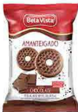
18854 BISCOITO AMANTEIG. BELA VISTA CHOCOLATE | 1X310GR 7896061300769