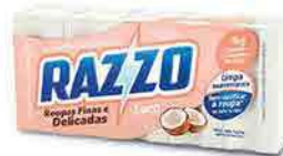
1097 SABÃO TAB. RAZZO COCO | 12X5X200 GR 7896023400094