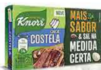
6657 CALDO KNORR COSTELA | 10X57 GR 7894000077468