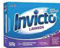
12911 LAVA-ROUPAS EM PÓ INVICTO LAVANDA | 24X500 GR 7898031172949