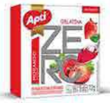
12617 GELATINA APTI ZERO MORANGO SILVESTRE | 12X12 GR 7896327513919