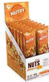
15115 BARRA NUTS NUTRY DISPLAY DAMASCO | 12X30 GR 7891331014834