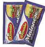
13960 MAIONESE D' MAIS SACHÊ | 156X6GR 7898958172077