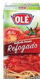
12916 MOLHO REFOGADO OLÉ TP | 24X520GR 7891032015109