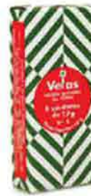
14052 VELA NOSSA SRª DA PENHA Nº3 17GR | 24X8UNID 7896335100033