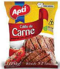
13686 CALDO APTI CARNE SACHÊ | 1X1,05 KG 7896327511427