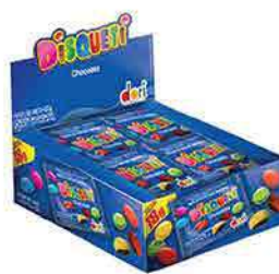
2735 DISQUETI DORI 24X18 GR 7896058500189