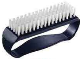
10836 ESCOVA PARA UNHAS CONDOR | 24X1 UNID 7891055500903