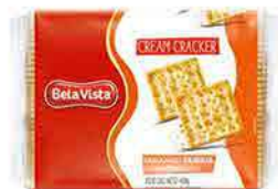
18838 BISCOITO BELA VISTA CREAM CRAKER | 20X400GR 859020000800