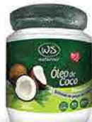
16434 ÓLEO DE COCO WS VIDRO | 1X200ML 7898928727818