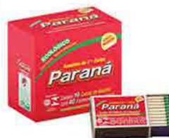
14011 FÓSFOROS PARANÁ VERMELHO | 20X10 UNID 7896080902043