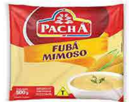
7769 FUBA PACHA 20X500GR 7896602900595