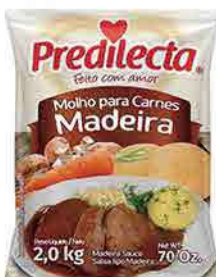
78 MOLHO PREDILECTA MADEIRA BAG | 1X2KG 7896292311817