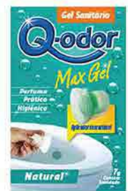
15996 GEL SANITÁRIO Q-ODOR NATURAL | 1X7GR 7897434401496