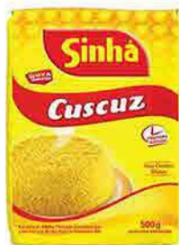
1165 CUSCUZ SINHÁ 30X500GR 7892300000698