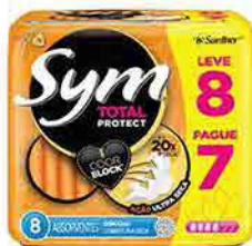
11908 ABSORVENTE SYM C/ABAS AÇÃO ULTRASSECA LV8 PG7 | 1X8 UNID 7896110007908