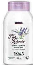
15278 HIDRATANTE SKALA LAVANDA | 1X500 ML 7897042008735