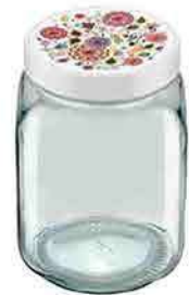
16409 POTE INVICTA QUADRADO MÉDIO DEC.SORT. | 1X1,3LT 7891691008436