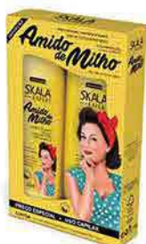
15344 SHAMPOO+CONDICIONADOR SKALA AMIDO DE MILHO | 2X325 ML 7897042013845