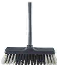
17514 VASSOURA SUTILE 1 UNID 7898650900381