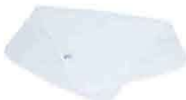
16939 FLANELA ZEBINA 28X38 BRANCA EMB. ECONOMICA | 1X10 UNID 7898151450385