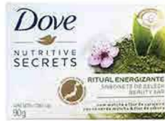
17298 SABONETE DOVE RITUAL ENERGIZANTE | 6X90GR 7891150064980