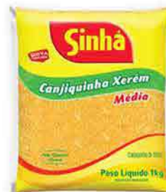
1087 CANJIQUEINHA SINHÁ XEREM MÉDIA | 20X1KG 7892300004504