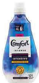
16321 AMAC. COMFORT CONC. INTENSE CUIDADO ESSENCIAL | 9X1,5 LT 7891150065178