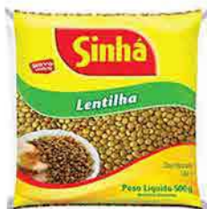
17673 LENTILHA SINHÁ | 12X500GR 789230001848