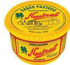
7639 SABÃO PASTOSO NEUTRAL | 18X500 GR 7896270200805