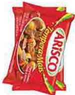
9608 TEMPERO ARISCO EM PÓ CARNES | 24X50 GR 7891150051652