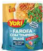
18031 FAROFA PRONTA YOKI SUAVE | 1X200GR 7891095030040