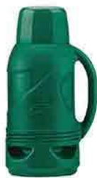
15258 GARRAFA TÉRMICA INVICTA LIDER VERDE FOLHA | 1X500 ML 7891691080128