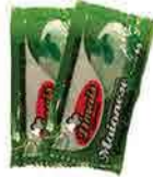
14716 MAIONESE D' MAIS ERVAS FINAS SACHÊ | 156X6GR 7898958172107