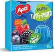
12612 GELATINA APTI TUTTI FRUTTI | 36X35 GR 7896327514176