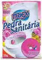
17751 PEDRA SANITÁRIA TRIEX JARDIM ROSAS | 12X25GR 7896527702076