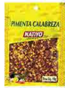
12357 PIMENTA CALABRESA NATIVO | 15X10 GR 7897052200716