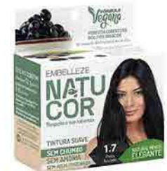
9244 TINTURA NATUCOR PRETO AZULADO 1.7 | 1 UNID 7896013502906