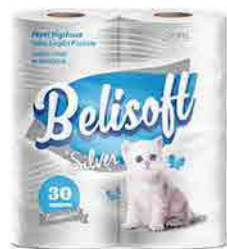
17607 PAPEL HIGIÊNICO BELISOFT NEUTRO 30MT | 16X4 UNID 7898945448413