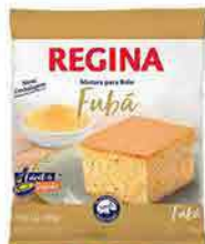
10033 MISTURA PARA BOLO REGINA FUBÁ | 12X400GR 7896093300317