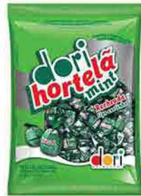
12994 BALA DORI HORTELÃ MINT RECHÇADA | 1X600 GR 7896058591620