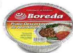
2373 MARMITEX BOREDA F. MANUAL N.8 | 1X100UNID 7897384700076