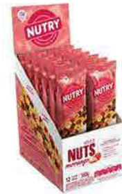
15117 BARRA NUTS NUTRY DISPLAY MORANGO | 12X30 GR 7891331014865