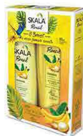
15342 SHAMPOO+CONDICIONADOR SKALA BANANA/BACURI | 2X325 ML 7897042013838