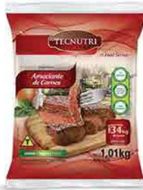
16470 AMACIANTE DE CARNE TECNUTRI SACHÊ | 1X1,01 KG 7898286805630