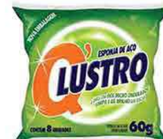
2641 LÃ DE AÇO BOMBRILO LUSTRO | 14X8 UNID 7891022850031