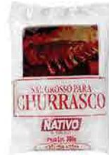
16461 SAL GROSSO NATIVO | 10X300 GR 7897052204424