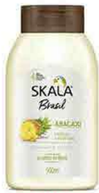
17490 HIDRATANTE SKALA ABACAXI | 1X500 ML 7897042013708