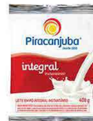
8666 LEITE EM PÓ PIRACANJUBA INT. INSTANTÂNEO SACHÊ | 5X400GR 7898215152439