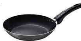
10650 FRIGIDEIRA ANTIADERENTE PANELUX 24CM | 1UNID 7898147771821