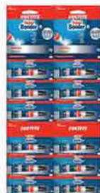
7501 COLA SUPER BONDER ORIGINAL CARTELA | 12X3GR 7891200294466