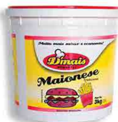
16933 MAIONESE D' MAIS BALDE | 1X3KG 7898994084785