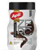
14792 ACHOCOLATADO APTI ZEROPT | 1X210GR 7896327515296