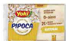
18028 PIPOCA MICROONDAS YOKI PREMIUM NATURAL | 36X90GR 7891095030194