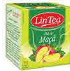
11948 CHÁ LINTEA MAÇÃ 30GR | 1X10UNID 7891095001439