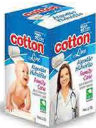
8625 ALGODÃO COTTON ROLO | 6X50GR 7898095296520