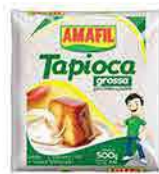
9946 TAPIOCA GROSSA AMAFIL | 20X500GR 7896035941813