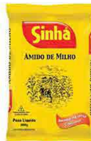
14312 AMIDO DE MILHO SINHÁ SACHE | 1X500GR 7892300002692