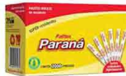
13352 PALITO DENTAL EMBALAGEM INDIVIDUAL PARANA | 1X2000 UN 7896080900032