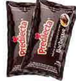
16155 MOLHO PREDILECTA BARBECUE SACHÊ 7GR | 192X7GR 17896292311906