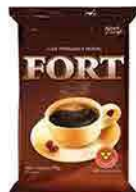
14222 CAFÉ 3 CORAÇÕES FORT | 20X250GR 7896005800539