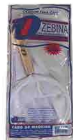
11474 COADOR ZEBINA MADEIRA DM12,5 | 1X24UN 7898151450187