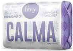
6399 SABONETE LIVY CALMA LAVANDA E CAMOMILA | 12X85GR 7896023408199