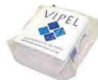
3055 GUARDANAPO VIPEL 20X22 | 1X60X50 UNID 7898388822856