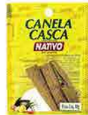
12305 CANELA EM CASCA NATIVO | 15X10 GR 7897052200839