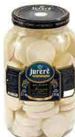
14313 PALMITO RODELA JURERÉ JUÇARA | 1X1.8KG 7896314616036