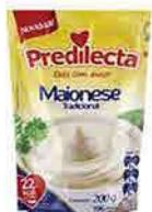
16153 MAIONESE PREDILECTA STAND UP | 24X200GR 7896292360433