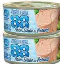
1637 ATUM SÓLIDO 88 NATURAL | 12X170GR 7891167035485