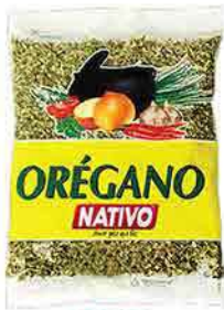
15168 ORÉGANO NATIVO 1X1 KG 7897052202383