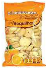
13275 SEQUILHOS LARANJA BOMBISCOITO ZERO LACTOSE/GLU | 1X320GR 7898249283246