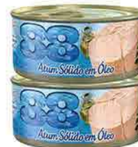
2182 ATUM SÓLIDO 88 ÓLEO | 12X170GR 7891167031685