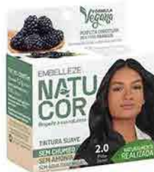
9246 TINTURA NATUCOR PRETO SUAVE 2.0 | 1 UNID 7896013502944