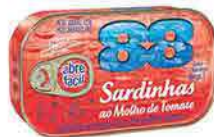
7971 SARDINHA 88 TOMATE ABRE FÁCIL | 25X125GR 7891167023024