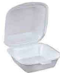
16197 HAMBURGUEIRA COPOPLAST CH-02 | 1X200UNID 17898604231278