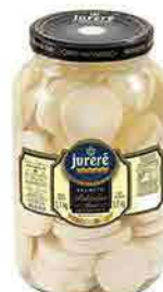
10710 PALMITO RODELA JURERÉ PALMEIRA REAL | 1X1.8KG 7896314611703