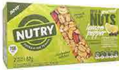
17755 BARRA NUTS NUTRY CAIXA LIMÃO/PIMENTA | 2X31 GR 7891331015848