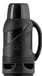
15256 GARRAFA TÉRMICA INVICTA LIDER PRETO | 1X500 ML 7891691280122