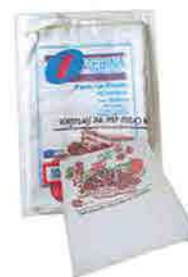
16937 PANO DE PRATO ESTAMPADO ZEBINA 68X38 | 1X12 UNID 7898151450163