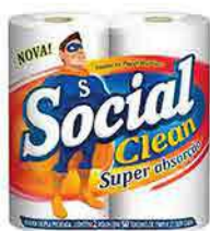
11604 TOALHA DE PAPEL SOCIAL CLEAN | 12X2 UNID 7896914000716