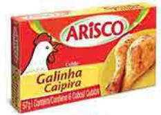
9607 CALDO ARISCO GALINHA CAIPIRA | 10X57 GR 7891700080415