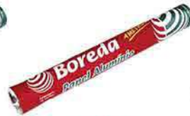
10948 ROLO ALUMÍNIO BOREDA 45CM C/4,0MT | 1X25 UNID 7897384700090