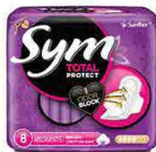
6483 ABSORVENTE SYM NORMAL C/ABAS SUAVE | 12X8 UNID 7896110002248