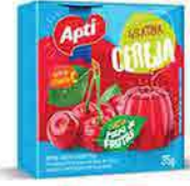
12605 GELATINA APTI CEREJA | 36X35 GR 789632751415