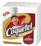
18802 GUARDANAPO COQUETEL 30X33 | 18X50 UNID 7896301800073