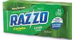
1176 SABÃO TAB. RAZZO FRESH LIMÃO | 12X5X200 GR 7896023400032