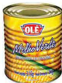
5579 MILHO VERDE OLÉ LATA | 1X2KG 7891032011156