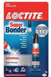
9651 COLA SUPER BONDER ORIGINAL | 24X3GR 7891200190942