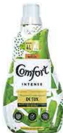
16898 AMAC. COMFORT CONC. INTENSE CUIDADO NATUREZA | 12X1LT 7891150063938