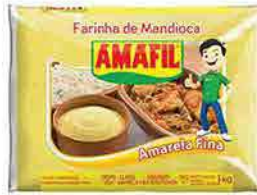
16157 FARINHA DE MANDIOCA AMARELA FINA AMAFIL | 20X1KG 7896035910055