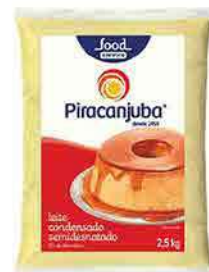
8885 LEITE CONDENS. PIRACANJUBA SEMIDESN. BAG | 1X2,5 KG 7898215152033