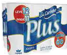
10713 PAPEL HIGIÊNICO CARINHO PLUS NEUT. 60MT L12P11 | 4X12 UNID 7896339811133