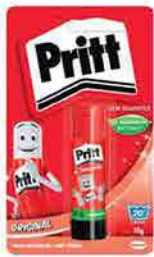
14615 COLA BASTÃO PRITT SM | 1X10GR 7891200003341