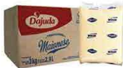
12147 MAIONESE D'AJUDA BAG | 1X3KG 7896054906039