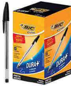
488 CANETA BIC CRISTAL PRETA | 1X50UNID 70330129665