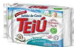
17878 SABÃO TAB. TEIÚ COCO MARMORIZADO | 1X200 GR 7896394800738