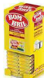
15882 ESPONJA BOMBRIL MULTIUSO DISPLAY | 1X30 UNID 7891022860962