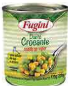
17686 DUETO MILHO+ERVILHA FUGINI LATA | 24X170GR 7897517209414