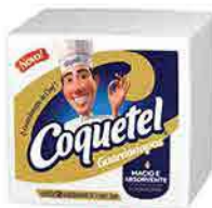
12083 GUARDANAPO COQUETEL 22X23 | 40X50 UNID 7896301800028