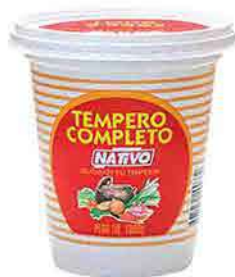
12370 TEMPERO COMPLETO NATIVO | 1X1 KG 7897052200372