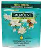
16281 SABONETE LIQ. PALMOLIVE SUAVE DELIC. JASMIN CACAU RF | 1X120 ML 7891024040126