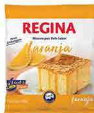
10034 MISTURA PARA BOLO REGINA LARANJA | 12X400GR 7896212700219