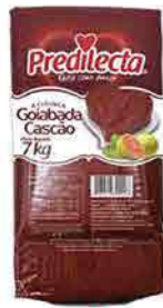
1647 GOIABADA PREDILECTA CASCAO | 1X7KG 7896292300026