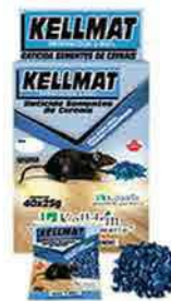
16945 RATICIDA SEMENTES CEREAIS KELLMAT DISP. | 1X40X25 GR 7898374661384