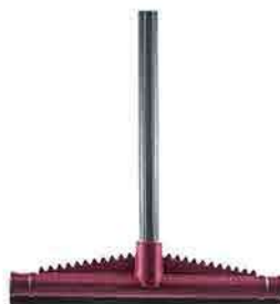
17521 RODO 30CM MULTILAR ROD-0 | 1 UNID 7898650900411