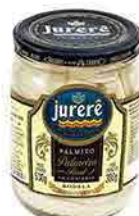
10299 PALMITO RODELA JURERÉ PALMEIRA REAL | 1X300GR 7896314611307