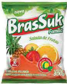
16954 REFRESCO BRASSUK SALADA DE FRUTA | 1X300 GR 7896683401998