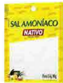
12362 SAL AMONÍACO NATIVO | 15X80 GR 7897052200051