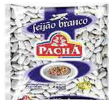
7448 FEIJÃO BRANCO PACHA | 10X500GR 7896602900175