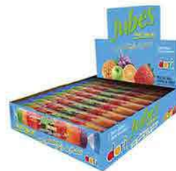
15327 GOMA DORI JUBES TUBO GELATINA | 20X48 GR 7896058593570