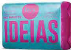
6397 SABONETE LIVY IDEIAS JASMIM PATCHOULI | 12X85GR 7896023408182