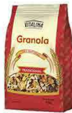
15965 GRANOLA VITALINA | 1X450GR 7898616300019