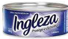
237 CERA INGLEZA PASTA INCOLOR | 12X400 GR 7891242010420