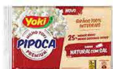
18029 PIPOCA MICROONDAS YOKI PREM. NATURAL C/SAL | 36X90GR 7891095030200