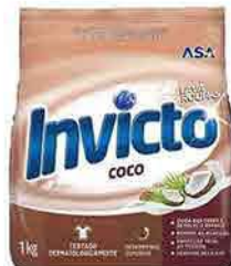
17844 LAVA-ROUPAS EM PÓ INVICTO COCO SACHÉ | 16X1KG 7898031173472