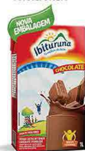
14400 ACHOCOLATADO IBITURUNA LÍQUIDO | 12X1,01LT 7896401600535