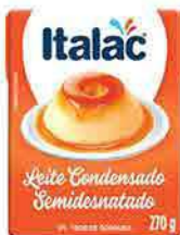
12886 LEITE CONDENSADO ITALAC SEMIDESNATADO TP | 24X270GR 7898080640529