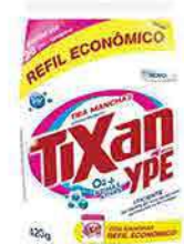
16233 TIRA MANCHAS TIXAN YPÊ PÓ BRANCA SACHÊ | 1X420 GR 7896098901298