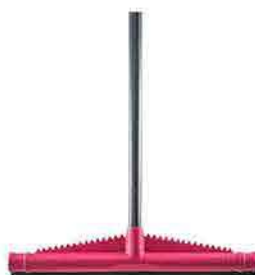
17515 RODO 40CM MULTILAR ROD-0 | 1 UNID 7898650900428