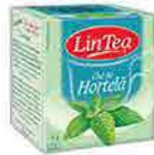
11945 CHÁ LINTEA HORTELÃ 10GR | 1X10UNID 7891095001385