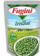
12521 ERVILHA FUGINI SACHÊ | 32X200GR 7897517209056