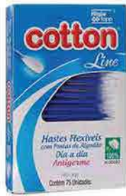
8505 HASTES FLEXÍVEIS COTTON AZUL | 12X75UND 7898095296018