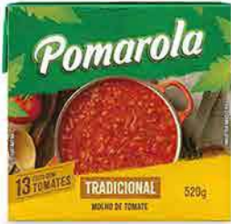
4786 MOLHO POMAROLA TRADICIONAL TP | 12X520GR 7896036095102