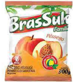
16033 REFRESCO BRASSUK PÊSSEGO | 1X300 GR 7896683402360