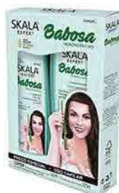
16011 SHAMPOO+CONDICIONADOR SKALA BABOSA | 2X325 ML 7897042014026