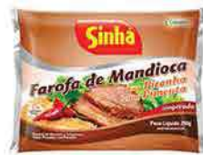
14305 FAROFA PRONTA SINHA PICANHA | 1X250GR 7892300001978