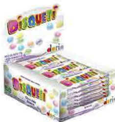
15331 DISQUETI DORI CHOCOLATE BRANCO | 18X40 GR 7896058593402