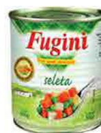
17685 SELETA DE LEGUMES FUGINI LATA | 24X200GR 7897517209292