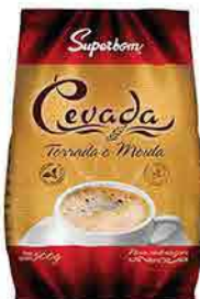
5698 CAFÉ DE CEVADA SUPERBOM | 12X500GR 7896024801104