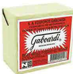
441 FÓSFOROS GABOARDI 20X10 UNID 7896279200103