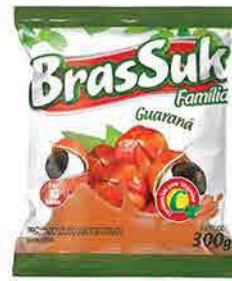
16027 REFRESCO BRASSUK GUARANA | 1X300 GR 7896683402377