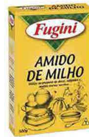
17992 AMIDO DE MILHO FUGINI CAIXA | 1X500GR 7897517203610