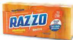
109 SABÃO TAB. RAZZO GLICER. AMARELO | 12X5X200 GR 7896023400056