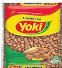
13410 AMENDOIM YOKI | 12X500GR 7891095011605