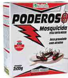
16947 INSET. KELLDRIN MATA MOSCAS GRAN. PODEROSO | 2X30 GR 7891021000925