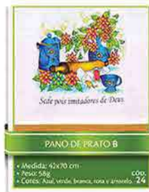
16126 PANO DE PRATO ESTAMPADO ITATEX 42X70 | 1X10 UNID 7898093784111