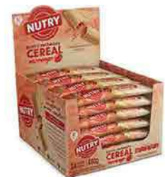
15089 BARRA RECHEADA NUTRY DISPLAY MORANGO | 24X20 GR 7891331008796