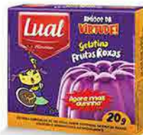
16294 GELATINA LUAL AMIGOS DA VIRTUDE FRUTAS ROXAS | 36X20 GR 7896683409178