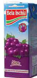
10770 SUCO BELA ISCHIA TP UVA(NECTAR) | 1X1LT 7898063763597