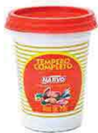
12369 TEMPERO COMPLETO NATIVO | 12X250 GR 7897052200358