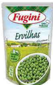
14823 ERVILHA FUGINI SACHÊ | 1X2KG 7897517209339