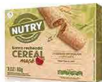
15828 BARRA RECHEADA NUTRY CAIXA MAÇA | 3X20 GR 7891331008697