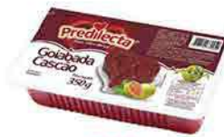
4134 GOIABADA PREDILECTA CASCAO | 24X350GR 7896292370050