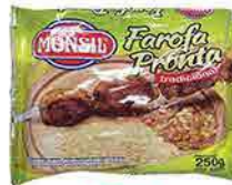
15130 FAROFA PRONTA MONSIL | 1X250GR 7896035912127