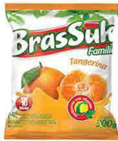
16034 REFRESCO BRASSUK TANGERINA | 1X300 GR 7896683402094