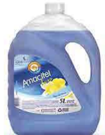
17439 AMACIANTE AMACITEL AZUL TOQUE DE POESIA | 1X5LT 7896040707008