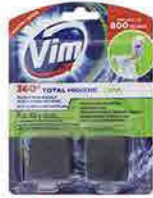
16327 BLOCO SANITÁRIO CAIXA ACOPLADA VIM LIMA | 1X100GR 8717163672037