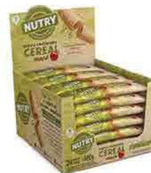
15090 BARRA RECHEADA NUTRY DISPLAY MAÇA | 24X20 GR 7891331008789