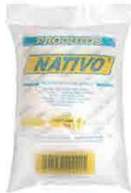
16462 BICARBONATO DE SÓDIO NATIVO | 1X1 KG 7897052202215