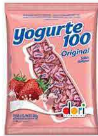
12992 BALA DORI YOGURTE 100 | 1X600 GR 7896058591507