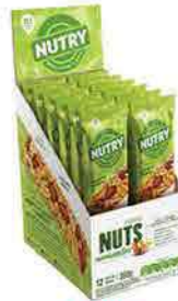
15113 BARRA NUTS NUTRY DISPLAY SEMENTES | 12X30 GR 7891331014780