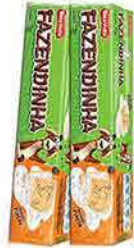
18866 BISCOITO RECH. FAZENDINHA FLOCOS | 40X130GR 7896061300264