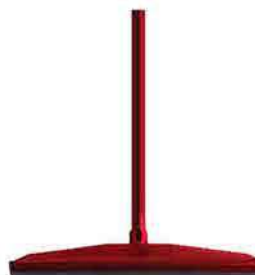
14361 RODO EVA ENXUTO 40CM CONDOR | 1 UNID 7891055112502