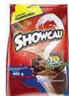
8178 ACHOCOL. EM PÓ SHOWCAU PREDILECTA | 24X400GR 7896292310742