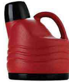
7980 GARRAFÃO TÉRMICO INVICTA VERMELHA | 1X3 LT 7891691187032