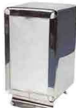
6830 GUARDANAPO VIPEL 14X14 | 1X5X400 UNID 7898388820050