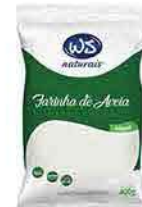
16436 FARINHA DE AVEIA WS | 1X400GR 7898988727269