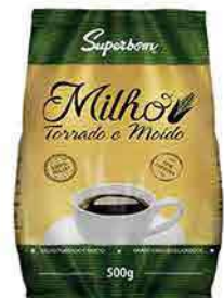
17557 CAFÉ DE MILHO SUPERBOM | 12X500GR 7896024810908