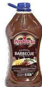
17702 MOLHO PREDILECTA BARBECUE GALÃO | 1X3.5KG 7896292315327