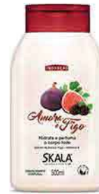
16347 HIDRATANTE SKALA AMORA E FIGO | 1X500 ML 7897042011421