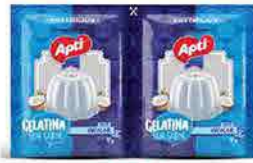
12614 GELATINA APTI SEM SABOR INCOLOR SACHÊ | 15X24 GR 7896327511472