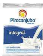
14262 LEITE EM PÓ PIRACANJUBA INTEGRAL SACHÊ | 10X200GR 7898215152330