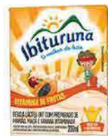
4805 BEBIDA LÁCTEA VITAMINA DE FRUTAS IBITURUNA | 27X200ML 7896401600788