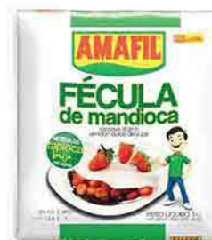
7878 FÉCULA DE MANDIOCA AMAFIL | 20X1KG 7896035940045