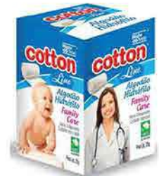
8391 ALGODÃO COTTON ROLO | 10X25GR 7898095296513