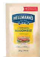
1064 MAIONESE HELLMANN'S SACHÊ | 24X200GR 7894000030470