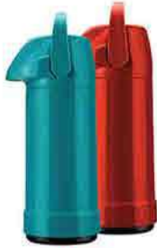
7983 GARRAFA TÉRMICA INVICTA PRESSÃO LISA SORT | 1X1 LT 7891691073113