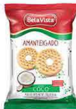
18855 BISCOITO AMANTEIGADO BELA VISTA COCO | 1X310GR 7896061300776