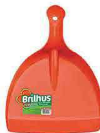
13268 PÁ DE LIXO PLÁSTICA BRILHUS | 1 UNID 7896001020207