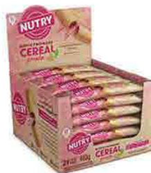
15091 BARRA RECHEADA NUTRY DISPLAY GOIABA | 24X20 GR 7891331014216