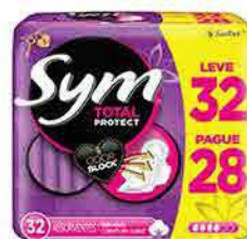
17612 ABSORV. SYM NORMAL C/ABAS SUAVE LV32 PG28 | 1X32 UNID 7896110094601