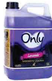
16466 SABONETE LIQUIDO ONLY LAVANDA | 1X5LT 7897534802063