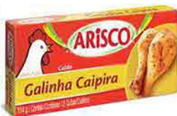
10384 CALDO ARISCO GALINHA CAIPIRA | 1X114 GR 7891700080439