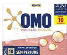
16489 LAVA-ROUPAS EM PÓ OMO MICELAR S/PERFUME | 20X800 GR 7891150072121