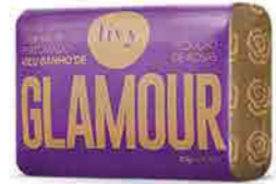
12059 SABONETE LIVY GLAMOUR FLORAL BOUQUET | 12X85GR 7896023408205