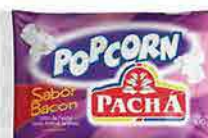
8930 PIPOCA MICROONDAS PACHA BACON | 24X100GR 7896602901066