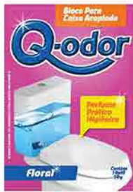
15989 BLOCO SANITÁRIO CX.ACOPLADA Q-ODOR FLORAL | 1X36UNID 7897434401687