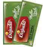
12641 MOLHO VERDE D'AJUDA SACHÊ | 192X7GR 7896054907227