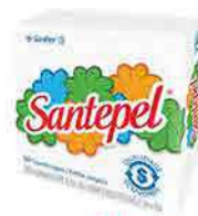
6918 GUARDANAPO SANTEPEL 33X30 | 1X48X50 UNID 7896110083353