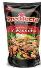
10016 MOLHO PREDILECTA YAKISOBA STAND UP | 24X300GR 7896292307544