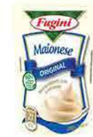
17986 MAIONESE FUGINI SACHÊ | 36X200GR 7897517205508