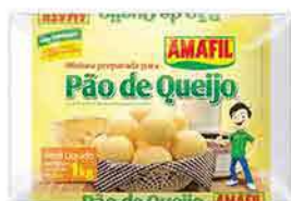
9947 MISTURA PARA PÃO DE QUEIJO AMAFIL | 1X1KG 7896035931050