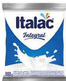
17478 LEITE EM PÓ ITALAC INTEGRAL SACHÊ | 1X800GR 7898080642196