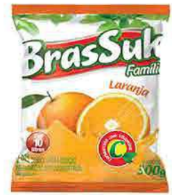
16028 REFRESCO BRASSUK LARANJA | 1X300 GR 7896683402001