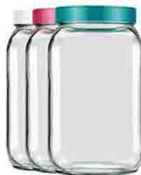
10165 POTE INVICTA QUADRADO GRANDE SORTIDA | 1X2 LT 7891691028472