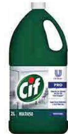
17710 LIMPADOR CIF MULTIUSO PROFISSIONAL | 1X2LT 7891150065215