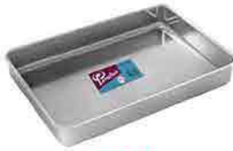
12494 ASSADEIRA RETANGULAR Nº4 | 1UNID 7898147772040