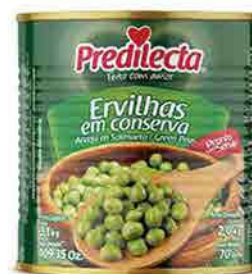
8087 ERVILHA PREDILECTA LATA | 1X2KG 7896292304895