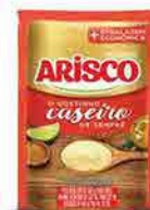
15673 MAIONESE ARISCO SACHÊ | 12X400GR 7891150056930