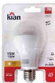
13760 LÂMPADA KIAN LED 15W BIVOLT | 1 UNID 7899710006579