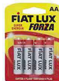
16180 PILHA FIATLUX COMUM AA PEQUENA | 1X4 UNID 7896007974276