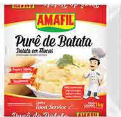
12918 PURE DE BATATAS EM FLOCOS AMAFIL SACHÊ | 1X1KG 7896035970981