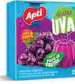
12613 GELATINA APTI UVA | 36X35 GR 7896327514121