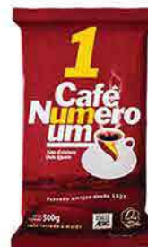
10190 CAFÉ NÚMERO UM | 10X500GR 7896212700028