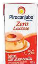
13248 LEITE CONDENS. PIRACANJUBA ZEROLACT. TP | 27X395 GR 7898215151999