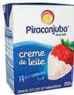
6629 CREME DE LEITE PIRACANJUBA LEVE TP | 27X200GR 7898215151784