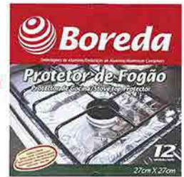
5796 FORRA FOGÃO BOREDA | 10X12 UNID 7897384700052