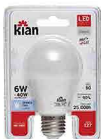
13757 LÂMPADA KIAN LED 6W BIVOLT | 1 UNID 7899710006517