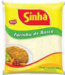
17674 FARINHA DE ROSCA SINHA | 12X500GR 7892300001800