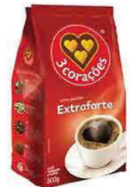
13831 CAFÉ 3 CORAÇÕES EXTRA FORTE | 10X500GR 7896005801529