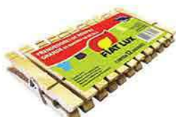
15362 PRENDEDOR DE ROUPA FIATLUX MADEIRA GRANDE | 1X50 DZ 7896007932122