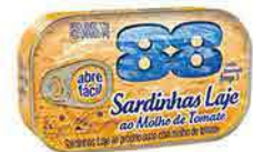
15715 SARDINHA 88 LAJE TOMATE ABRE FÁCIL | 25X125GR 7891167023062