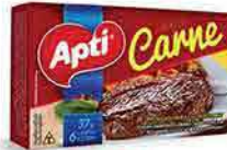
12651 CALDO APTI CARNE 10X57 GR 7896327513223