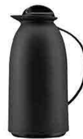
10163 GARRAFA TÉRMICA INVICTA VG PRETO | 1X750 ML 7891691188039