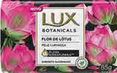
15428 SABONETE LUX SUAVE FLOR DE LOTUS ROSA | 12X85GR 7891150059924