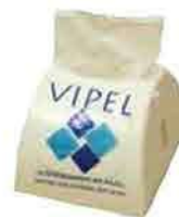
16902 GUARDANAPO VIPEL INTERC. 10X21 | 12X250 UNID 7898388821330