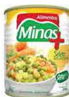
13460 SELETA DE LEGUMES MINAS MAIS LATA | 24X200GR 7898598210559