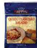
9876 QUEIJO RALADO RETTIS | 20X50GR 7898114700151