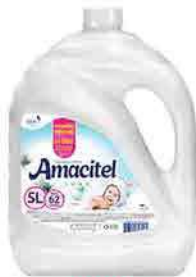
17806 AMACIANTE AMACITEL BRANCO MOMENTO CARINHO | 1X5LT 7896040706995