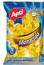
14779 GELATINA APTI MARACUJÁ | 1X1 KG 7896327512295