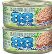
15473 ATUM RALADO 88 NATURAL | 12X140GR 7891167040410