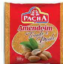
2076 AMENDOIM PACHÁ TORRADO MOÍDO | 10X500GR 7896602900328