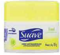
16892 DESODORANTE CREME SUAVE FRESH | 1X55GR 7891150063150