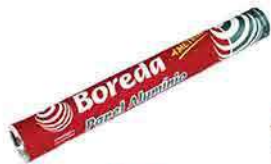
2068 ROLO ALUMÍNIO BOREDA 30 CM C/4,0MT | 1X12 UNID 7897384700083