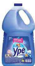
9393 AMACIANTE YPÊ AZUL ACONCHEGO | 1X5 LT 7896098905401