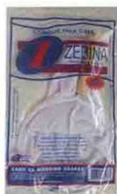
11632 COADOR ZEBINA MADEIRA DM16 GRANDE | 1X24 UN 7898151450064