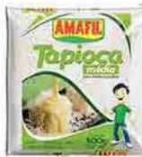
8002 TAPIOCA AMAFIL | 20X500GR 7896035941844