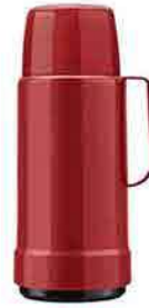
12652 GARRAFA TÉRMICA INVICTA IDEAL VERMELHO | 1X1 LT 7891691184314