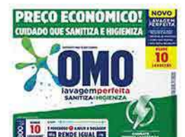
17934 LAVA-ROUPAS EM PÓ OMO LAV. PERF.SANITIZ.CAIXA | 20X800 GR 7891150072138