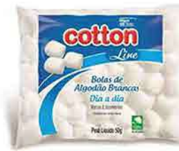
8389 ALGODÃO COTTON BOLA | 6X50GR 7898095296094