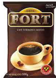
14223 CAFÉ 3 CORAÇÕES FORT | 10X500GR 7896005800546