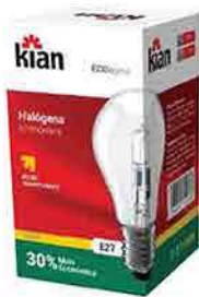
13768 LÂMPADA KIAN HALOGÊNIO ECOLOG. 70WX220V | 1 UNID 7898495149556