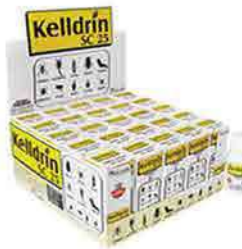
16940 INSETICIDA KELLDRIN SC 25 PARA JARDINAGEM | 1X30 ML 7891021000949