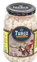
14315 PALMITO PICADO JURERÉ TUNGA PUPUNHA | 1X300GR 7896314614315