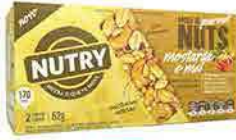
17754 BARRA NUTS NUTRY CAIXA MOSTARDA/MEL | 2X31 GR 7891331015817