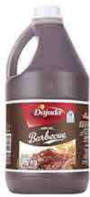
15945 MOLHO D'AJUDA BARBECUE GALÃO | 1X3.6KG 7896054907210