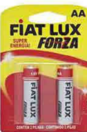
16179 PILHA FIATLUX COMUM AA PEQUENA | 1X2 UNID 7896007974177