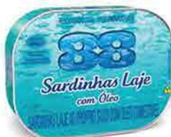
15488 SARDINHA 88 LAJE ÓLEO ABRE FÁCIL | 24X250GR 7891167023147