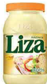
11784 MAIONESE LISA PET | 12X500GR 7896036091326