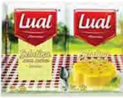
16299 GELATINA LUAL SEM SABOR | 24X24 GR 7896683409901