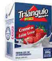
17670 CREME DE LEITE TRIÂNGULO LEVE TP | 27X200GR 7896434920723