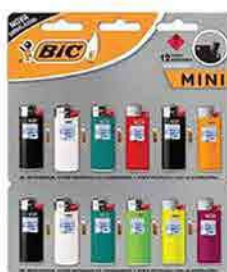
18914 ISQUEIRO BIC MINI LV12 PG11 | 1X50 UNID 70330659056