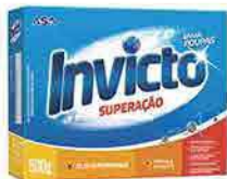
3156 LAVA-ROUPAS EM PÓ INVICTO SUPERACÃO | 24X500 GR 7898031170099