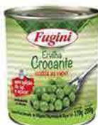
17739 ERVILHA FUGINI VAPOR LATA | 24X170GR 7897517209407