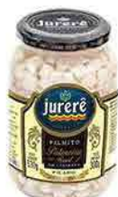
10298 PALMITO PICADO JURERÉ PALMEIRA REAL | 1X300GR 7896314611406