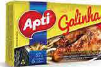
12650 CALDO APTI GALINHA 10X57 GR 7896327513216