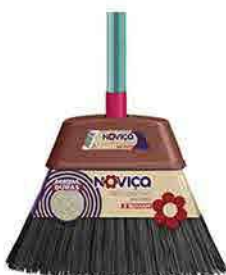
14633 VASSOURA NOVICA PIAÇAVA BETTANIN | 1 UNID 7896001017528