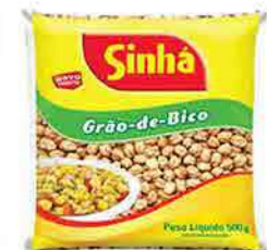
17672 GRÃO DE BICO SINHA | 12X500GR 7892300001824