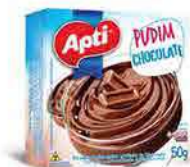
16253 PUDIM CHOCOLATE APTI | 1X50 GR 7896327514909