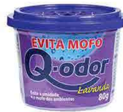
15986 EVITA MOFO Q-ODOR LAVANDA | 1X80GR 7897434401113