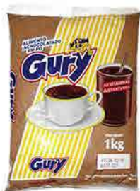
3461 ACHOCOLATADO GURY | 12X1KG 7896274202201