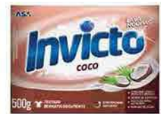
17843 LAVA-ROUPAS EM PÓ INVICTO COCO | 24X500 GR 7898031173441