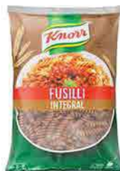
15924 MACARRÃO KNORR FUSILLI INTEGRAL | 20X500GR 7891150062375