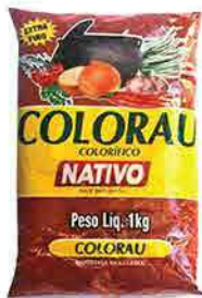
12349 COLORAU NATIVO 1X1 KG 7897052200143