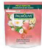
16280 SABONETE LIQ. PALMOLIVE OLEO NUTRITIVO C/CAMELIARF | 1X120 ML 7891024040119