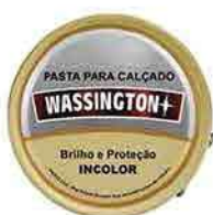
16378 CERA P/CALÇADO WASHINGTON PASTA INCOLOR | 1X36 GR 7793350992646