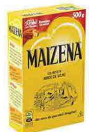
50 AMIDO DE MILHO MAIZENA | 10X500GR 7894000010021