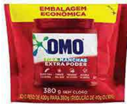
16367 TIRA MANCHAS OMO EM PÓ EXT. PODER SACHÊ | 1X380 GR 7891150062092