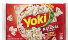
6942 PIPOCA MICROONDAS YOKI NATURAL C/SAL | 36X100GR 7891095002202