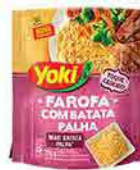
18032 FAROFA PRONTA YOKI COM BATATA PALHA | 1X200GR 7891095030057