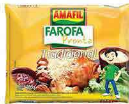
8934 FAROFA PRONTA AMAFIL | 10X500GR 7896035911144