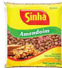
13882 AMENDOIM BRANCO SINHÁ | 12X500GR 7892300002562