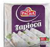
13451 MASSA PARA TAPIOCA PACHA | 20X500GR 7896602903374