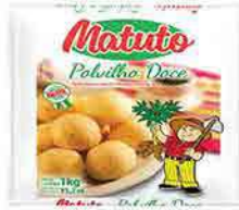
5435 POLVILHO DOCE MATUTO | 20X1KG 7896035921297