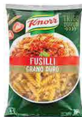
15923 MACARRÃO KNORR FUSILLI GRANO DURO | 20X500GR 7891150062467