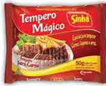
13885 TEMPERO MÁGICO SINHÁ CARNES | 1X50 GR 7892300002487