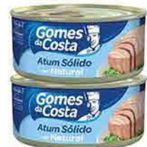
15475 ATUM SÓLIDO GOMES DA COSTA NATURAL | 12X170GR 7891167011755