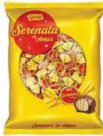
16528 BOMBOM GAROTO SERENATA | 1X825 GR 7891008114126