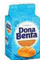
1678 FERMENTO INSTANTÂNEO DONA BENTA FERMIX | 12X125GR 7896005273623