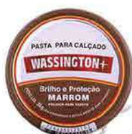
16377 CERA P/CALÇADO WASHINGTON PASTA MARROM | 1X36 GR 7793350020103