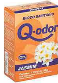
15985 BLOCO SANITÁRIO Q-ODOR REFIL JASMIM | 1X36UNID 7897434401144