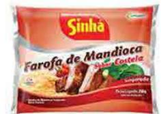
14304 FAROFA PRONTA SINHA COSTELA | 1X250GR 7892300001985