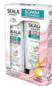
16012 SHAMPOO+CONDICIONADOR SKALA BOMBA DE VITAMINA | 2X325 ML 7897042013814