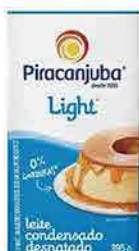
16334 LEITE CONDENSADO PIRACANJUBA LIGHT TP | 27X395 GR 7898215152019