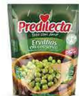
15320 ERVILHA PREDILECTA SACHÊ | 32X200GR 7896292311107