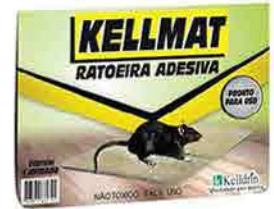
16946 RATOEIRA ADESIVA KELLMAT | 1X25 UN 7898374662794