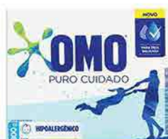
16324 LAVA-ROUPAS EM PÓ OMO PURO CUIDADO | 20X800 GR 7891150064652