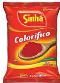
14621 COLORAU SINHÁ 1X500 GR 7892300030602