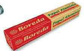
17605 ROLO ALUMÍNIO BOREDA 30 CM C/ 100MT | 1X6 UNID 7897384700342