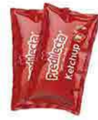
8568 CATCHUP PREDILECTA SACHÊ | 192X7GR 17896292315461