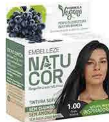
17288 TINTURA NATUCOR PRETO INTENSO 1.00 | 1 UNID 7896013548409