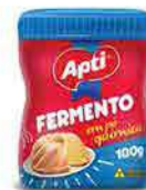
12629 FERMENTO EM PÓ QUÍMICO APTI LATA | 12X100GR 7896327512967