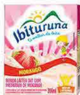
14401 BEBIDA LÁCTEA MORANGO IBITURUNA | 27X200ML 7896401601822