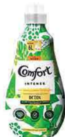
17752 AMACIANTE COMFORT CONC. INTENSE DETOX | 9X1,5 LT 7891150065161