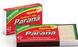
16371 FÓSFOROS PARANÁ ECO GIGANTE 9,5 CM | 1X15 UNID 7896080900285