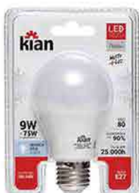
13758 LÂMPADA KIAN LED 9W BIVOLT | 1 UNID 7899710006531