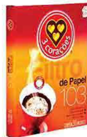
13829 COADOR 3 CORAÇÕES PAPEL 103 | 1X30 UNID 7896005803721