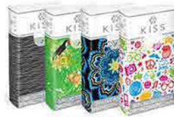
11835 LENÇO FACIAL KISS FOLHA TRÍPLA | 28X10UNID 7896110011141