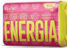
12060 SABONETE LIVY ENERGIA FRUTAS VERMELHAS | 12X85GR 7896023408212