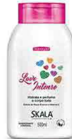
15405 HIDRATANTE SKALA LOVE INTENSE | 1X500 ML 7897042010431