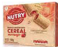
15829 BARRA RECHEADA NUTRY CAIXA MORANGO | 3X20 GR 7891331008710