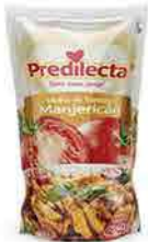
8850 MOLHO PREDILECTA MANJERICÃO STAND UP | 24X340GR 7896292304208