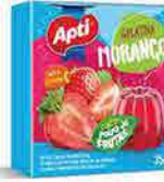
12610 GELATINA APTI MORANGO | 36X35 GR 7896327514114