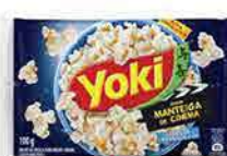
18025 PIPOCA MICROONDAS YOKI MANTEIGA CINEMA | 36X100GR 7891095008452