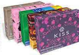
3006 LENÇO FACIAL KISS SORTIDO | 7X50UNID 7896110011158