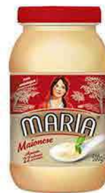
9924 MAIONESE MARIA PET | 12X500GR 7896036092859