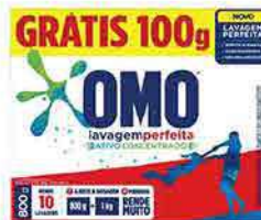
16352 LAVA-ROUPAS EM PÓ OMO LAV. PERFEITA GTS100G | 20X800 GR 7891150064324