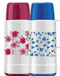
7981 GARRAFA TÉRMICA INVICTA DECORADA SORTIDA | 1X500 ML 7891691083228