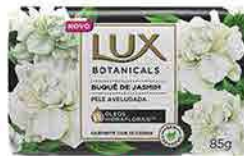
15427 SABONETE LUX SUAVE BUQUÊ DE JASMIM BRANCO | 12X85GR 7891150059849