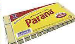
13349 PRENDEDOR DE ROUPA PARANÁ BAMBU | 1X50 UNID 7896080901824