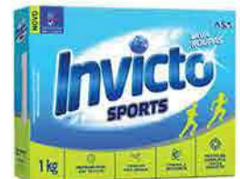
18050 LAVA-ROUPAS EM PÓ INVICTO SPORTS | 20X1 KG 7898031173325