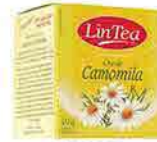
11950 CHÁ LINTEA CAMOMILA 10GR | 1X10UNID 7891095001897