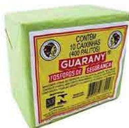
3921 FÓSFOROS GUARANY 20X10 UNID 7898909769035