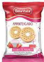
18856 BISCOITO AMANTEIG. BELA VISTA IOGURTE/MORANGO | 1X310GR 7896061300790