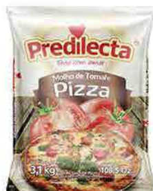
9389 MOLHO PREDILECTA PIZZA BAG | 1X3.1KG 7896292302341