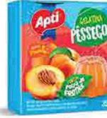
12659 GELATINA APTI PÊSSEGO | 36X35 GR 7896327514190