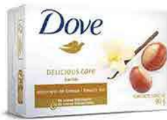
10622 SABONETE DOVE KARITÉ E BAUNILHA | 6X90GR 7891150019560