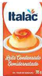
8196 LEITE CONDENSADO ITALAC SEMIDESNATADO TP | 27X395 GR 7898080640413