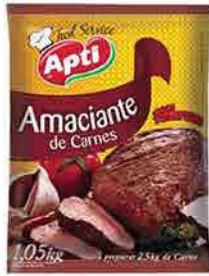
13687 AMACIANTE DE CARNE APTI | 1X1,05 KG 7896327512226