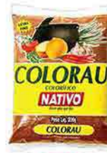
12309 COLORAU NATIVO 15X200 GR 7897052200129