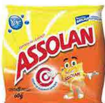
5578 LÃ DE AÇO ASSOLAN 14X8 UNID 7896090122707