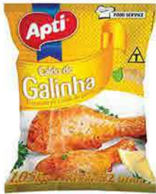
13685 CALDO APTI GALINHA SACHÊ | 1X1,05 KG 7896327511410