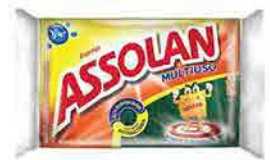
17637 ESPONJA ASSOLAN MULTIUSO | 1X60 UNID 7896090122417