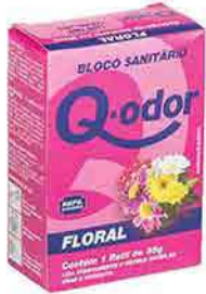
15982 BLOCO SANITÁRIO Q-ODOR REFIL FLORAL | 1X36UNID 7897434400901