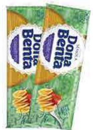
12944 MACARRÃO DONA BENTA SÊMOLA ESPAGUETE | 12X1KG 7896005286531