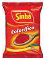
14620 COLORAU SINHÁ 10X100 GR 7892300030596