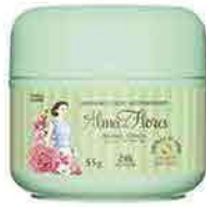
3796 DESODORANTE CREME ALMA DE FLORES | 1X55GR 7891134003950