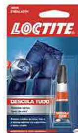
14845 DESCOLA TUDO LOCTITE | 1X2GR 78912000332311