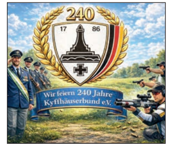
240 Jahre Kyffhäuserbund.