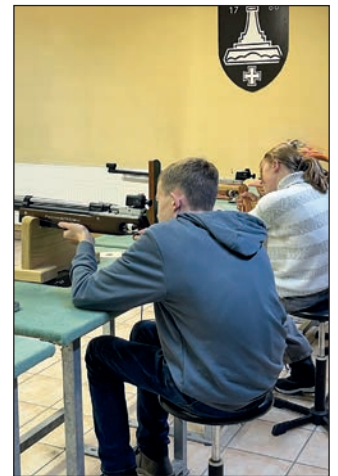
Die Jugend war gut vertreten.

Auch wenn in diesem Jahr etwas weniger Besucher den Weg in die Halle fanden, zeigte die Veranstaltung einmal mehr, wie lebendig und herzlich das Vereinsleben der Kyffhäuser Kameradschaft ist. Die Organi-