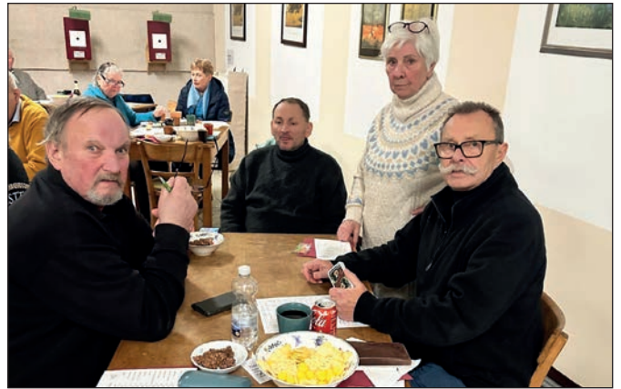
Ehrenvorsitzender spielte Skat.

Wir haben für alle einen Becher mit Würfeln, Skatkarten pro Tisch und die Listen sind vorbereitet. Also ran an die Würfel und Karten!