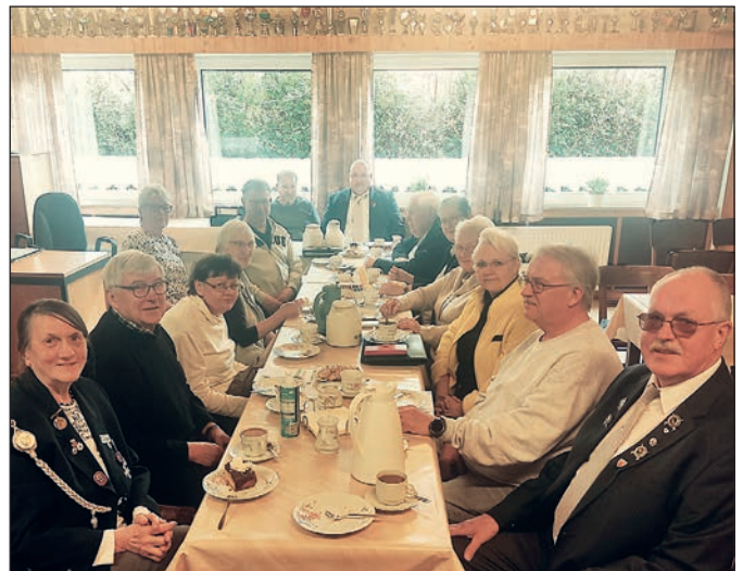
Die Jahreshauptversammlung fand in der Schießhalle der KK Jeddelloh II statt.