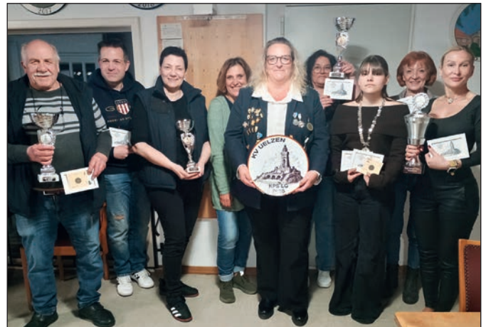
Gemeinsame Siegerehrung auf dem Schießstand in Altenmedingen: Große Freude bei den erfolgreichen Schützinnen und Schützen.

Beim Damen-Pokalschießen ging die Kette an Sammy Joe