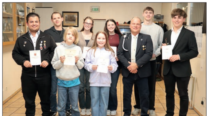
Erfolgreiche Landes- und Bundesmeister.