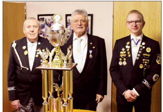
Schießwarte Sieger 2026 unter sich.