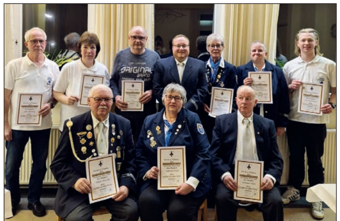
Zahlreiche Ehrungen für langjährige Mitgliedschaften.

Ein besonderer Höhepunkt waren die zahlreichen Ehrungen für langjährige Mitgliedschaften von 10 bis hin zu 50 Jahren. Bei den anschließenden Wahlen zeigte sich große Einigkeit: Nahezu alle Vorstandsmitglieder wurden in ihren Ämtern bestätigt. Eine bedeutende Veränderung ergibt sich