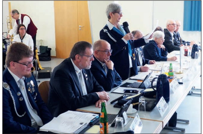
Die Teilnehmer der Landesverbandversammlung.