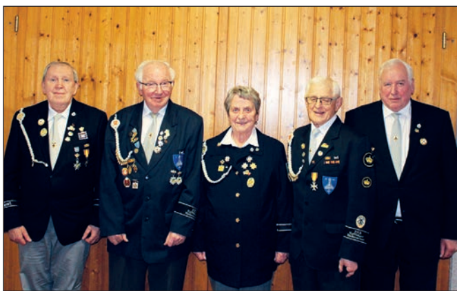
Der neue Vorstand im Kreisverband Rotenburg.

Kommen wir jetzt zur Bundesmeisterschaft, die wieder in Wittorf stattfand: Der Kreisverband Rotenburg hat drei Bun-