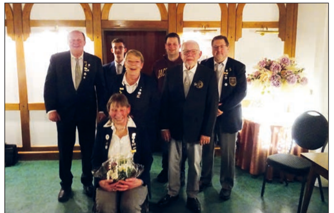
Der neue Vorstand der KK Meßlingen-Südfelde.