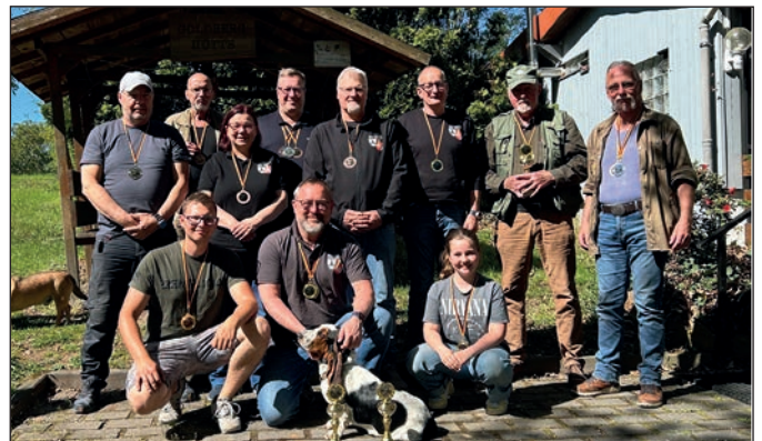
Die Einzelsieger und Pokalsieger.

Alljährlich lädt die Kyffh. Kam.Cölbe 1883 e.V. zum traditionellen Pokalschießen mit dem Karabiner 98 - k ein. Bei strahlenden Wetter, unter besten Bedingungen wurde der Wettstreit in drei Disziplinen, nämlich mit dem K-98-k im Kaliber .22lfB ZF, dem K-98-k (Großkaliber) offene Visierung und dem K-98-k (Großkaliber) mit ZF ausgetragen. Als Grundlage diente, laut unserer Schießsportordnung, die Disziplinen GK-L 1 und GK-L 1 SÜ. Der Wettkampf wurde auf 50 m-Distanz ausgetragen; in