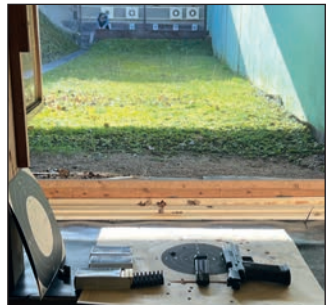
Auf dem Kurzwaffenstand.

Die hohen erreichten Ringzahlen sprechen für ein hervorragendes Niveau des Schießsports in Wackernheim.