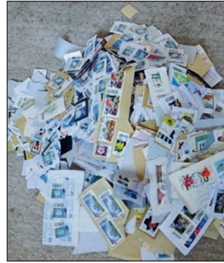
Briefmarken für Bethel.