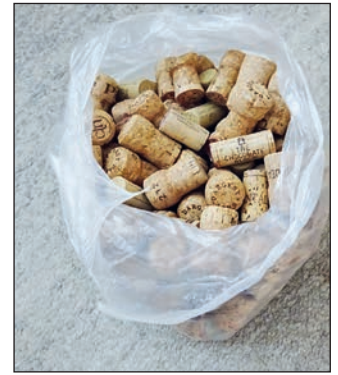
Korke für die Diakonie Kehl-Kork.