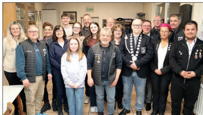
Geehrte auf der Jahreshauptversammlung.