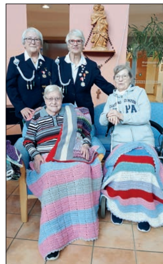
Übergabe der Decken.

Mit vereinten Kräften gelingt es der Gruppe immer wieder, ein Stück Wärme und Freude in die Senioreneinrichtungen der Region zu bringen. Ihr Engagement zeigt eindrucksvoll, wie viel Gutes aus gemeinschaftlichem Tun entstehen kann.