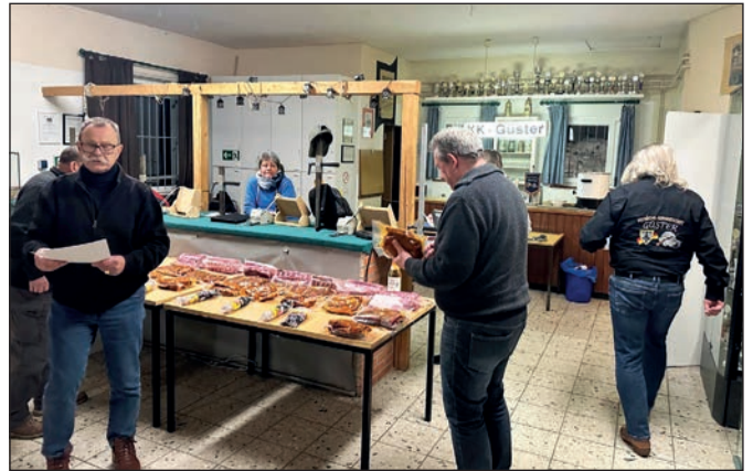
Vorsitzender und Ehrenvorsitzender vergaben die Preise.