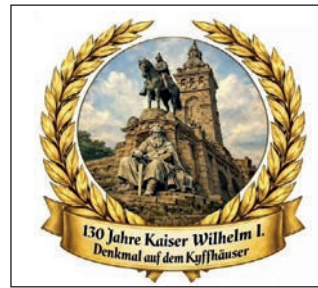
130 Jahre Kyffhäuserdenkmal.