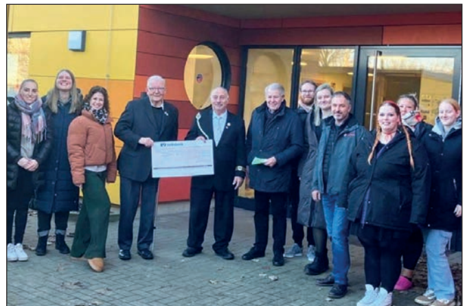
Übergabe der Spende bei der Kita Leitung in Ritterhude.

Der Vorstand des Kyffhäuser Bund e.V. Die Kyffhäuser Kameradinnen/en des Kreis und Landesverband, und seine Kameradinnen/en der Kyffh. Kameradschaft Schweringen