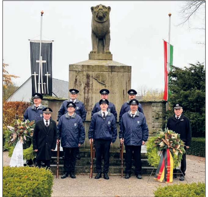
Aufstellung der Kyffhäuserkameraden vor dem Ehrenmal.

Unser Ehrenmalwart trommelt stets drei bis vier Helfer zusammen, die Unkraut entfernen, Blumen pflanzen, fegen, das Laub zusammenkehren. Jährlich geht es noch gründlicher ans Werk, wenn ringsherum die Hecke zurechtgestutzt wird.