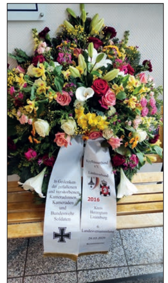
Kranz für das Ehrenmal der Gemeinde Krummesse.