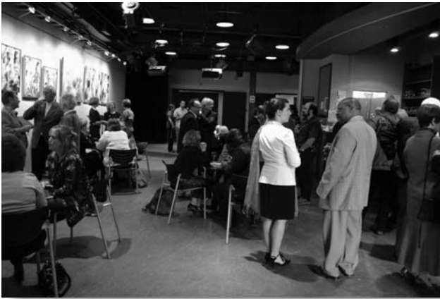
Le bistro de La Nouvelle Scène, avant le spectacle du 20 e .