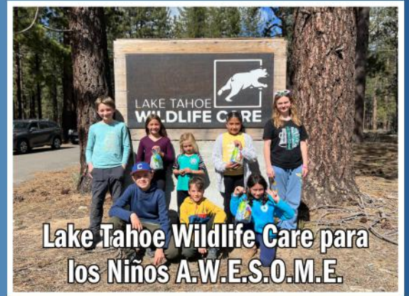
Lake Tahoe Wildlife Care para los Niños A.W.E.S.O.M.E.