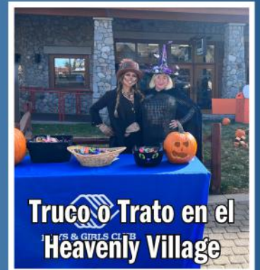
Truco o Trato en el Heavenly Village