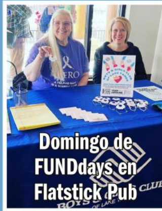
Domingo de FUNDays en Flatstick Pub