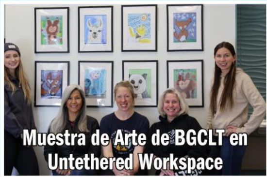
Muestra de Arte de BGCLT en Untethered Workspace