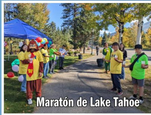
Maratón de Lake Tahoe