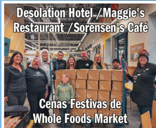
Desolation Hotel /Maggie's Restaurant / Sorensen's Café