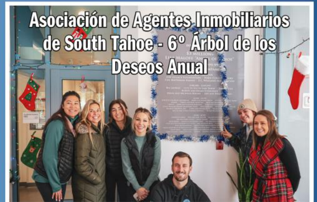
Asociación de Agentes Inmobiliarios de South Tahoe - 6º Árbol de los Deseos Anual