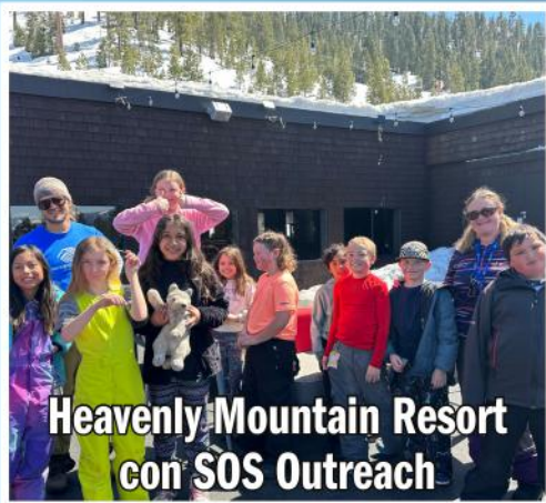
Heavenly Mountain Resort con SOS Outreach