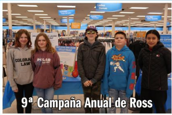
9ª Campaña Anual de Ross