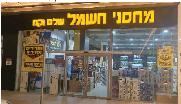
כל לקוח הוא אח"מ בחנות

משעל, עסק כל חייו הבר- גרים בתחום מכירות מוצרי החשמל, זאת למרות שבאוניברסיטה בכלל למד פיזיותרפיה. כאשר זיהה את ההזדמנות העסקית לפתוח סניף של רשת מוצרי החשמל המצליחה בקניון עטרות, החליט להפסיק להיות שכיר ולה- ביא לידי ביטוי את כישורי בנייה חנות. "כל לקוח מרגיש אצלנו VIP" אומר לנו משעל ומוסיף - "העניין הוא שזו לא רק הרגשה, זו המציאות. הלקוח במרכז ואנחנו מספקים לו את חוויית הקניה מעבר למוצרים הבינלאומיים שאנחנו מספקים". למרות שבאיזור ירושלים ישנם עוד סניפים של הרשת, יש משהו מיוחד