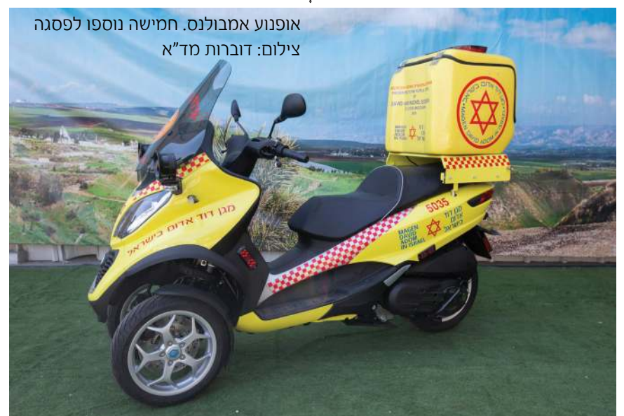
אופנוע אמבולנס. חמישה נוספו לפסגה