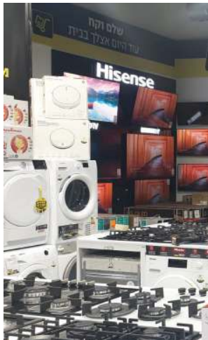
מגוון עצום ב-700 מ"ר

עמר משעל (44), מנהל את החנות שבקניון עטרות, כאשר כל לקוח הוא VIP כהגדרתו