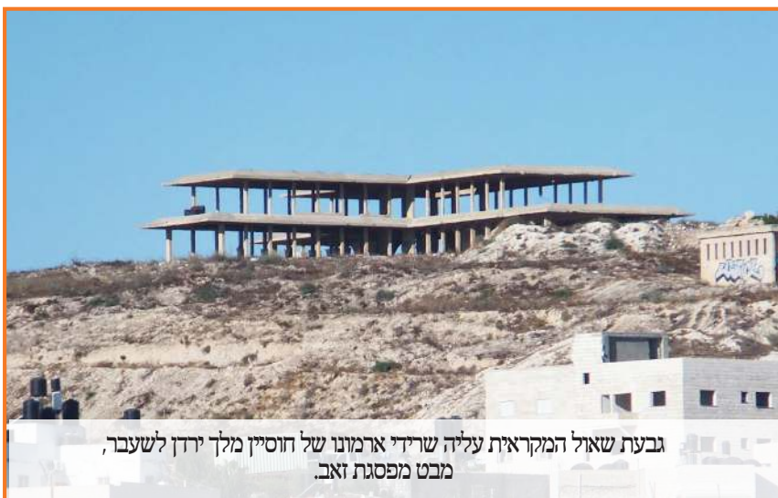
גבעת שאול המקראית עליה שרידי ארמונו של חוסיין מלך ירדן לשעבר, מבט מפסגת זאב.

בתקופת המלוכה ישב שאול המלך במקום זה, כאן ביתו והגבעה נקראת על שמו: וַיֵּלֶךְ שְׁמוּאֵל הַרְמְתָה וְשָׂאֵל עָלָה אֶל בֵּיתוֹ גְּבַעַת שְׂאֵוֶל" (שמואל א, טו לד). אם כך שאול, המלך הראשון של ישראל בונה כאן את ביתו וארמונו. כיום ניתן לראות בראש הגבעה את שרידי ארמונו של חוסיין מלך ירדן שהחל לבנות את ביתו במקום אך לא סיים בגלל פרוץ מלחמת ששת הימים (ראו תמונה).