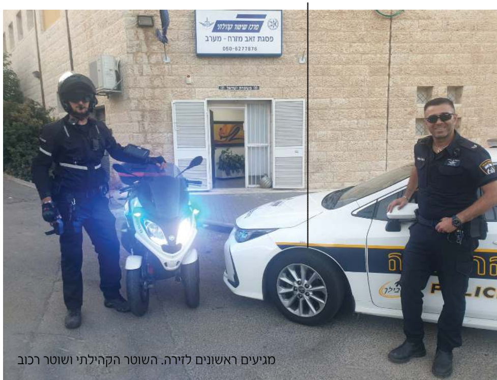
מגיעים ראשונים לזירה. השוטר הקהילתי ושוטר רכוב

למערך הכוננים של מד"א בשכונת פסגת זאב נוספו חמישה כוננים חדשים ותחנת שפט הוסיפה שני אופנועים שמגיעים ראשונים לכל זירה בשכונה