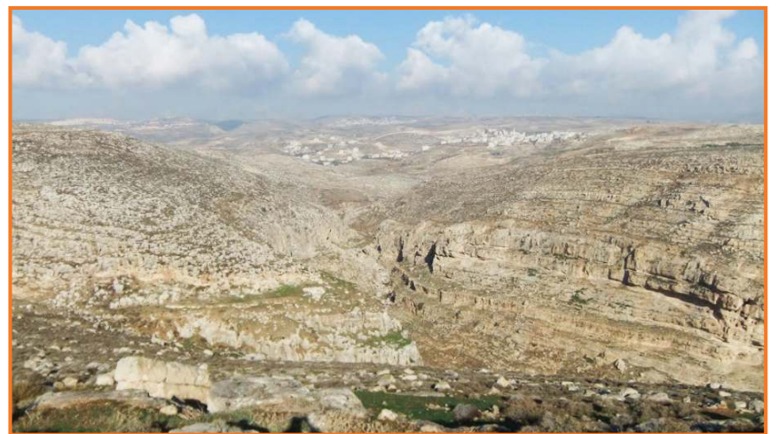
נחל מכמש, בסמוך ליישוב אדם שבסביבתו עבר על פי התיאור המקראי סנחריב בדרכו לירושלים.

סנחריב מלך אשור (705-681 לפנה"ס), ערך מסע מלחמה לאזור כדי להשתלט על יהודה שהייתה תחת הנהגתו של חזקיהו המלך.