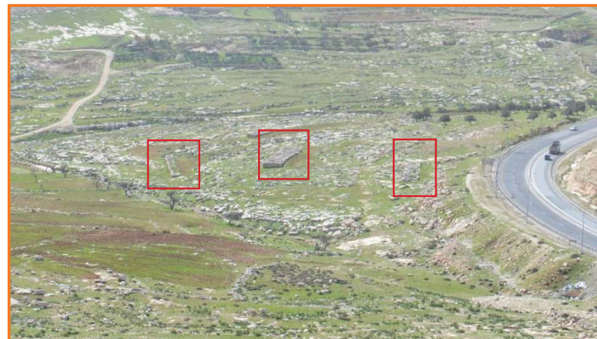
קבר רחל, אחת ההצעות לזיהוי קבר רחל בסמוך ליישוב אדם והכביש מבנימין למחסום חיזמא, ראו מבני האבן המוקפים בריבוע האדום שיש הרוצים לזהות בהם את מבנה הנצחה של קבר רחל.

פסגת זאב שוכנת בסמוך לקו הגבול בין שני שבטים. בנימין מצפון ויהודה מדרום. תיאור הגבול מתחיל ממזרח מצפון ים המלח עולה לכיוון מערב דרך בית חגלה, בית הערבה, ממשיך ועובר בסמוך למעלה אדומים, במקביל 'לנחל', הוא נחל פרת (קלט). ואז הוא פונה מעט דרומה לכיוון עין שמש (אזור אל ע-זריה וממשיך לכיוון