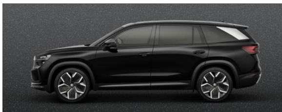
Noir Magic, effet perlé