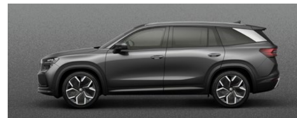
Gris Graphite, métallisée