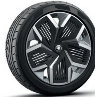
Jantes en alliage léger 8,0J x 20" «Rila», anthracite con superficie lucidata et panneau Aero