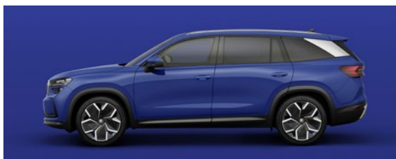
Bleu Energy, uni