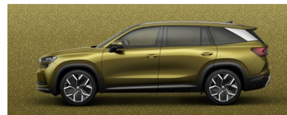
Or bronze, métallisée