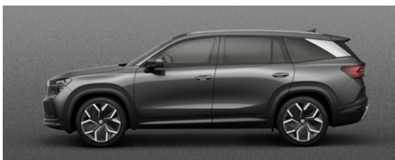
Gris Steel, uni