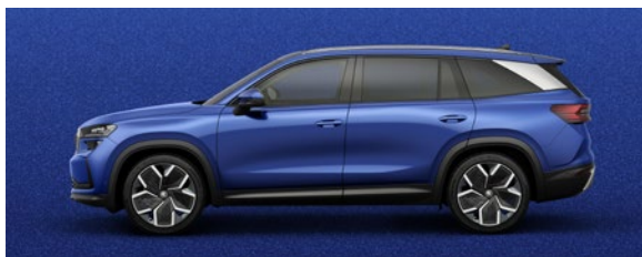
Bleu Race, métallisée