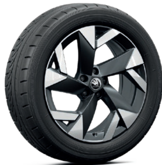
Jantes en alliage léger 7,5J x 19" «Tirsuli» aero, noir