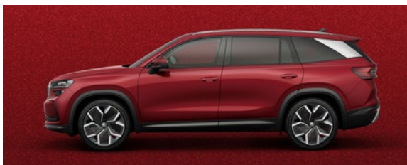
Rouge Velvet, métallisée spéc.

Les prix s'entendent en CHF et incluent 8.1% TVA. Certains des équipements optionnels mentionnés ci-dessus ne peuvent être commandés qu'en association avec d'autres équipements supplémentaires. De plus, lesdits équipements optionnels ne peuvent pas tous être combinés entre eux. Veuillez contacter votre partenaire Škoda pour de plus amples informations. Les couleurs représentées peuvent différer des couleurs effectives de la peinture en fonction de sa qualité.