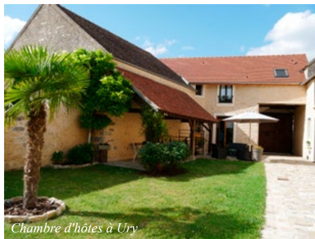
Chambre d'hôtes à Ury

chiens menaçants. Ils sont attachés... et représentés en métal ! Pour terminer la visite, l'allée des Vaches, au bout de la Grande rue, est un lieu paradisiaque, avec sa forêt et ses impressionnants rochers qui évoquent des animaux, des formes humaines. Je vous laisse imaginer ! D'autres sites proches peuvent être visités : Provins, le château de Vaux-le-Vicomte, mais ce sera pour une autre fois.