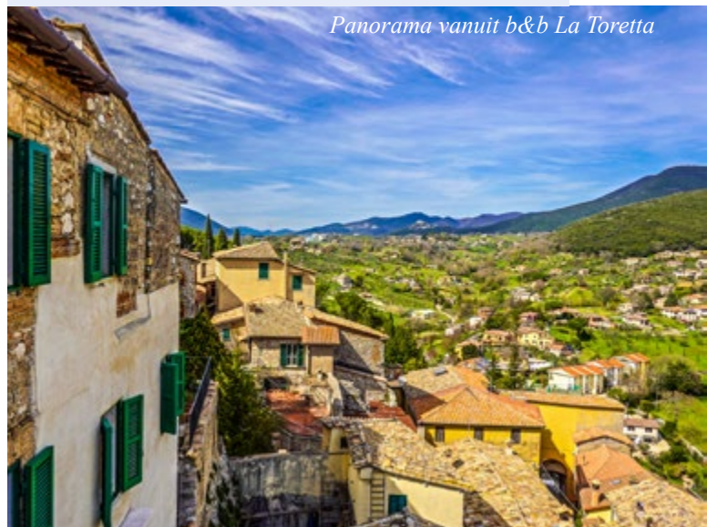
Panorama vanuit b&b La Toretta

Carpe diem , 'pluk de dag' dus, is van de bekende Romeinse schrijver en dichter Horatius die in de Sabijnse bergen een landgoed kreeg van kunstbeschermmer Maecenas. Daar hield hij zich bezig met poëzie tot aan zijn dood in 8 V. C. Al die tijd wist hij op zijn domein in Sabina te genieten van de mooie dingen des levens. En om te eindigen nog één van zijn spreuken: Een goed begin is het halve werk.