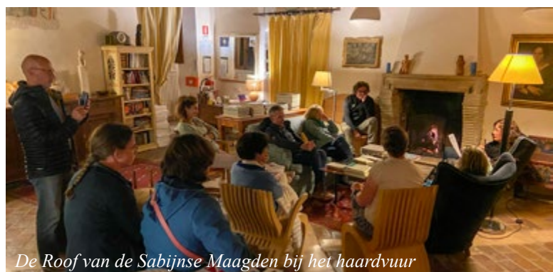
De Roof van de Sabijnse Maagden bij het haardvuur