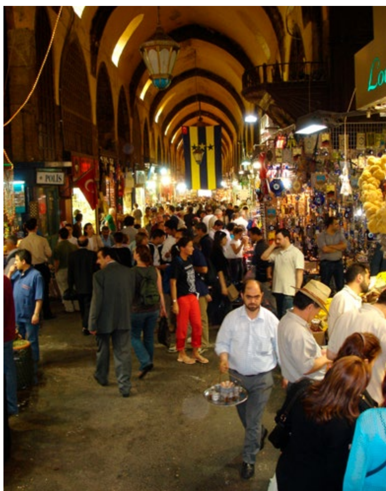
Le bazar égyptien