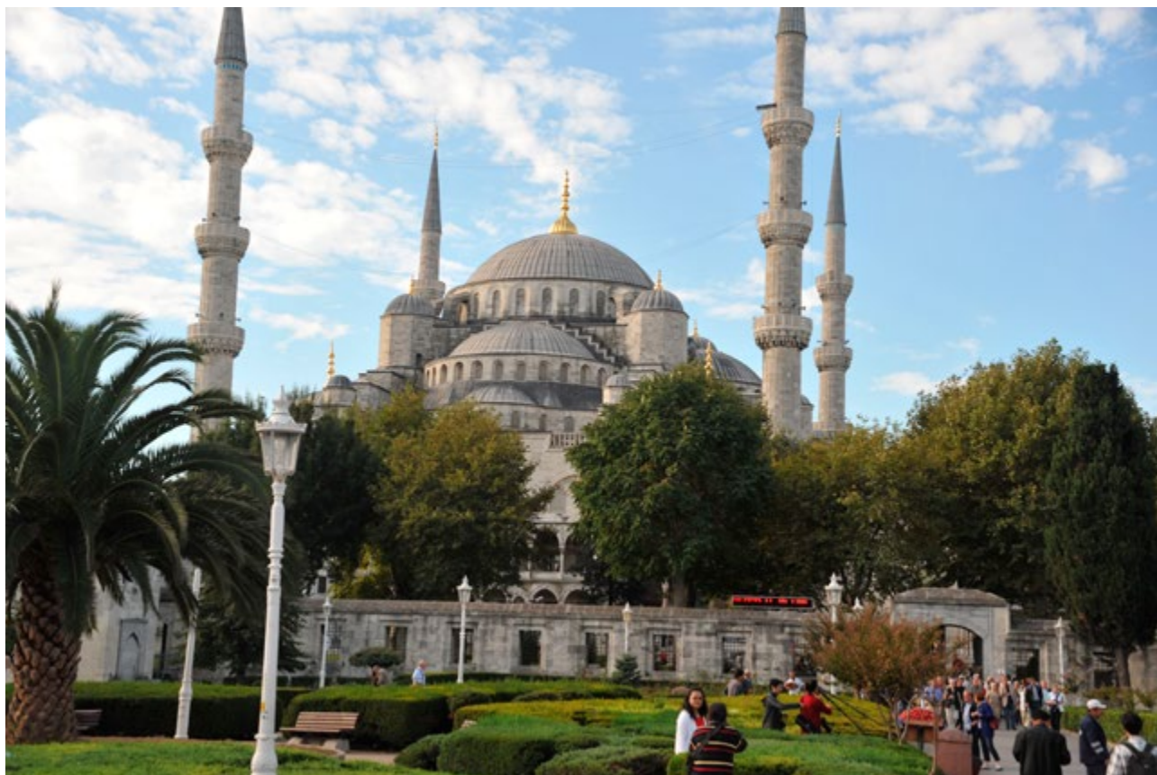
L'ancienne basilique Sainte-Sophie, fondée par l'empereur Constantin en 325 fut achevée en 537 sous Justinien. Sa reconversion en mosquée par le sultan Mehmet II moyennant l'ajout de quatre minarets sauva cet admirable joyau de la chrétienté de la destruction.