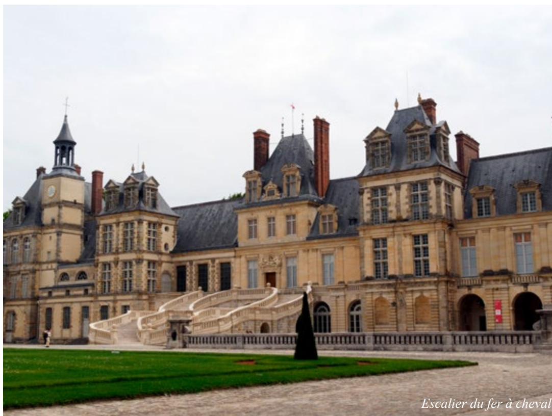
Escalier du fer à cheval

©Texte : Claudine Clabots