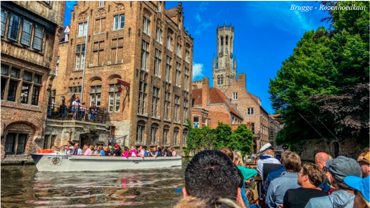
Brugge - Rozenhoedkaai

Belgium is a small country but there are many wonderful and exceptional things about it. For certain you heard about the Atomium, Tomorrowland, Father Damian, Rubens and so on. You also know the famous chocolate, beer, waffles, witlof, mussels, French Belgian fries and much more. About this 'much more' handles this article.