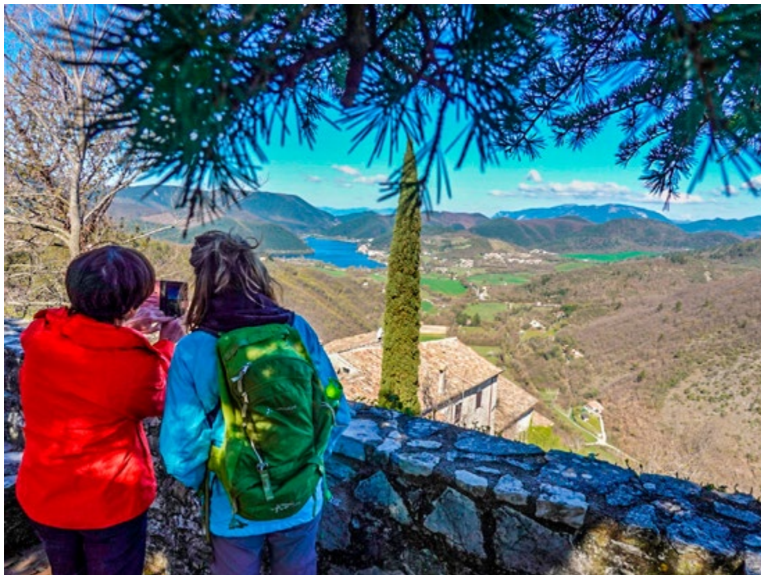
△ Zicht vanuit Labro op meer van Piediluco ▽ Typisch straatje in Casperia