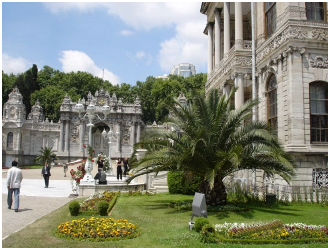
Le Palais de Dolmabahçe fut érigé en 1853 dans un style baroque inspiré par des sultans sous influence européenne. Il compte pas moins de 285 pièces. Ses superbes jardins sont en style rococo.