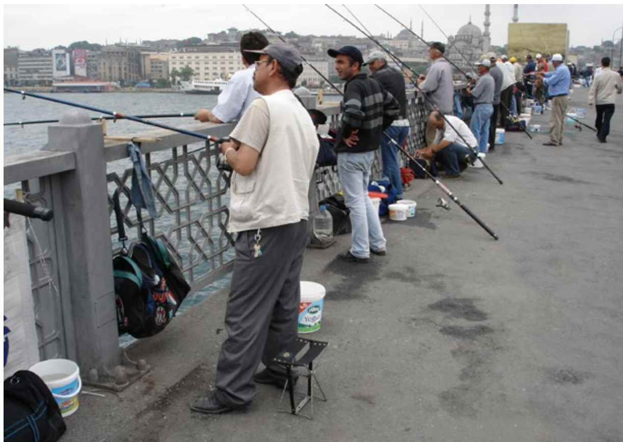
Le Pont de Galata franchit la Corne d'Or, le port intérieur de la ville. Sa partie inférieure abrite de multiples restaurants. Vous y trouverez aussi les traditionnels pêcheurs à la ligne qui y trouvent leur friture quotidienne.