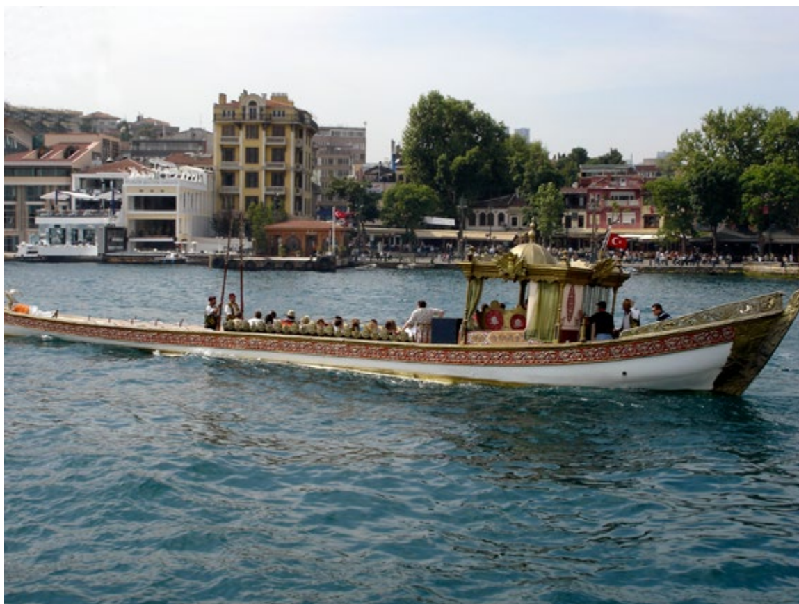
Un mariage en bateau traditionnel.