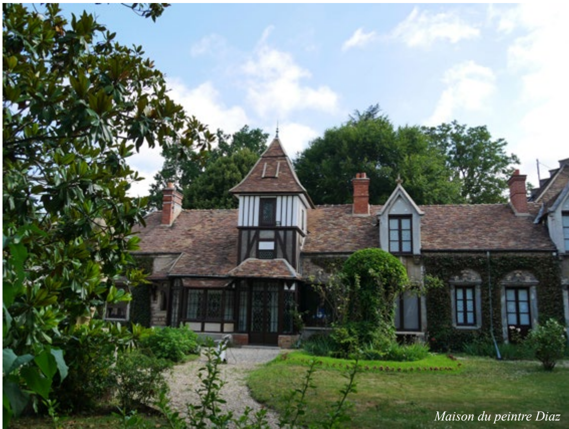
Maison du peintre Diaz