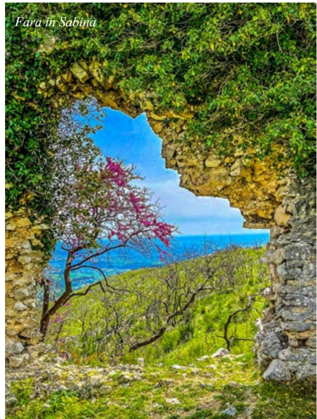
Fara in Sabina