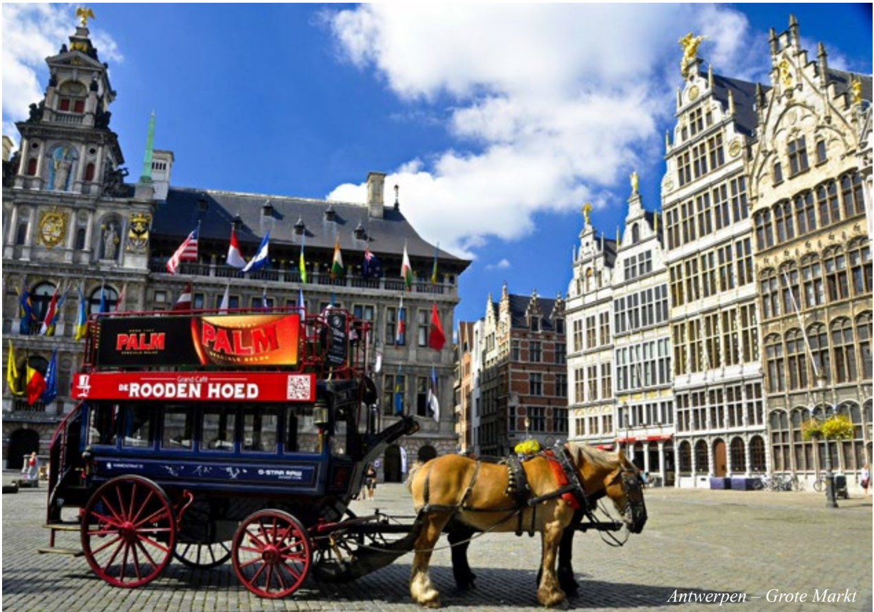
Antwerpen – Grote Markt

order to spare the city. Bruges' most famous landmark is the belfry , housing a municipal carillon comprising 48 bells with free concerts on a regular basis. What else do you have to see in the city? There's the beautiful Béguinage , although there are no more beguines, you can enter the Groeningemuseum with its extensive collection of medieval paintings like those of the Flemish Primitives and also modern art, or you can catch a glimpse of the relic of the Holy Blood in the chapel with the same name on the Burg square, the very center of Bruges. You can stroll through the Old St. John's Hospital and have a drink in one of the many cafés and terraces, looking at the passers-by. Just take your time and enjoy!