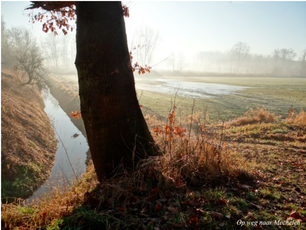
Op weg naar Mechelen

de tocht. Ik kon niet meer terug. Enkel nog mijn lijstje. Lijstje? Ik had aan pa beloofd, ik had aan ma beloofd, ik had aan wederhelft beloofd... ik had zoveel beloofd dat ik tel kwijt was. En dus maakte ik lijst met alle mogelijke namen van familieleden en kennissen, nog levend of reeds naar de eeuwige jachtvelden verhuisd en elke dag opnieuw zou ik één naam eruit prikken en die dag reserveren voor mijn relatie met die persoon. Wat heb ik ooit tegen hem of haar gezegd? Of niet? Wat heb ik ooit gedaan dat niet netjes was of wat zou ik beter hebben gedaan? Hoe kon ik ongedaan maken wat ik ooit mispeuterde of hoe kon ik een toekomstige ontmoeting nog humaner – beter – maken. Ik was -dacht ik- volledig voorbereid en in januari 2022 zou ik starten. Voorbereid? Langs geen kanten!