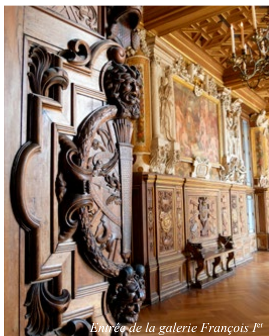
Entrée de la galerie François I er