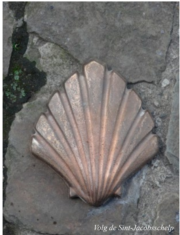
Volg de Sint-Jacobsschelp

In januari starten? Dus op zoek naar slaapgelegenheden pelgrim waardig! Na wat zoekwerk vind je lijstjes van mensen of (kerkelijke) gemeenschappen die voor een relatief laag bedrag pelgrims onderdak willen geven maar hoe ik ook mailde of telefoneerde: ik vond voor mijn eerste stap (week) geen enkel onderdak. Vooreerst