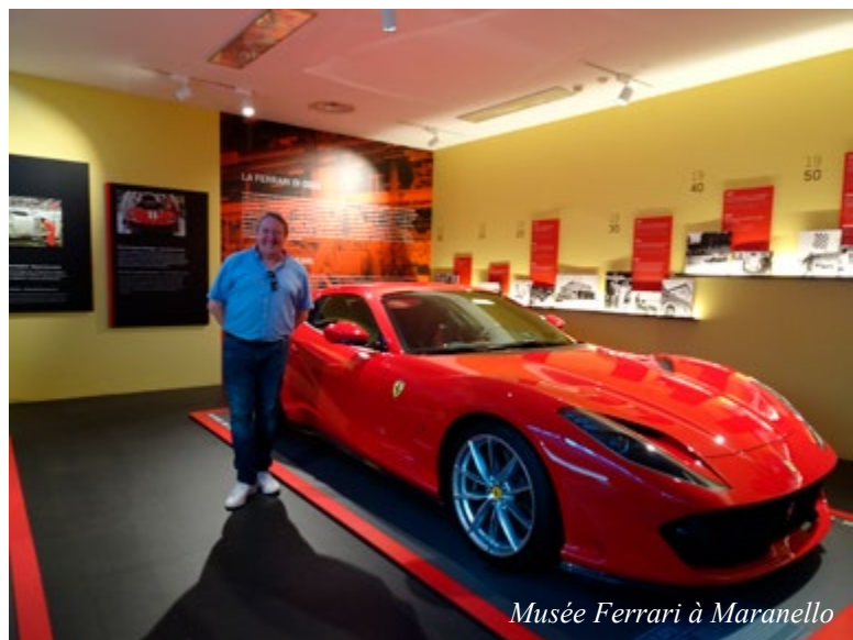
Musée Ferrari à Maranello