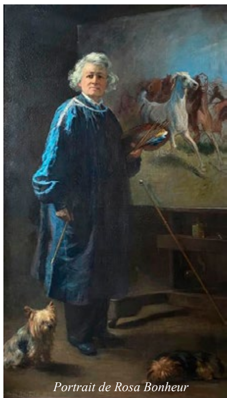
Portrait de Rosa Bonheur