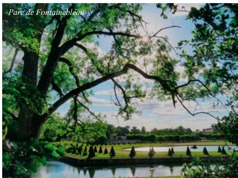
Parc de Fontainebleau

Le château de Fontainebleau s'est retrouvé récemment dans l'actualité car le célèbre escalier du Fer à cheval, qui mène à la Porte dorée, où Napoléon a salué pour la dernière fois ses soldats avant de partir en exil en 1814, vient d'être restauré. Il est splendide mais choque quelque peu par son aspect trop « neuf », comparé à la façade marquée par les ans. J'en ai profité pour revoir le domaine.