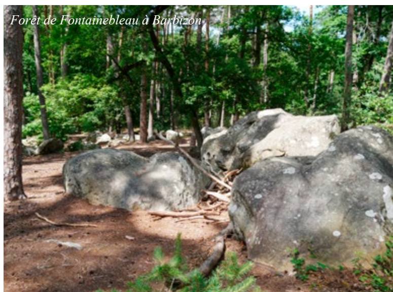
Forêt de Fontainebleau à Barbizon

Il est difficile d'imaginer qu'après la Révolution française ce château est vidé de son mobilier. En 1789, le feu prend et détruit certaines salles. Le domaine devient, entre 1803 et 1808, une caserne puis... une prison ! C'est Napoléon qui le fait remeubler et revivre. On peut visiter ses appartements, sa bibliothèque où il travaillait et le guéridon où il a signé son abdication le 4 avril 1814. C'est ici aussi qu'il avait tenté de se suicider la nuit du 12 au 13 avril 1814, mais le poison n'avait pas fait l'effet escompté. Il y reviendra le 20 mars 1815 avant son départ pour Sainte-Hélène. Les visiteurs y retrouveront notamment des salles consacrées à l'Empereur, dont la salle du trône avec son siège orné d'abeilles. Des porcelaines de Sèvres illustrent ses conquêtes. Une salle émouvante est consacrée à l'Aiglon, avec ses vêtements, ses jouets. Un fils mort trop tôt, à l'âge de 21 ans, en Autriche, alors qu'il avait changé de nom. On l'appelait désormais le duc de Reichstadt. L'Empereur y est représenté lors du Sacre et juste à côté, une vitrine montre sa redingote sombre