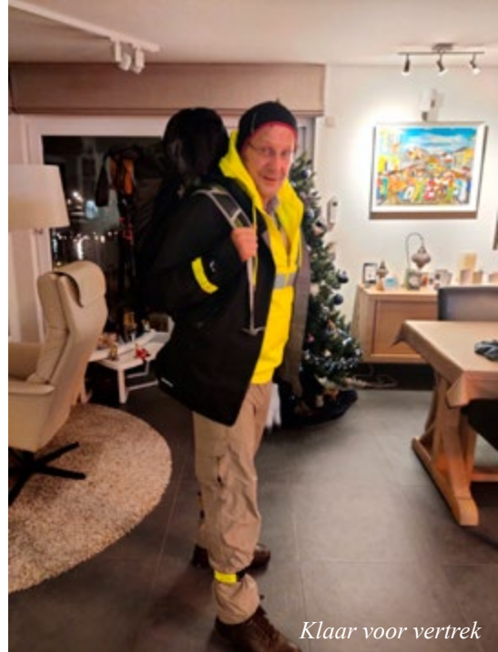
Klaar voor vertrek

6 Januari 2022. 06.00 u. Deur achter mij togetrokken en op pad. Ik was voorbereid (dacht ik): mijn pelgrimsroute was gestart! Eerste halte zou Mechelen worden want in kathedraal was er een tentoonstelling bezig die ik echt wilde zien en daar moest ik mijn eerste stempeltje gaan halen. Om 06.30 u terug thuis want mondmasker vergeten, en drankvoorraad (water of wat dacht je), en handschoenen... Eerste stempeltje in zijbeuk kathedraal bij pezige afgetrainde man die mij vroeg hoeveel kilometer ik per dag dacht af te leggen. Naïef antwoordde ik ongeveer dertig. Hij had al vier verschillende pelgrimstochten afgelegd met een daggemiddelde van rond de vijftig... Vele dagtochten later (en veel wijzer) onderzocht ik dat 25 km/dag voor mij een mooi gemiddelde was. De tijd dat ik de Dodentocht (100 km te voet) in