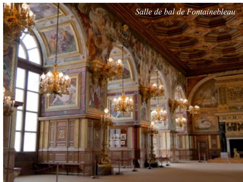
Salle de bal de Fontainebleau