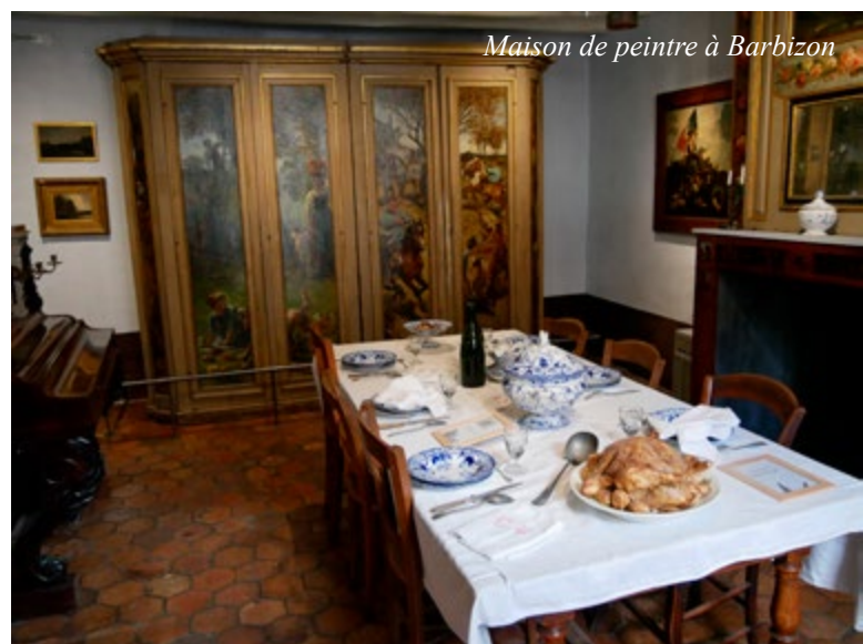
Maison de peintre à Barbizon