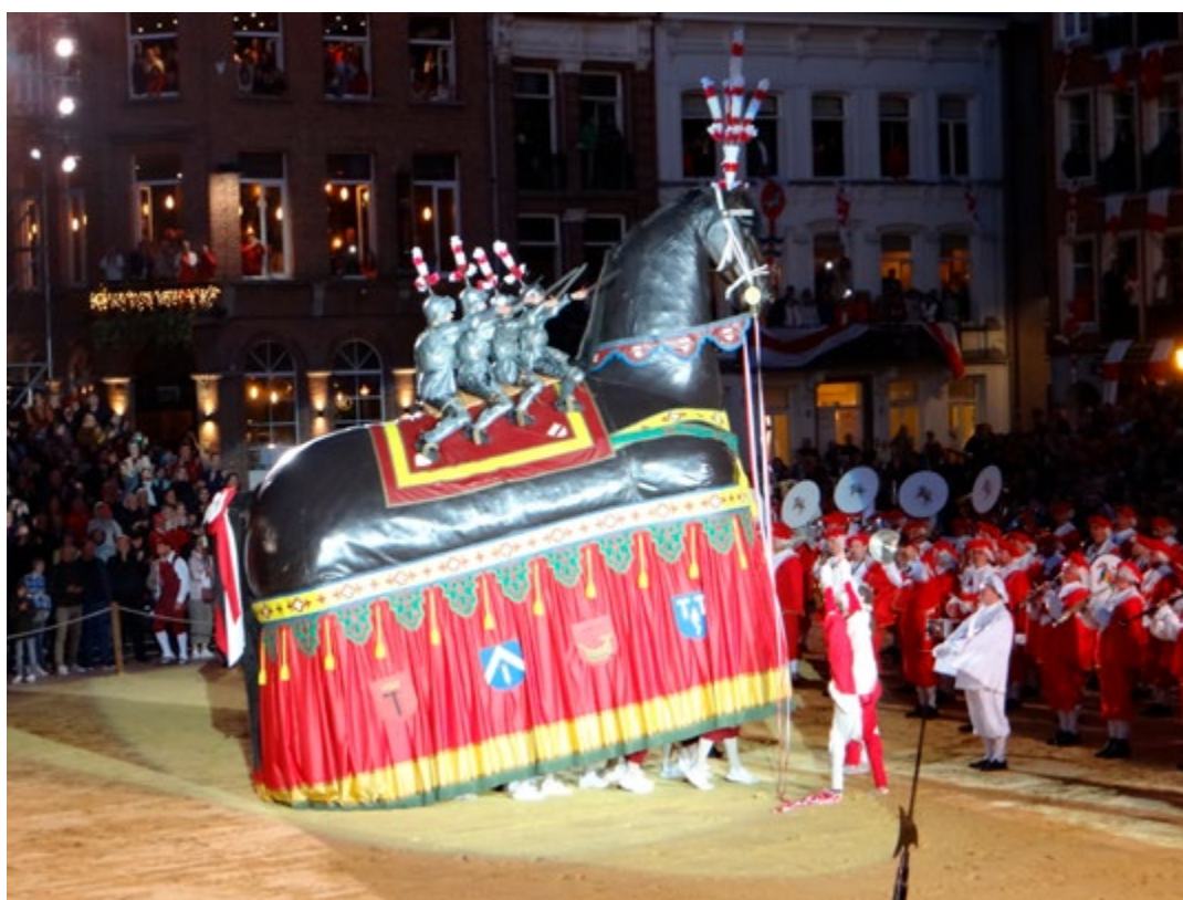
△ De algemene repetitie op zaterdag avond ▽ Paardendressur