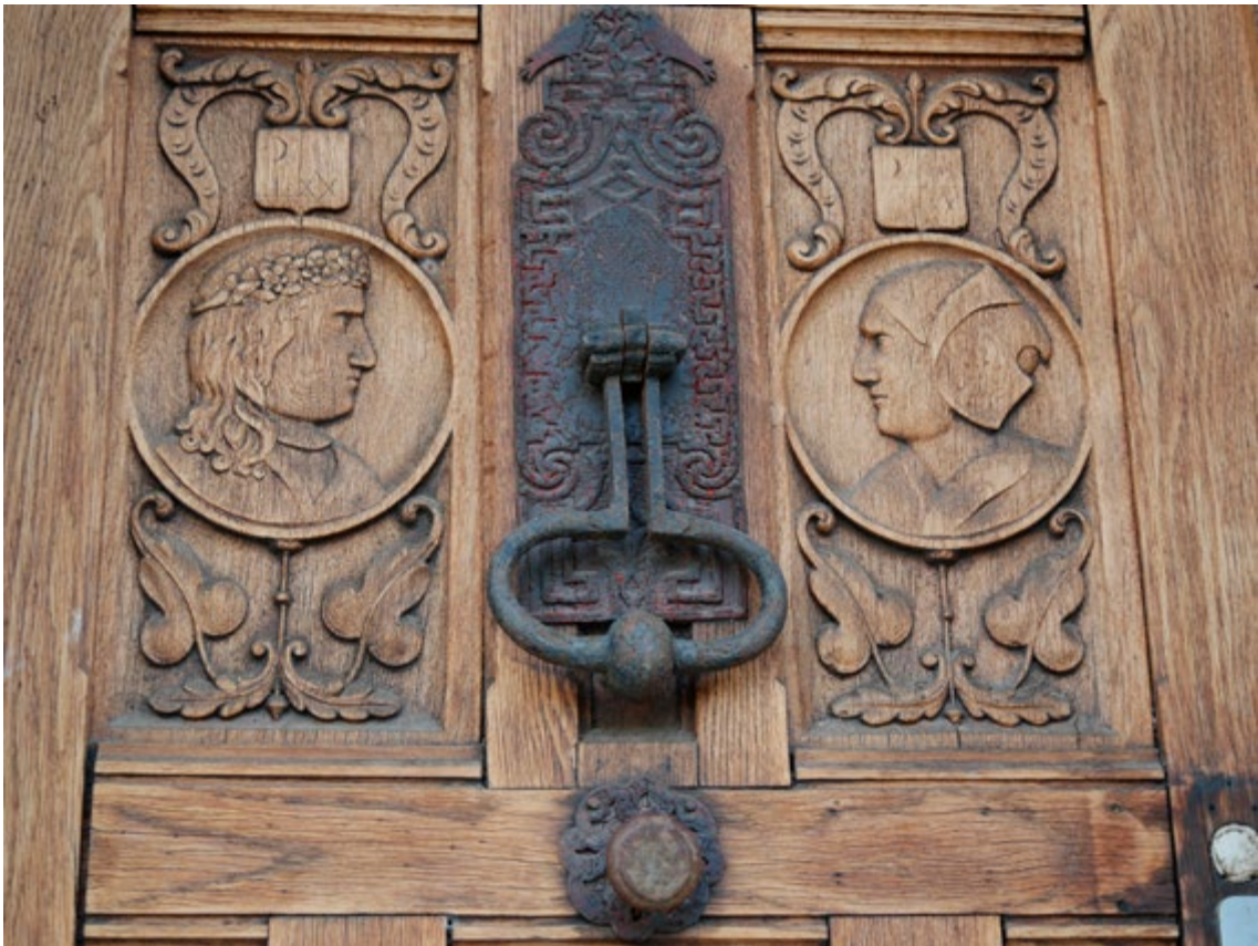
△ Porte de maison à Barbizon ▽ Tapisserie de Bruxelles