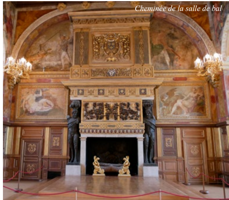
Cheminée de la salle de bal

Après le succès de la visite « Enquête au château », les organisateurs ont élaboré un nouvel épisode pour le plus grand plaisir des petits enquêteurs qui doivent résoudre une énigme. Tous les samedis et dimanches à 15 h 00 – durée 1 h 30. Le domaine possède le seul jeu de paume historique encore en activité. Avant d'initier les visiteurs à ce jeu des rois, le maître paumier explique son histoire, ses règles et les expressions de la langue qui en découlent. Les attelages de la forêt vous proposent une promenade commentée du Grand Parterre et du parc en calèche tirée par deux chevaux. Un petit train avec audioguide vous transporte si vous avez des problèmes de marche. Vous pouvez aussi canoter sur l'étang aux carpes. Le « Café des mariners » vous propose des crêpes, des glaces ou des boissons fraîches sur une belle terrasse. L'histopad permet une exploration interactive des collections. Le boudoir turc était l'espace intime de Marie-Antoinette. Il est ensuite devenu la chambre de Joséphine de Beauharnais. Les jardins invitent à la