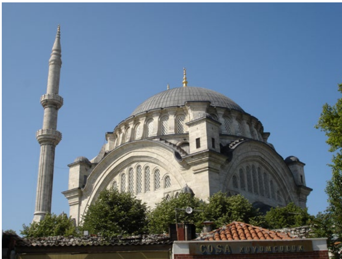
La mosquée Nuruosmaniye