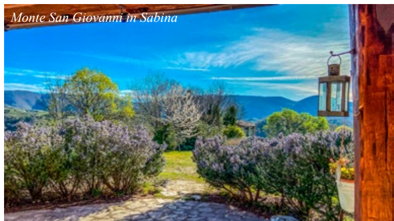
Monte San Giovanni in Sabina