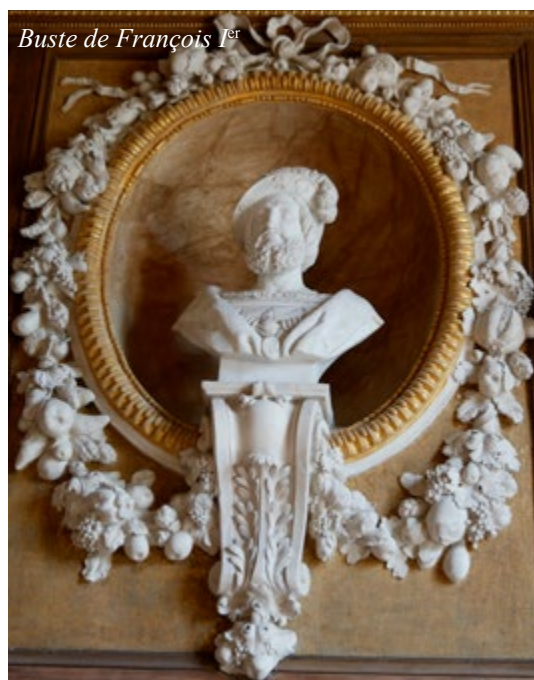
Buste de François I er