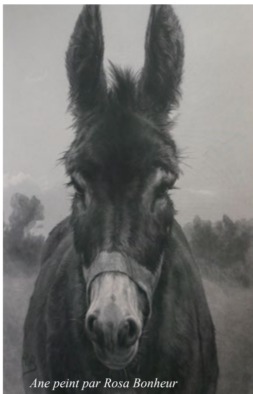
Ane peint par Rosa Bonheur