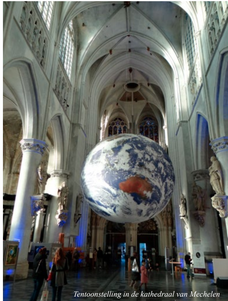
Tentoonstelling in de kathedraal van Mechelen

Vorbereiding? Het Compostellagenootschap in Mechelen. Een paar gidsen en enkele richtlijnen. Raadgevingen van internet qua uitrusting, planning in mijn agenda en mijn lijstje... Compostellagenootschap enthousiasmeerde me met een lidmaatschap, een controlestempelboekje en enkele gidsen. Ik kon niet meer terug. Uitrusting? Mijn laatste stapuitstapjes van enkele kilometers maakten duidelijk dat mijn legerboots en ABL-rugzak