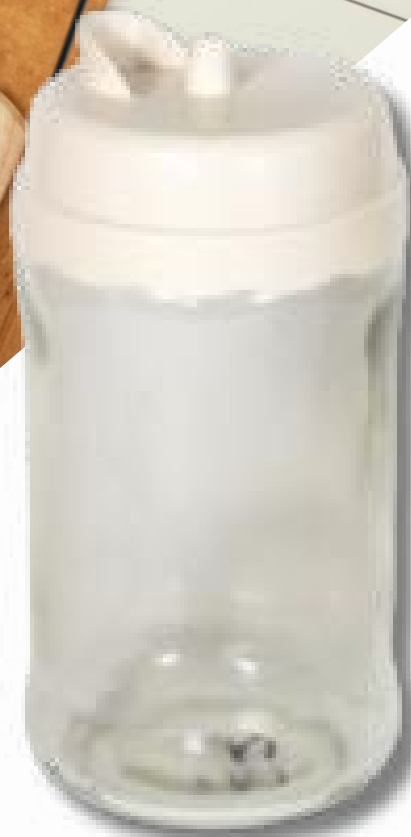
Vertedor para sal fina y gruesa 360cc cod:71026