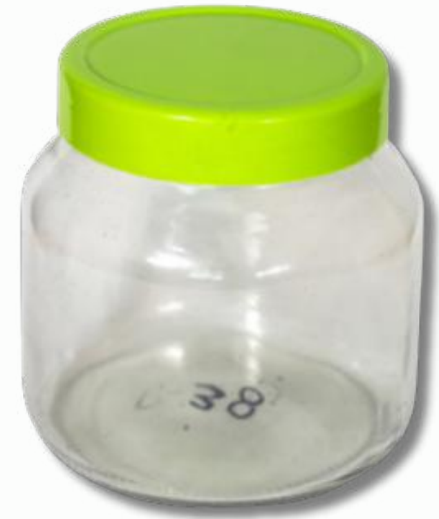
Frasco 1500CC con tapa lisa cod:71084