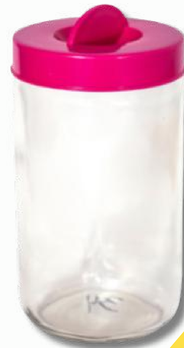
Frasco 830CC con tapa cod:71083