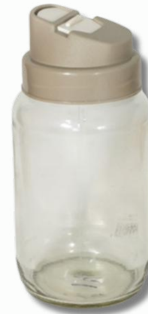
Vertedor 680CC con tapa regulable cod:71032