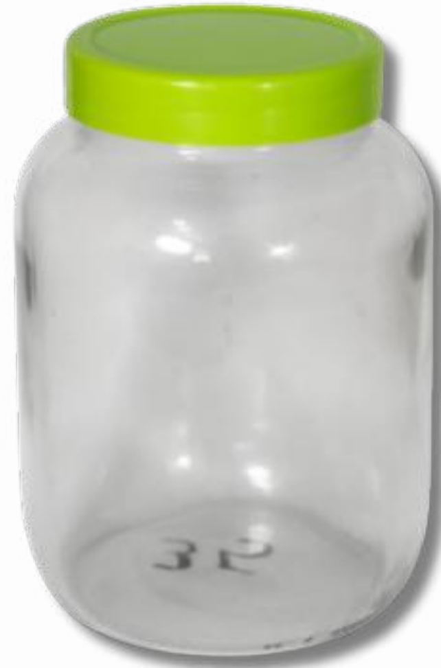
Frasco 3000CC con tapa lisa cod:71081