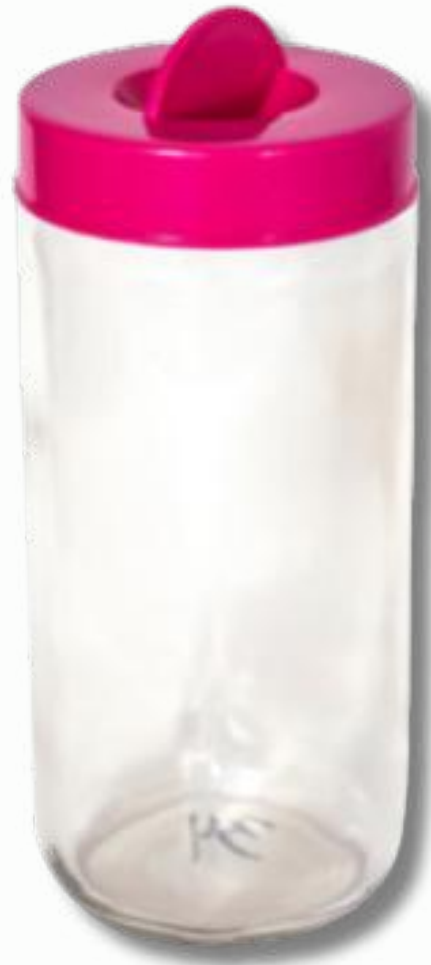
Frasco recto 820CC con tapa cod:71080