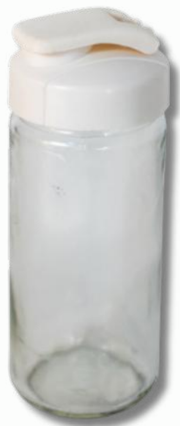
Vertedor 360CC con tapa clip cod:71008