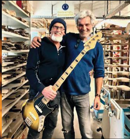
Björn Both / Santiano

Marketing is one of the most difficult tasks when establishing a product.